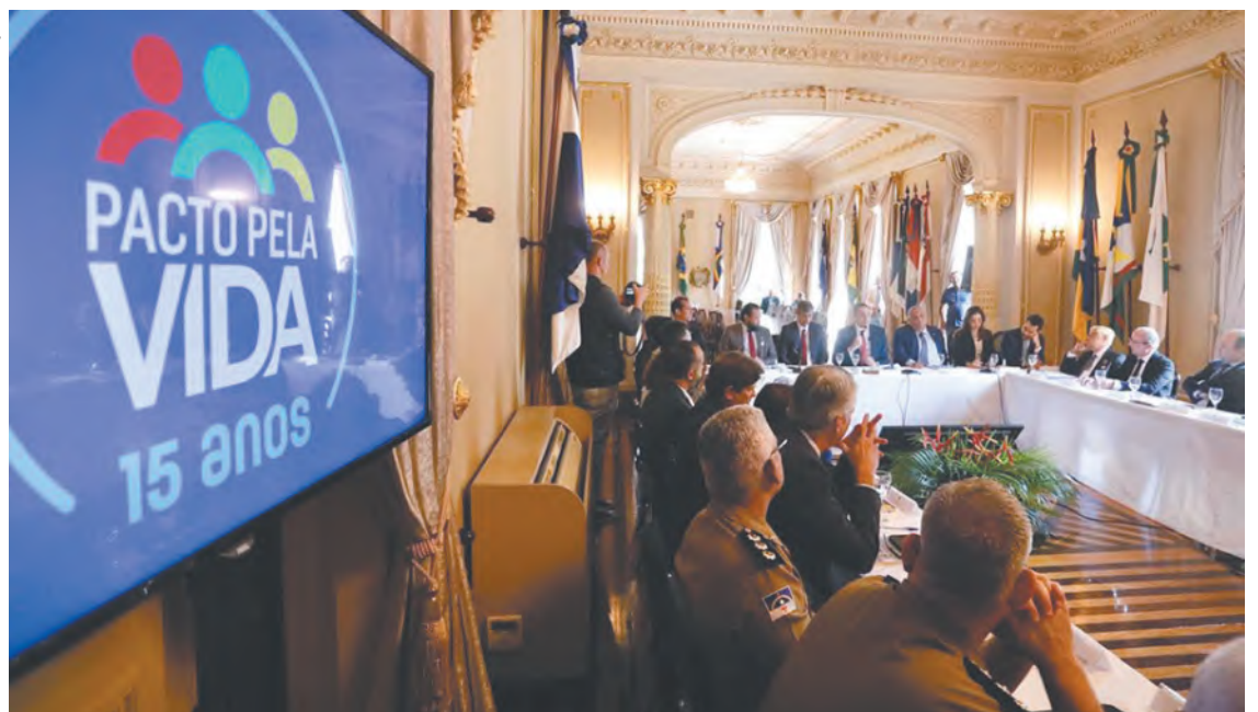
Dados foram apresentados ontem, durante a última reunião de 2022 do Pacto pela Vida