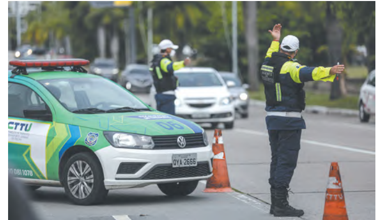
Autarquia tem feito ações para reduzir vítimas fatais

Em 2022, o excesso de velocidade foi tema de duas campanhas de mídia de massa desenvolvidas pela Prefeitura do Recife. Além disso, a CTTU realizou A Melhor Blitz de Todas, na qual os condutores eram parabenizados quando respeitavam os limites de velocidade regulamentados nas vias. Ao todo, mais de mil condutores foram abordados em blitzes educativas