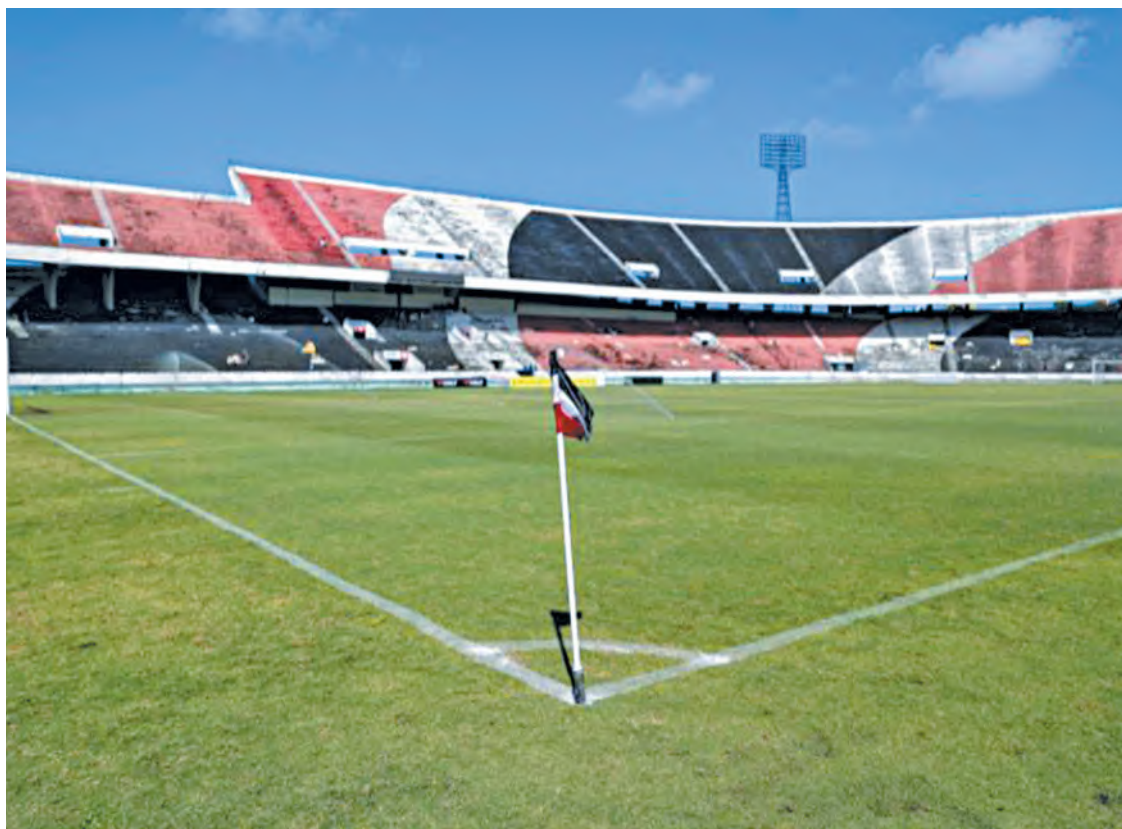
Modelo de Sociedade Anônima é considerado vital para o futuro do clube do Arruda

"No começo, o Executivo nos tratou muito bem, foram fidalgos, mas com o passar do tempo essas coisas mudaram um pouco. A gente esteve sempre próximo para acompanhar esse processo de Recuperação Judicial, porque a gente julga que isso é importante para a reestruturação do Santa Cruz. O processo está correndo, mas pode ser contestado, e isso é um perigo muito grande", acrescentou.