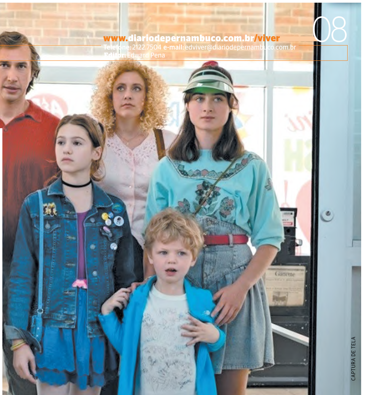
CAPTURA DE TELA

A expressão confusa e os gestos desajeitados de Adam Driver, indicado ao Oscar por pela parceria com o diretor em História de um casamento , com certeza é fundamental para a graça do filme, que, no meio de um caldeirão de teses, ainda encontra tempo para criticar a arrogância, despreparo e inércia dos acadêmicos. Na segunda metade, ele abandona o que parecia ser a premissa da trama e assume uma estrutura quase experimental de afunilamento da narrativa – momento em que a personagem de Greta Gerwig ganha mais destaque.