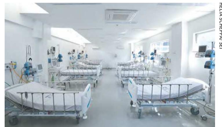
Unidade tem 90 leitos de internação e 63 de emergência

Na unidade, que será administrada pela Organização Social Hospital Tricentenário, serão disponibilizadas nove especialidades, bem como outros serviços de apoio, como nutrição, psicologia e serviço social. A es-