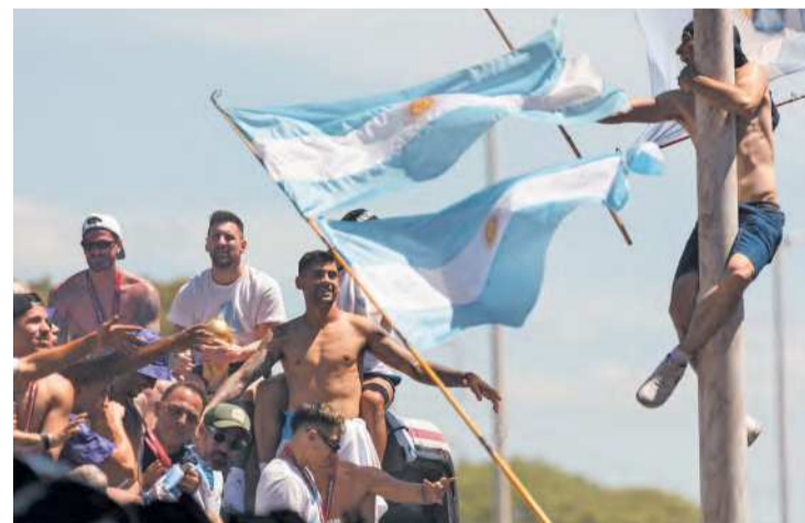
Torcida fez de tudo para ficar próxima dos atletas