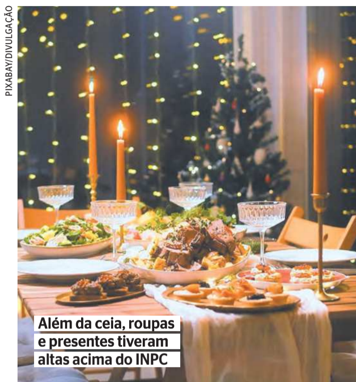
Além da ceia, roupas e presentes tiveram altas acima do INPC

Em uma cesta composta por 10 produtos, entre eles aves natalinas, azeite, caixa de bombom, espumante, lombo, panetone, pernil, peru, sidra e tender, houve um aumento de qua-