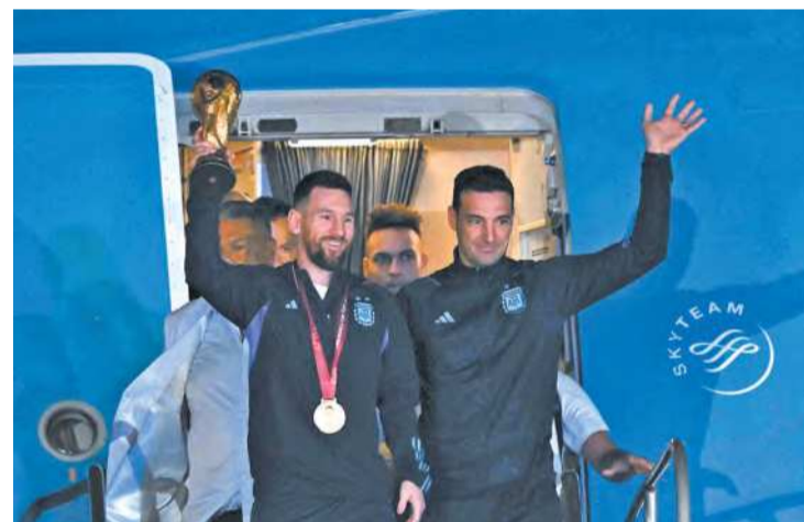
Messi e Scaloni foram os primeiros a deixar o avião

O uso dessa vestimenta em um momento de tanta atenção da mídia internacional gerou debate sobre o gesto, mas para muitos