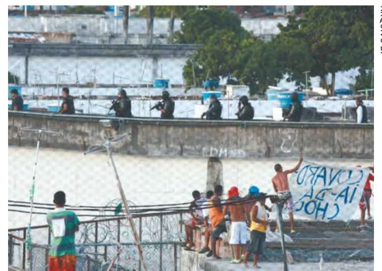
A expectativa é de que o número de presos seja reduzido

A deliberação é válida para quem cumpre pena no Complexo Penitenciário do Curado, os que estão em regime semiaberto ou já cumpriram parte da pena e foram transferidos.