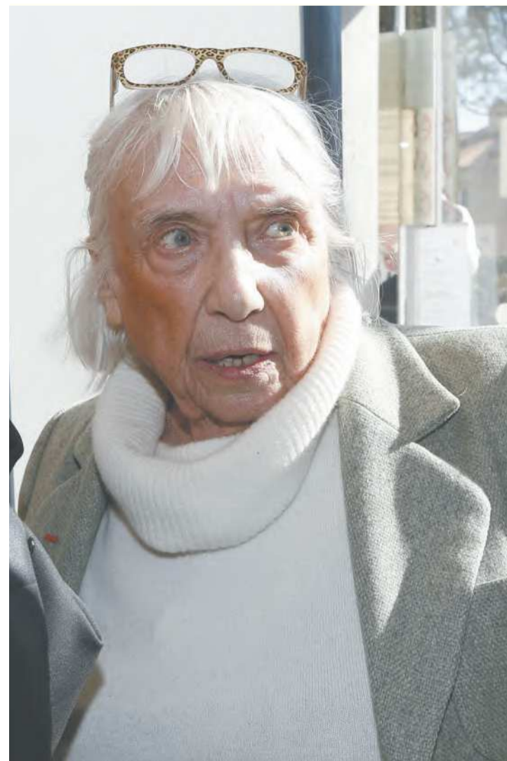
Maya Ruiz-Picasso morreu cercada por sua família

Maya Ruiz-Picasso recebeu a Legião de Honra em outubro de 2007, no grau de cavaleira. Em 2023, a França e a Espanha celebram o 50º aniversário da morte do pintor. (Correio Braziliense)