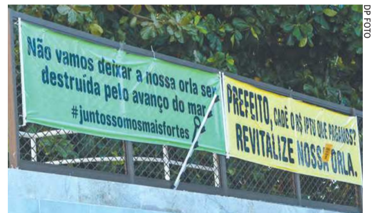
População cobra revitalização e obras de contenção