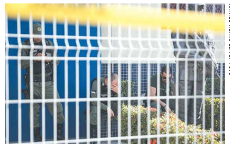
Crime chocou policiais que trabalhavam no batalhão

“De imediato, foi feito o socorro das vítimas e acionados todos os meios para o atendimento da ocorrência, tais como a Diretoria de Assistência Social, para