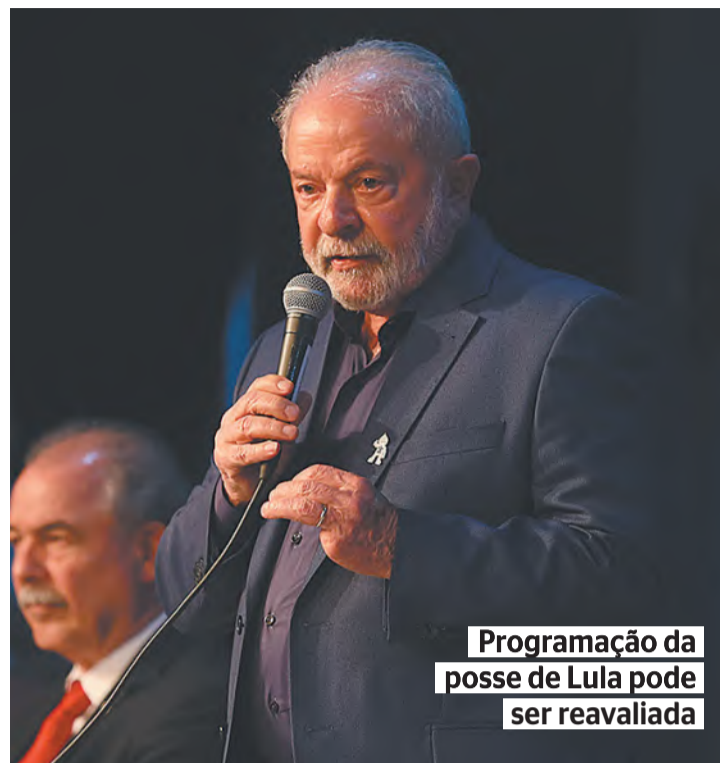
Programação da posse de Lula pode ser reavaliada

Na avaliação do deputado federal eleito, Lindbergh Farias (PT-