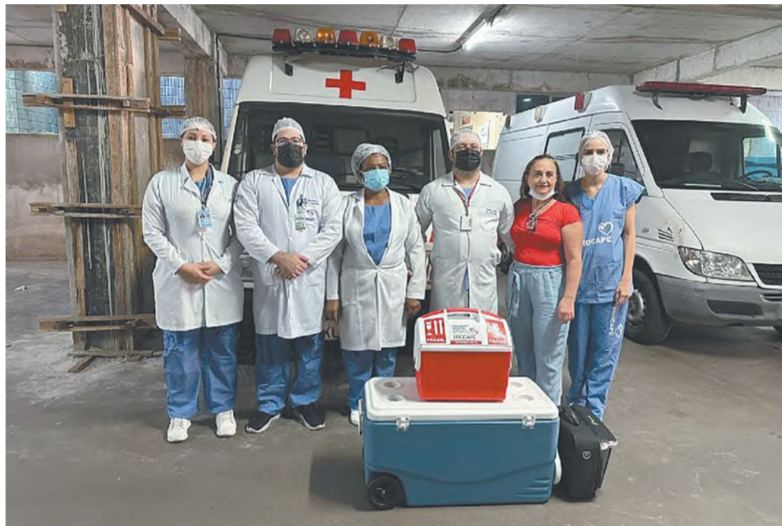
A equipe da Central de Transplantes do estado realizou 30 cirurgias do tipo, em 2022

“A data do 25 de dezembro é simbólica, onde celebramos o Natal e, com ele, o nascimento de Jesus Cristo. Renascer pela fé, pela doação de órgãos por um transplante. Nesse último, ma família fez renascer pelo amor quatro histórias de vida. Graças ao gesto de solidariedade, pacientes receberam no dia de Natal o melhor presente: suas vidas de volta”, disse a coordenadora da