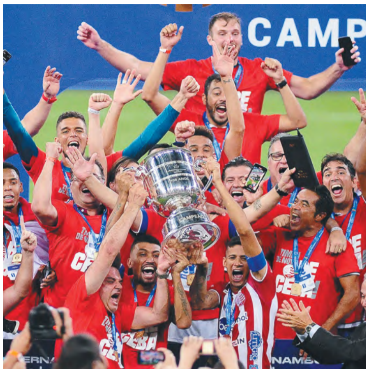
Após 20 anos, Alvirrubros comemoraram o bi do PE