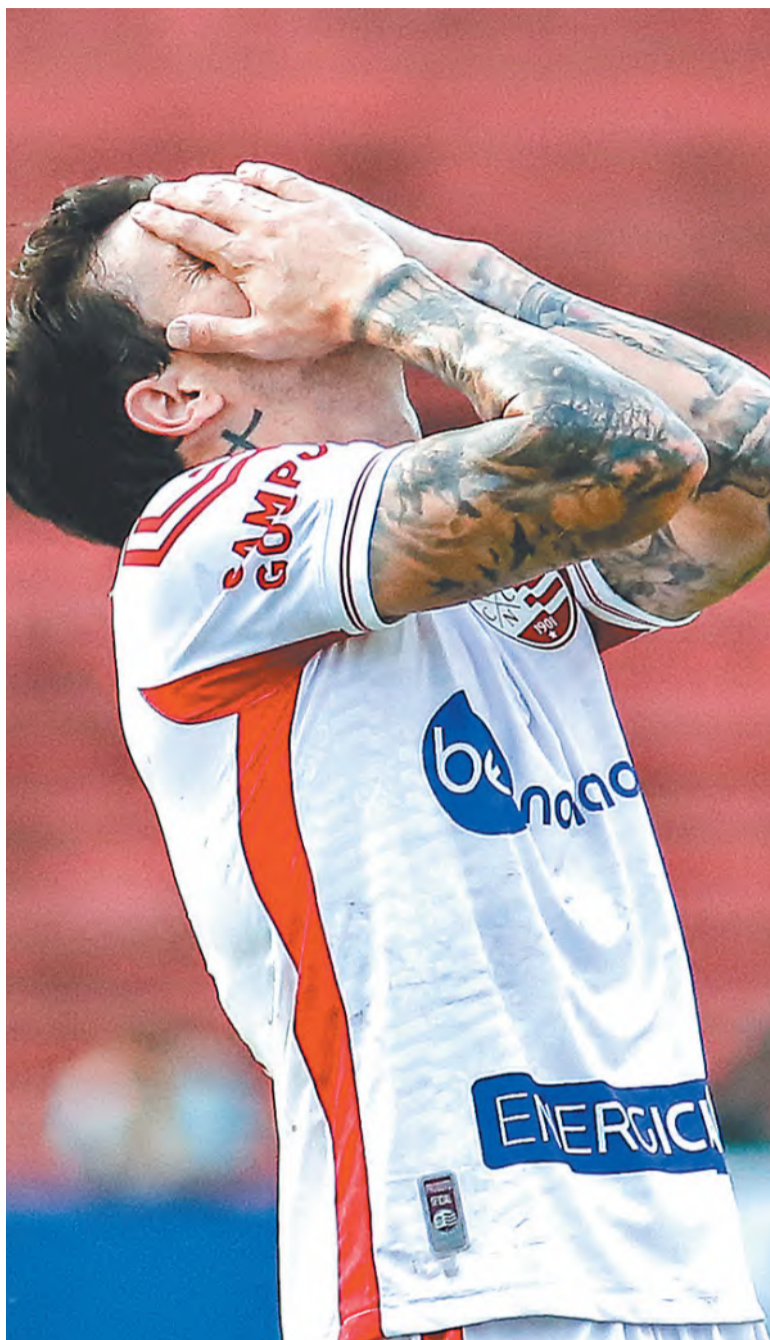
Grande decepção do ano foi voltar para a Terceira Divisão