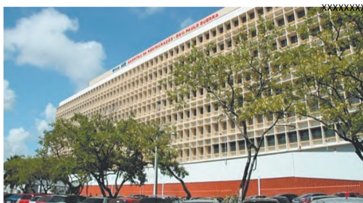
Youssef foi encaminhado ao Hospital da Restauração

foram as áreas mais afetadas pelos golpes de faca que ele recebeu quando reagiu à invasão. Yasser Youssef chegou a ser encaminhado para o Hospital da Restauração, onde ficou internado na Unidade de Terapia Intensiva (UTI), mas não resistiu aos ferimentos. O óbito aconteceu por volta das 4h30.