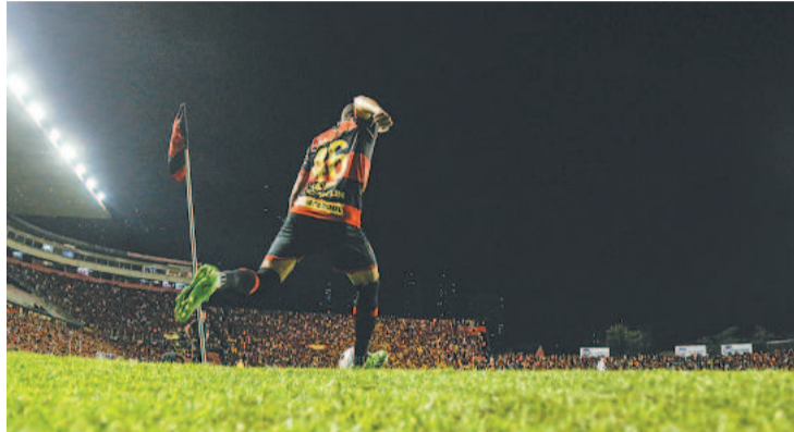
Gramado da Ilha precisa de 15 dias para recuperação