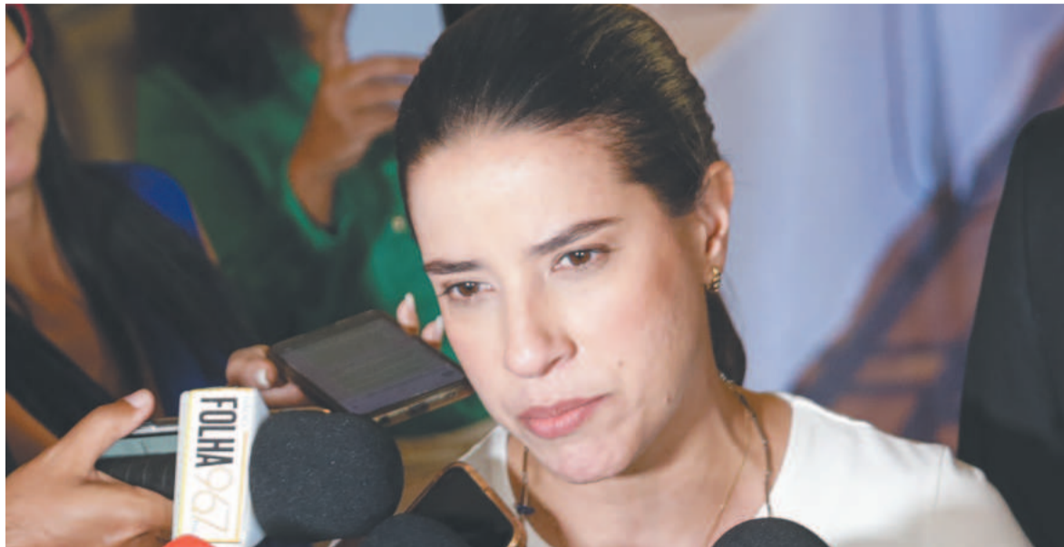
Governadora Raquel Lyra registrou mudança no texto inicial no Diário Oficial de ontem