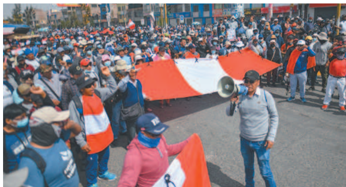
Partidários defendem Castillo, ex-presidente preso

Por precaução, o trem entre Cusco e a cidadela inca de Machu Picchu, joia do turismo do país, foi suspenso por tempo indeterminado. Boluarte substituiu Castillo, que em 7