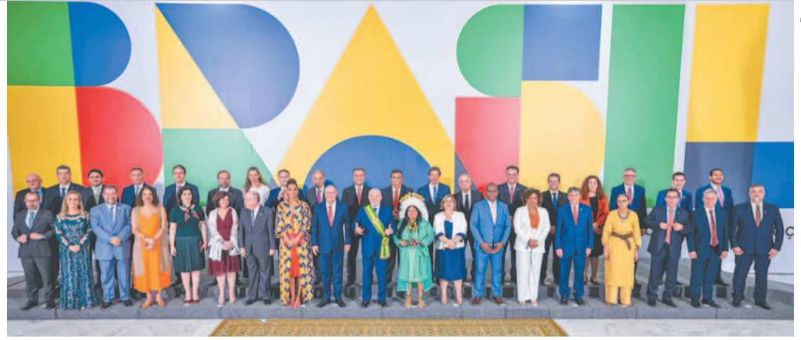
Primeiro encontro após a posse está marcado para amanhã, no Palácio do Planalto

na, dias 23 e 24 de janeiro, para uma série de compromissos, incluindo uma reunião da Comunidade de Estados Latinoamericanos e Caribenhos (Celac), que está sob presidência temporária do país vizinho. (Agência Brasil e Correio Braziliense)