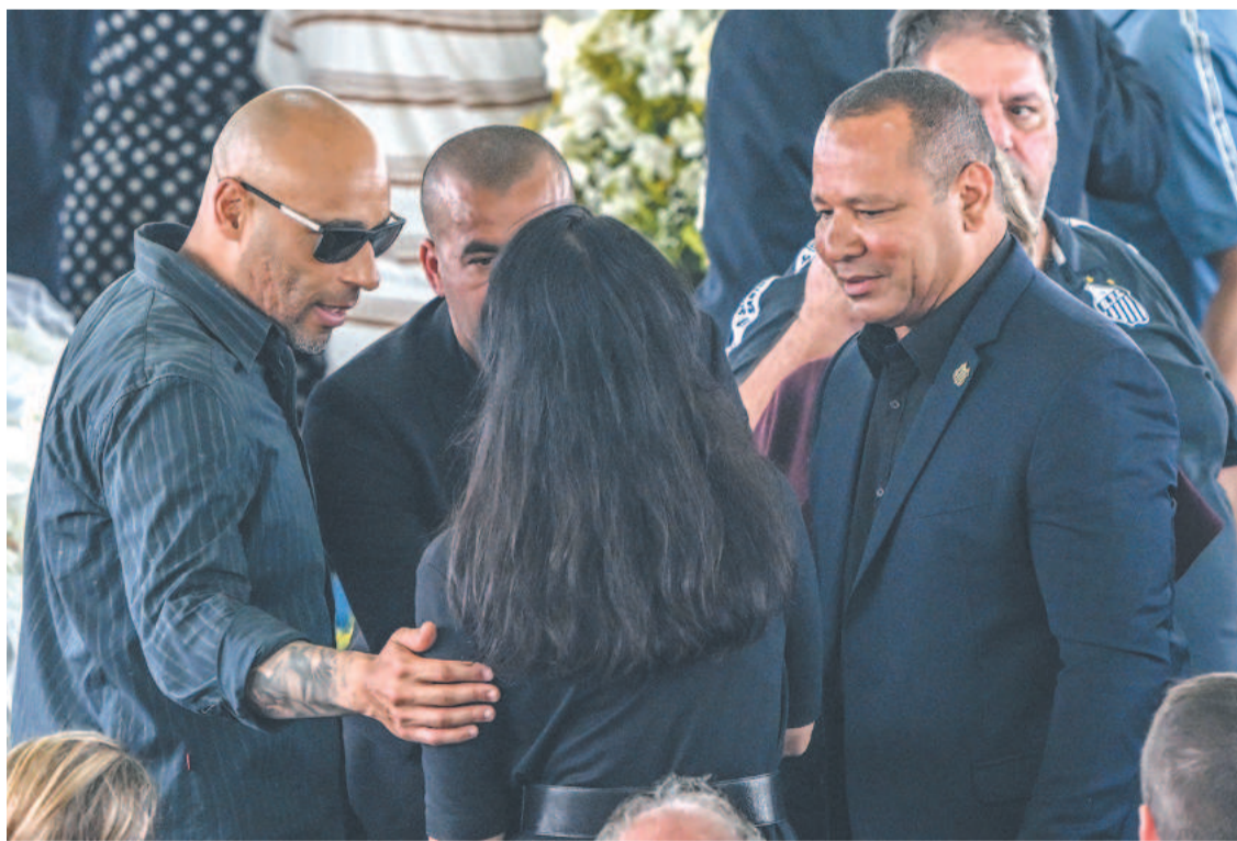
O pai de Neymar compareceu ao velório de Pelé, em Santos, representando o atacante

Enquanto a alegação de que a presença de Neymar na Vila Belmiro para o adeus a Pelé foi barrada pelo PSG circulava na imprensa, o jogador foi visto em uma festa na França, cantando e dançando pagode.