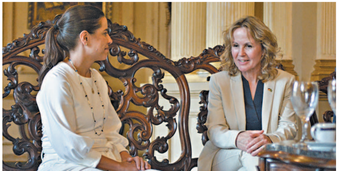
Governadora recebeu, ontem à tarde, a ministra do Meio Ambiente da Alemanha

De acordo com a governadora, uma das saídas está no investimento na chamada economia verde, modelo que visa o desenvolvimento sustentável. “Podemos gerar emprego e renda para nossa população e ao mesmo tempo garantir instrumentos estruturados que permitam que o estado possa sobreviver e conviver melhor com as mudanças climáticas e os desafios que temos no