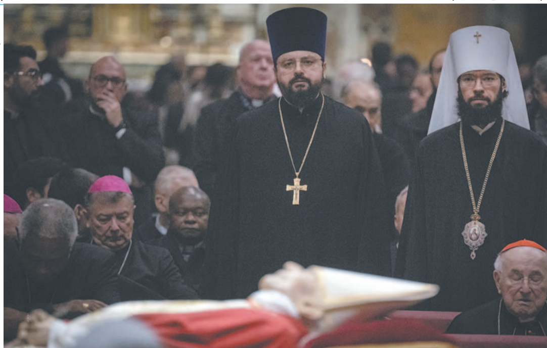
Desde a segunda-feira, o ex-pontífice alemão é velado na Basílica de São Pedro