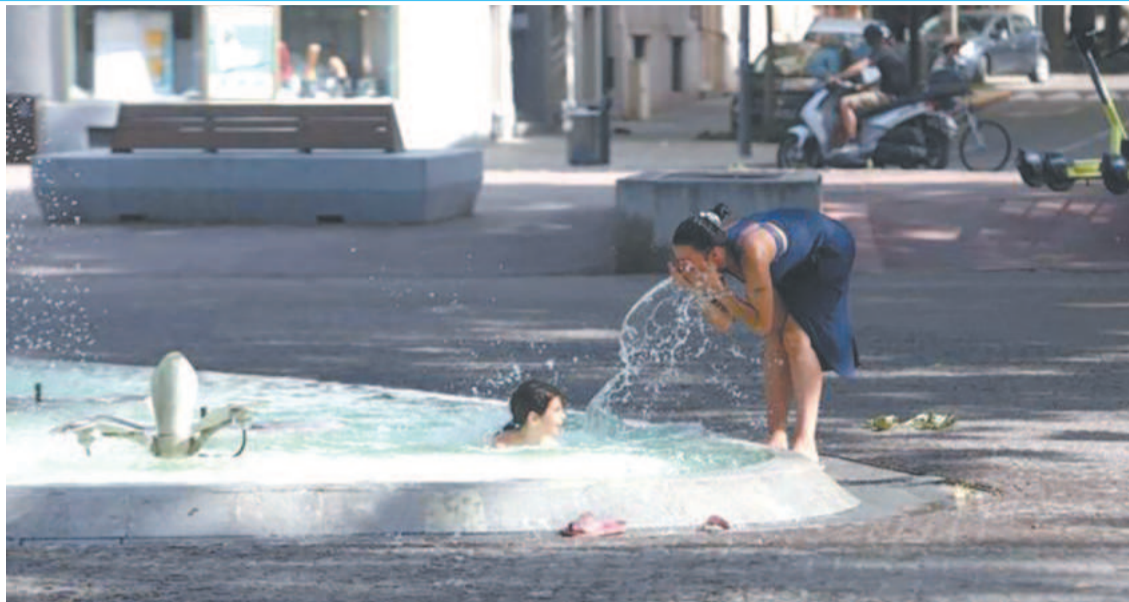
Verão francês do ano passado: no Velho Continente, foi segundo ano mais quente

rio: 2022 em particular foi "o segundo ano mais quente" pelos registros oficiais. Os meses de verão bateram recordes no Reino Unido, enquanto França, Portugal e Espanha sofreram severas secas.