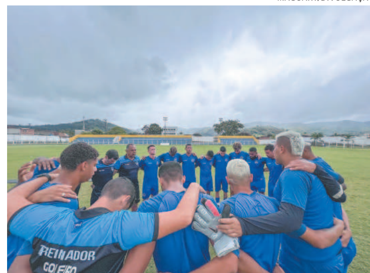
Time de Bonito foi um dos que mais investiu no PE2023

Fundada em 1971, a Associação Atlética Maguary viveu seu ápice em 1977, quando se sagrou campeã da Série A2 Estadual. O clube encerrou as atividades no ano seguinte e retorna à elite em 2023.