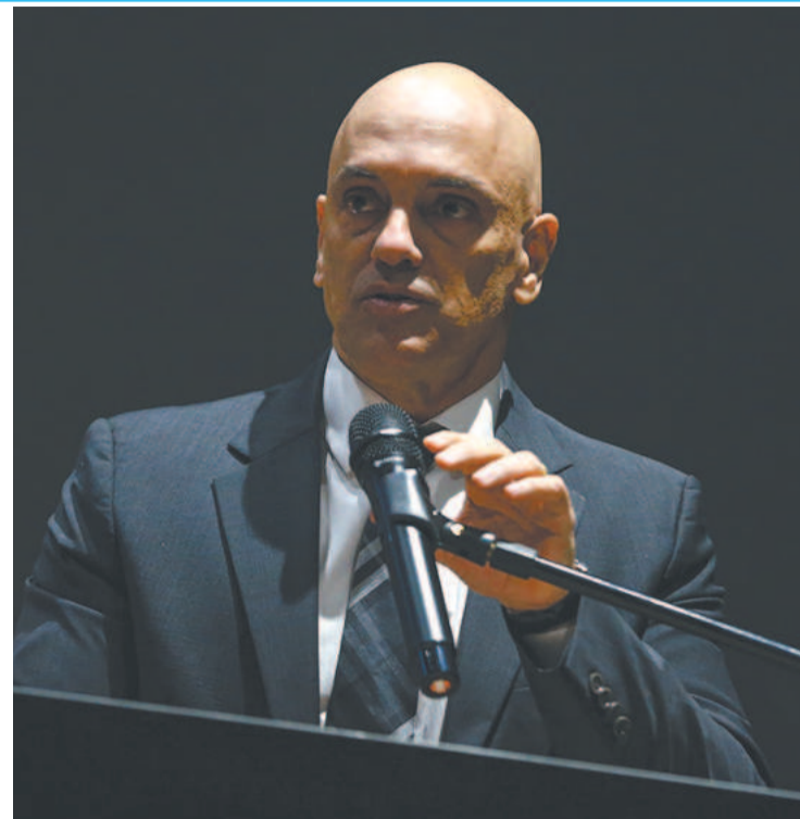
Decisão de Alexandre de Moraes atendeu pedido da AGU

“Acredito na Justiça brasileira e na força das instituições. Estou certo de que a verdade prevalecerá”, completou. A residência do ex-secretário, no Jardim Botânico, foi alvo de busca e apreensão por agentes da Polícia Federal. (Correio Braziliense)