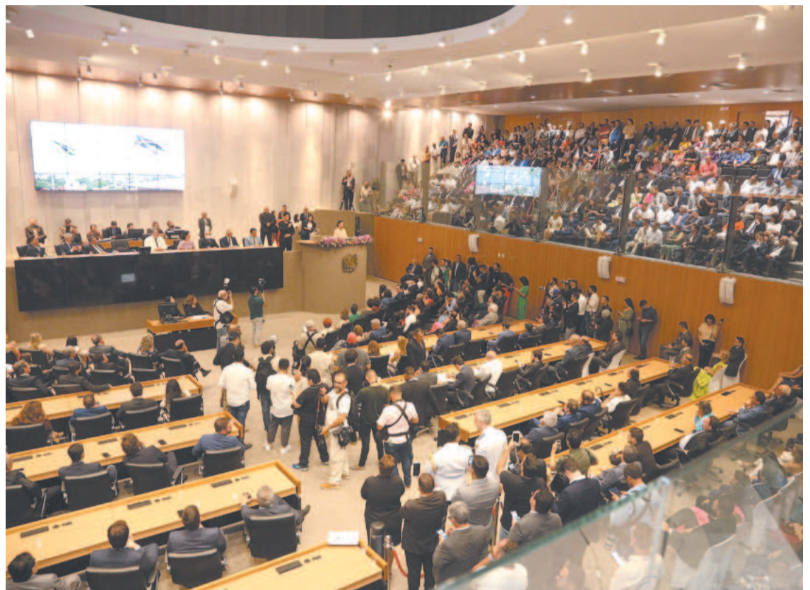
Mesa diretora disse que servidores do Judiciário também já recebem mesmos auxílios

deu algumas explicações sobre a medida. Primeiro, justificou que os benefícios não são arbitrários. Que os servidores do Poder Judiciário e do Ministério Público de Pernambuco recebem os auxílios-saúde e alimentação. E que para o auxílio-moradia algumas regras são