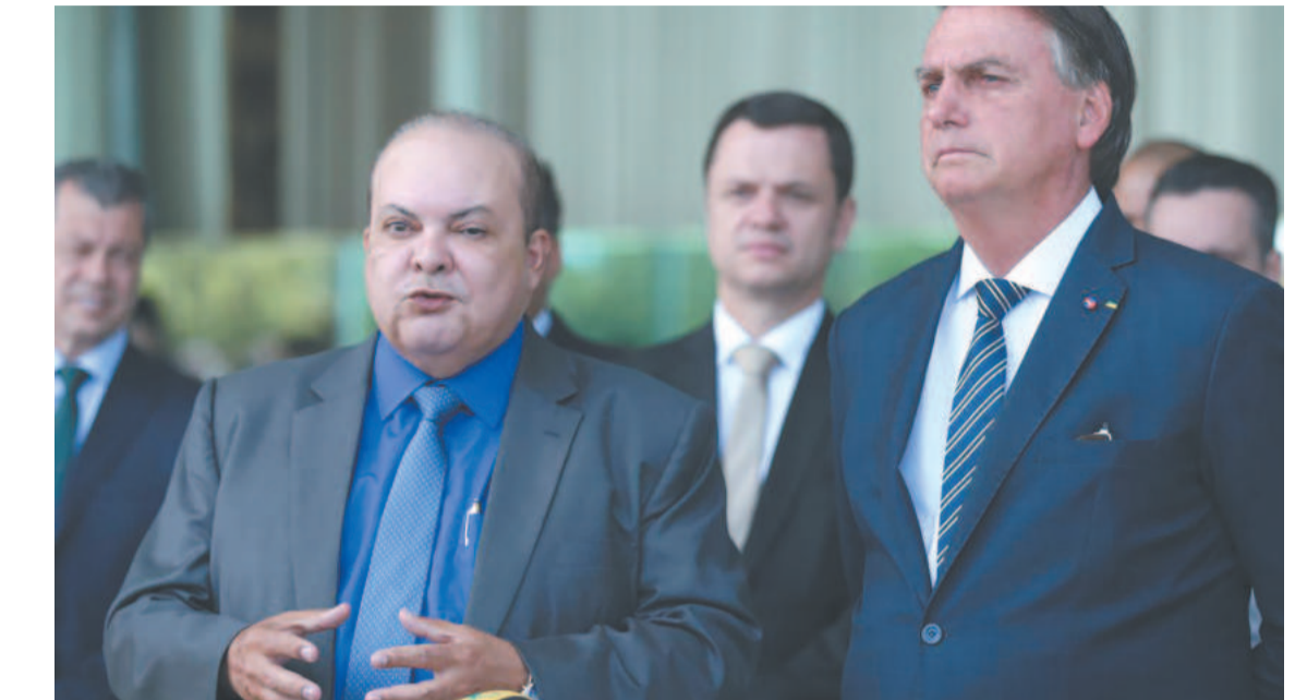
Ibaneis foi afastado do cargo por 90 dias e Bolsonaro viajou para os Estados Unidos

O ex-presidente, que pretendia ficar em Orlando, nos EUA, até 31 de janeiro, revelou que a ideia agora é retornar ao Brasil mais cedo. O ex-presidente Jair Bolsonaro (PL) disse, em entrevista à rede de notícias CNN, que pretende retornar das férias em Orlando, nos Estados Unidos, mais cedo que o esperado. “Eu vim para ficar até o final do mês, mas