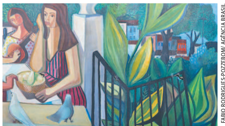
As Mulatas, de Di Cavalcanti, foi atacada por terroristas

“Esse memorial é para deixar marcado, para que nunca mais possa acontecer outra violência desse nível, com o intocável, que é nossa democracia”, disse Mar-