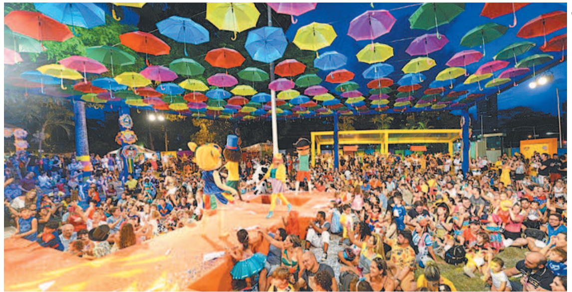
Neste ano, evento será realizado ao ar livre, no jardim externo do centro de compras

A criançada também poderá participar de um desfile de fantasias e se divertir gratuitamente na área kids, com brinquedos voltados para a primeira infância e atividades lúdi-