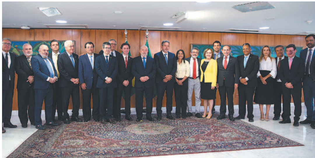
Parlamentares fizeram uma entrega simbólica do decreto de intervenção no DF

Lula falou também sobre os atos de vandalismo ao sistema elétrico do país. "Aquilo foi um ato de vandalismo também, um ato de bandidos porque os cabos de aço foram ferrados. Significa que propositalmente alguém cortou os cabos das duas torres grandes. Já tinha aconte-