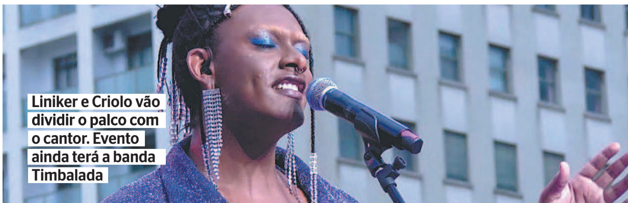
Liniker e Criolo vão dividir o palco com o cantor. Evento ainda terá a banda Timbalada