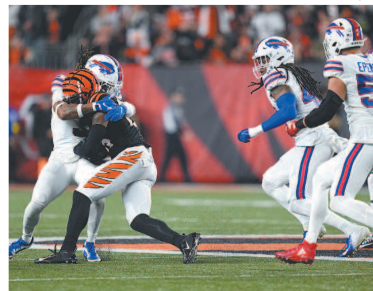
Momento do choque que resultou na parada cardíaca