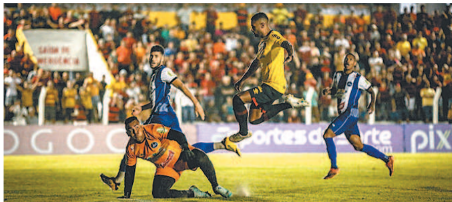
RAFAEL BANDEIRA / SCR