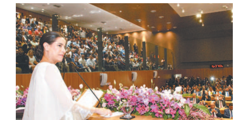
Governo Raquel Lyra propõe a realização de parcerias ao lado da sociedade civil organizada

De acordo com ranking divulgado no início do ano pelo