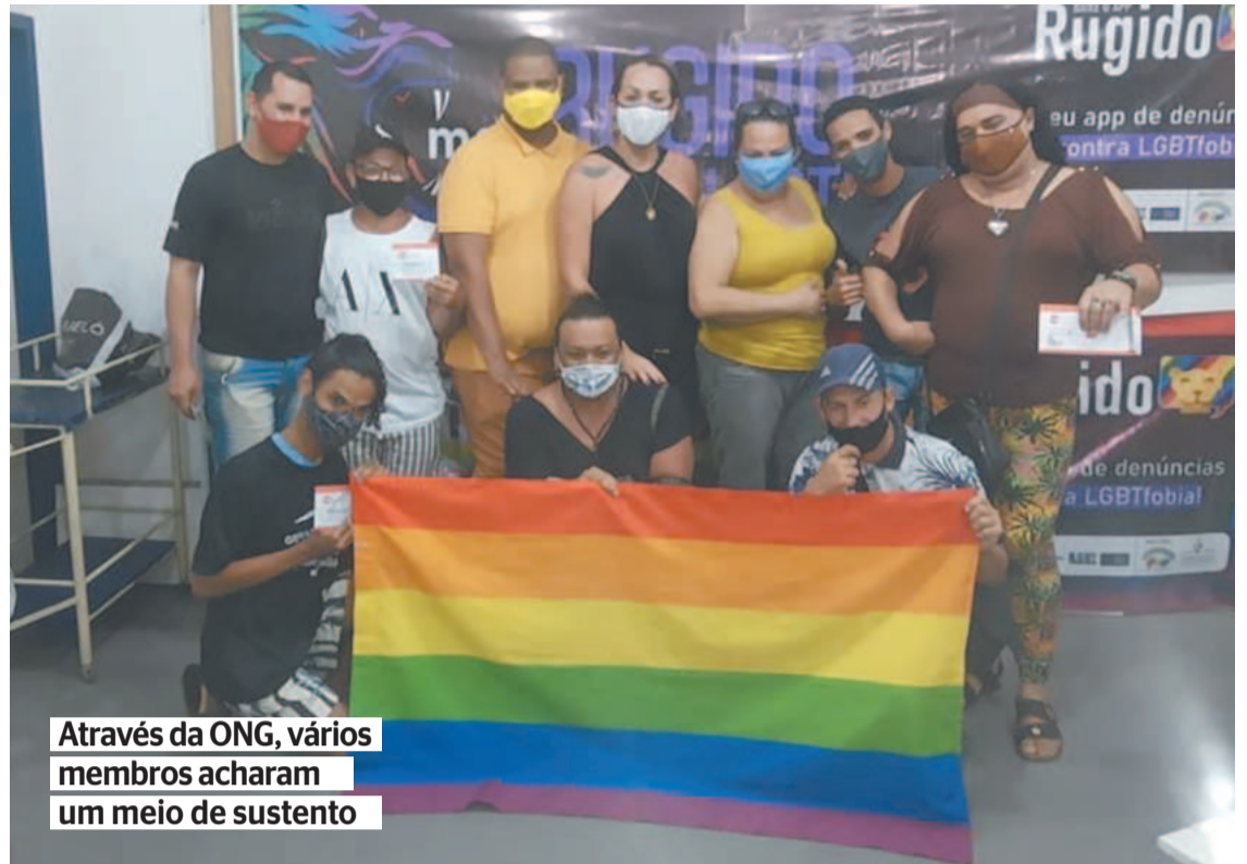
Através da ONG, vários membros acharam um meio de sustento