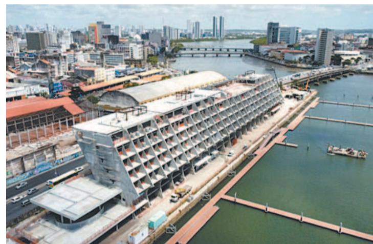
Hotel está previsto para ser concluído em outubro

O hotel-marina Novotel, que está sendo erguido no bairro de São José, no Recife, poderá gerar 2,6 mil empregos diretos e indiretos. Com apoio da Prefeitura do Recife, o empreendimento, que já emprega 200 pessoas, tem investimento previsto de R$ 140 milhões e deverá ser inaugurado ainda este ano. A unidade hoteleira vai dispor de 300 apartamentos em quatro andares, centro de convenções, sala de reuniões e dois restaurantes, além de uma marina para 148 barcos. A previsão de conclusão é outubro deste ano, com data para iniciar a operação em dezembro.