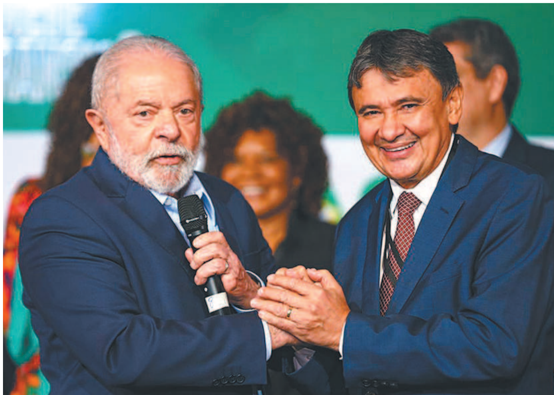
Lula escolheu como responsável pelo programa, ex-governador do Piauí, Wellington Dias

Ao sair de reunião com o presidente Luiz Inácio Lula da Silva no Palácio do Planalto, o ministro disse que a partir de fevereiro o governo vai começar a fazer uma busca ativa para incluir quem ainda está fora do programa, vai começar a pagar R$ 150 para quem tem filhos menores de seis anos (pagamento previsto para começar em março) e atualizar cerca de 10 milhões de benefícios com algum "indício de irregularidades".