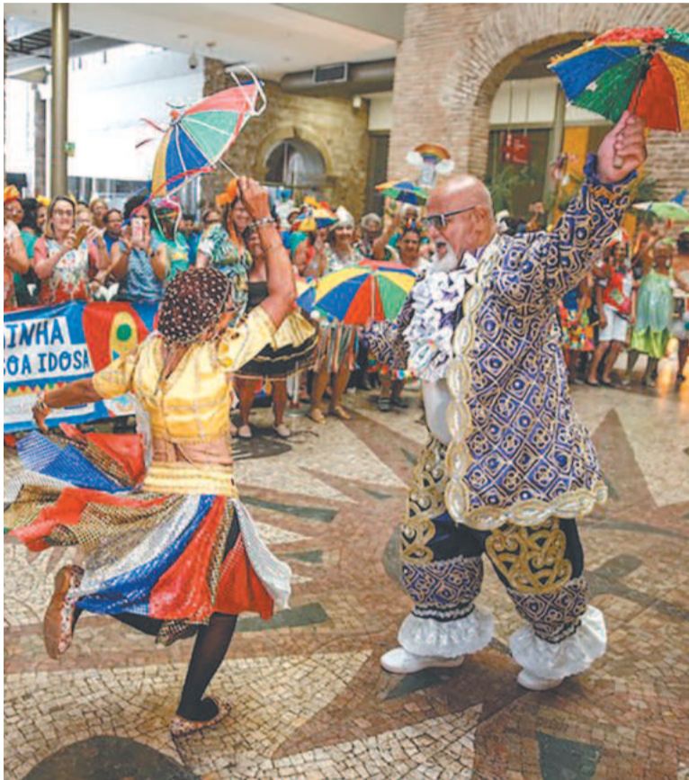
Carnaval volta a acontecer depois de dois anos de Covid-19

Já estão abertas as inscrições para o 12º Concurso do Rei e da Rainha do Carnaval da pessoa idosa do Recife 2023. Interessados em concorrer aos títulos podem procurar, até a próxima segunda-feira (16), das 8h30 às 16h30, na sala da Gerência da Pessoa Idosa, no 6º andar da sede da Prefeitura da Cidade do Recife, no bairro do Recife.