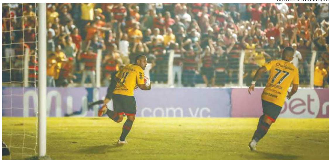
Camisa 11 rubro-negro entrou na etapa final do jogo no estádio Artuzão, em Bonito