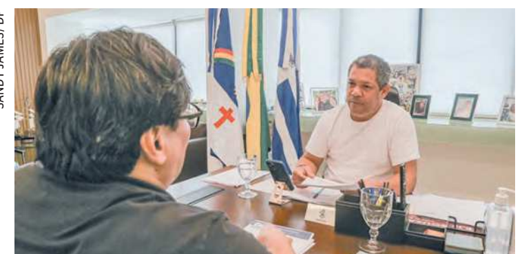
A ação tramita na Vara da Fazenda Pública, no Cabo