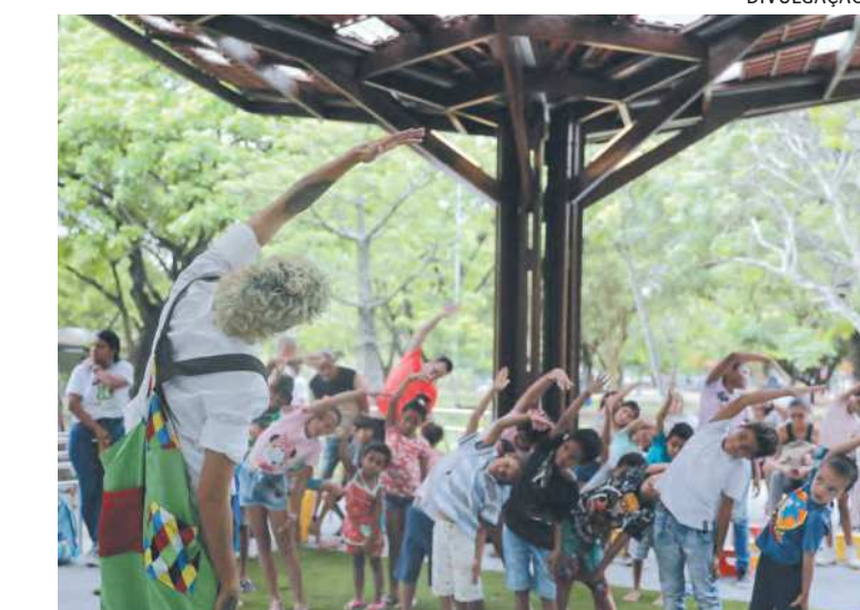
Espaço recebe dez mil por ano, de acordo com a gestão

paço multiuso voltado às ações permanentes de educação ambiental, que abriga exposições, exibição de filmes e peças de teatro, e que recebe uma média de 10 mil visitantes por ano. Além