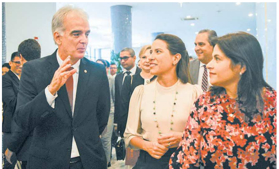
Com 227 votos, ele foi o primeiro na lista tríplice do Ministério Público de Pernambuco

a aliança com o Ministério Público para melhorar o estado de Pernambuco. “Recebi a visita do procurador-geral de Justiça antes de tomar posse, e ele dizia que o Ministério Público iria atuar firme junto com o nosso governo no combate à insegurança alimentar. Milhares de pessoas passam fome em Pernambuco, 2 milhões de pessoas não têm acesso à água no nosso estado. Nós não temos sequer tratamento de esgoto para