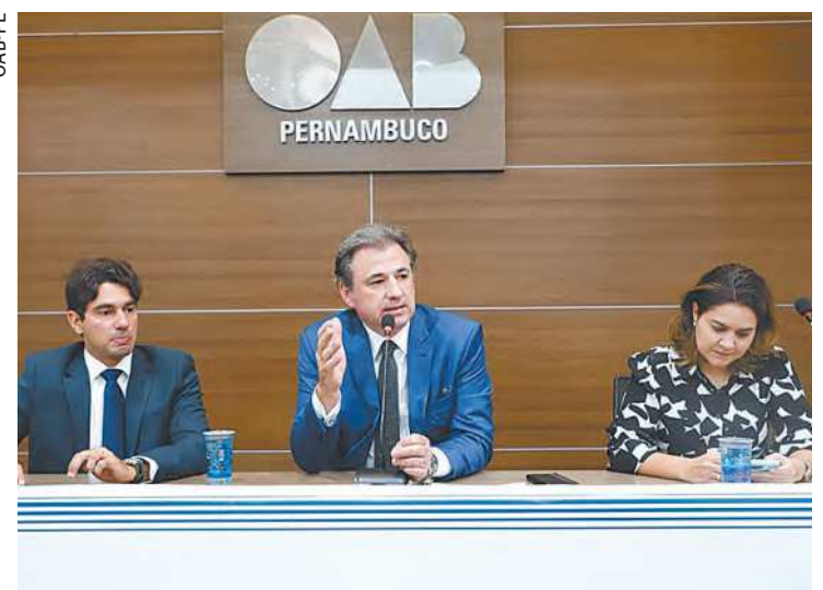
Lins (c) diz que auxílios extrapolem medida do razoável