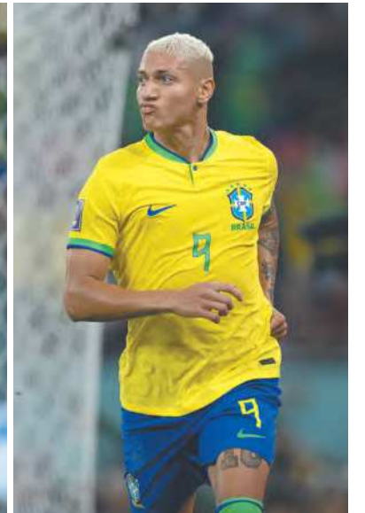
Além do quarteto, Alisson e Ederson concorrem ao prêmio de melhor goleiro. Resultado sairá dia 27 de fevereiro