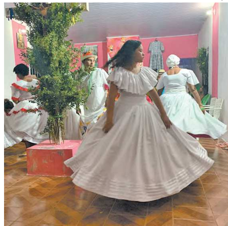
Registros feitos desde 1999 e agora compactados