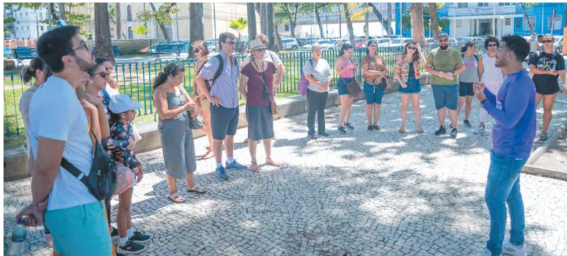
Projeto municipal abre o agendamento sempre às sextas-feiras e tem limite de vagas

Neste sábado, às 15h, por exemplo, a atividade será "Caça ao Tesouro", perfeita, segundo a gestão, para crianças e adolescentes. Inédita na programação de passeios, essa iniciativa vai levar participantes a desbravarem importantes pontos históricos do Recife, tendo como ponto de partida a Praça do Arsenal, e incluindo encenação de momentos históricos, passando por atrativos turísticos do Centro. Também neste sábado, pela manhã, outra opção é o passeio de catamarã pelo Rio Capibaribe, para conhecer o Recife e suas pontes, com apresentação dos pa-