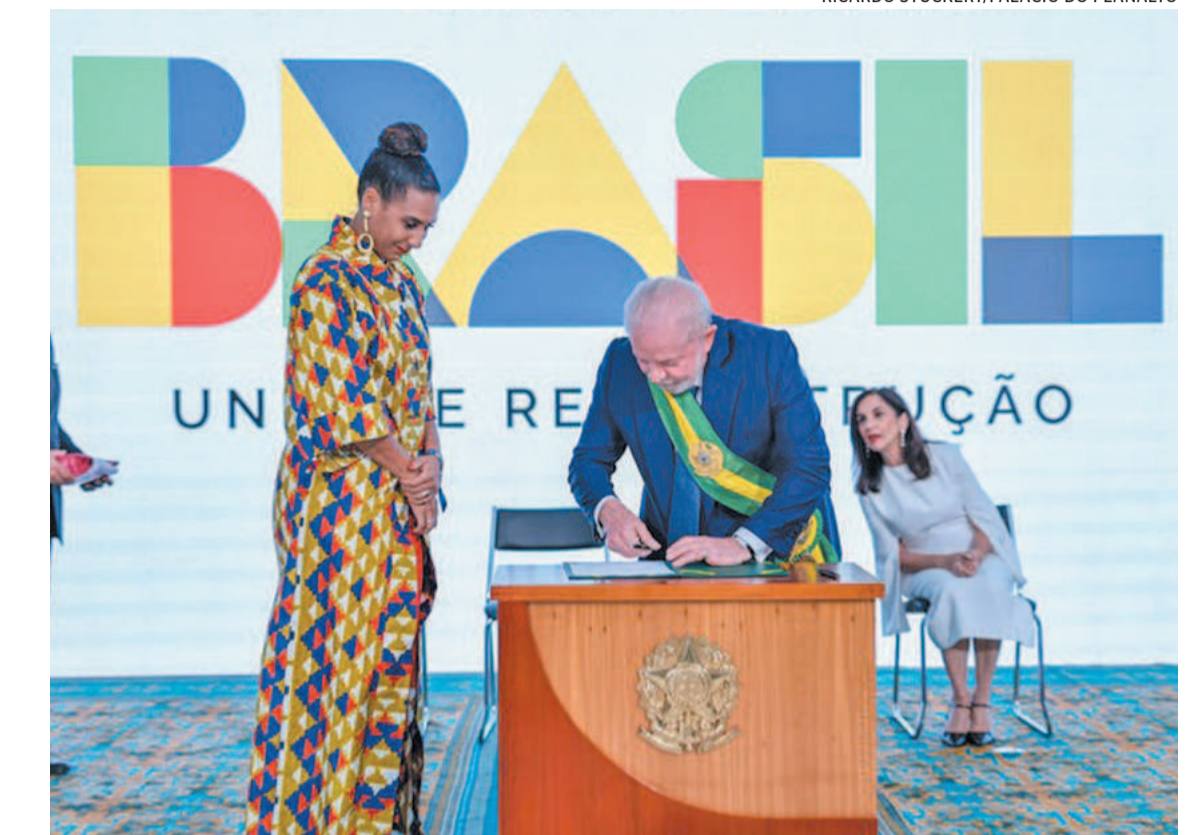
Lula sanciona a nova lei observado pela ministra da Igualdade Racial, Anielle Franco