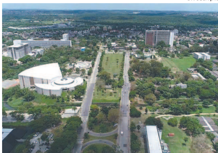
Há opções online mas também algumas presenciais

Estão abertas até o dia 3 de fevereiro as inscrições para os cursos de idiomas da Coordenação de Línguas para Internacionalização (Cling) da Diretoria de Relações Internacionais (DRI) da UFPE para o primeiro semestre de 2023. Estão disponíveis turmas de inglês, francês, italiano e espanhol. Nos cursos de inglês e francês, há opções de turmas on-line e presenciais; nos cursos de espanhol e italiano, estão disponíveis apenas turmas online. Os horários estão disponíveis no Instagram do Cling e as aulas têm início a partir de 13 de fevereiro.