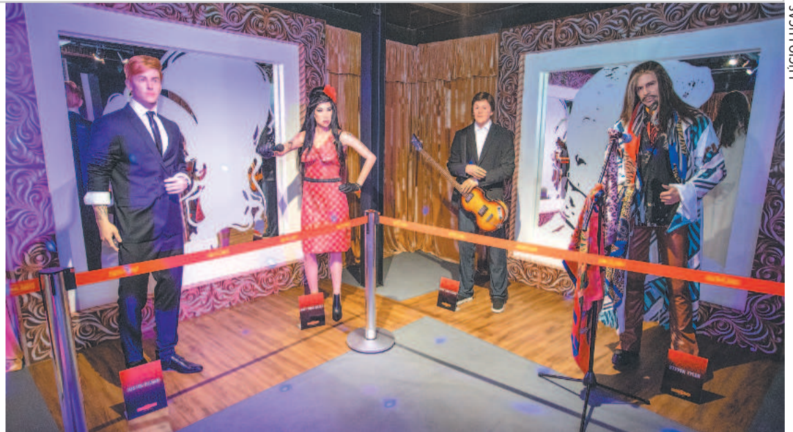
Local tem mais de 70 personagens nacionais e internacionais em tamanho real

A opção que proporciona aos visitantes uma viagem pelo mundo já está revolucionando o entretenimento turístico de quem circula pelo famoso centrinho de Porto em busca de artesanato, ou culinária regional. As peças apresentam uma riqueza de detalhes que são fascinantes. A impressão é que as representações podem ganhar vida a qualquer momento. Fãs das grandes