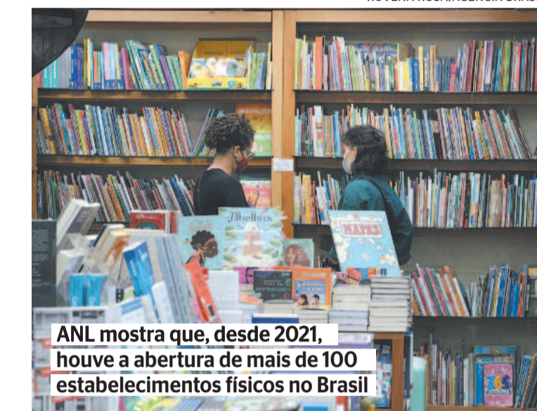
ANL mostra que, desde 2021, houve a abertura de mais de 100 estabelecimentos físicos no Brasil

Mas, não faz muito tempo, o cenário era desalentador. Enquanto as lojas virtuais, como a Amazon e o Magazine Luiza, dobavam a porcentagem das suas participações no faturamento do mercado editorial — de 12,7% em 2019, para 24,8%