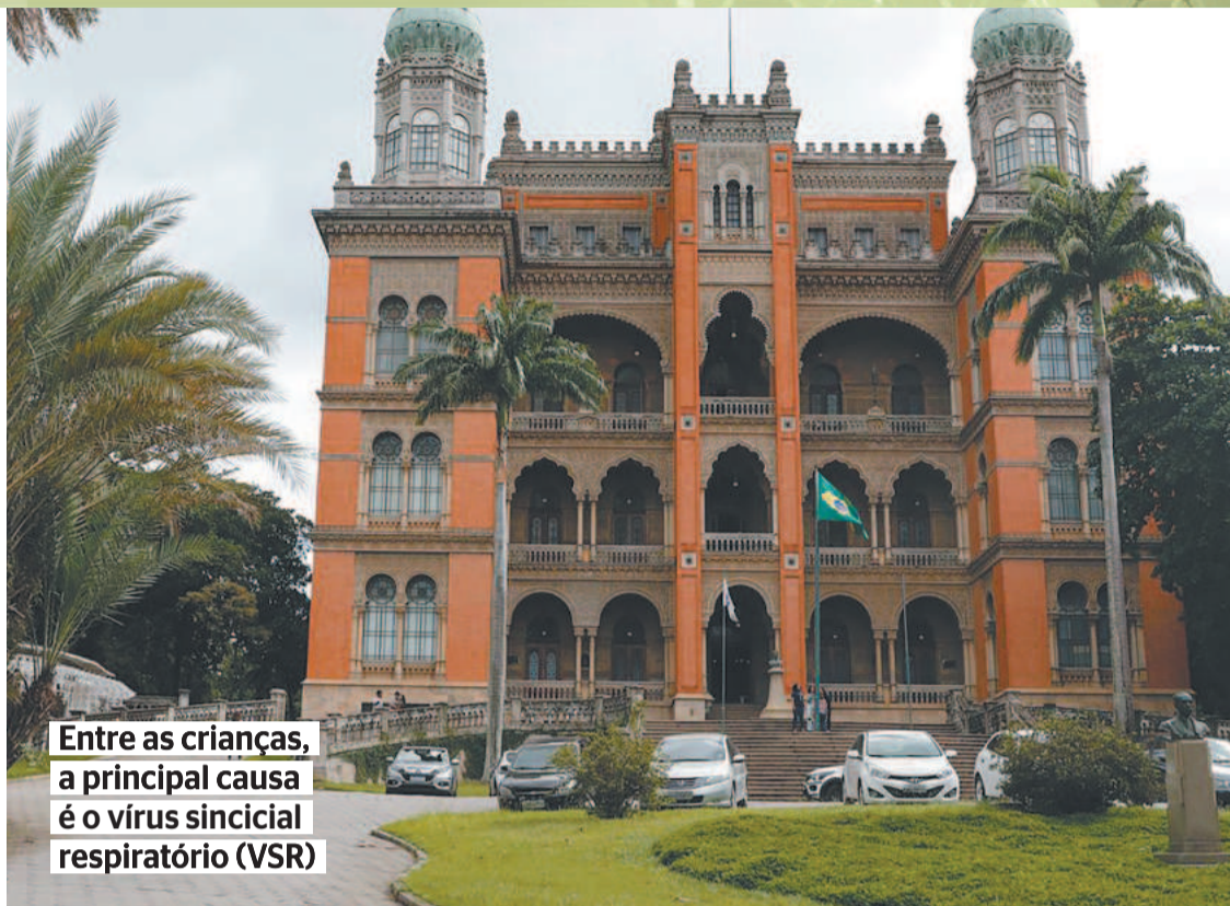
Entre as crianças, a principal causa é o vírus sincicial respiratório (VSR)

A pandemia de Covid-19 já provocou a morte de 695.088 pessoas no Brasil, o segundo maior número de vítimas em todo o mundo, segundo a Organização Mundial da Saúde. (Agência Brasil)