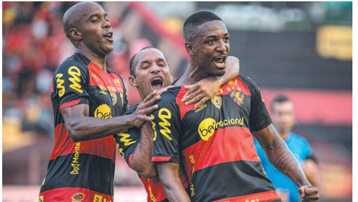
Rubro-negros conseguiram a primeira vitória no ano após o 2 a 0 diante do Petrolina

“Eu não gosto desse termo de poupar jogadores. Para mim o atleta só não vai começar o jogo se ele realmente não apresentar um nível de recuperação adequado. Então, sabemos que é uma viagem longa, uma das maiores no campeonato. Não podemos abrir de forma alguma em nenhum jogo. Jogar contra o Salgueiro lá sempre foi muito difícil, sempre foi muito complicado contra qualquer equipe. Temos que ter a melhor equipe possível para poder fazer esse enfrentamento. Mas sabendo também que nós já temos a Copa do Nordeste e avaliaremos o que fazer nessa sequência de jogos.”