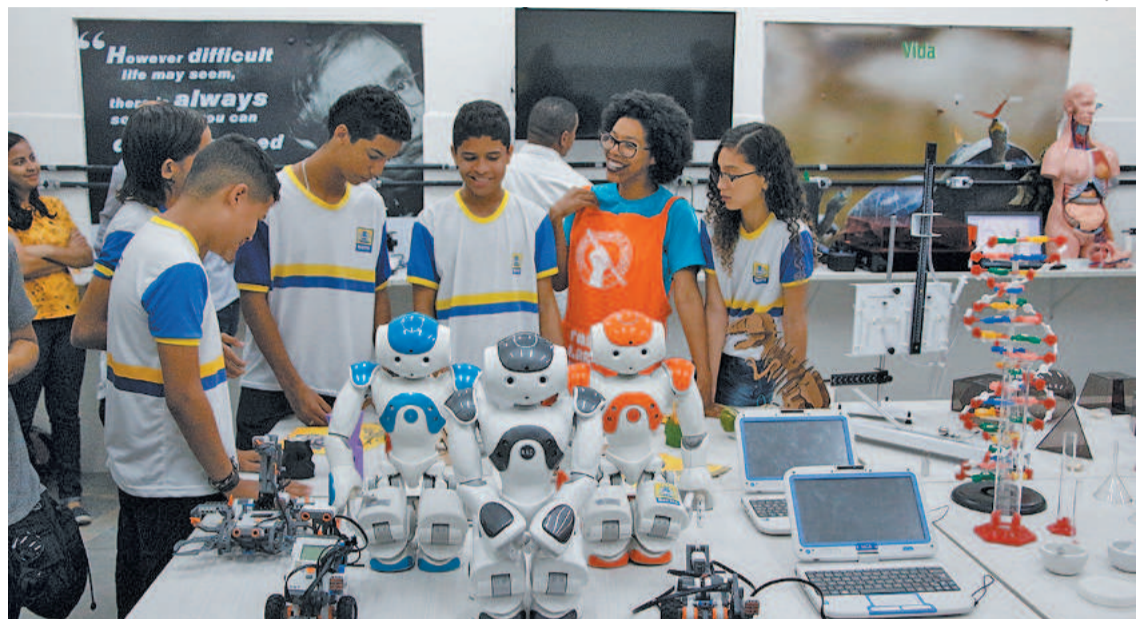
Muitas cidades já têm política do tipo, como no Recife, onde há ensino de robótica

Já o segundo veto exclui trecho que garantia prioridade de financiamento pelo Fundo de Financiamento Estudantil (Fies) aos programas de imersão de curta duração em técnicas e