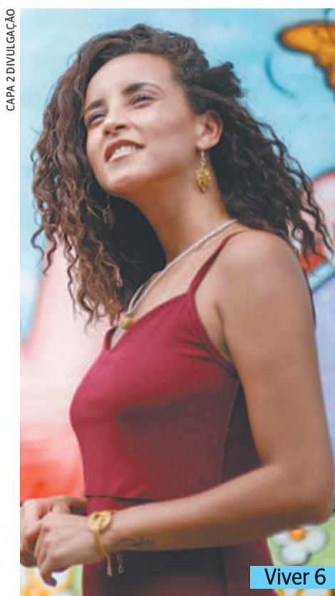
CAPA 2 DIVULGAÇÃO

Um dos itens previa a inclusão de aulas como robótica no currículo escolar. Vida Urbana 13