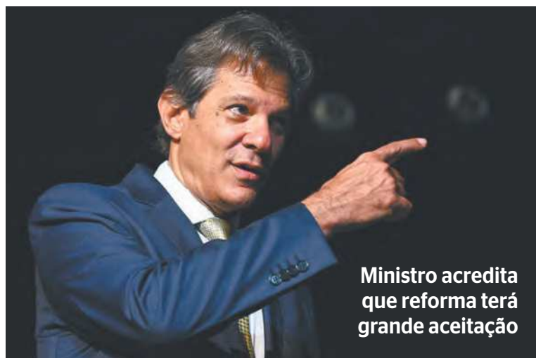
Ministro acredita que reforma terá grande aceitação

Segundo o chefe da pasta da Fazenda, a reforma tributária que o governo Lula deve fazer – que envolve a unificação de impostos – é “inconfortável”, mas não é a “bala de prata” da economia. (Victor Correia, do Correio Braziliense)