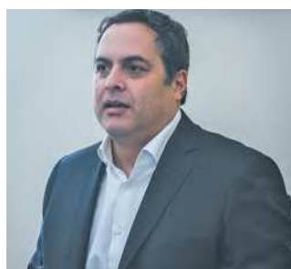
Ex-governador é auditor concursado

ça, Justiça, com Flávio Dino, Indústria e Comércio, com o vice-presidente Geraldo Alckmin, e a Secretaria Nacional de Segurança Pública, com Tadeu Alencar.