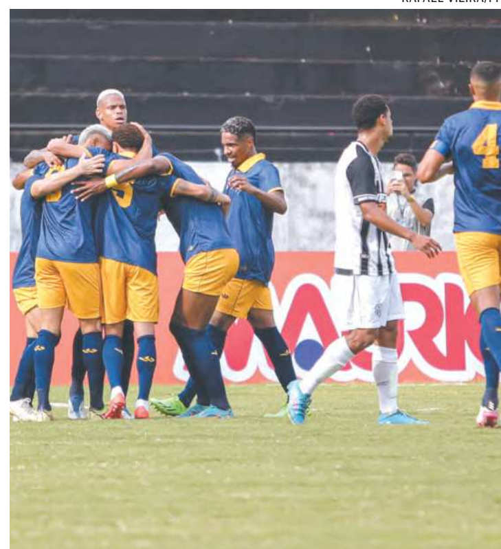
Time de Camaragibe venceu o Central por 2 a 0 ontem

Na próxima rodada o Retrô visita o Caruaru City, no Vianão, na próxima quinta-feira às 16h. No mesmo dia, mas às 20h, a Patativa recebe o Afogados no Lacerdão.