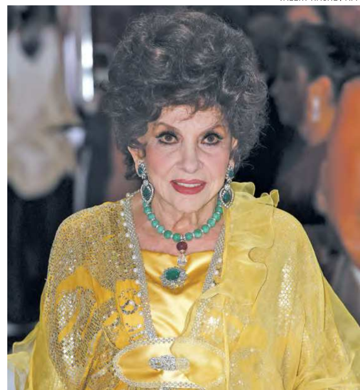
Gina estudou Belas Artes e também se dedicou à escultura

interpretou Esmeralda. Filmou nos Estados Unidos até 1962 e depois voltou para a Itália. Desde então, trabalhou ocasionalmente em produções para cinema e televisão. A italiana voltou às suas primeiras paixões artísticas, a fotografia e a escultura, às quais se dedicou plenamente no início dos anos 1980. Seu único arrependimento? Não ter “encontrado nunca [sua] alma gêmea” e ter conhecido apenas o amor “não correspondido”, declarou à Vanity Fair em 2007. Lollobrigida se divorciou em 1969 de Milko Skofic, médico com quem se casou em 1949 e teve seu único filho, Milko Jr. Em 2006, aos 79 anos, a artis-