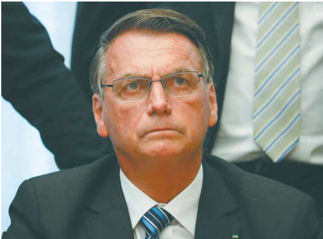
Bolsonaro continua hospedado em Orlando, nos EUA, para onde foi no fim do ano

Enquanto isso, o ministro do Tribunal Superior Eleitoral (TSE) Benedito Gonçalves autorizou ontem a inclusão da minuta apreendida na casa do ex-ministro da Justiça Anderson Torres em uma ação de investiga-