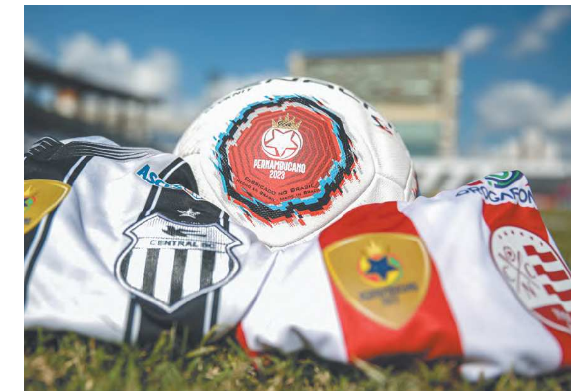
Partida que abriu o Pernambucano 2023 tem, a princípio, a vitória da Patativa mantida