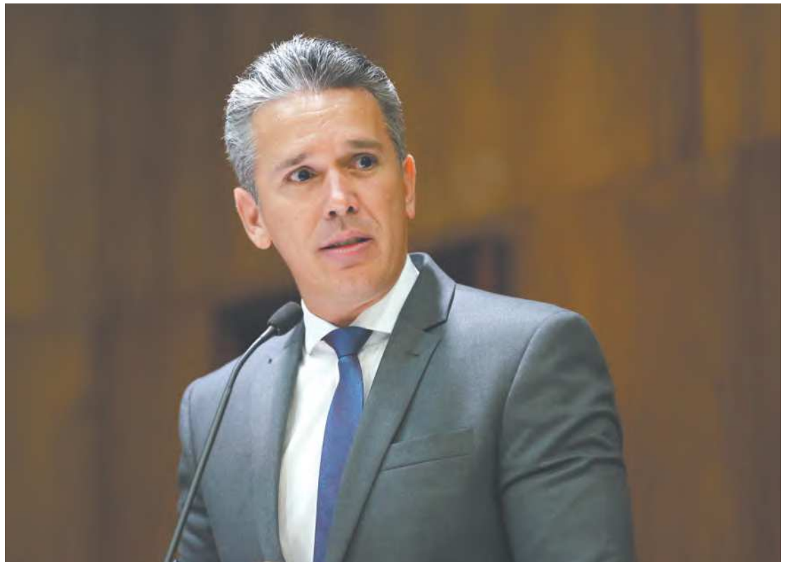
Ementa de Felipe Carreras condena o que chamou de “invasões golpistas”

A do pedido de Sâmia Bomfim aponta necessidade de “criação de Comissão Parlamentar de Inquérito com a finalidade de investigar a organização e o financiamento de atos terroristas e antidemocráticos que têm o ob-