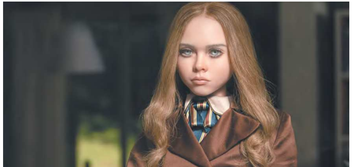
Divertimento de M3gan é garantido no senso de humor afiado e ocasionalmente absurdo

Produzido e idealizado por James Wan e dirigido por Gerard Johnstone, em seu segundo longa-metragem, M3gan, que acaba de entrar em cartaz, mescla essa premissa de ficção científica e os comentários elementares sobre a onipresença tecnológica na vida