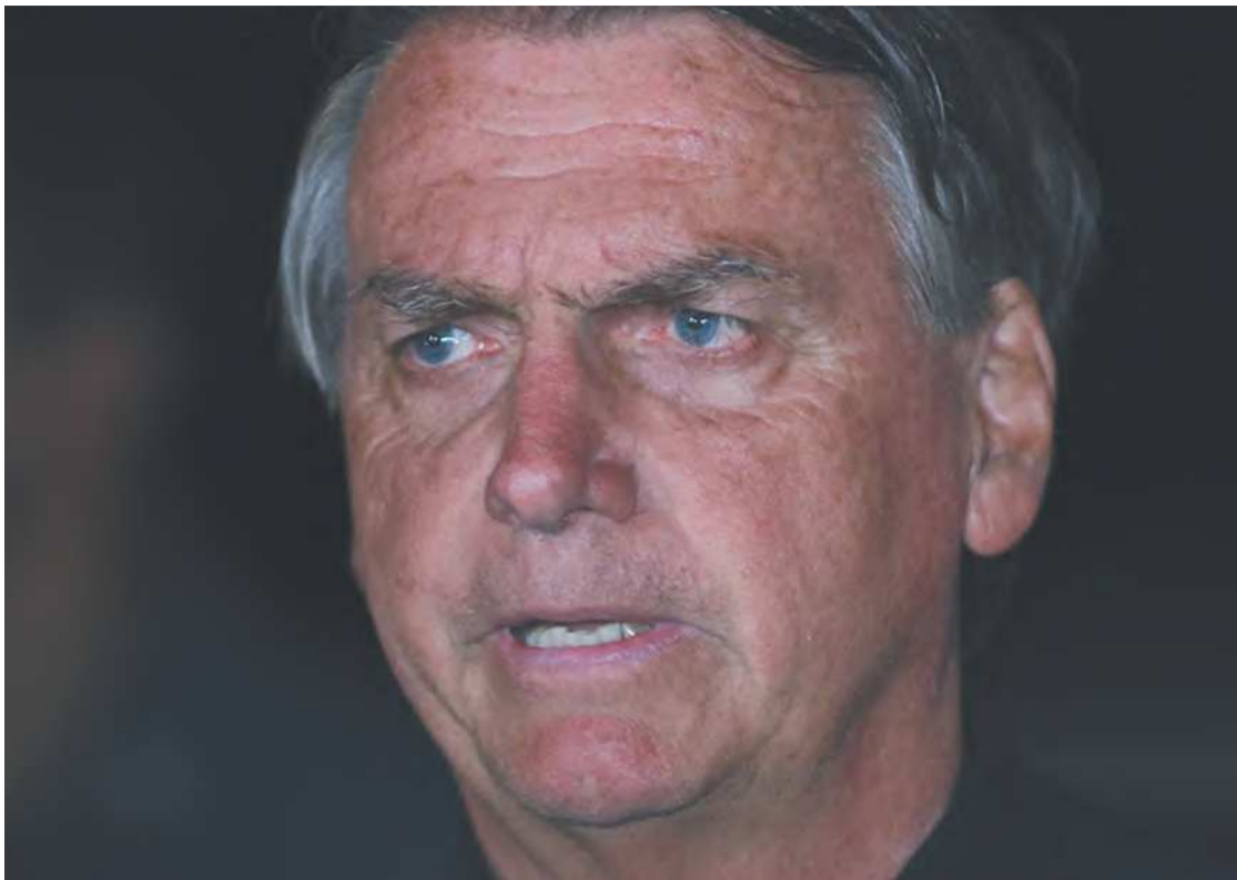
Jair Bolsonaro é investigado por autoria intelectual dos atos antidemocráticos