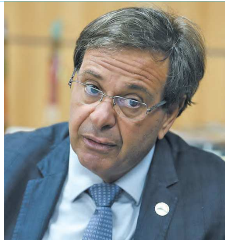
Ex-ministro foi presidente da Embratur por dois meses

A disputa pela presidência da Assembleia Legislativa de Pernambuco (Alepe) para o biênio 2023-2025 já conta com a candidatura oficial do deputado