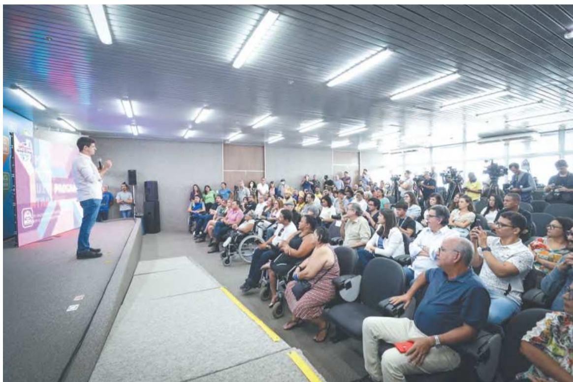
Baile Municipal do Recife chega à edição 57 depois de dois anos suspenso pela Covid-19