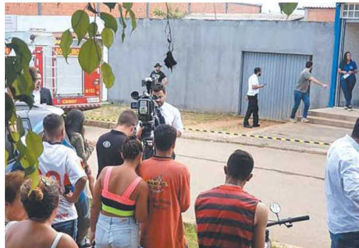
Caso chocou o país e envolve a morte de três crianças