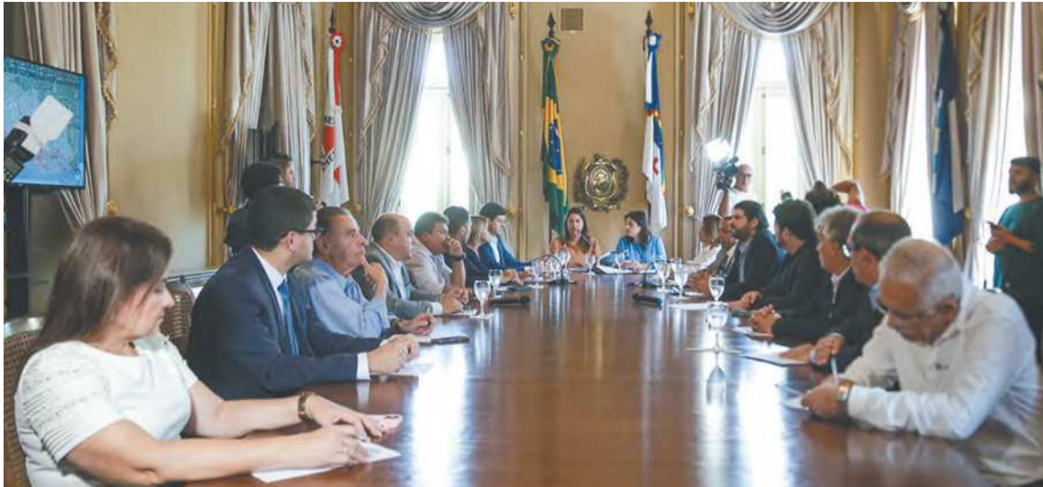
Reunião aconteceu ontem no Palácio do Campo das Princesas e foi específica sobre a região