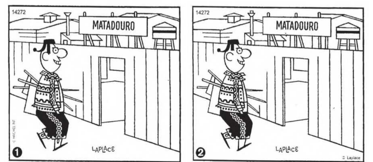
Resolução: 1. Telhado acima da placa. 2. Madeira que sustenta a placa. 3. Chaminé da casa. 4. Detalhe da casa. 5. Gola. 6. Madeira nas costas. 7. Pedaco da calça na barra. 8. Tamanho de madeira na barra.