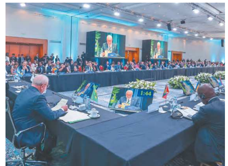
Presidente afirmou que pretende realizar COP no Brasil