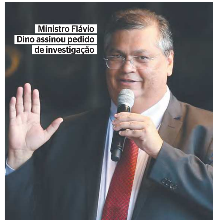
Ministro Flávio Dino assinou pedido de investigação

“É desumano o que vi aqui”, afirmou Lula durante sua visita. Ainda na última sexta-feira foi decretado estado de emergência de saúde pública no território, em edição extra do Diário Oficial da União (DOU). Desnutrição, malária, pneumonia