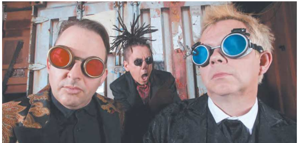
Grupo é dono de mega-hits como "Whats on your mind (Pure Energy)" e "Repetition"

Foi em 1989 que eles lançaram seu primeiro disco, que leva apenas o nome do grupo e que contém os principais hits de car-