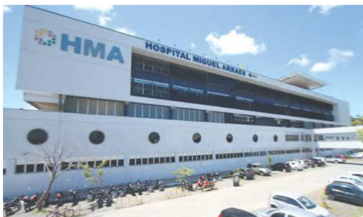
Fundação investigada pela PF tem ligação com o Imip