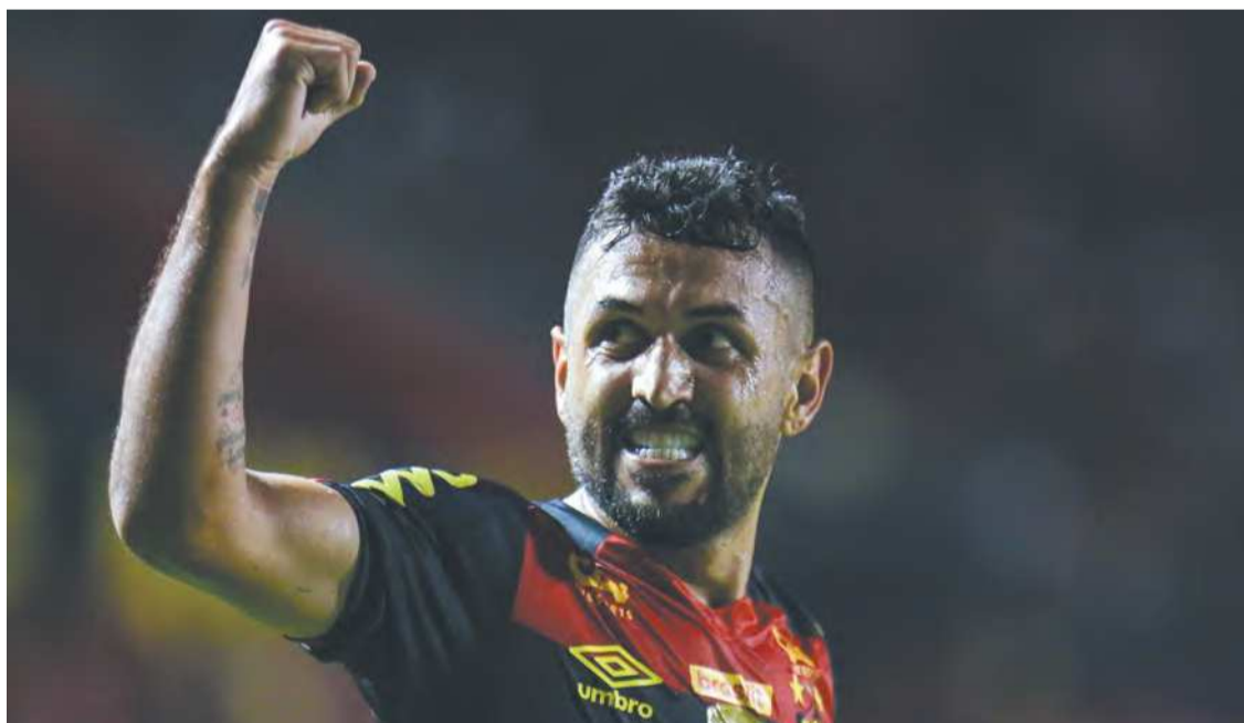
Gol saiu na primeira vez que o atacante tocou na bola nos 6 a 1 contra o Belo Jardim

zamos um trabalho muito bem feito pelos professores na pré-temporada, porque eles já estavam visando essa sequência de jogos", pontuou.