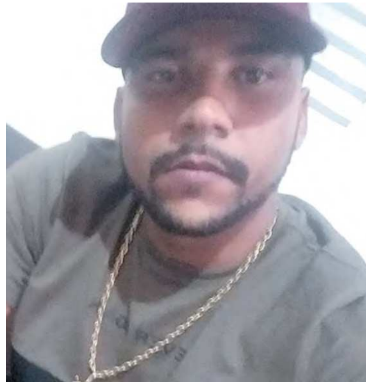
O suspeito se entregou na 30ª DP, em São Sebastião

"Infelizmente, temos uma legislação que determina o prazo de 10 dias para a autoridade policial concluir o inquérito. Isso prejudica um pouco", disse. Segundo o advogado, a PCDF tem elementos suficientes para re-