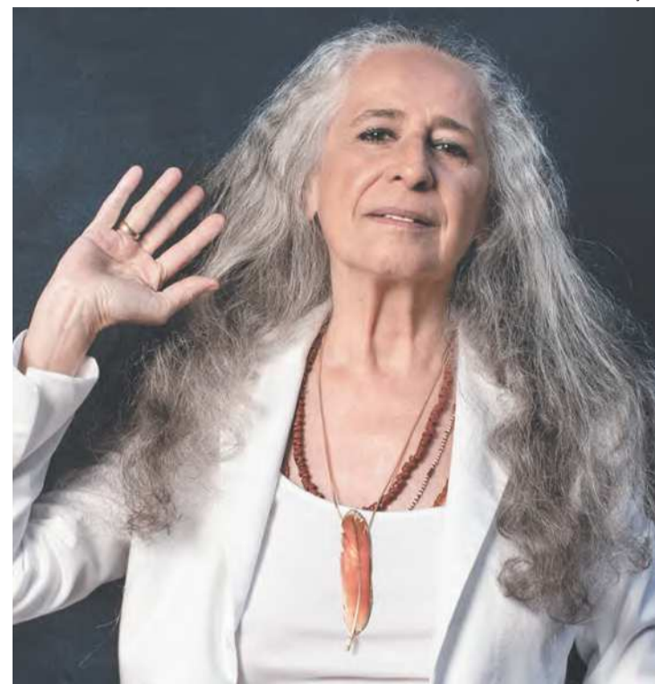
Show de Bethânia ocorrerá em apresentação única

A previsibilidade sempre passou ao largo da trajetória artística da cantora Maria Bethânia. Após o repentino sucesso com a sua arrebatadora interpretação para a música "Carcará", em 1965, os mais afoitos a elegeram como uma cantora de protesto, título que ela declinou de imediato. E assim, ela seguiu e prosseguiu in-