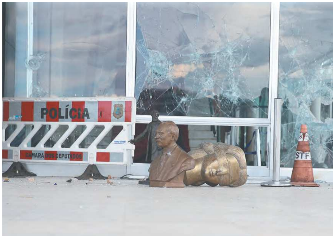
Manifestantes depredaram os prédios públicos sem confronto com policiais

A atuação da PMDF já havia sido classificada como falha e omissa pelo STF logo após os atos golpistas, o que resultou na exoneração do ex-comandante