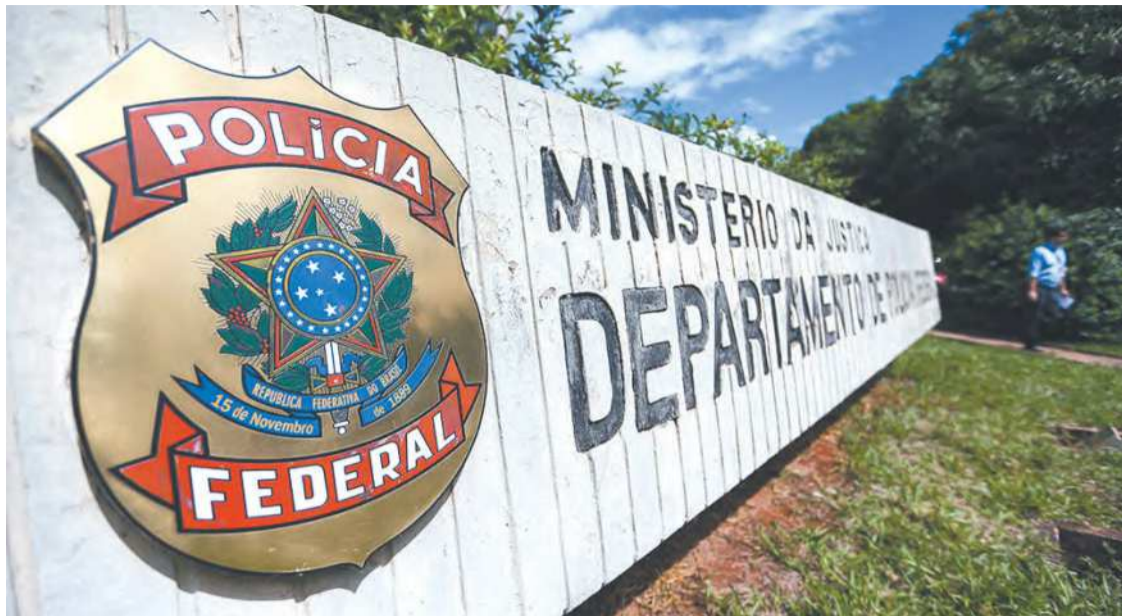
Polícia Federal foi acionada para o caso após pedido feito pelo Ministério da Justiça