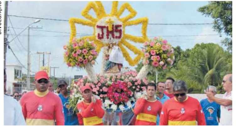
Festejo começa hoje, com a procissão da bandeira