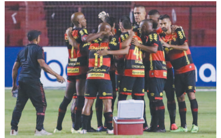
Leões venceram os últimos três jogos como mandantes

GENIVALDO HENRIQUE esportes@diariodepernambuco.com.br