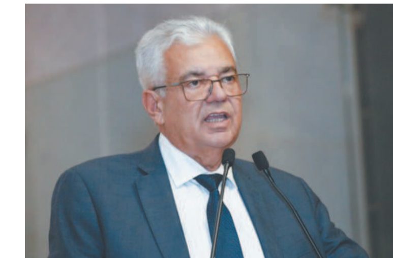
Parlamentar ainda não oficializou a polêmica decisão