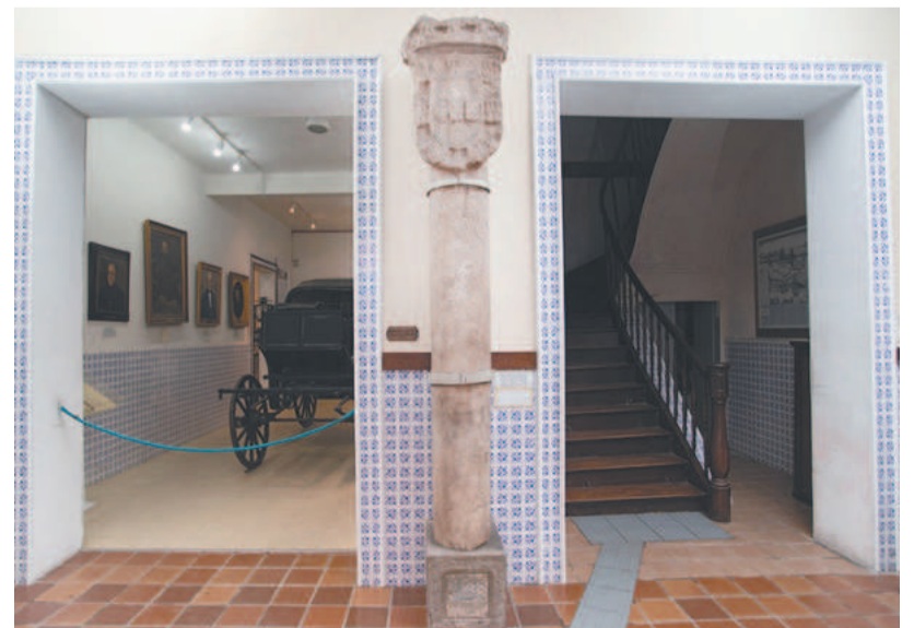
Museu se encontra aberto para visitaçã de segunda a sexta