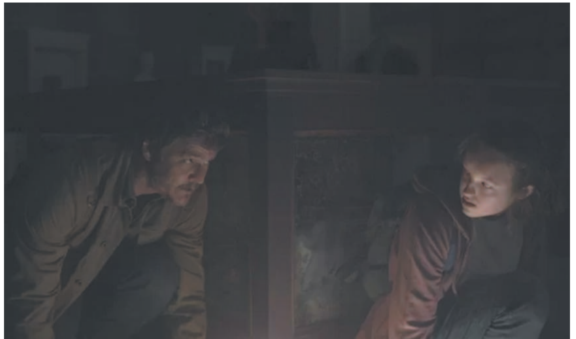
Seriado é aclamado pela crítica e atualmente tem 97% de aprovação no Rotten Tomatoes

Outro recorde quebrado foi o de maior crescimento de audiência entre a estreia e o segundo episódio da atração