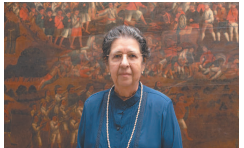
“Instituto é o mais antigo do Brasil”, disse a presidente

O museu se encontra aberto para visitaçã de segunda a sexta-feira, das 9h às 12h e das 14h às 16h e, aos sábados, das 8h às 12h. Lá, pesquisadores e estudantes podem ter acesso a diversos documentos históricos de Pernambuco com atendimento presencial exclusivamente aos sábados ou consultas por meio do e-mail arqueologico@iahgp.org . Os ingressos custam R$2,00. Grupos escolares devem fazer agendamento prévio.