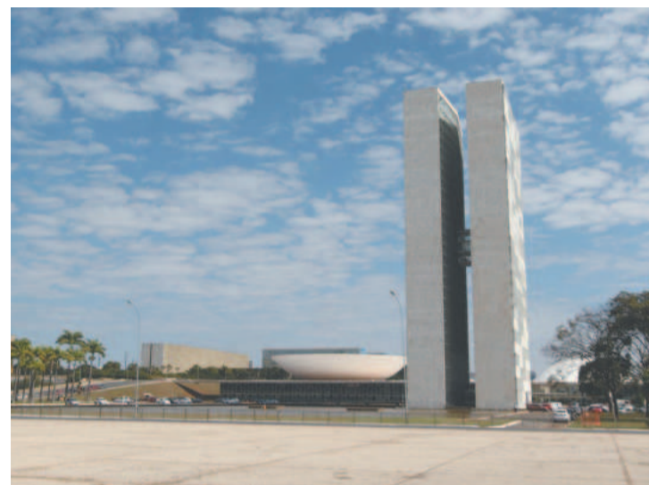
Propostas reúnem tributos que aboarda o consumo

e Serviços (IBS). Pela proposta, a Contribuição sobre Bens e Serviços (CBS) substituiria a Contribuição para o Financiamento da Seguridade Social (Cofins), o Programa de Integração Social (PIS) e o Programa de Formação do Patrimônio do Servidor Público (Pasep). (Agência Brasil)