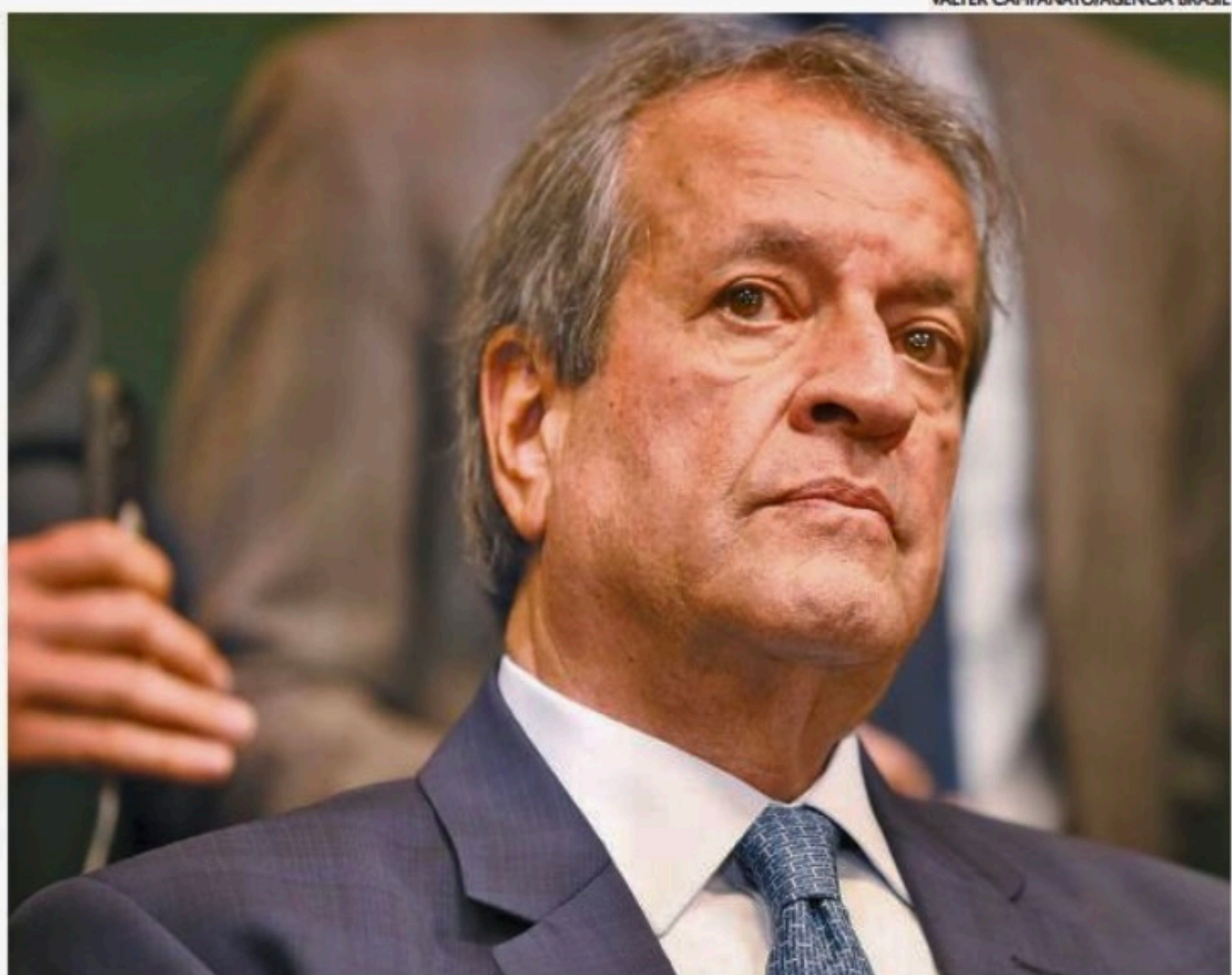
Presidente do PL saiu em defesa de correligionário e condenou os que querem responsabilizá-lo