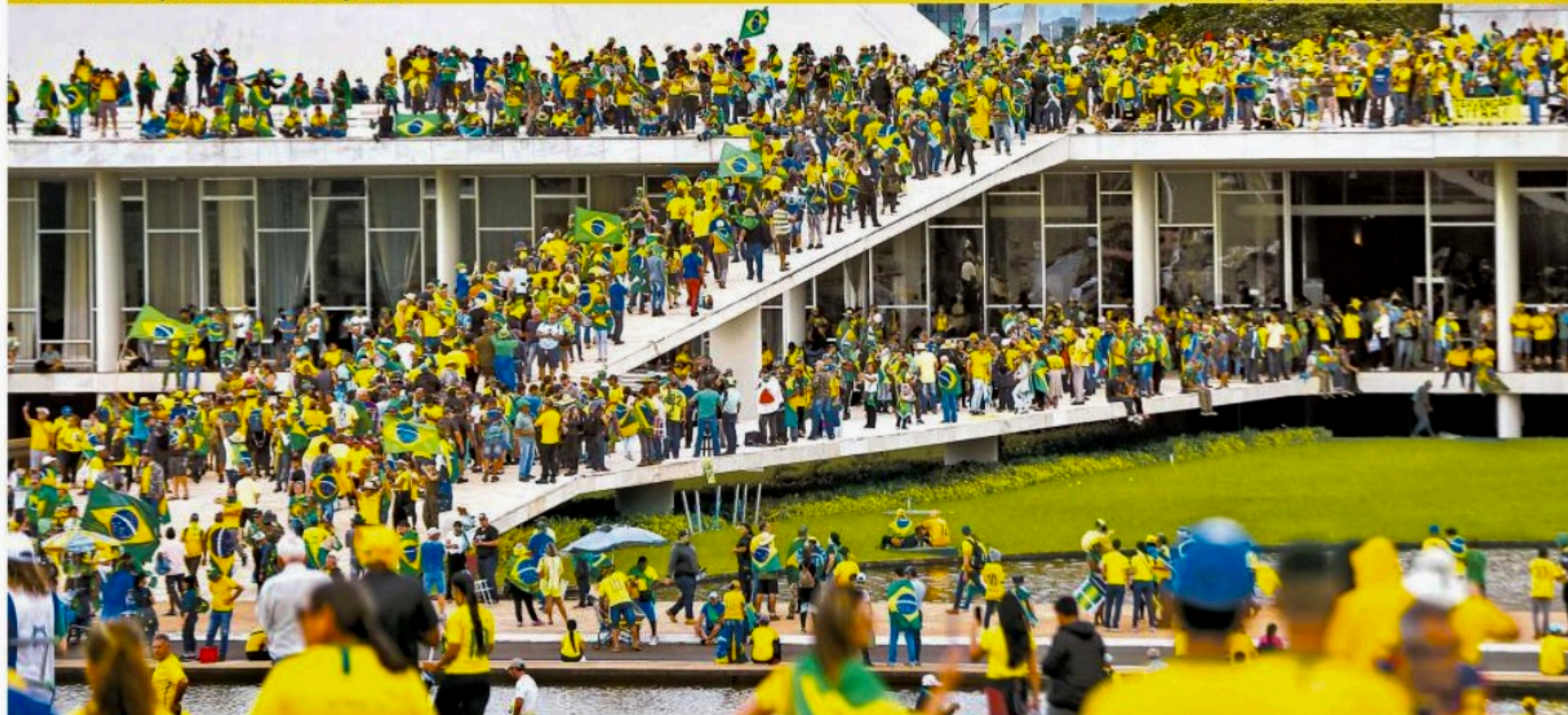
Manifestantes extremistas invadiram e depredaram as sedes dos Três Poderes , em Brasília. Um ataque sem precedentes

Recife, segunda-feira, 9 de janeiro de 2023 Ano XXV n° 7