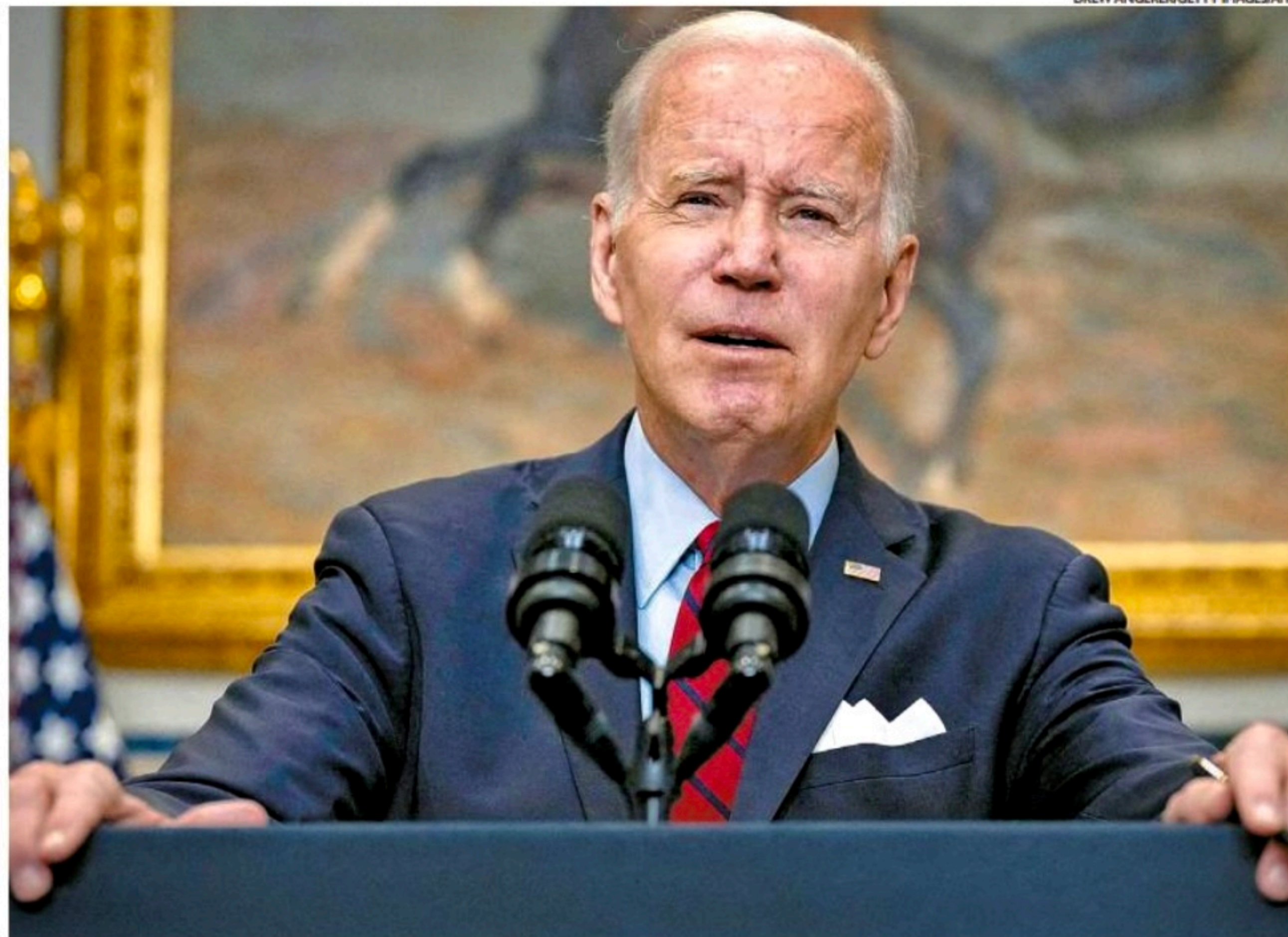
O presidente dos Estados Unidos, Joe Biden , disse que as instituições democráticas do Brasil têm todo o seu apoio

“Como presidente da Celac [Comunidade de Estados Latino-Ame-