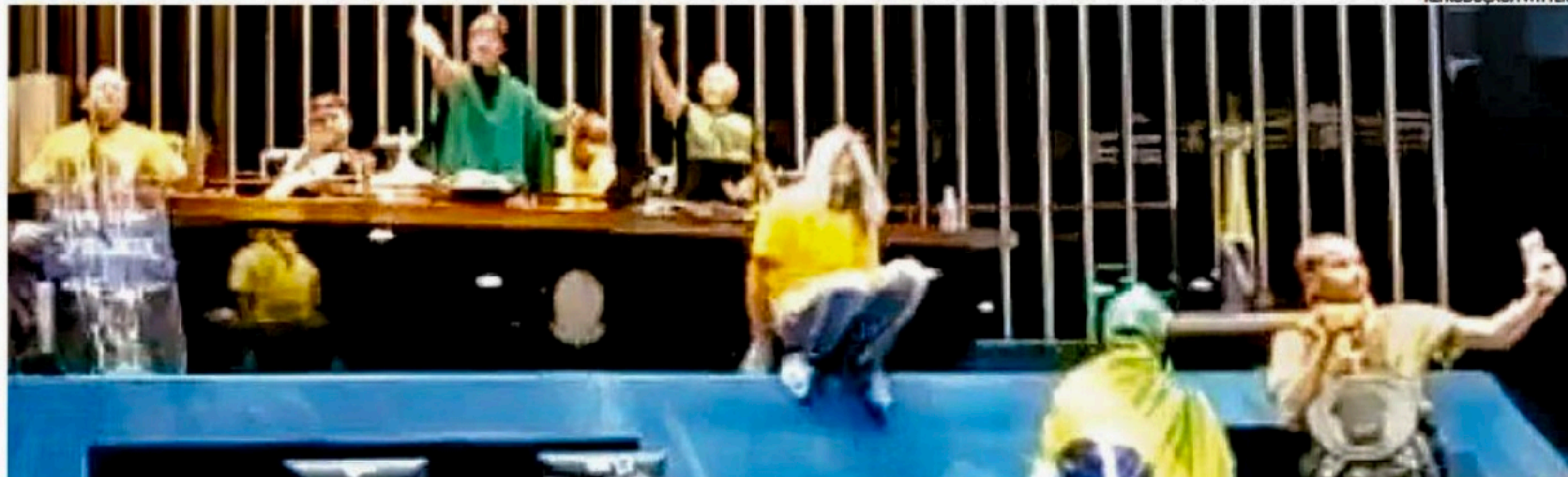
Radicais bolsonaristas tomaram o plenário do Legislativo, vandalizaram e destruíram com pedaços de pau e pedras diversos móveis e objetos da Casa