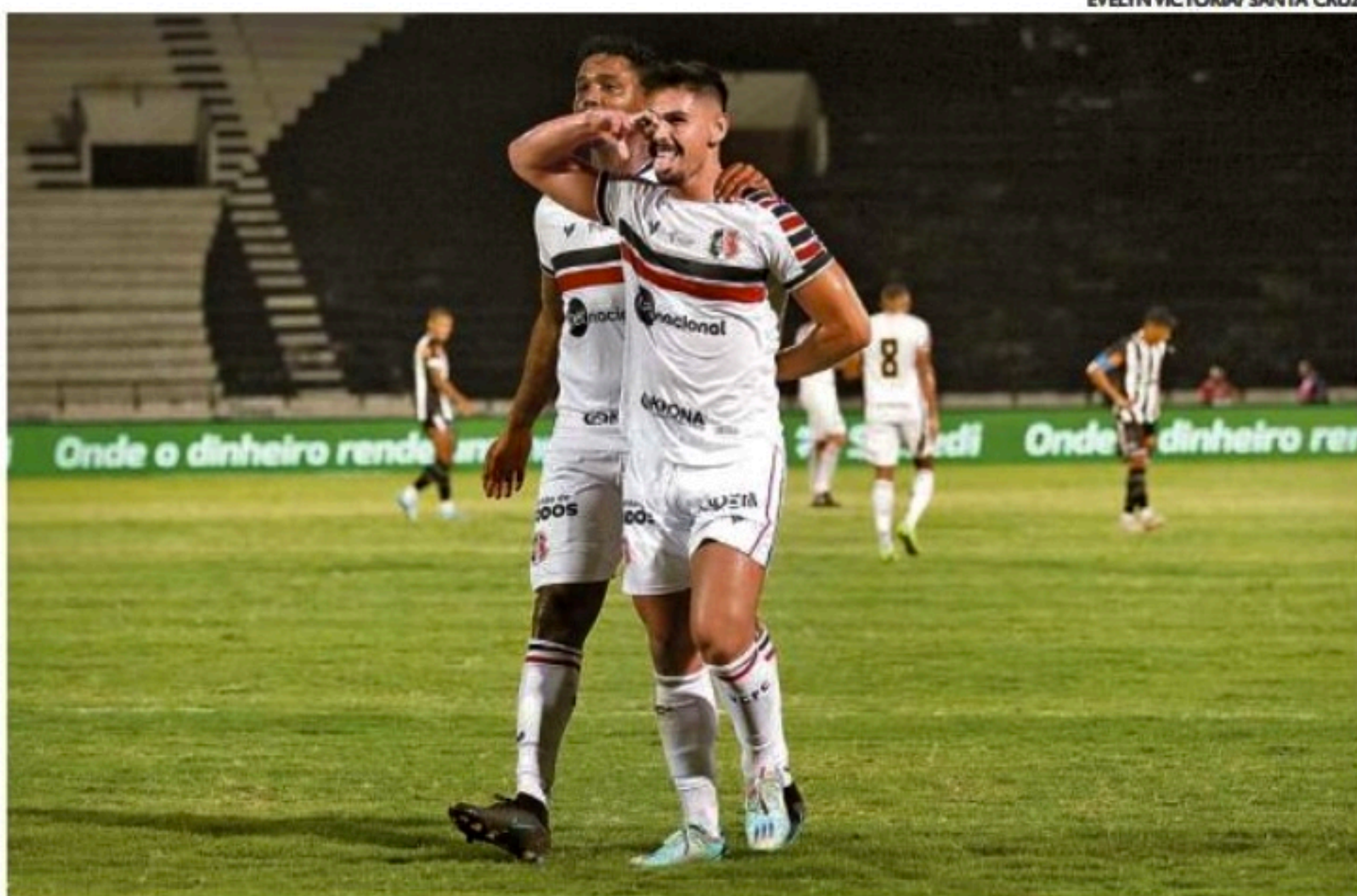
EVELYN VICTORIA/SANTA CRUZ

Como era de se esperar, Santa e Botafogo fizeram um primeiro tempo de muito estudo do adversário, mas também de algumas oportunidades para ambos os lados. Aliás, a etapa inicial ter terminado com um tento para cada lado acabou sendo o placar mais justo no Arruda. Ainda antes dos 15 minutos jogados, cada equipe já havia desperdiçado uma boa chance para abrir o placar.