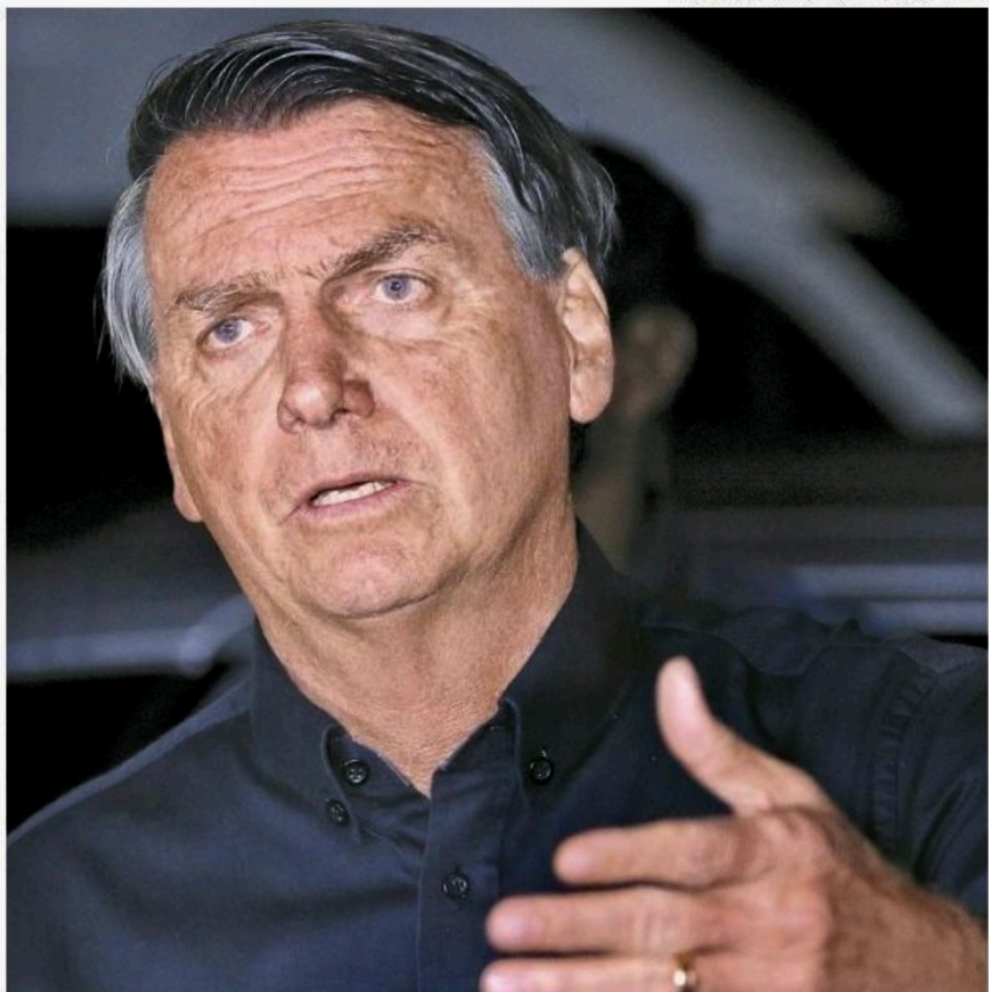
Através do Twitter, ex-presidente disse que sempre andou nas "quatro linhas da Constituição"

O ex-presidente está na Flórida, nos Estados Unidos, desde o fim de dezembro do ano passado e pouco tem dado declarações públicas. Ele vem se mantendo recluso desde a derrota no segundo