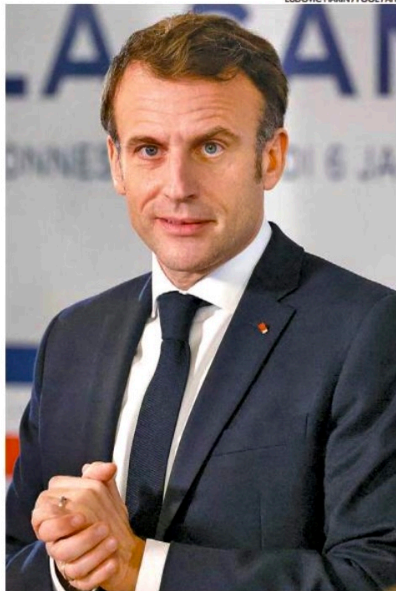
O presidente da França, Emmanuel Macron , condenou as invasões