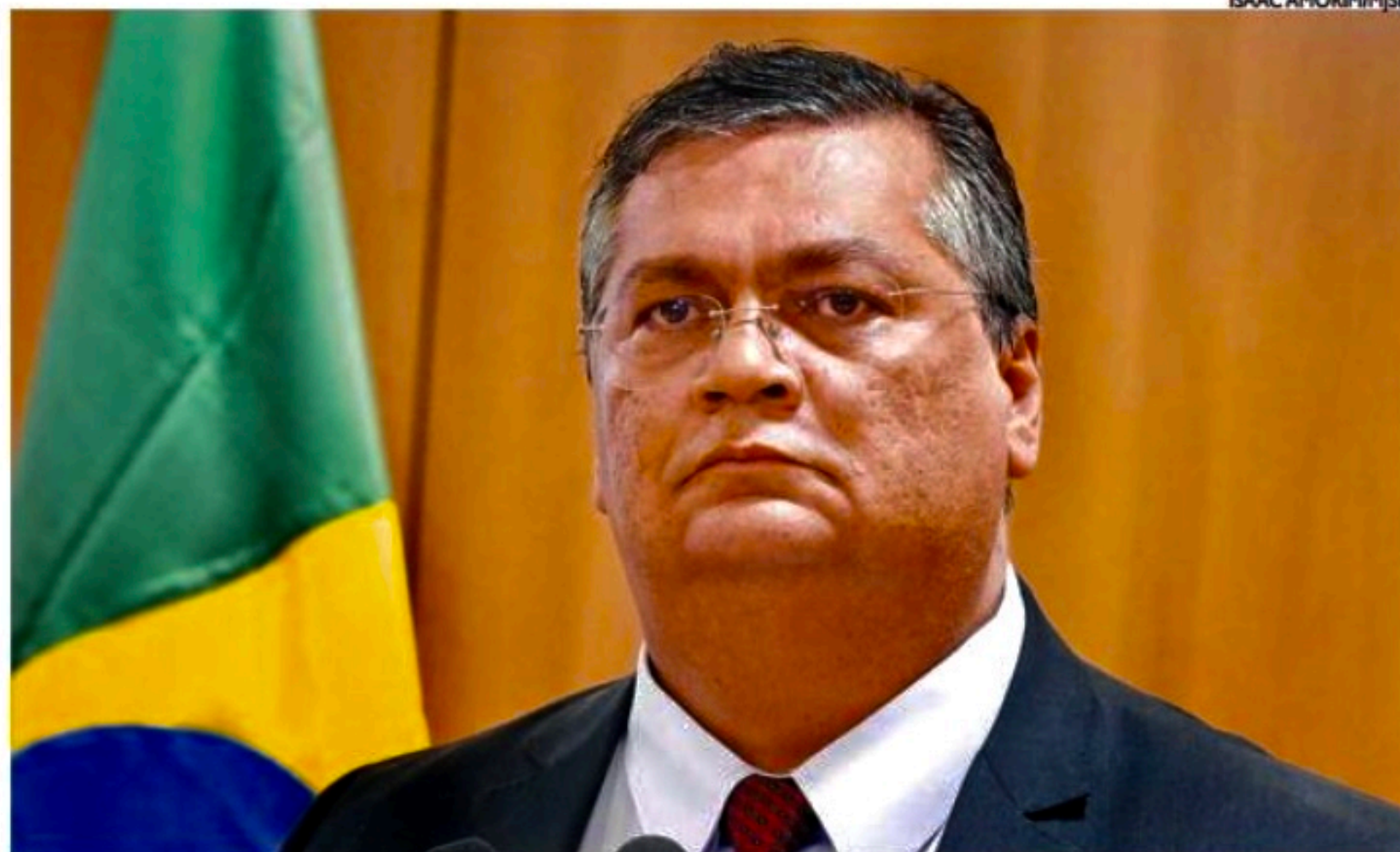
Flávio Dino afirmou que governo já identificou ônibus e que encontrará culpados por financiamento