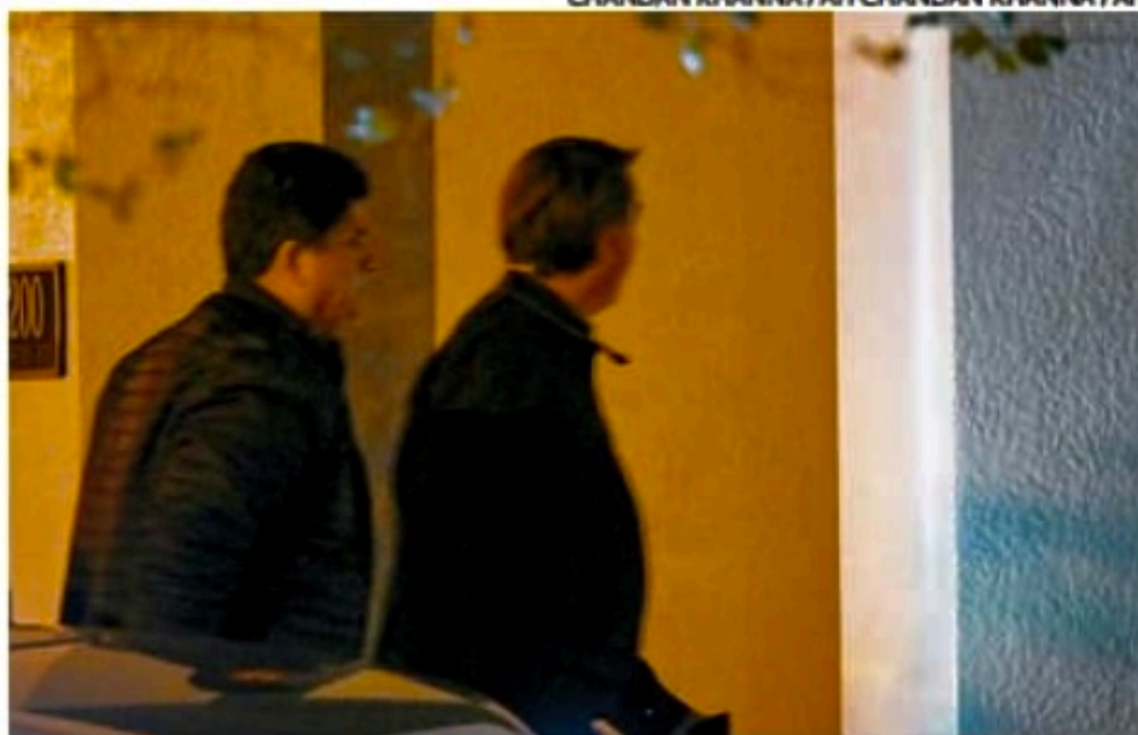
Após hospital, Bolsonaro voltou à casa onde está hospedado, ontem à noite