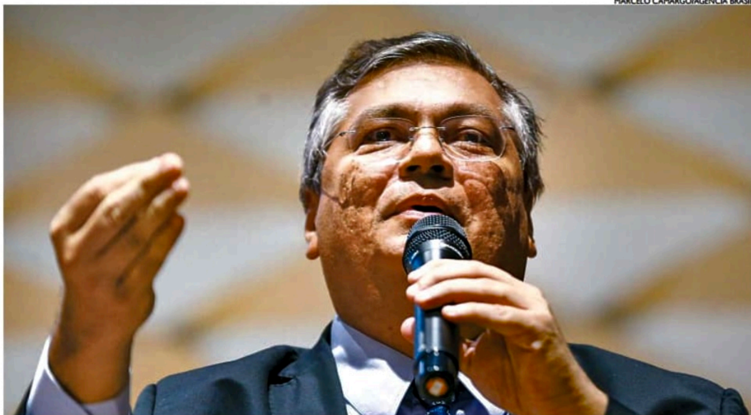
Flávio Dino também afirmou que, entre os financiadores, as pessoas são oriundas, com maior ênfase, das regiões Sul, Sudeste e Centro-Oeste