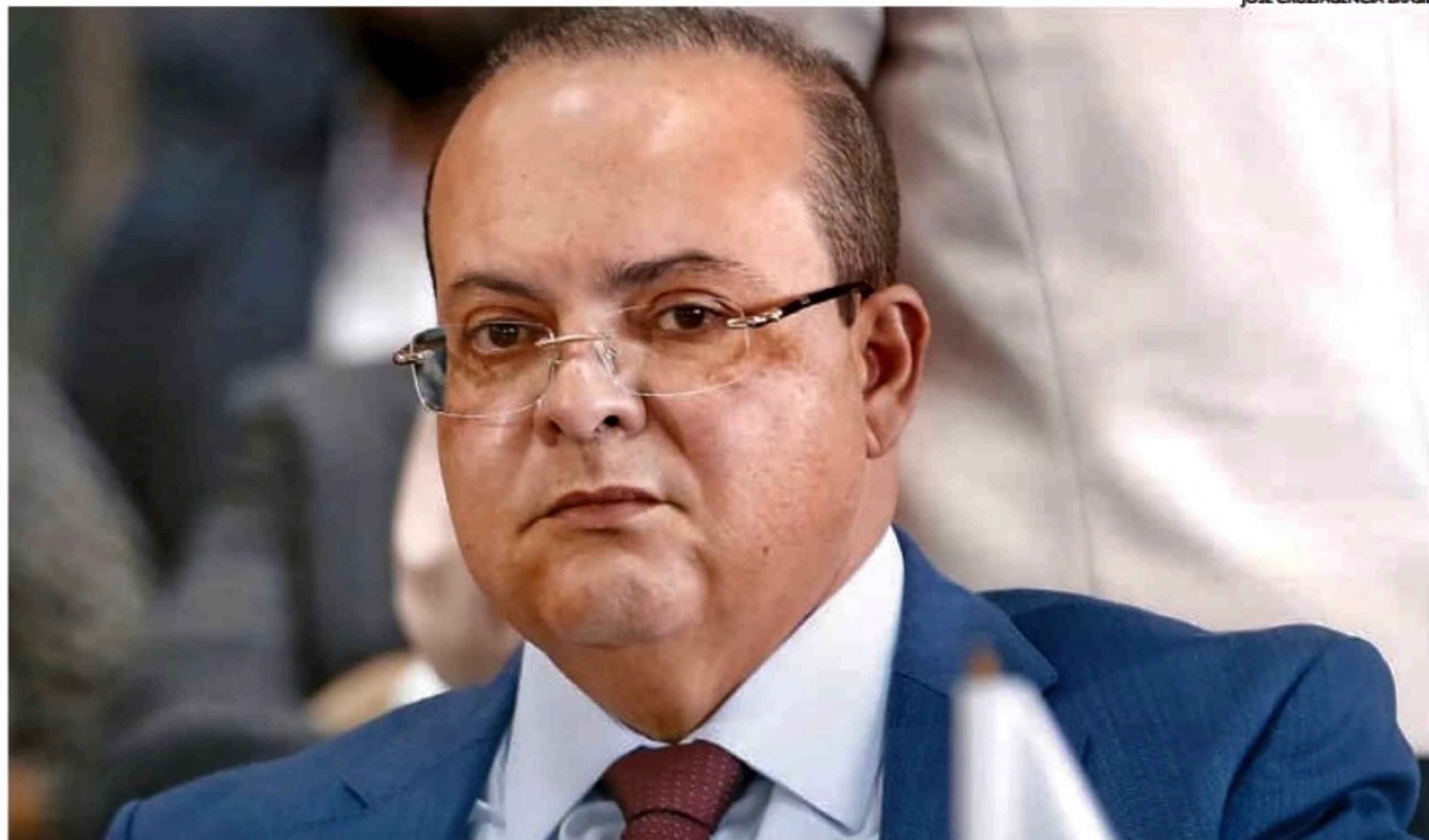
Governador do Distrito Federal, Ibaneis Rocha (MDB), é um dos alvos do pedido do Ministério Público para bloqueio de bens

O objetivo do Ministério Público com o pedido é garantir recursos para eventual ressarcimento público, caso os agentes públicos sejam condenados ao ressarcimento. Caso o tribunal identifique a participação direta ou indireta de agentes públicos nos atos, eles podem ser condenados ao ressarcimento aos cofres públicos, a multa e até à inabilitação para ocupação de cargos públicos por até 8 anos.