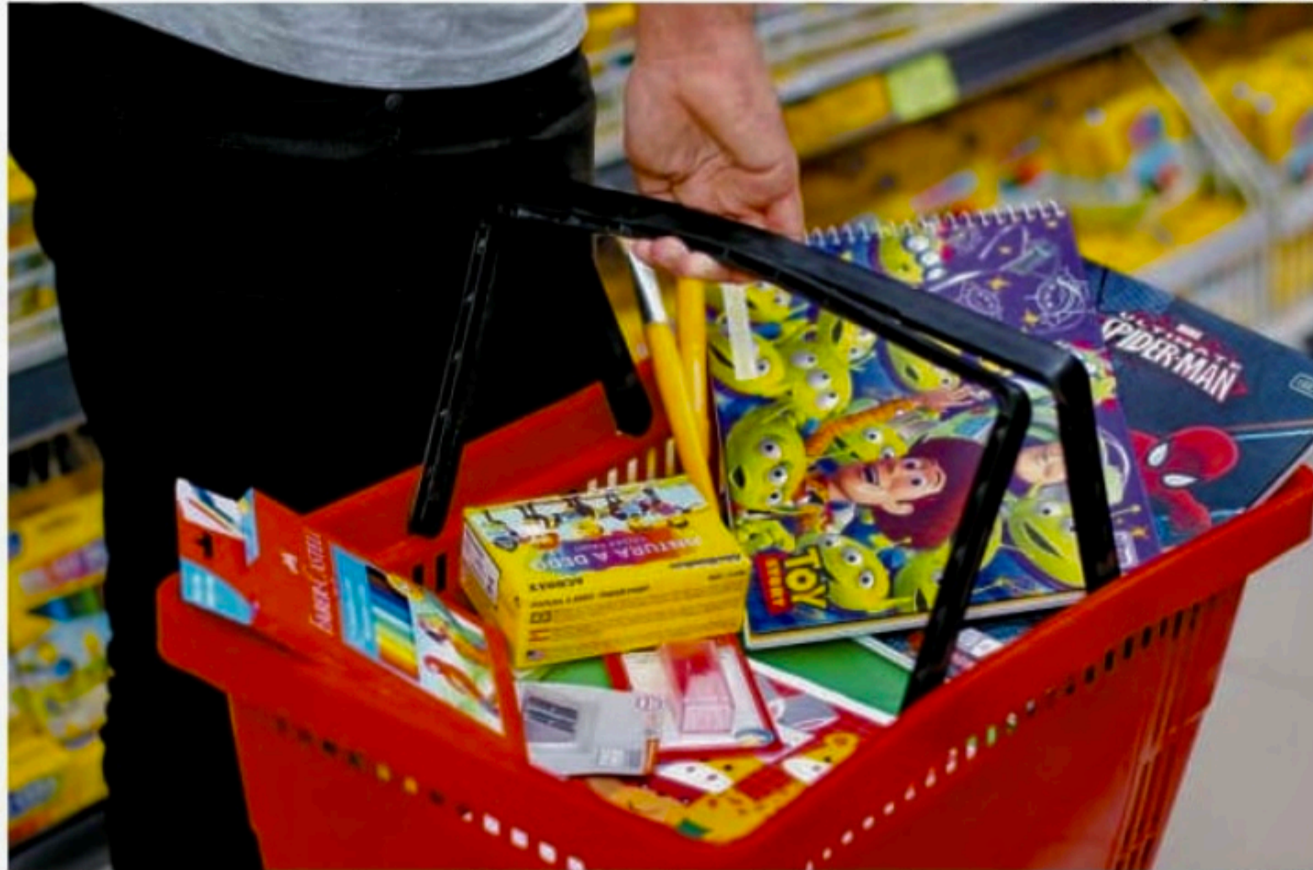
Pesquisa do Procon-PE apontou que diferença entre preços, do ano passado para este ano, chegou a 401,17%