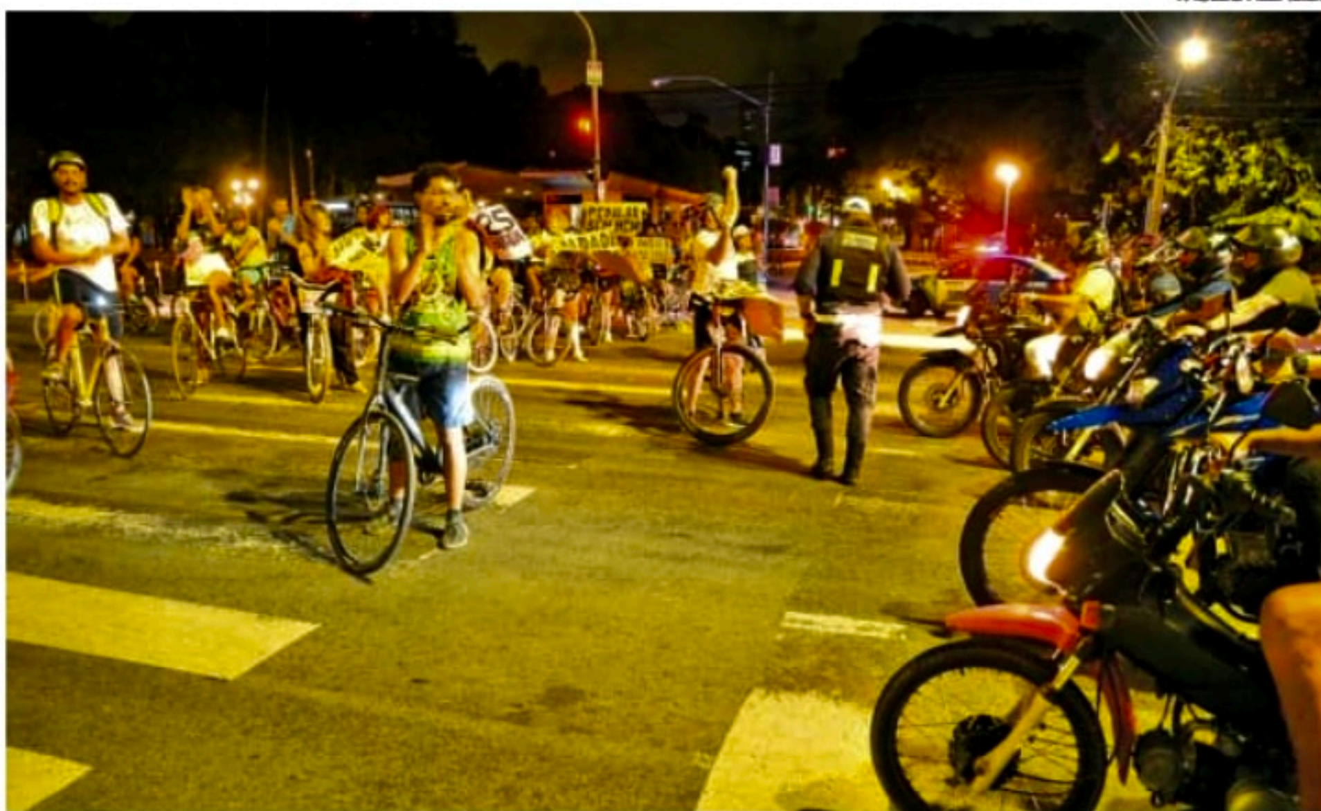
Com cartazes, ciclistas realizam protesto para chamar atenção da população quanto à falta de segurança

"A gente olhou e não tinha ninguém. Ele [o assaltante] devia estar intoxicado em algum lugar. Veio e puxou a minha bolsa, que se arrebenhou na hora e eu não caí. Ele seguiu pela Visconde de Suassuna. Eu consegui sair correndo gritando: 'Ladrão, ladrão'. Só que ele conseguiu chegar no sinal e dobrou para a Cruz Cabugá. Onde ele passou, tinha câmeras da SDS. Mas eu não consegui acessar as imagens", conta a ciclista, que registrou boletim de