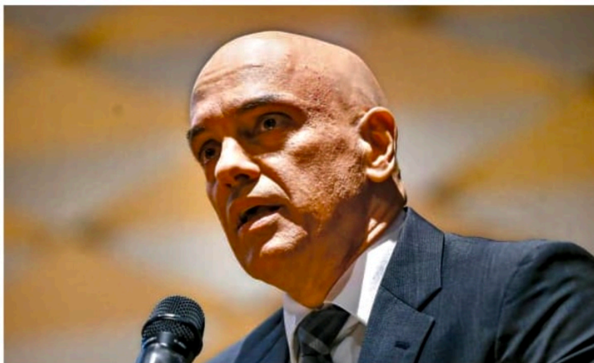
Para ministro, comportamento dos dois coloca em risco a vida de Lula, parlamentares e magistrados

Foi com base nesses argumentos que o ministro decretou a prisão preventiva de Torres e Vieira. As prisões foram solicitadas pelo diretor-geral da PF Andrei Rodrigues, escolhido pelo governo Lula para comandar a corporação.