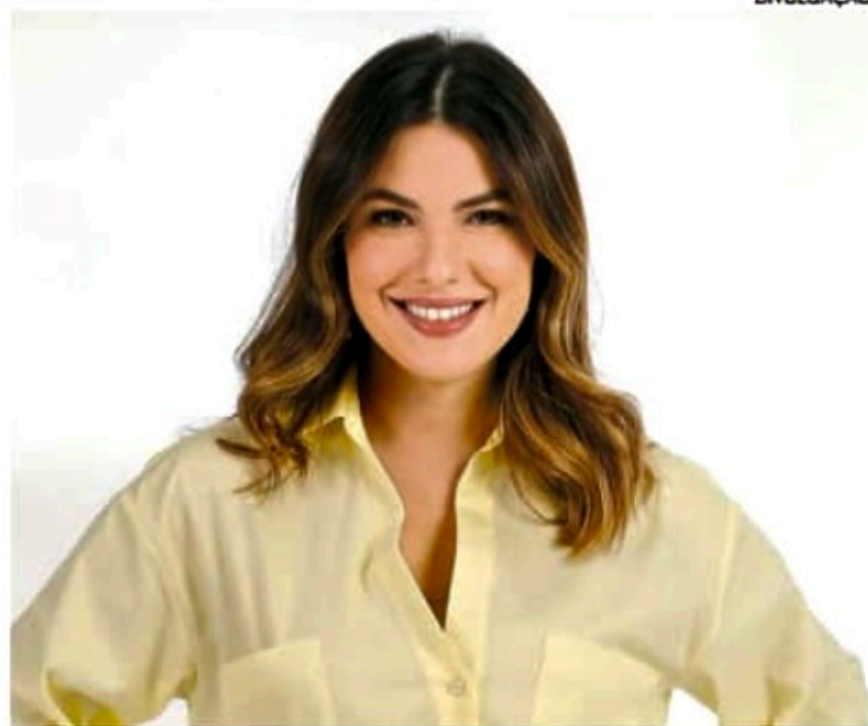
Aos 32 anos, artista trabalha no projeto infantojuvenil há cinco

O momento trágico da trama acaba aproximando Luísa e Otto, de Dalton Vigh. O casal, que ainda não é oficial no enredo, conta com uma