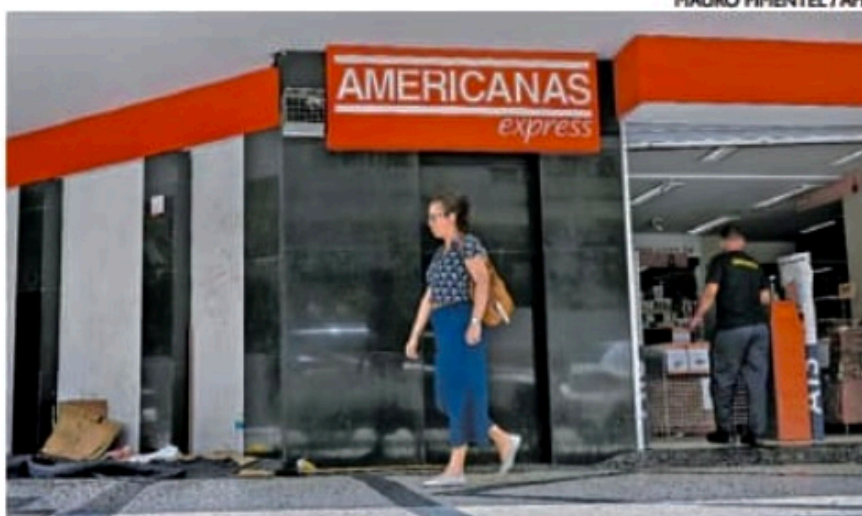
No mercado financeiro, ações da empresa tiveram queda de 38,41%

Nas redes sociais, a companhia informou que segue aberta e pronta para as compras e entregas, em lojas, site e aplicativo. Para o patrocínio no BBB23, a Americanas