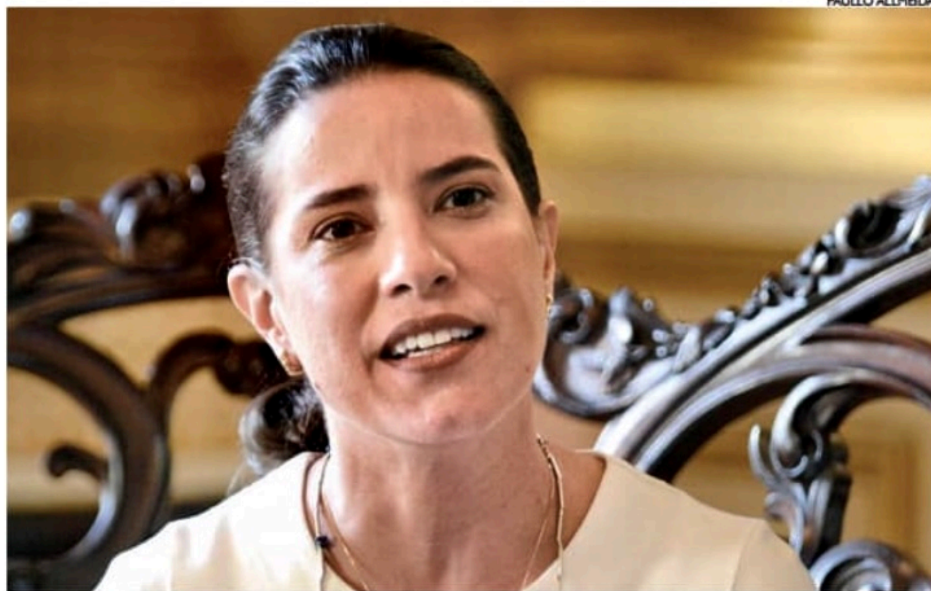
Apesar do novo subsídio, Raquel Lyra optou por receber os vencimentos de seu órgão de origem

Apesar da decisão, a proposta de reforma administrativa encaminhada pela governadora à própria Alepe já previa a remuneração do seu secretariado com base nos novos valores, ou seja, R$ 18 mil. Ou seja, embora Raquel não quisesse se comprometer com a sanção do reajuste - sob a justificativa de que teria sido uma iniciativa do Legislativo e no Executivo -, ela já contava com essa remuneração na hora de convocar os nomes para compor o seu primeiro escalão.