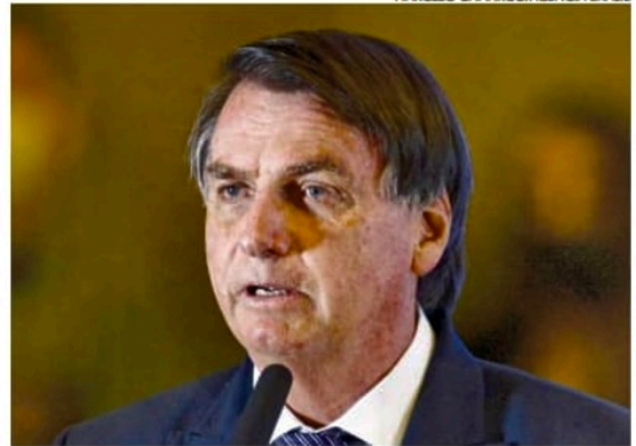
Para ministro, Bolsonaro tentou usar cargo para manipular eleições

dores deve ser analisada como elemento da campanha eleitoral de 2022, dotado de gravidade suficiente para afetar a normalidade e a legitimidade das eleições e, assim, configurar abuso de poder político e uso indevido dos meios de comunicação", completou o magistrado.