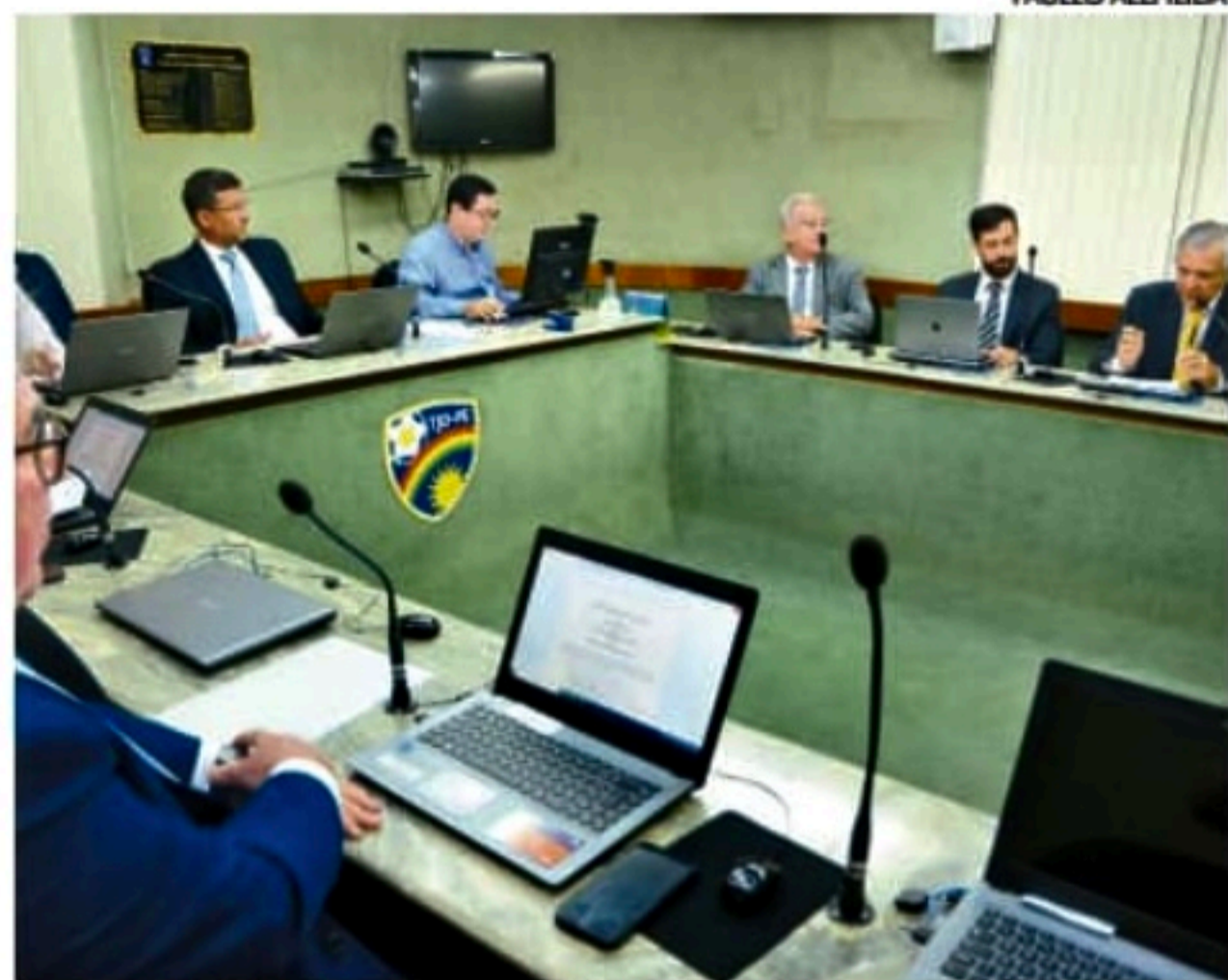
Sessão de julgamento foi realizada na noite de ontem, no TJD-PE

Em julgamento realizado na noite de ontem, o Tribunal de Justiça Desportiva de Pernambuco (TJD-PE), manteve, de forma unânime, o resultado da partida entre Central e Náutico, disputado no último dia 7, no Lacerdão, em Caruaru, no Agreste do Estado. O clube da capital pedia a impugnação do jogo alegando um possível erro de direito no duelo válido pela estreia do Campeonato Pernambucano.