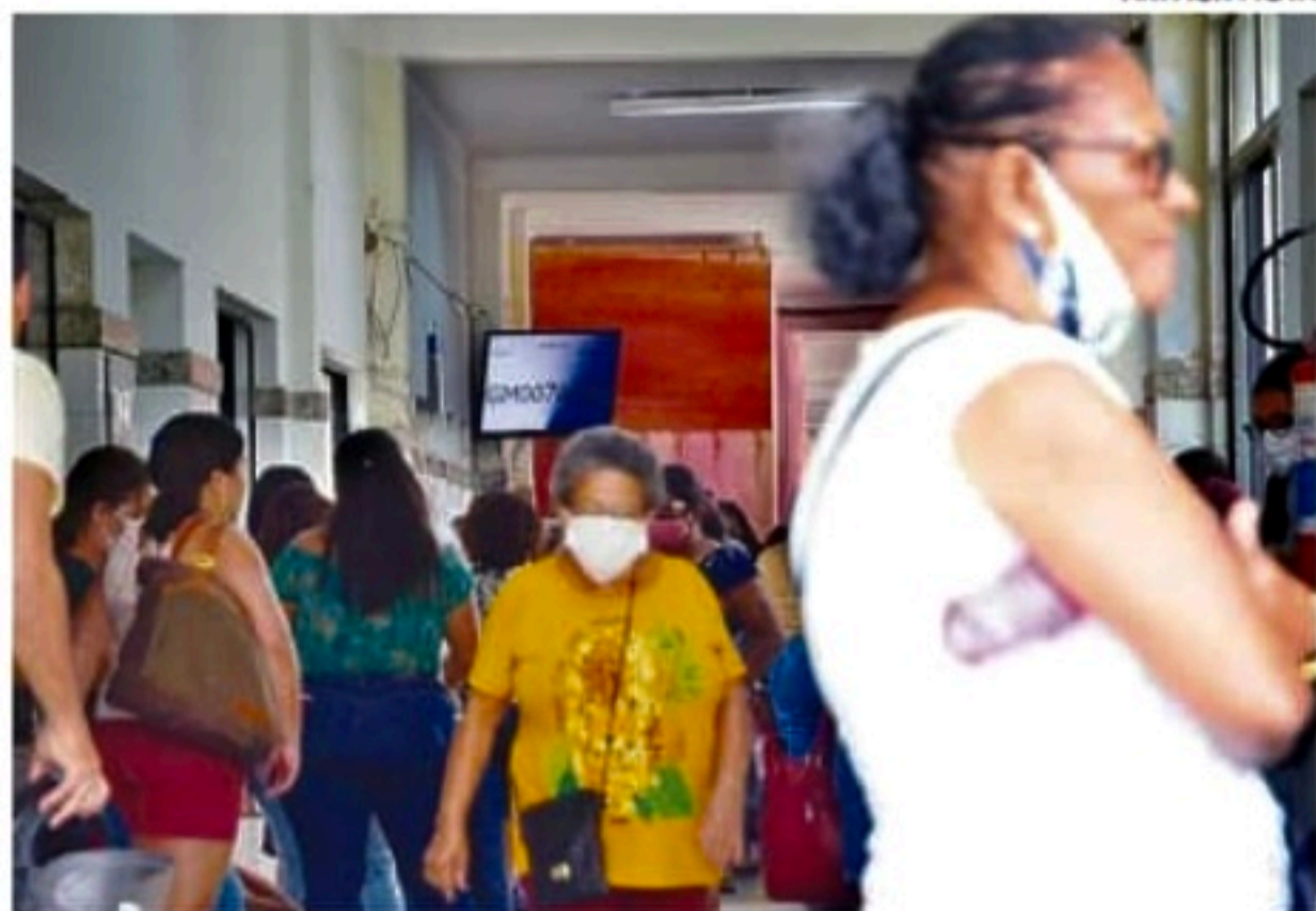
Pacientes enfrentaram filas e falta de vagas para agendamento

A semana começou com muita dificuldade para quem precisa marcar consultas e exames no Hospital Barão de Lucena, no Recife. Na manhã de ontem, pacientes reclamavam das filas e falta de vagas para agendamento. A reportagem esteve no local mas não foi autorizada a permanecer nas dependências do hospital. Do lado de fora, a população relatava a situação caótica que se instalou.