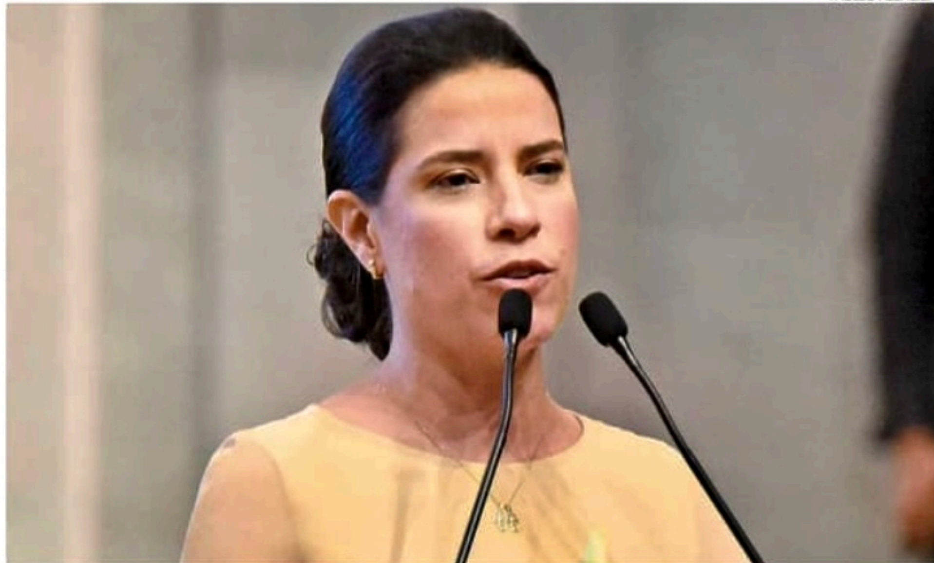
Em campanha, Raquel Lyra assegurou que FEEF, cuja validade iria até 2022, não seria prorrogado

Já o Centro das Indústrias de Pernambuco (Ciepe) e a Federação das Indústrias do Estado de Pernambuco (Fiepe) sugerem ampliar o FEEF por um ano. "As entidades industriais de Pernambuco se posicionam contra os aumentos de impostos e a prorrogação do Fundo. Contudo, diante do caso de emergência exposto pela equipe econômica do governo, a FIEPE e o CIEPE compreendem as justificativas para uma prorrogação pelo prazo máximo de um ano", afirmaram as entidades em nota.