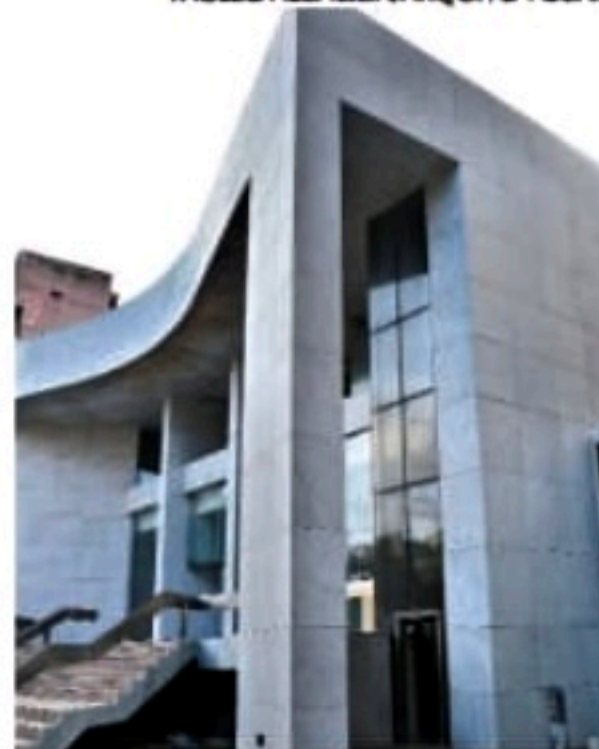
Alepe se reúne na tarde desta terça para votar o projeto de lei

teto das gratificações passa de R$ 2,1 mil para R$ 3 mil.