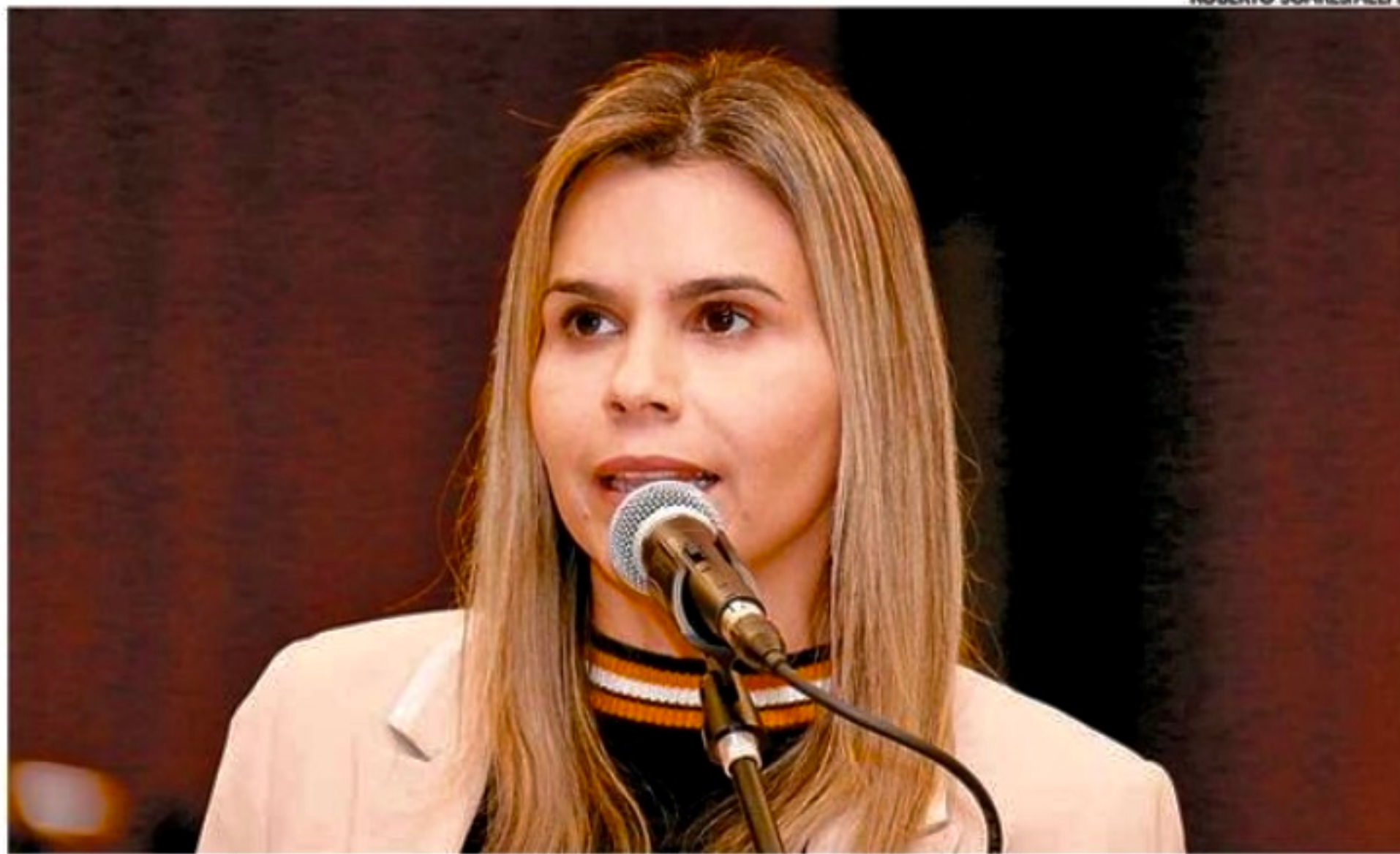
Condenação também prevê multa de R$ 10 mil. Mas a parlamentar ainda pode recorrer da sentença

■ Processo foi movido por um casal trans de Montes Claros, Minas Gerais, após a hoje deputada federal eleita postar uma mensagem preconceituosa