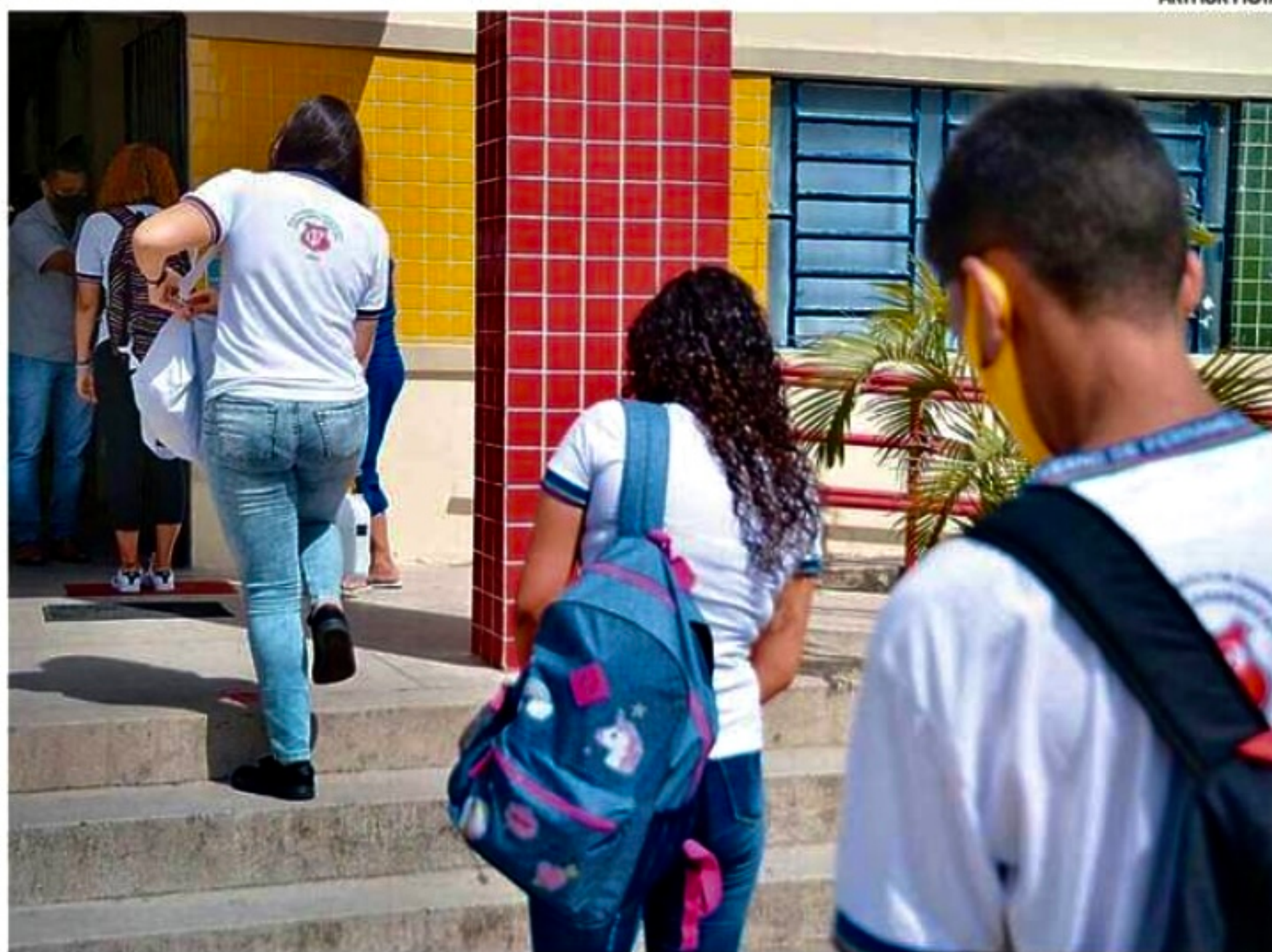
De pouco mais de 20 mil cadastros recebidos, somente 10.359 vagas foram efetivadas entre 2 e 13 de janeiro

Agora, os interessados têm até o dia 22 de janeiro para realizar a inscrição no site www.matricularapida.pe.gov.br . No endereço eletrônico, é necessário preencher nome completo; data de nascimento; escola de origem; escola que pretende estudar, com série e turno; e-mail; nome do responsá-