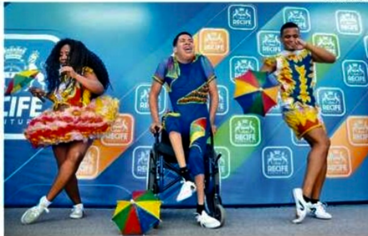
Passistas de frevo se apresentaram ontem em coletiva de imprensa do Baile