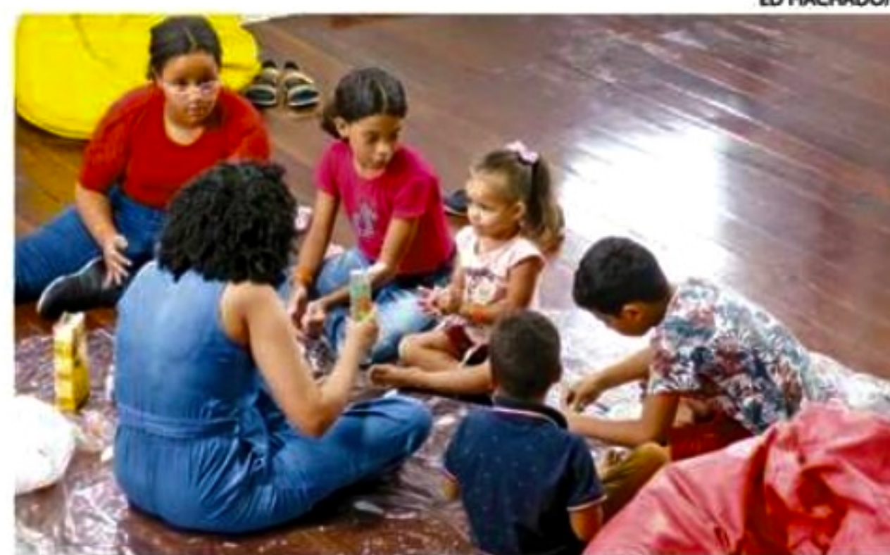
Visitantes fizeram oficina de gastronomia e contação de história

“A [oficina] de jogos, por exemplo, tem muitos adultos participando. É interessante, porque a gente consegue ocupar tanto a criança quanto o responsável”, disse. Além de toda a diversão, algumas oficinas também têm o