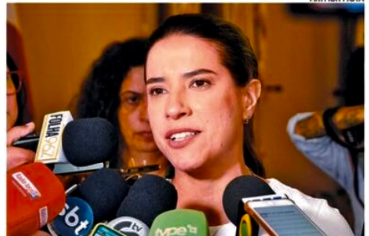
Projeto apresentado pela governadora foi aprovado ontem