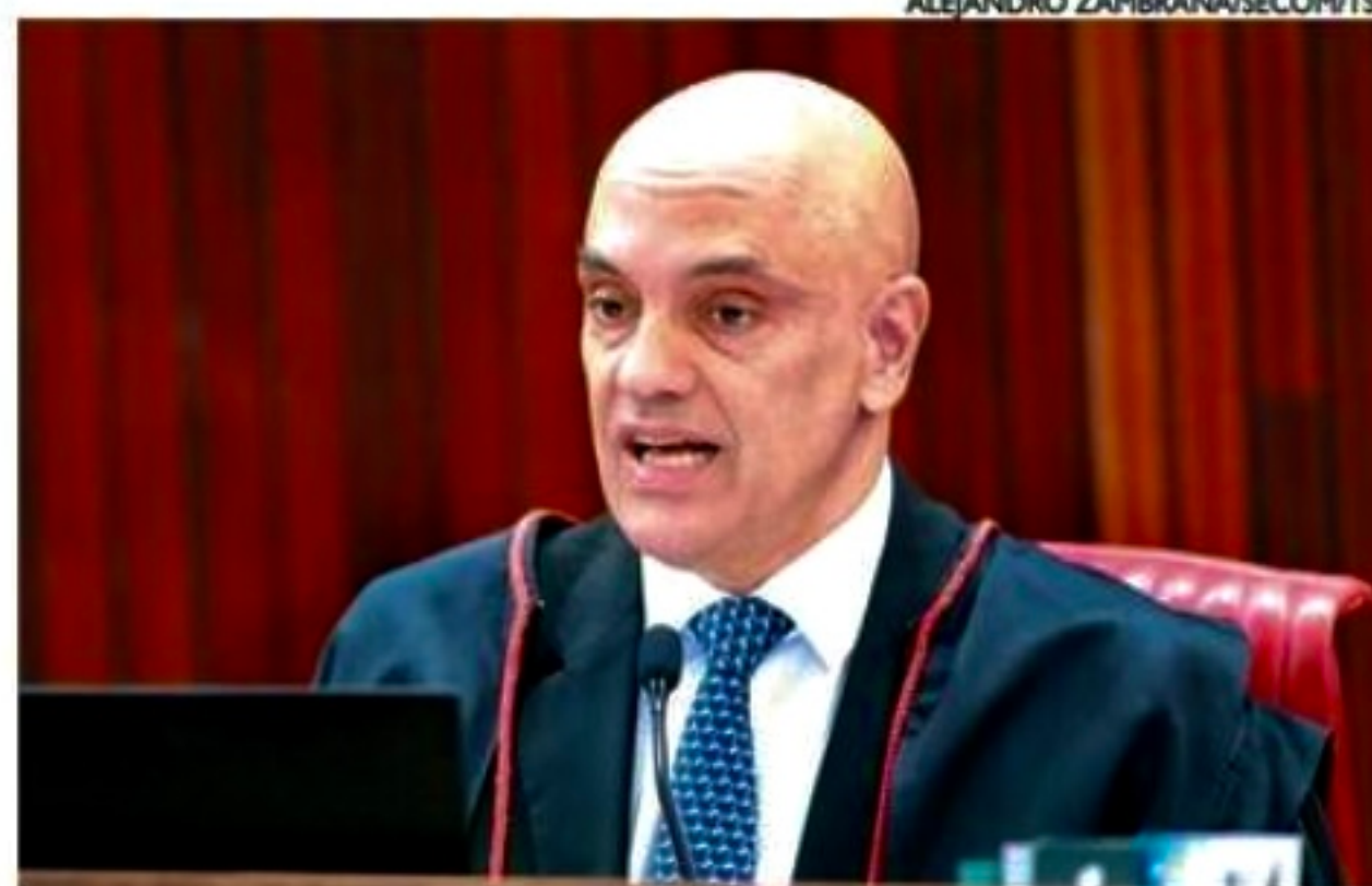
Moraes tem decidido sozinho sobre soltura ou não dos envolvidos

Em todos os casos, portes de arma de qualquer tipo ficam suspensos, bem como qualquer autorização de compra de armas por colecionadores ou caçadores. Os envolvidos também ficam proibidos de conversarem entre si e de utilizar