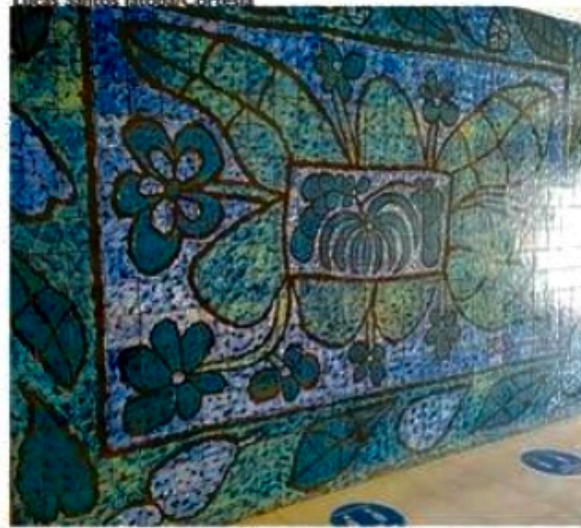
Mural está no hall social da sede do DER-PB

dos anos, em sentido contrário ao de vários monumentos de Brennand no Recife, necessitados de manutenção pelos órgãos públicos, além de carentes do zelo e respeito da população pelo seu patrimônio artístico e cultural, por se tratar de equipamentos de muita representatividade do seu meio e, enfim, em