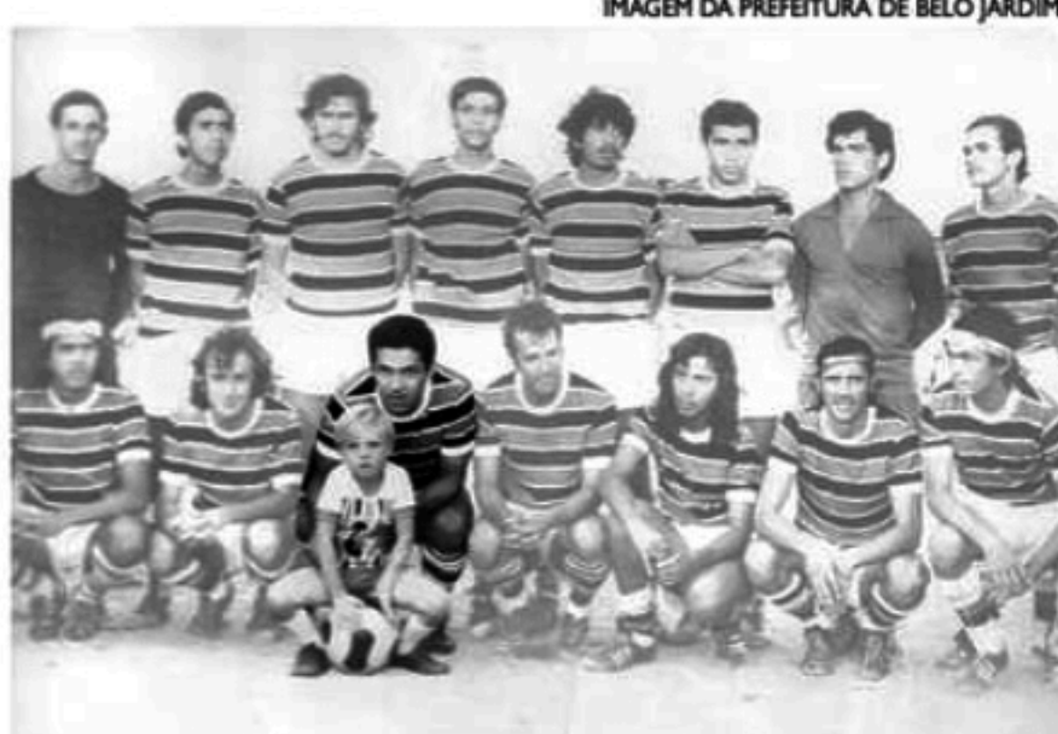
Pela Seleção Brasileira, Garrincha foi bicampeão mundial

■ Quatro décadas sem o Anjo das Pernas Tortas: relação do jogador com Pernambuco vai além do futebol