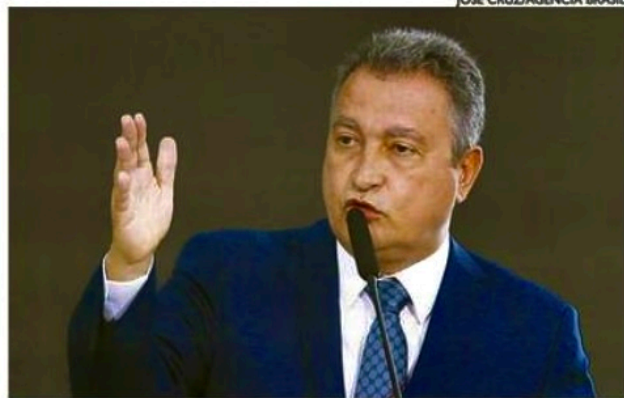
Substituições foram oficializadas em despacho do ministro Rui Costa