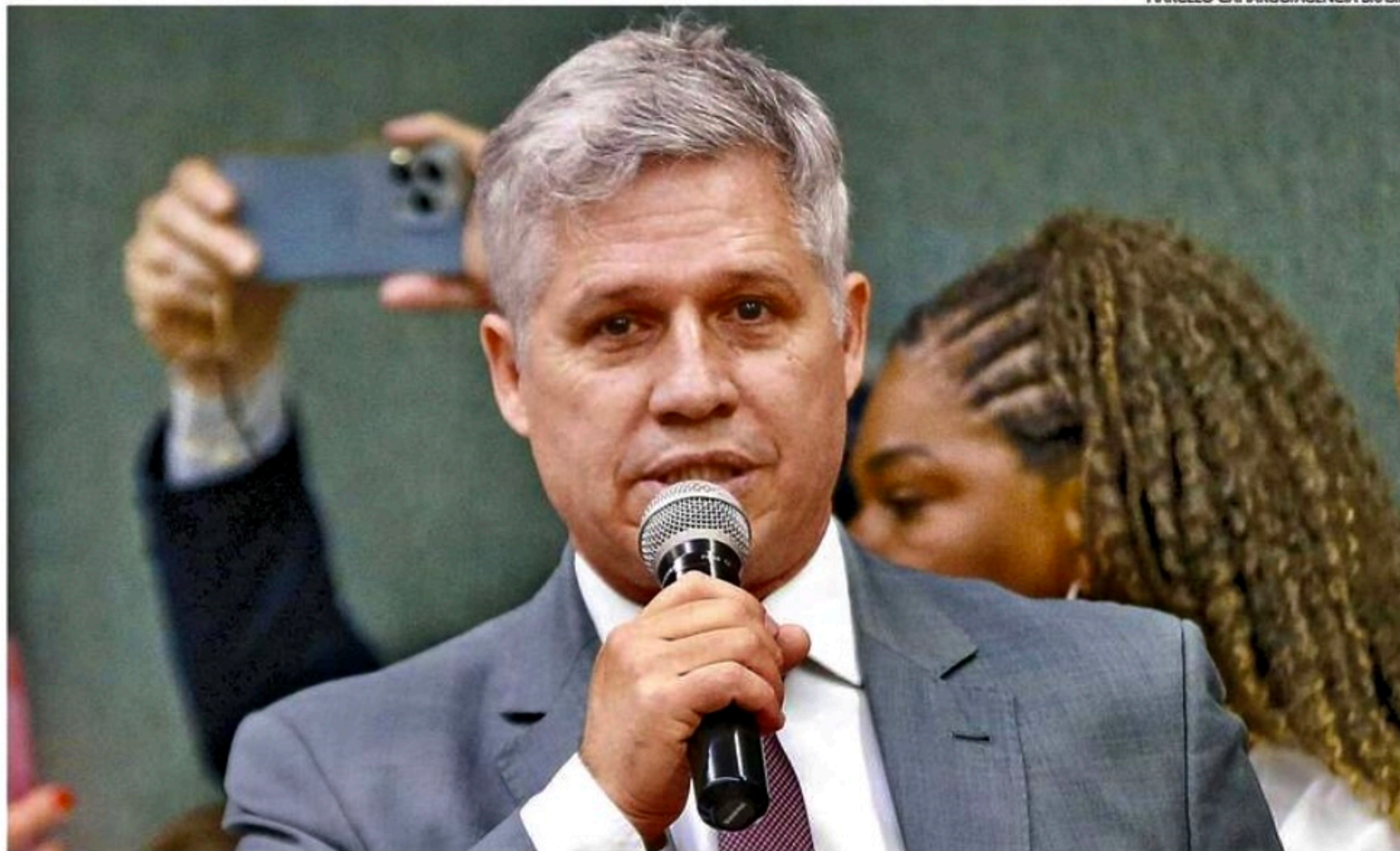
Paulo Teixeira afirmou que os atos golpistas começaram, de fato, em 2020, quando Bolsonaro "estabeleceu uma guerra com o Supremo"

Para o ministro, os atos golpistas começaram, na verdade, em 2020, quando Bolsonaro "estabeleceu