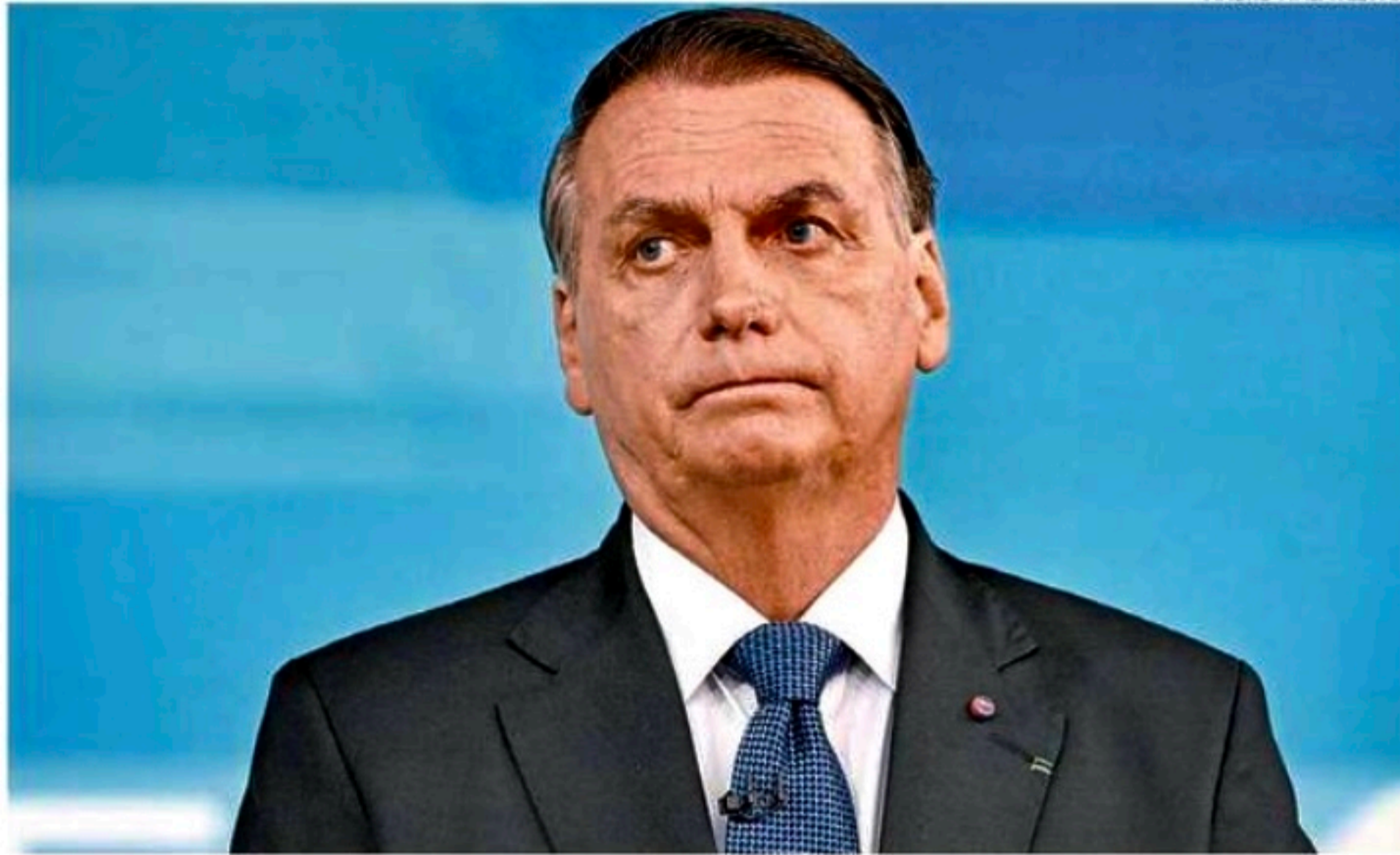
Atos de campanha de Bolsonaro no Palácio do Planalto e no Palácio do Alvorada foram questionados

Mais uma ação de investigação judicial eleitoral (Aije) contra o ex-presidente Jair Bolsonaro (PL) foi admitida, ontem, pelo ministro do Tribunal Superior Eleitoral (TSE) e corregedor-geral da Justiça Eleitoral, Benedito Gonçalves. O procedimento aberto apura eventual abuso de poder político e econômico e pode levar Bolsonaro à inelegibilidade.