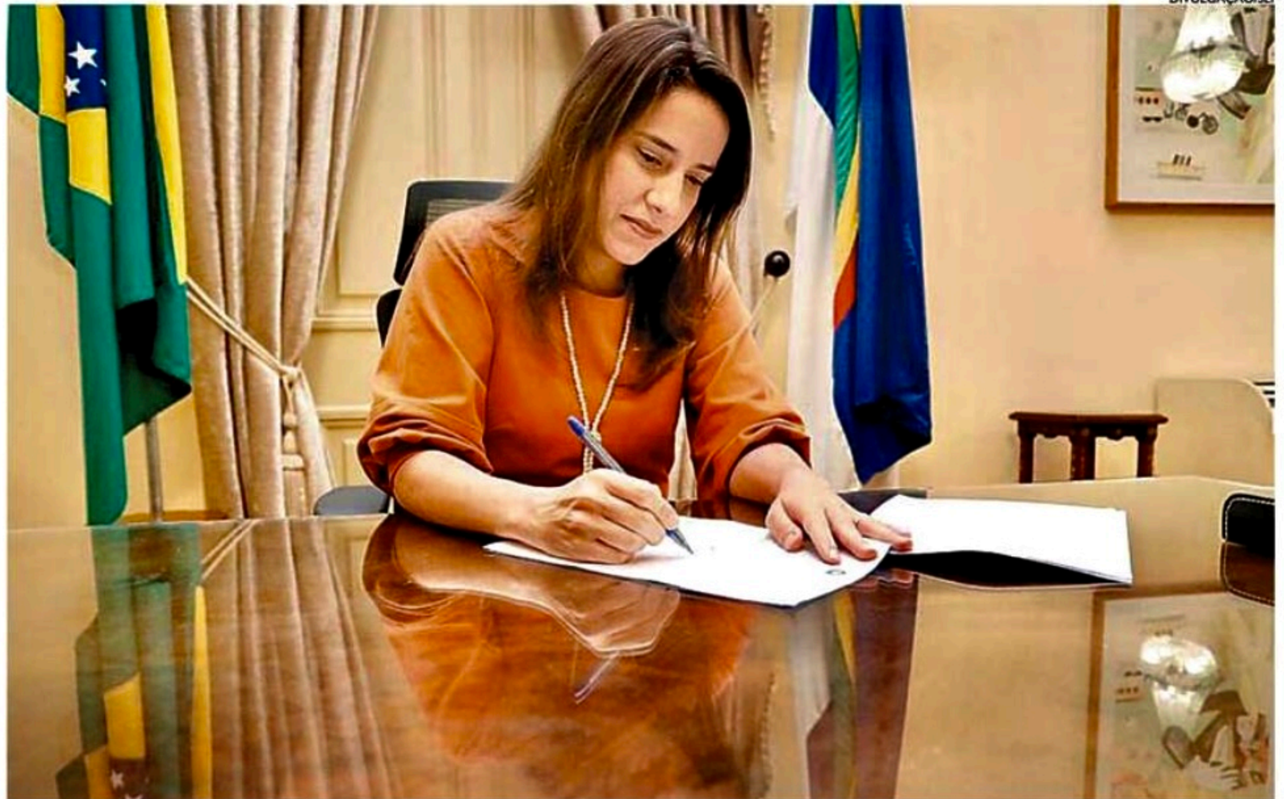
Vários setores afetados pelo FEEF criticam decisão de prorrogá-lo tomada pelo governo Raquel Lyra. Empresários temem carga excessiva

Manzi conta que além de ser um dificultador para atrair novos em-