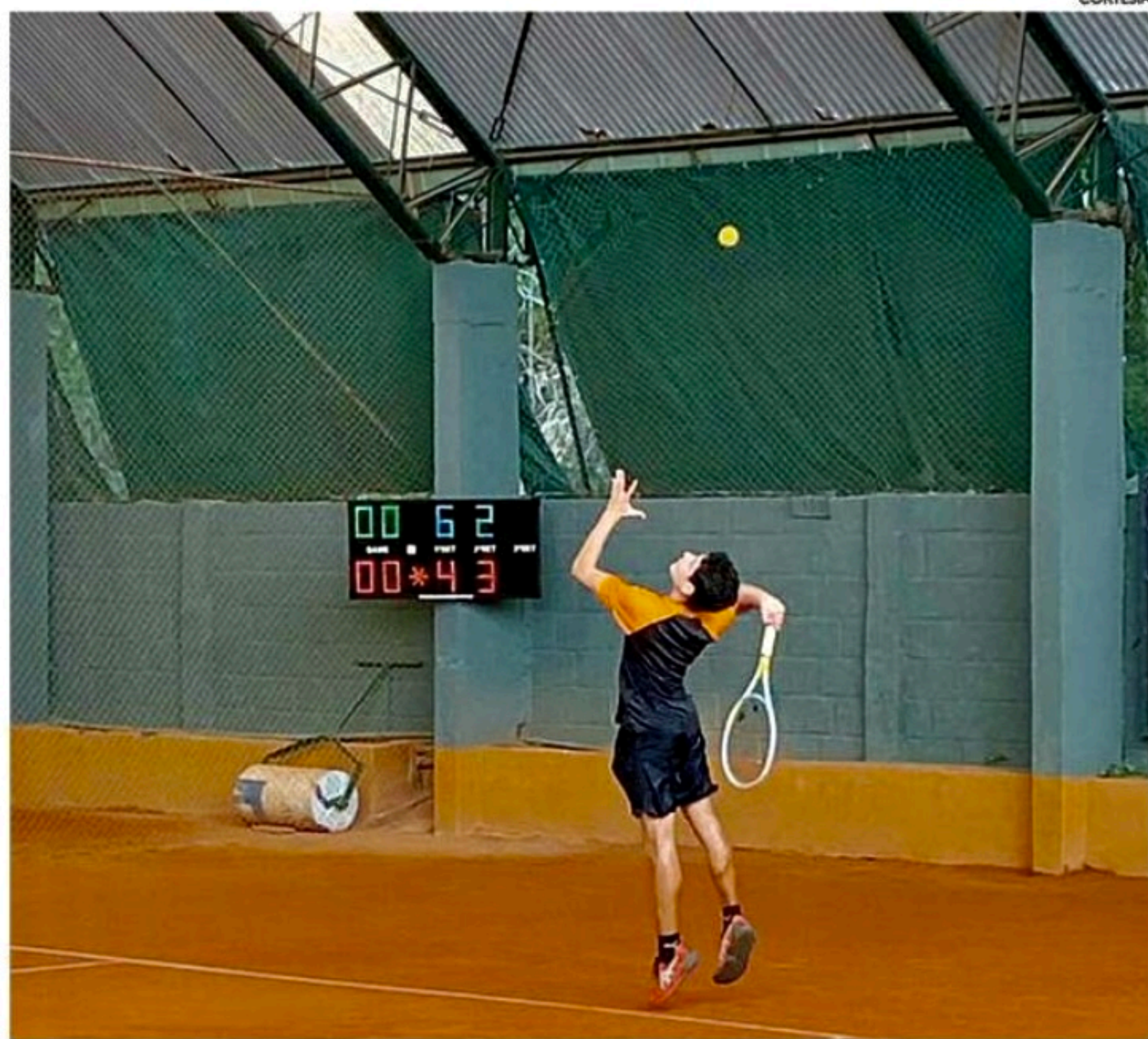
Competição é celeiro de talentos e ponto de integração entre jovens tenistas de todo o Brasil

Um dos mais tradicionais do Brasil, torneio que é porta de entrada para Campeonato Brasileiro vai até amanhã no Recife