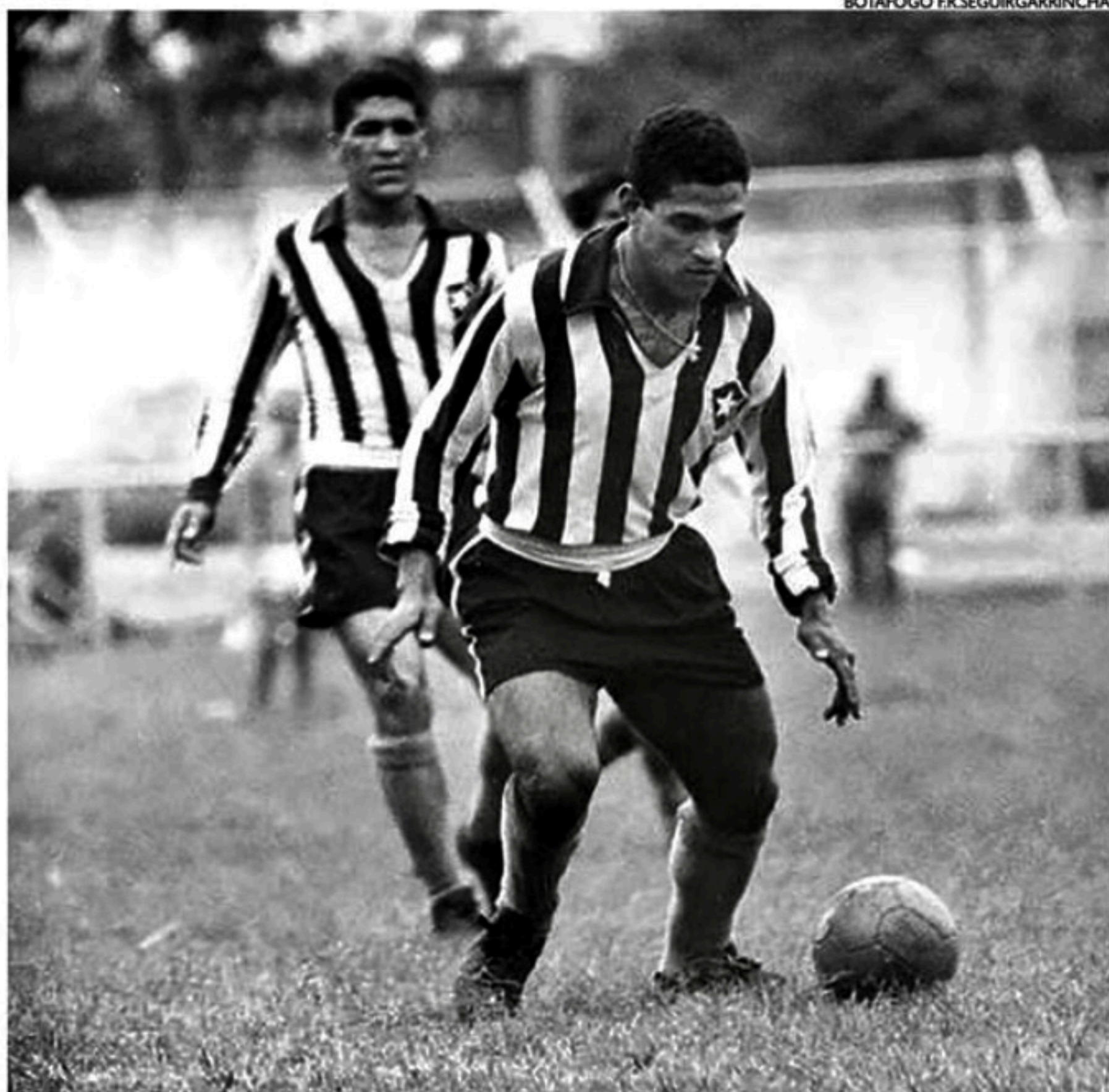
Com a camisa do Botafogo, Garrincha enfrentou por diversas vezes Santa Cruz, Náutico e Sport

Já aposentado oficialmente dos gramados, Garrincha fez alguns jo-