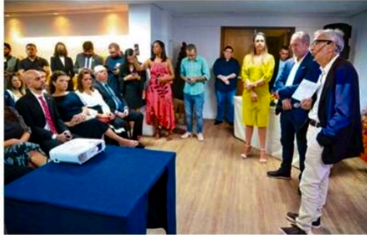
Evento reuniu personalidades de diversos segmentos do Estado