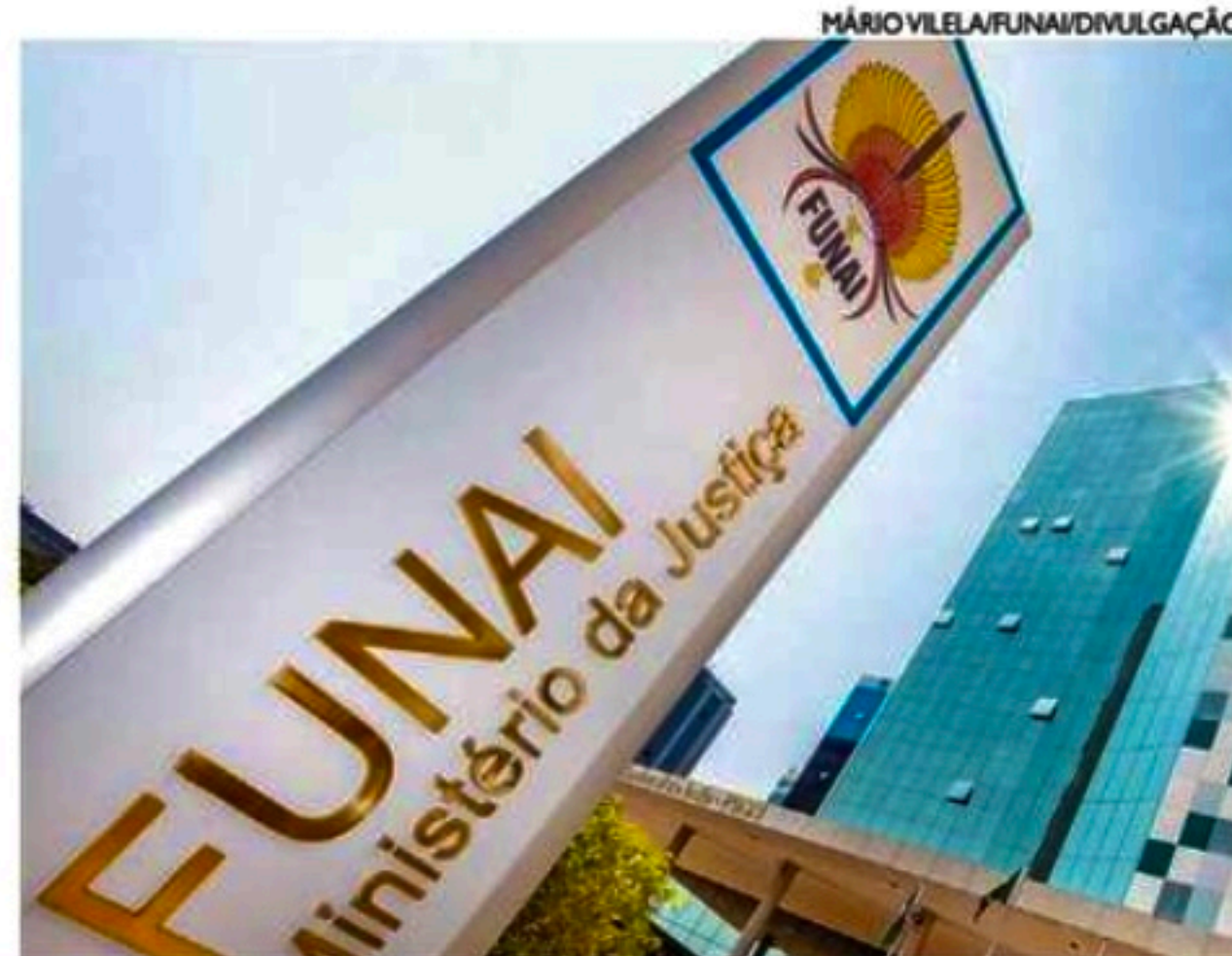
Governo exonerou 43 servidores da Funai e 11 do Ministério da Saúde