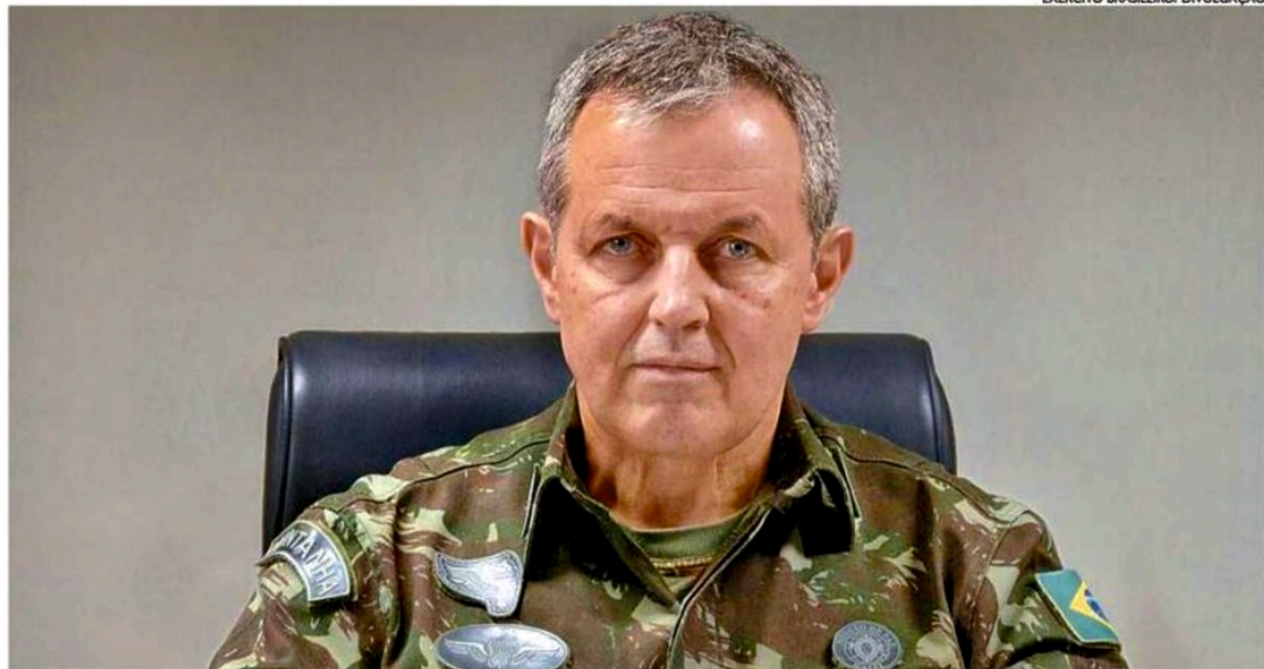
Comandante Ribeiro Paiva tirou do caminho um nome que causava mal-estar no Planalto: o tenente Cid, ex-ajudante de ordens de Bolsonaro

Na reunião com o general Tomás, de acordo com relatos de militares, o comandante teria convencido Cid, alvo de investigação no Supremo Tribunal Federal (STF), que o contexto político não era favorável e, portanto, um afastamento seria uma melhor saída tanto para o próprio tenente-coronel quanto para o Exército neste momento de crise.