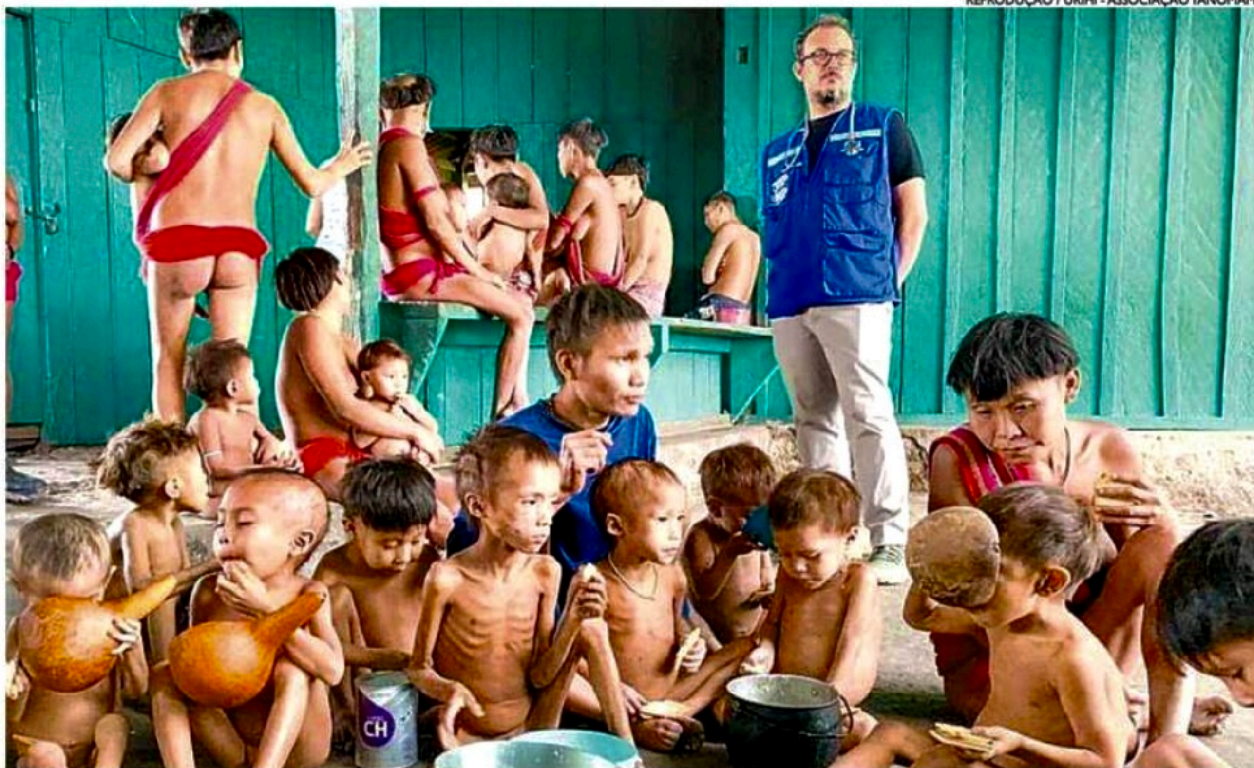
A situação do povo Yanomami levou a gestão do presidente Lula a tomar medidas urgentes para tentar salvar a vida de crianças e adultos