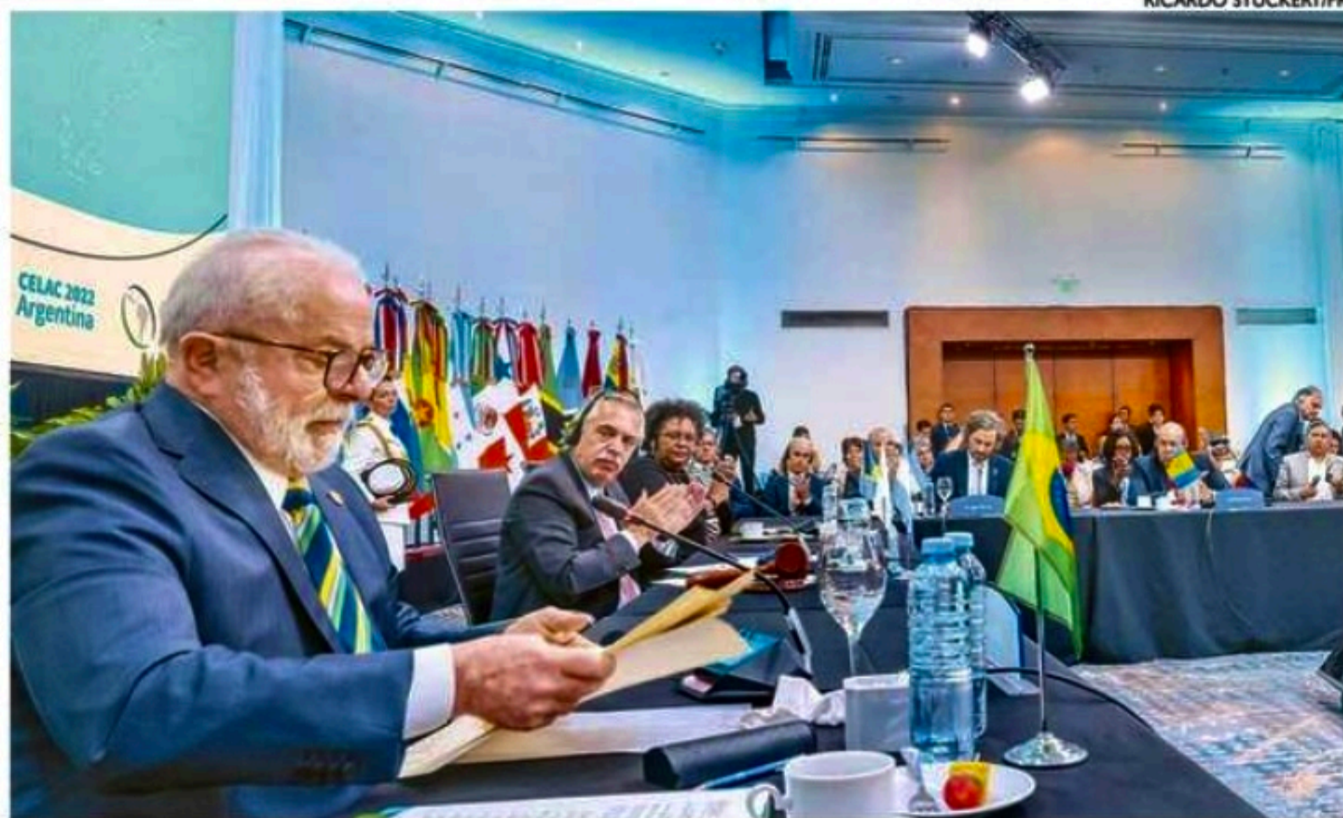
Em um discurso emocionado, Lula afirmou que a sensação era de reencontro consigo mesmo

Com o Brasil de volta à Cúpula, Lula reafirmou identidade entre os países, criticou Bolsonaro pela saída e agradeceu apoio contra os atos do dia 8