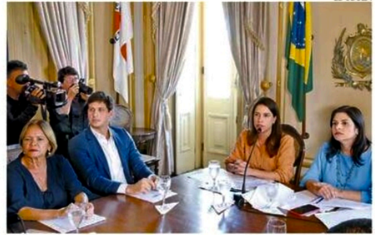
Governadora vai promover reuniões com todas regiões do Estado

“(Sugerimos) Que o estudo de tráfego possa ser feito para ajustes de novos retornos e novas intervenções e um estudo que já foi feito quando Eduardo Campos era governador, que pode ser atualizado, de uma terceira faixa”, explicou. Segundo João, a BR-101, por onde passam mais de 65 mil veículos por dia, é uma via que “tem uma importância metropolitana grande”.