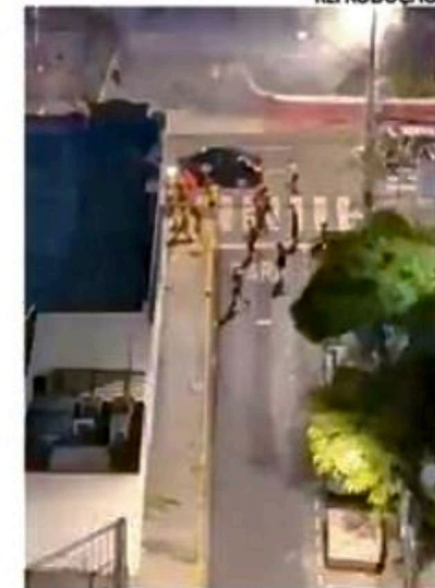
Briga de torcidas do Sport e do ABC assustou moradores