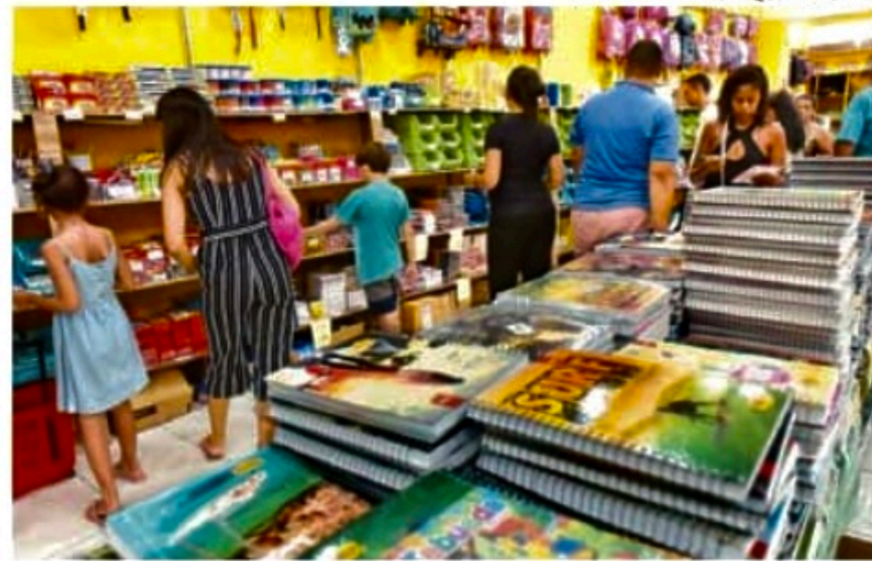
A variação de preços entre lojas diferentes é bastante elevada