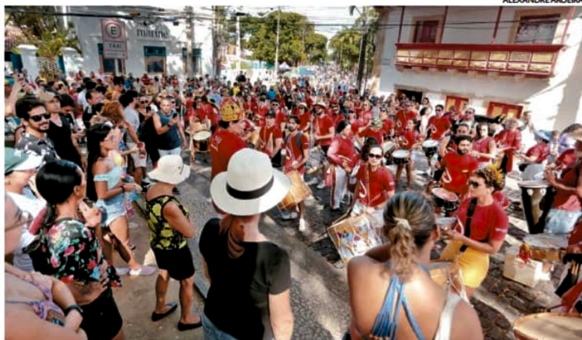
Em Olinda, com o sol a pino deste domingo, a folia já subia e descia as ladeiras

■ Há menos de um mês da chegada do Carnaval, foliões já curtem as prévias do festejo que ficou sem dar o ar da graça por três anos devido à pandemia