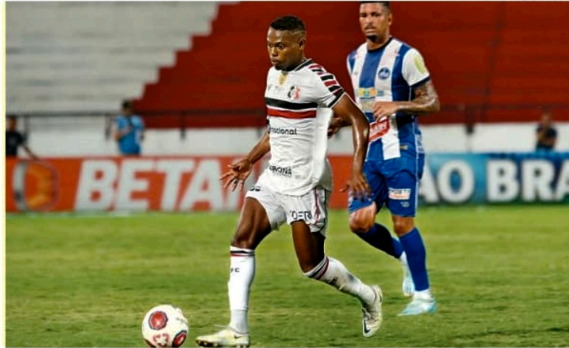
Apesar do maior tempo de posse de bola, Santa Cruz não construiu boas jogadas