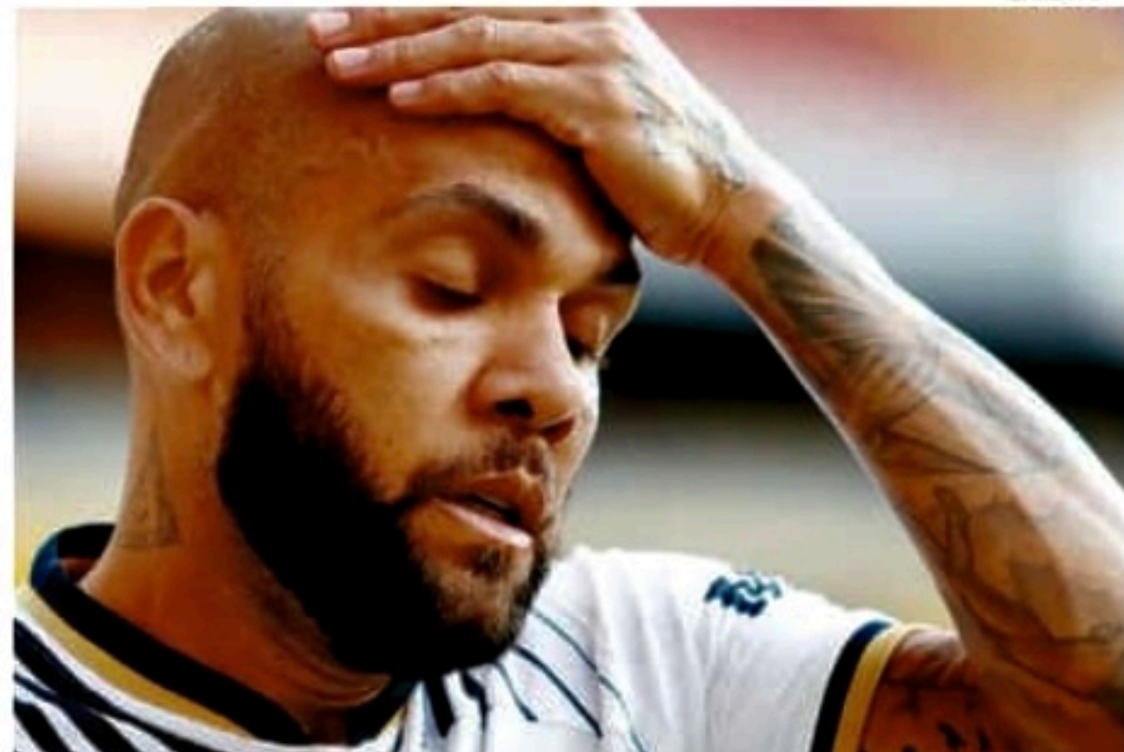
Daniel Alves está detido, desde o dia 20, sob acusação de estupro