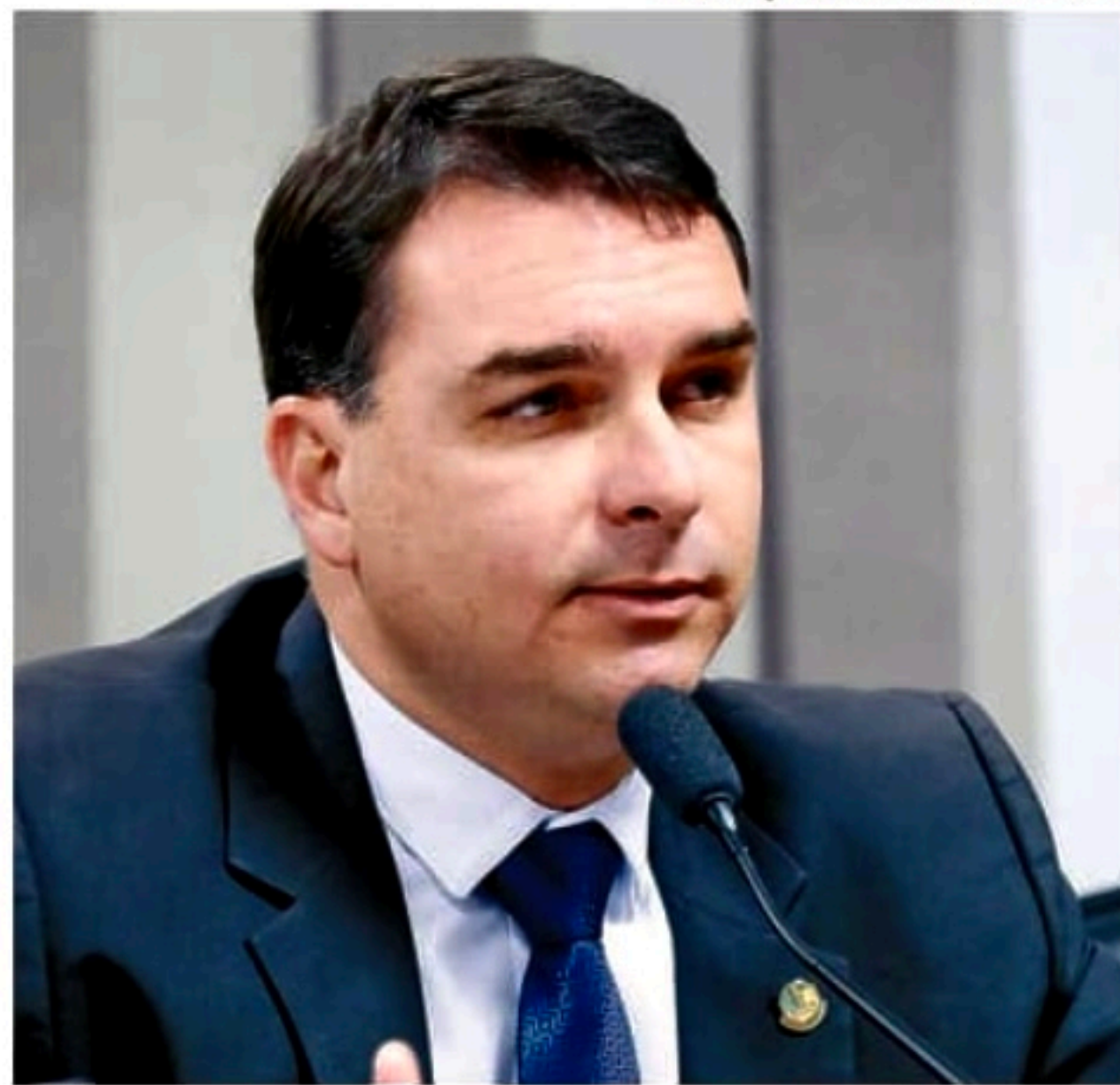
O filho do ex-presidente disse que não viu nenhuma minuta golpista

O ex-presidente é alvo de uma série de inquiridos do Supremo Tribunal Federal (STF) e no Tribunal Superior Eleitoral (TSE), inclusive acerca dos constantes questionamentos sobre a confiabilidade do sistema eleitoral. "Não tem temor nenhum. Ele não tem nenhuma responsabilidade sobre o que aconteceu no Brasil. Se ele estivesse sentado na cadeira de