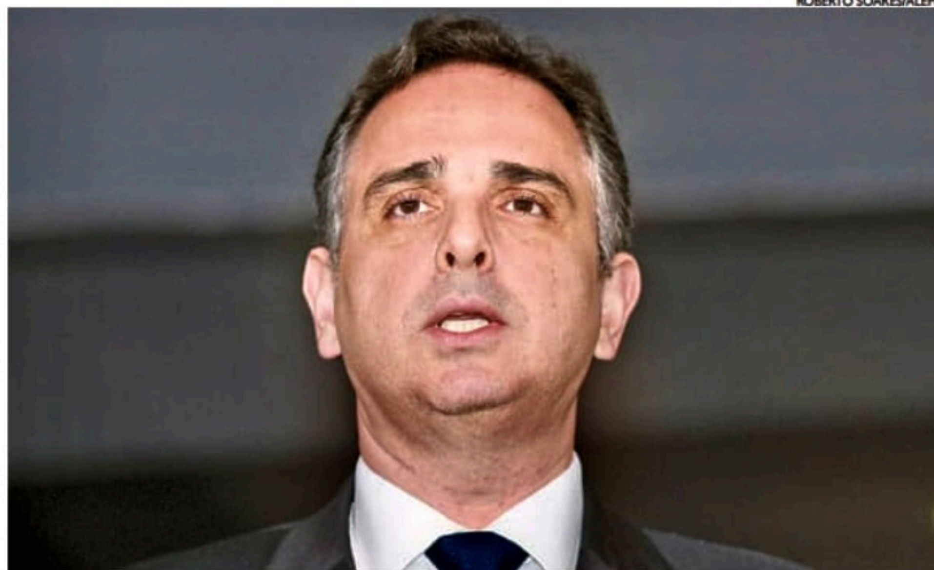
Pacheco terá pela frente uma disputa mais acirrada como o ex-ministro de Bolsonaro, Rogério Marinho

modo em parte da bancada com Pacheco diante da avaliação de que ele está "muito próximo" do ex-presidente da Casa Davi Alcolumbre