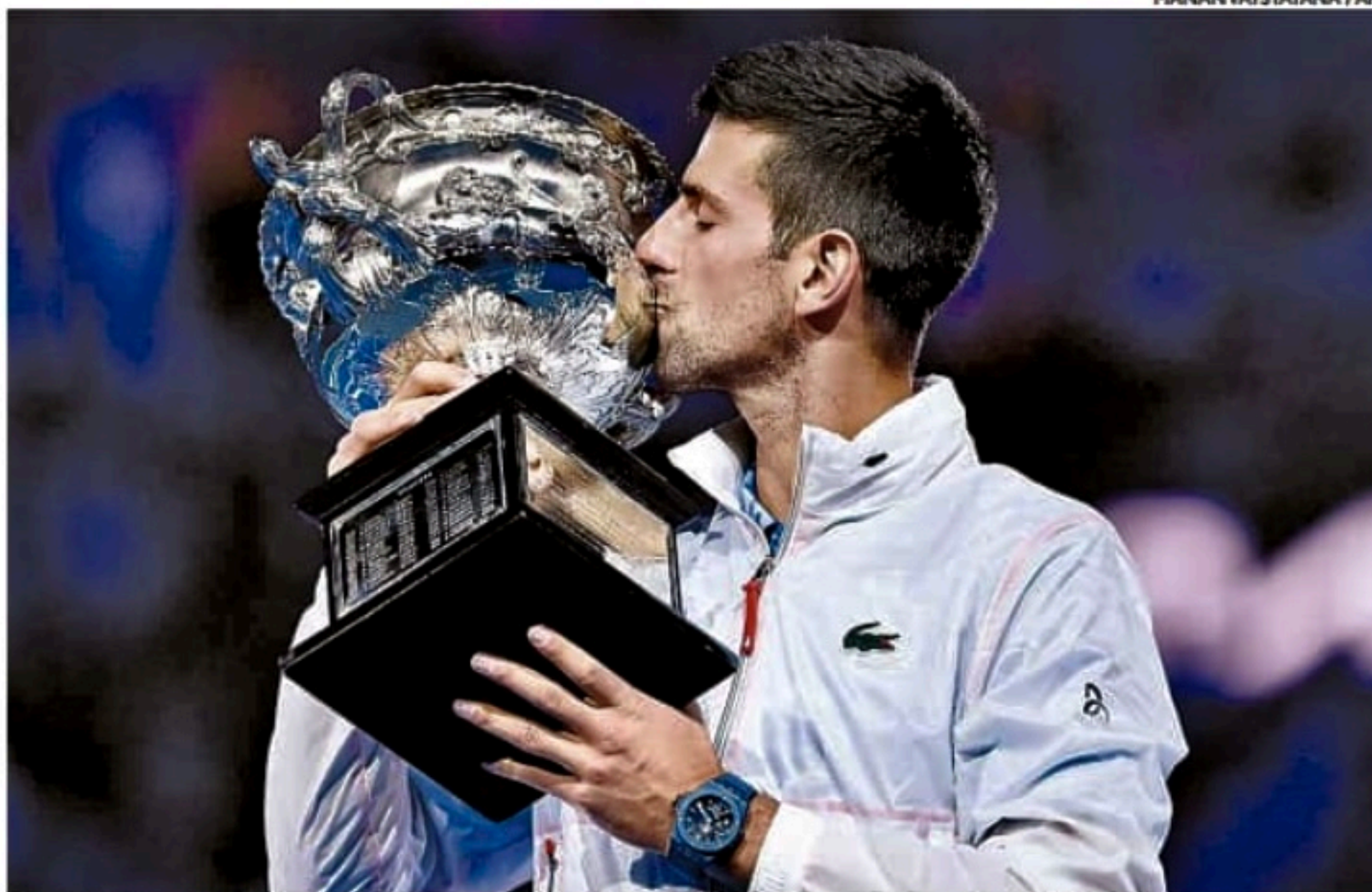
Novak Djokovic: "Este foi um dos torneios mais desafiadores que já joguei na minha vida"