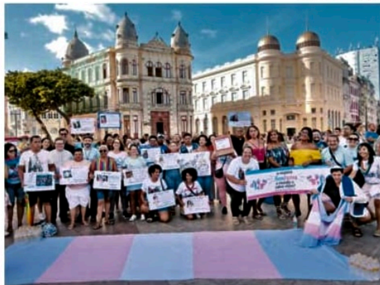
Evento reuniu movimentos sociais e ativistas LGBTQIAP+