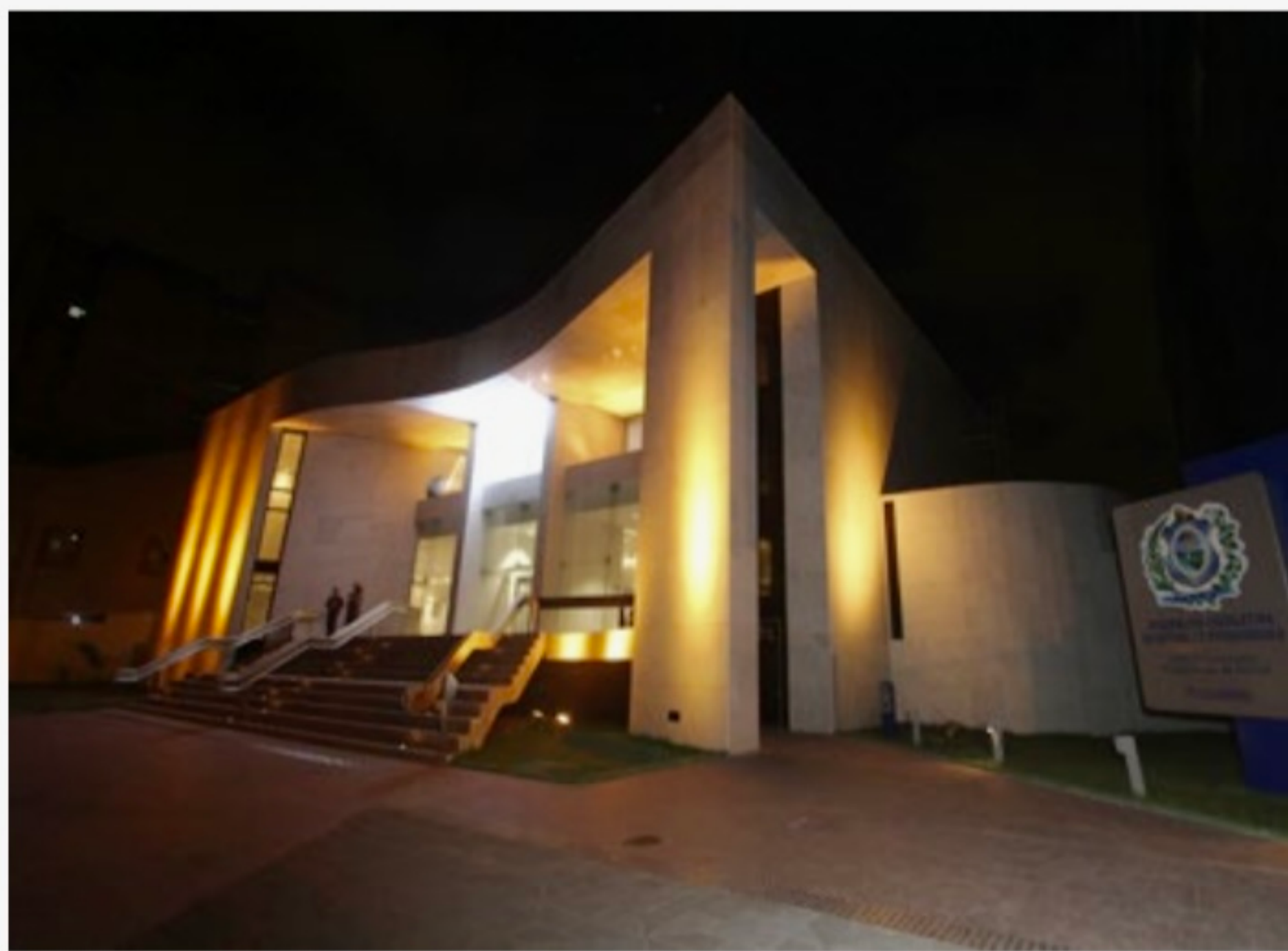
Deputados estaduais votaram de forma remota. Não houve transparência na divulgação dos votos

“A população pernambucana passa por um problema muito grave na questão social e nosso voto contra não é porque não va-