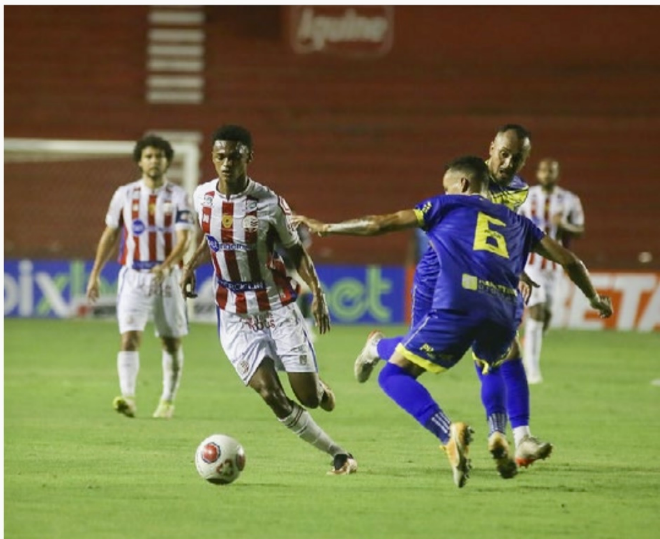
Náutico venceu o Caruaru City na segunda rodada

“Estamos passando por um processo natural de aprendizado. Fizemos um bom clássico e um bom jogo. Poderíamos ter feito mais gols, mas entendo que os gols que não fizemos fazem parte do aprendizado. E vamos amadurecendo mais,