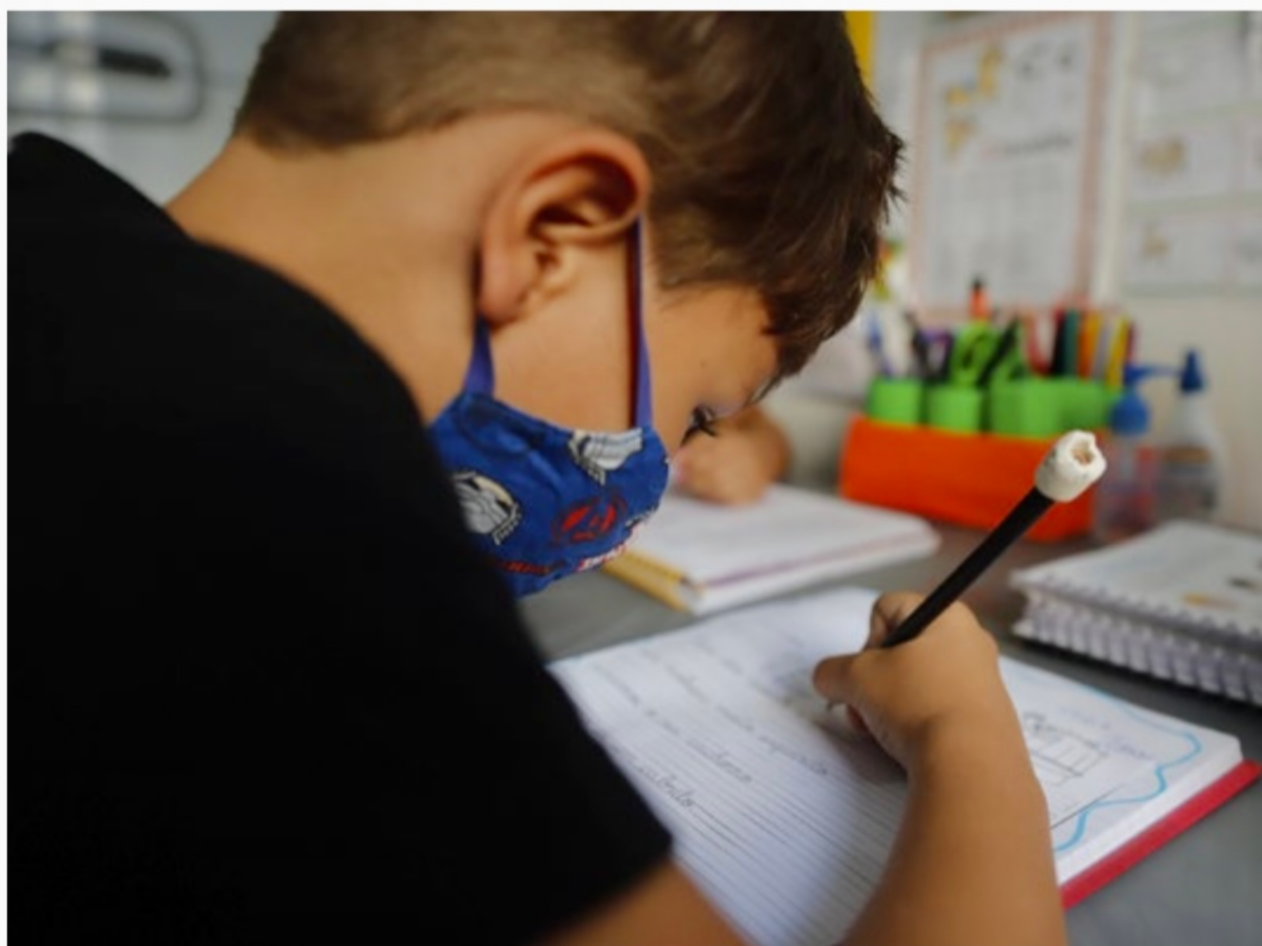
Valor do piso salarial pago aos professores de escolas particulares depende de negociação entre os donos dos colégios e a categoria

Portanto, R$ 4.420,55 é o mínimo que União, Estados, o Distrito Federal e os municípios deverão pagar aos professores da