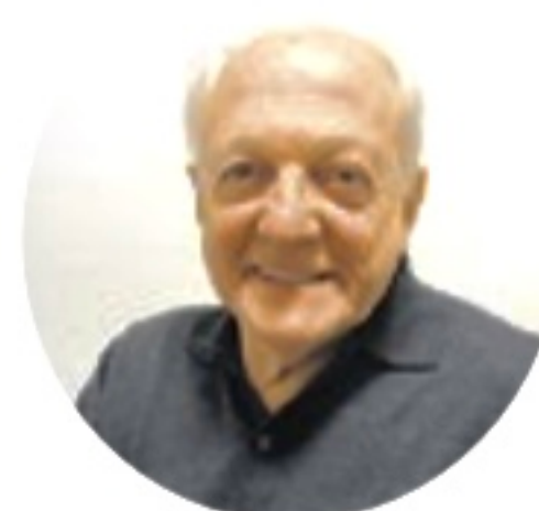
FLÁVIO RICCO Colaboração JOSÉ CARLOS NERY