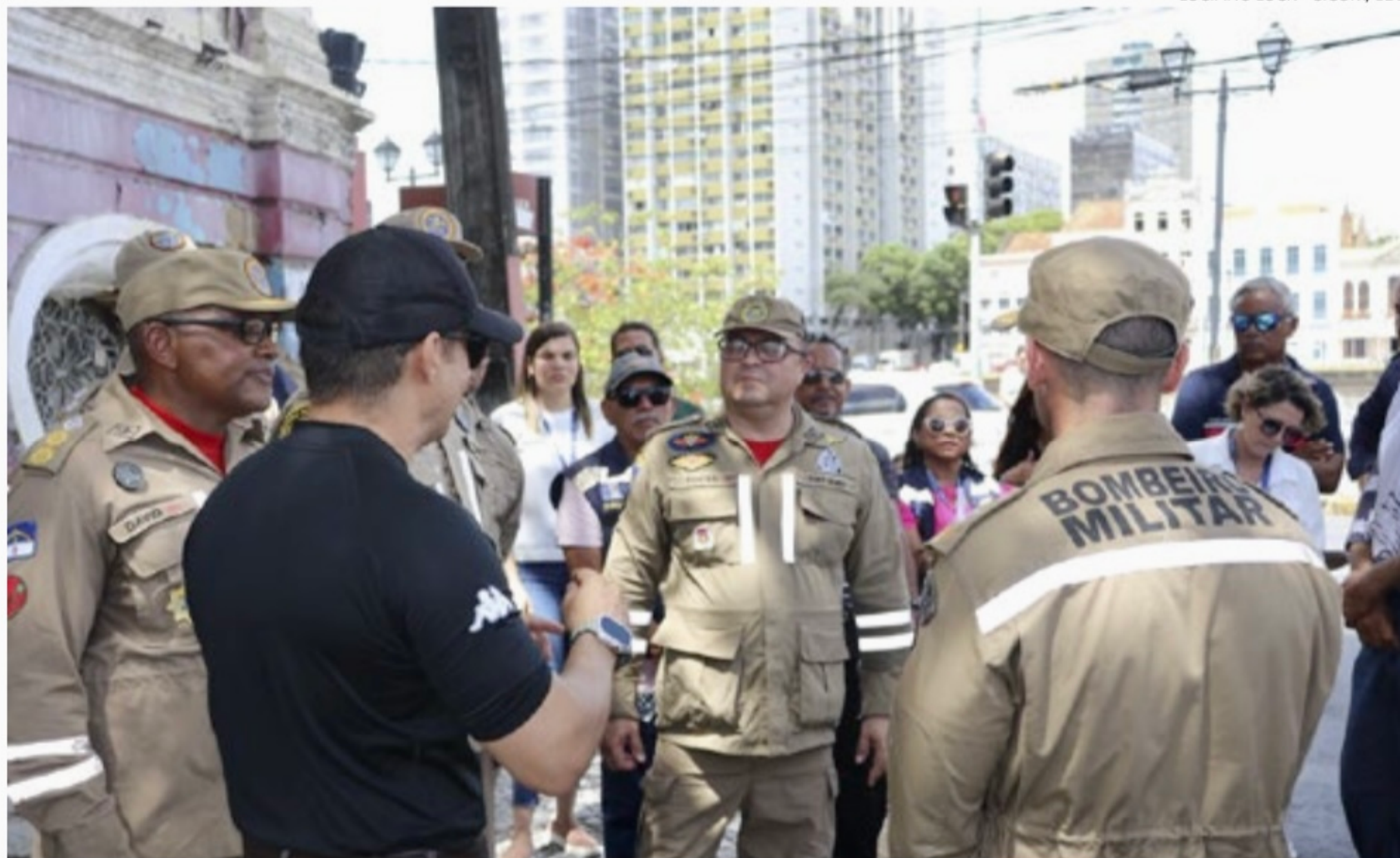
Grupo inspecionou o trajeto do cortejo, passando por Rua Imperial, Praça Sérgio Loreto, Avenida Dantas Barreto, Guararapes e Rua do Sol

Após dois anos sem a saída do bloco por causa da pandemia da covid-19, o desfile do Galo da Madrugada será no