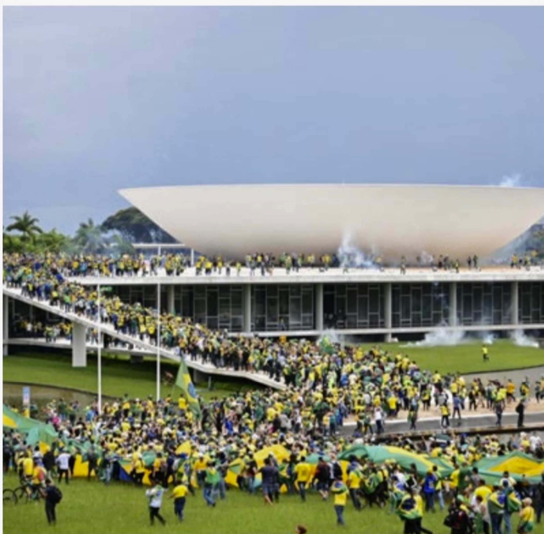
Inquérito vai correr em sigilo e foi determinado prazo de um ano para as investigações

O inquérito vai correr em sigilo e foi determinado prazo de um ano para as investigações.