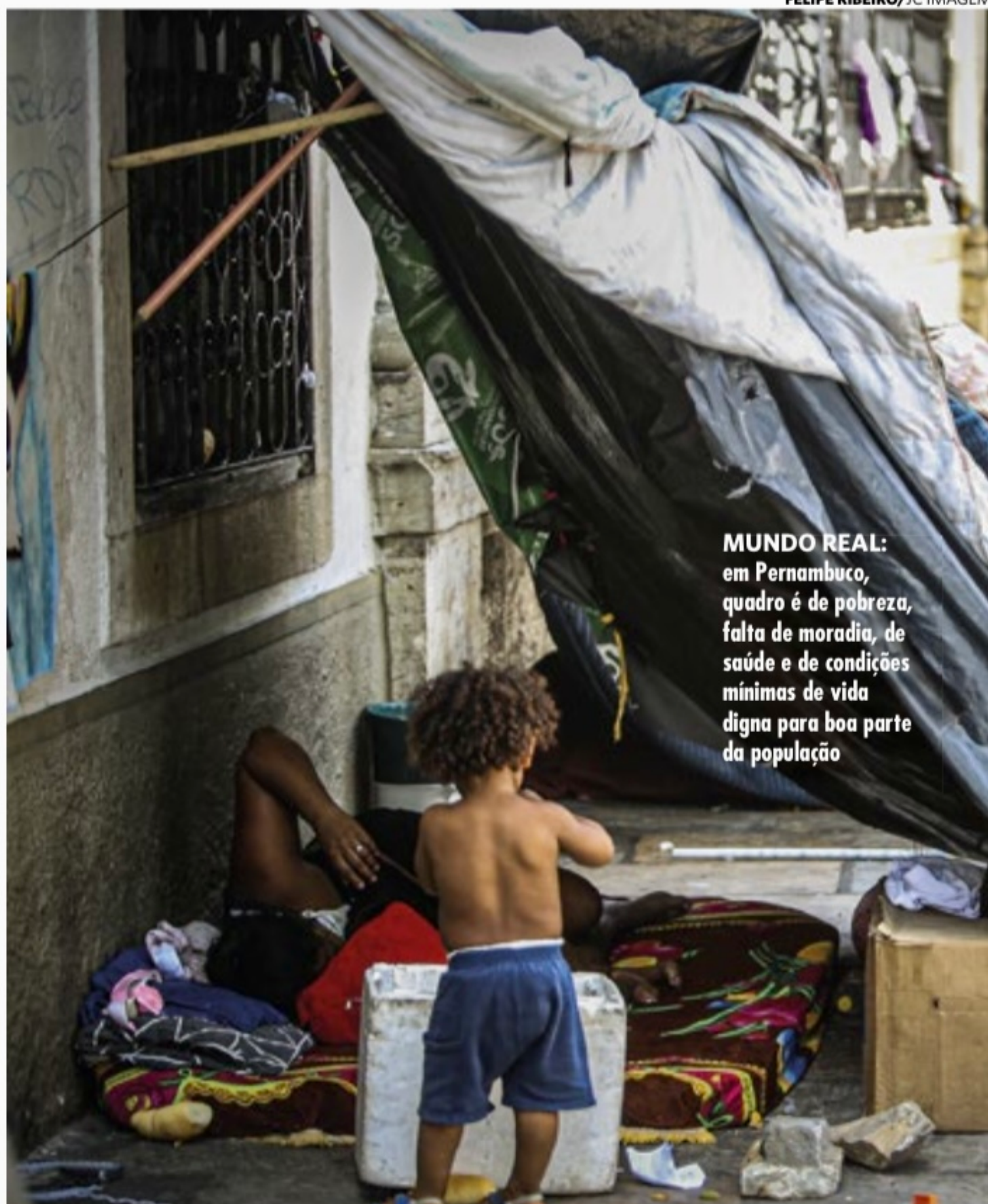
MUNDO REAL: em Pernambuco, quadro é de pobreza, falta de moradia, de saúde e de condições mínimas de vida digna para boa parte da população