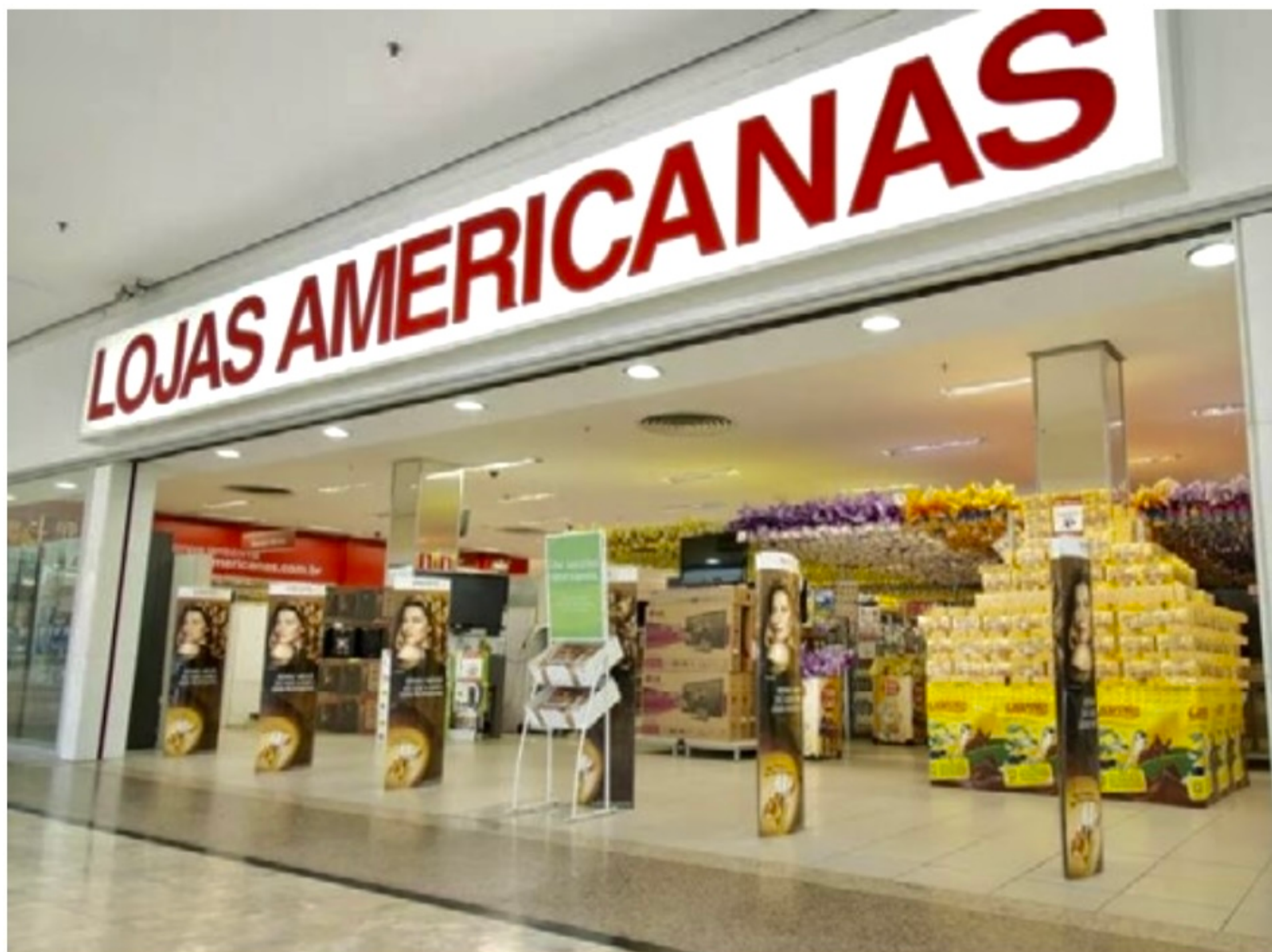
Rede varejista revelou ter dívida bilionária

“Os balanços revelam que as Lojas Americanas possuem 0,015% de lucratividade. Isso significa dizer que, para pagar R$ 40 bilhões, é preciso faturar entre 2 e 3 bilhões. Fazendo uma análise fria, ao pedir recuperação judicial, ela poderá renegociar as dívidas com os credores de forma mais fácil”, explica o especialista.