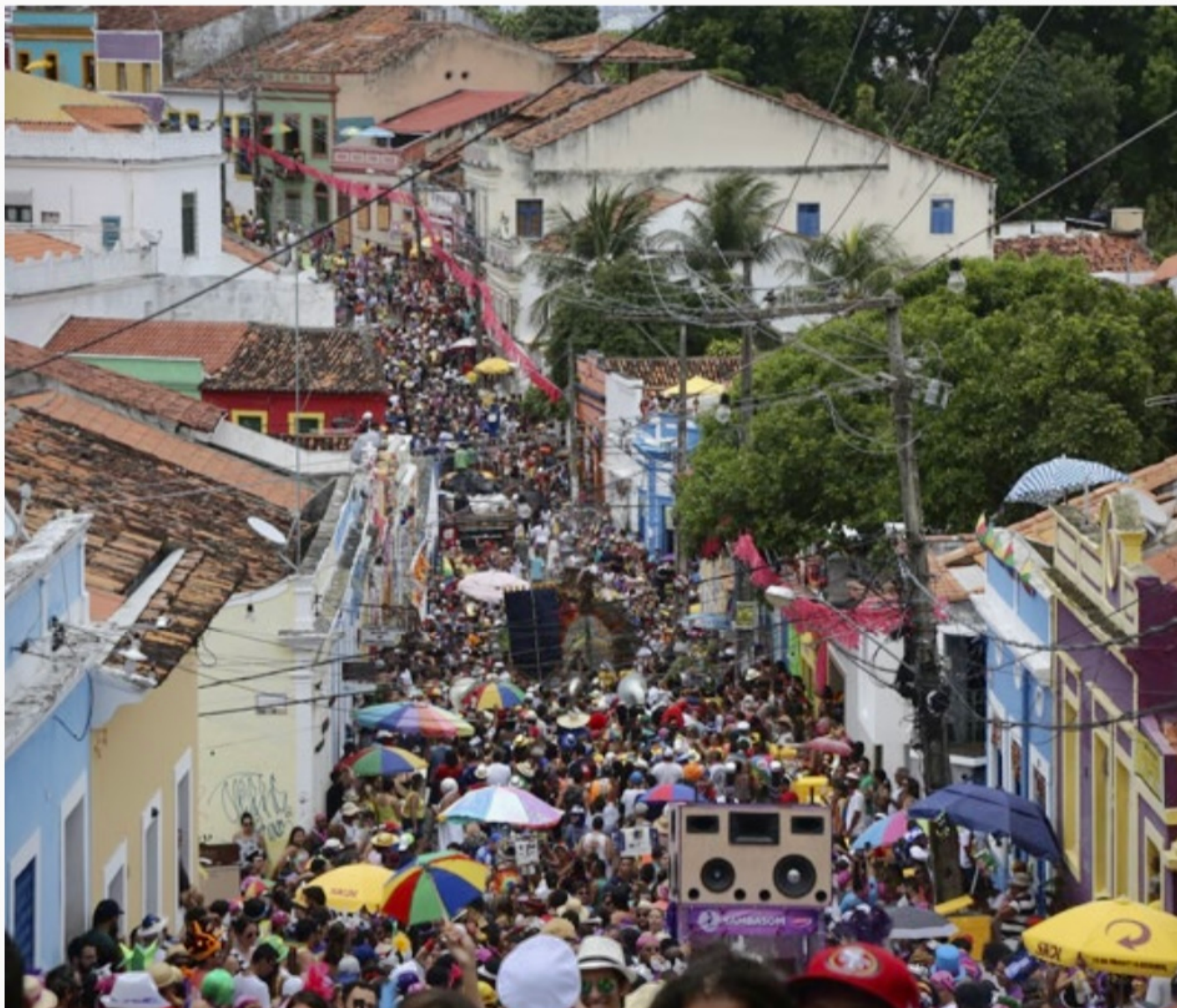
Alguns blocos estão com dificuldades financeiras e não vão desfilar este ano

Os dois anos de suspensão do Carnaval vão se estender para algumas agremiações em Olinda. Entenda os motivos