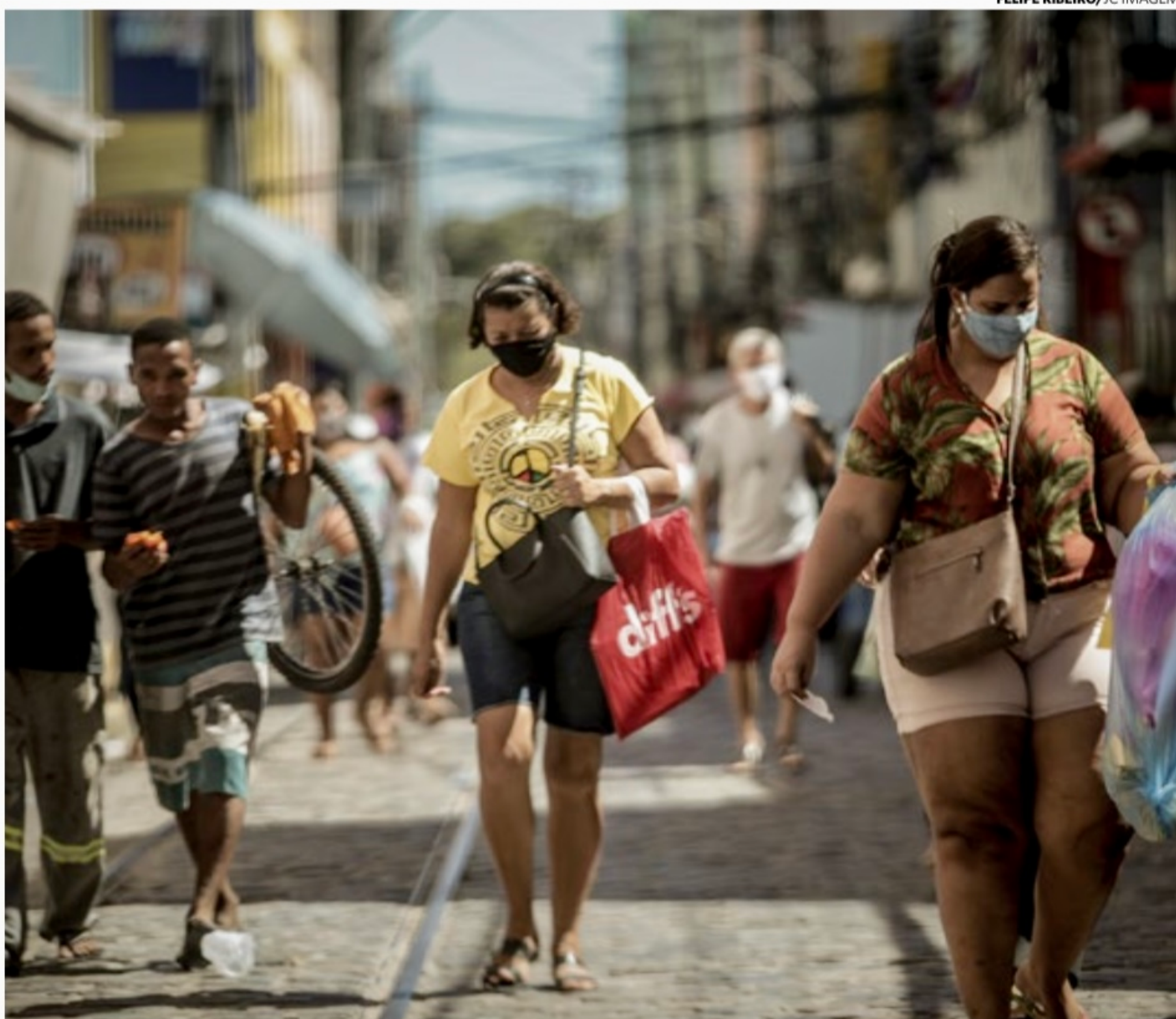
População: prévia do Censo de 2022 revelou que a população pernambucana (9,0 milhões) aumentou em cerca de 200 mil pessoas comparada a 2010