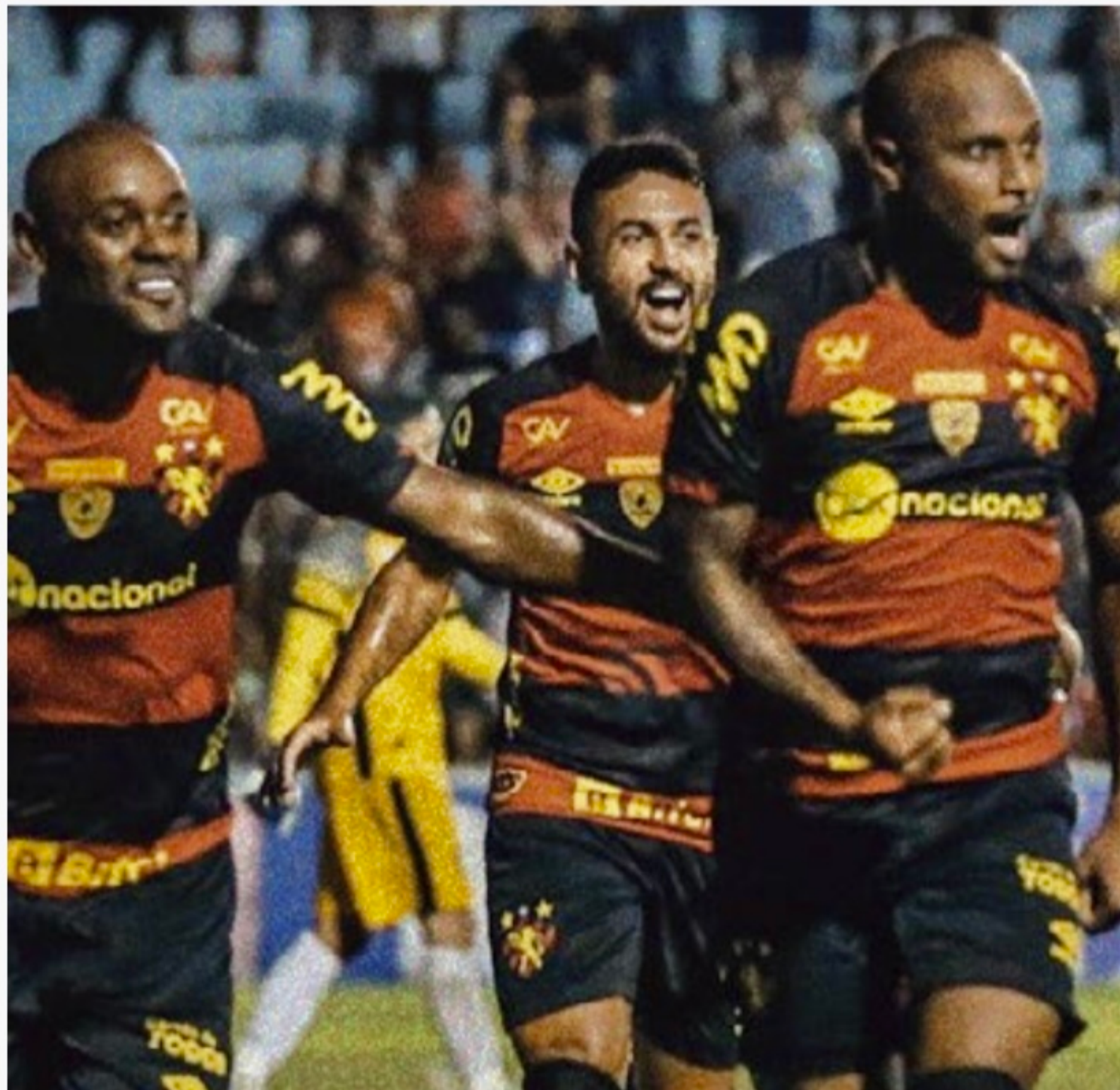
Sport venceu o Salgueiro por 2x1 no Campeonato Pernambucano 2023

Em tempo, O Sport volta a campo no próximo sábado (21), quando fará sua estreia na Copa do Nordeste contra o ABC-RN, na Ilha do Retiro, às 19h30. Já o Salgueiro só volta a campo na terça da semana que vem, quando visitará o Íbis, no Gileno de Carli, novamente pelo Campeonato Pernambucano.