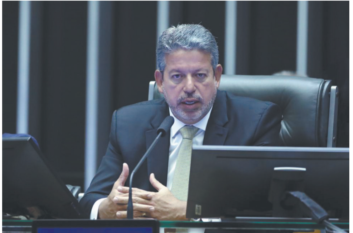
Atual presidente, Lira (PP) é considerado o único com uma candidatura viável à vitória

PT, PSB e outros partidos da base do presidente Luiz Inácio Lula da Silva (PT) caminham consolidados para reconduzir