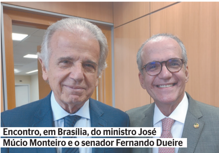
Encontro, em Brasília, do ministro José Múcio Monteiro e o senador Fernando Dueire