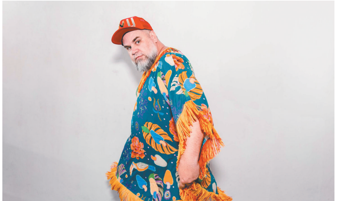
Neste início de ano, DJ divide agenda entre prévias carnavalescas e outros eventos