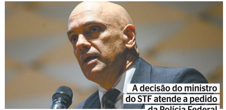
A decisão do ministro do STF atende a pedido da Polícia Federal

“As afirmações de Valdemar Costa Neto, ao dizer que teve consigo minutas semelhantes, de caráter manifestamente ilegal e inconstitucional, devem ser esclarecidas no contexto mais amplo desta investigação, notadamente no que diz respeito à adesão, por terceiras pessoas,