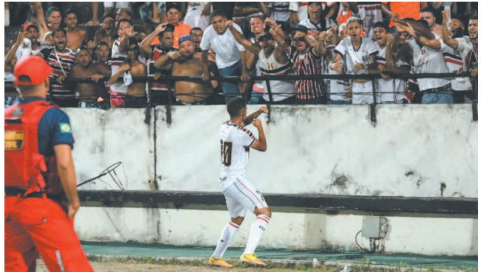
Até agora, são seis empates e quatro vitórias entre jogos como mandante e visitante

Apesar dos empates, Tricolor não perdeu ainda na temporada 2023 entre PE e Nordeste; somando os jogos amistosos, marca é até melhor que a de 1996