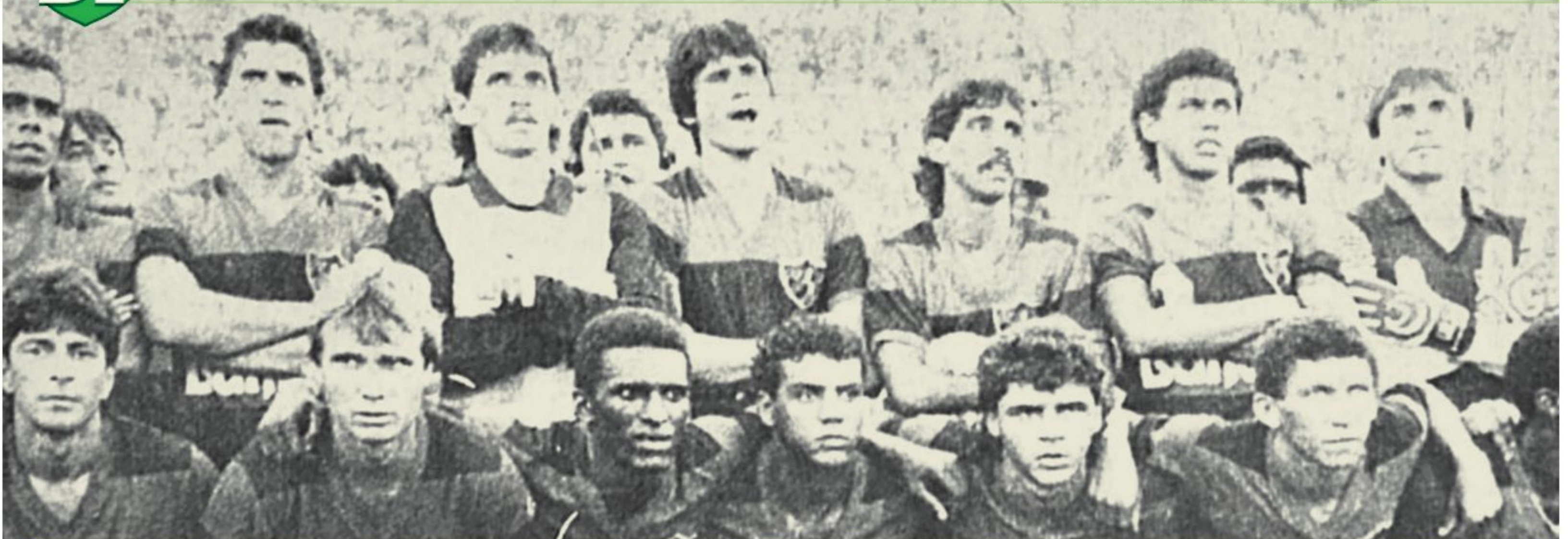
Exatamente no dia 7 de fevereiro de 1988, o Sport conquistava do inédito (e polêmico) título do Campeonato Brasileiro de 1987