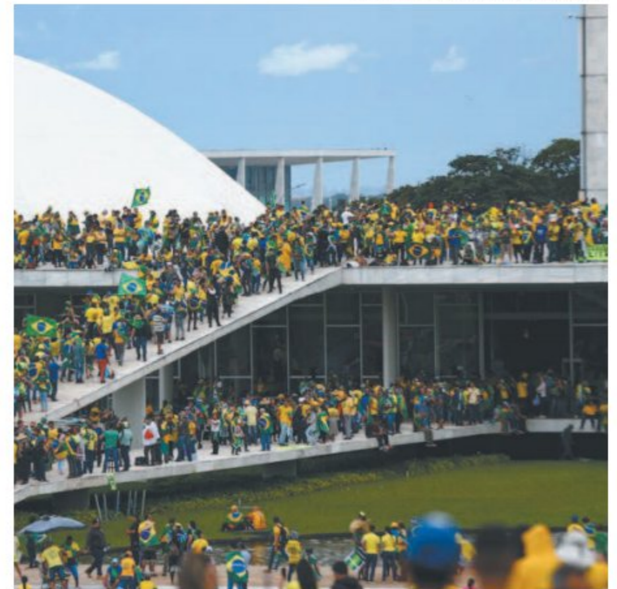
Denúncias citam nomes de participantes e autoridades