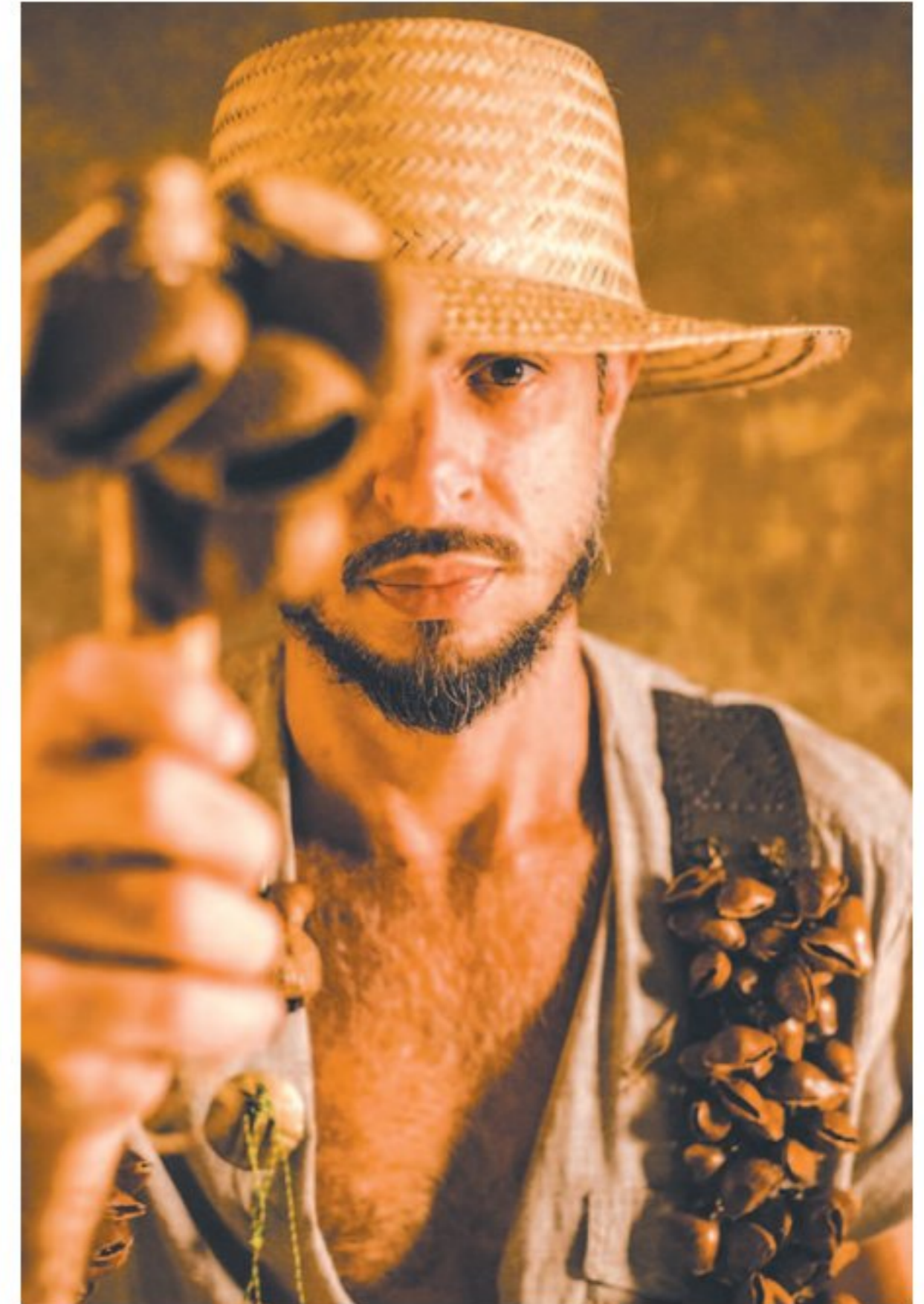
Músico diz que produção é regional com pegada jazzista

Embora seja um disco brasileiro, o ouvinte pode perceber que "O Sopro e a Percussão" possui uma relação muito estreita com a música mundial. "Remete ao regional, mas ao mesmo tempo com uma pegada jazzística."