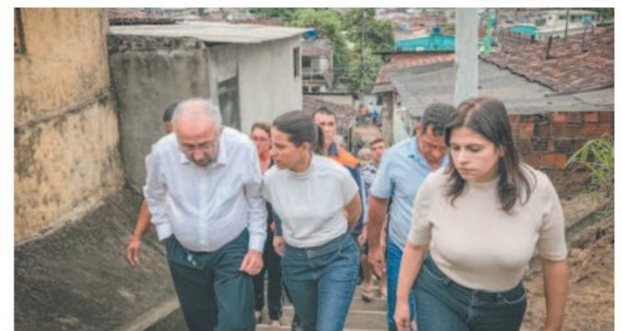
Raquel Lyra, e a vice, Priscila Krause, foram à comunidade

alagada e pacientes precisaram ser transferidos. Não houve sessões na Assembleia Legislativa de Pernambuco nem na Câmara dos Vereadores do Recife por falta de energia.