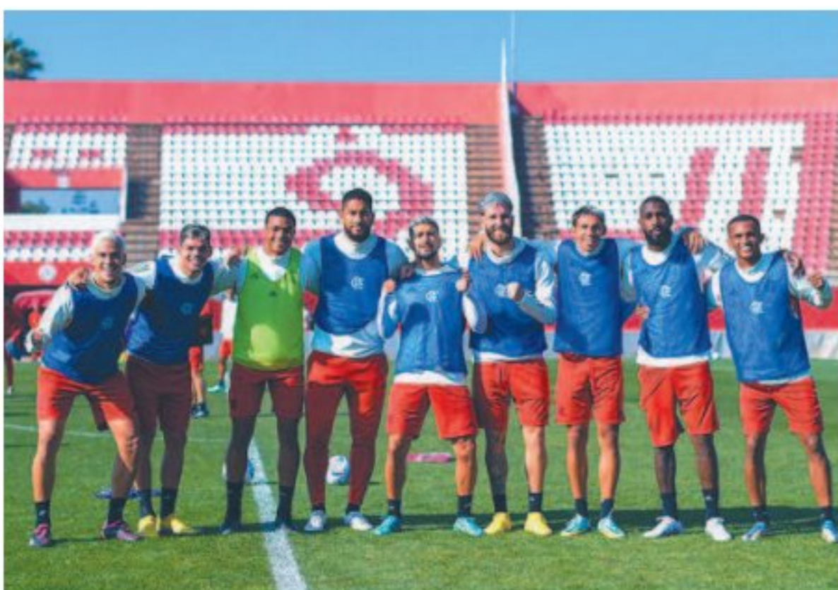
Mengão encara o Al Hilal, às 16h, na cidade de Tânger