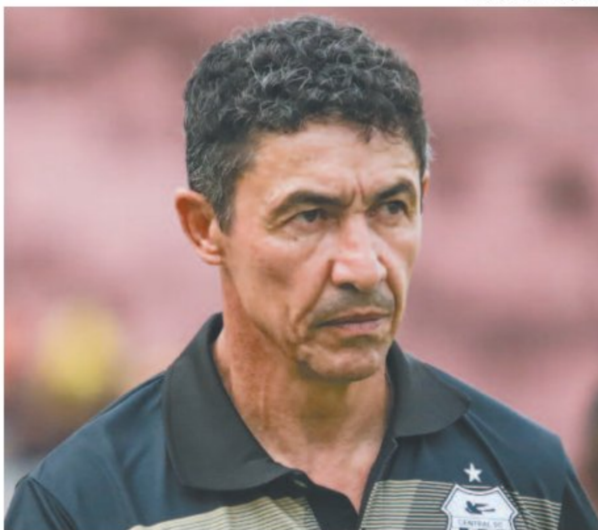
Treinador não suportou derrota para o Petrolina

Em nota oficial, o Central agradeceu os serviços presta-