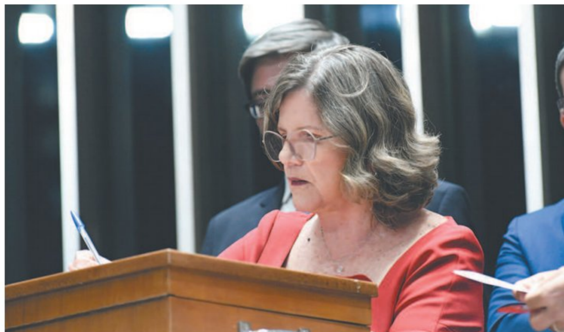
Senadora Teresa Leitão quer usar a educação como promotora de igualdade social

O presidente reeleito da Casa, Rodrigo Pacheco, comprometeu-se em ter uma mulher à frente de um novo colegiado criado para defesa da democracia