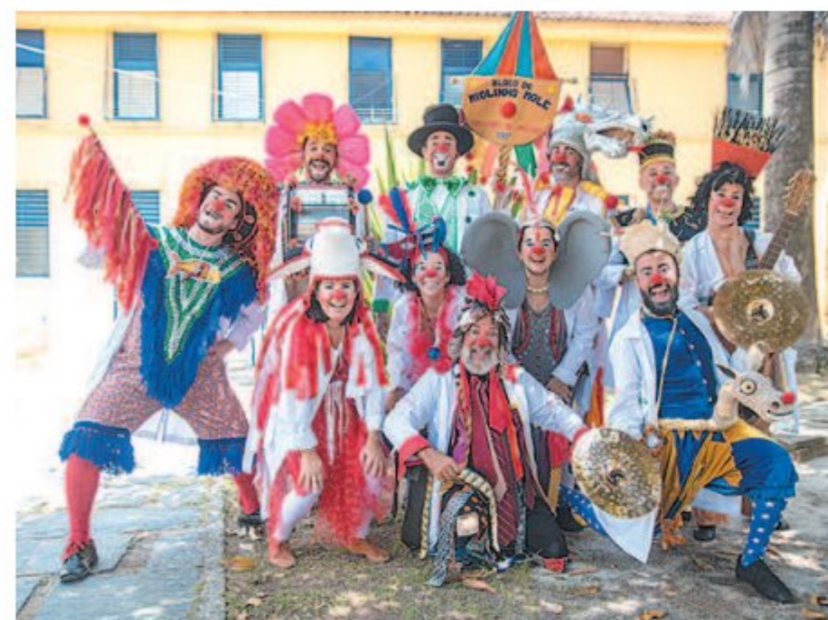
Para os “doutores palhaços”, festejar a volta é importante

O Miolo Mole, o bloco dos Doutores da Alegria para todos os foliões, o Bloco do Miolo Mole, que está em sua 18ª edição, sairá no dia 16, com concentração no Armazém do Campo (Avenida Martins de Barros, 387, Santo Antônio), a partir das 18h.