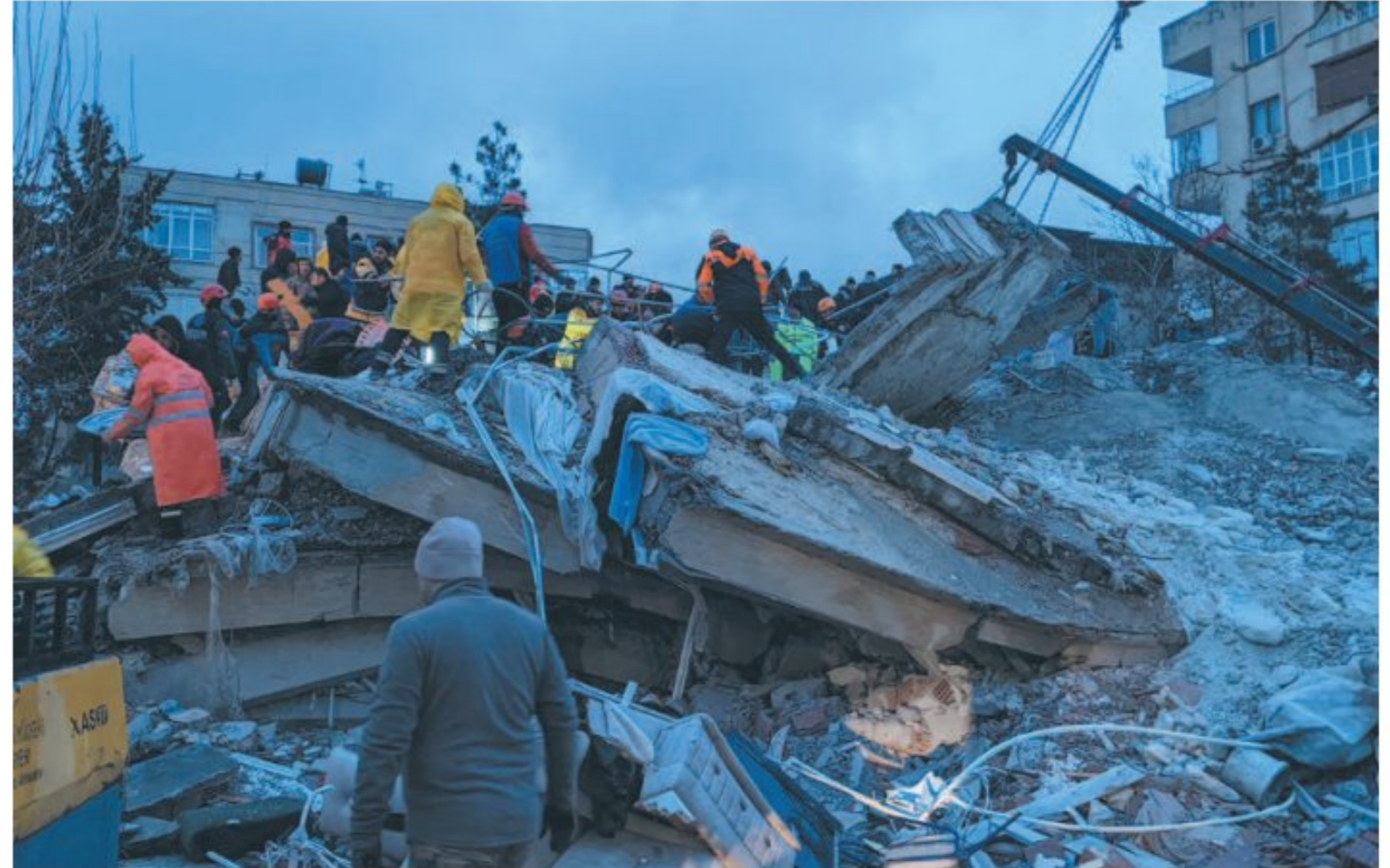
Buscas por sobreviventes em prédio da Turquia continuam hoje. EUA mandarão ajuda

Dezenas de países ofereceram ajuda à Turquia e à Síria, onde o terremoto foi mortal porque ocorreu nas primeiras horas da manhã, quando a maioria das pessoas estava dormindo. O presidente dos Estados Unidos, Joe Biden, prometeu a Erdogan que Washington enviaria "toda a ajuda necessária" para a recu-