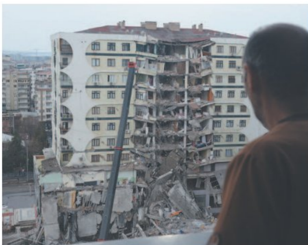
Itamaraty diz que ainda não há brasileiros entre vítimas