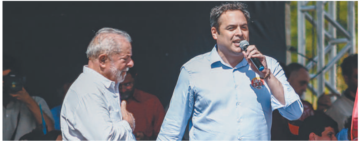
O ex-governador de Pernambuco anunciou sua desfiliação do PSB no dia 27 de janeiro

O Banco do Nordeste do Brasil é uma sociedade de economia mista, de capital aberto e