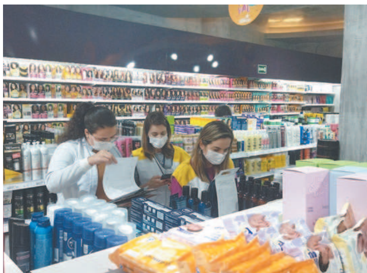
Vigilância Sanitária e Procon começaram ontem a ação