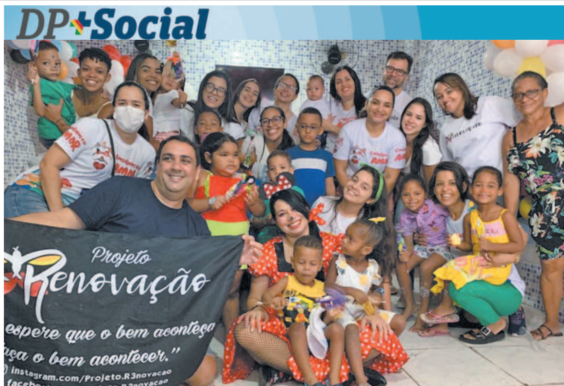
Entre as atividades, há visitas a creches, onde são realizadas refeições e recreações

De acordo com a regra do Código de Defesa do Consumidor (CDC), fabricante é responsável pelos danos causados pelo defeito no produto, conforme destaca o artigo 12. A recomendação do Procon Recife é de somente usar/comprar produtos autorizados pela Anvisa. O Procon Recife pode ser acionado pelo site procon.recife.pe.gov.br .