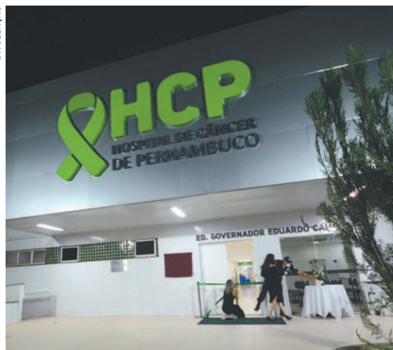
HCP deve R$ 12 milhões a médicos contratados

Médicos contratados pelo Hospital de Câncer de Pernambuco (HCP) decidiram que vão parar de trabalhar no próximo dia 8 de março, caso a unidade de saúde não honre o pagamento de uma dívida de R$ 12 milhões com a categoria. De acordo com informações do Sindicato dos Médicos de Pernambuco (Simepe), mais de cem profissionais participaram da Assembleia Geral Extraordinária (AGE) e a decisão de parar em consequência do que foi definido como “falta de apresentação de propostas razoáveis e objetivas pelo Hospital de Câncer”. Solicitado a se posicionar, o HCP respondeu por nota, informan-