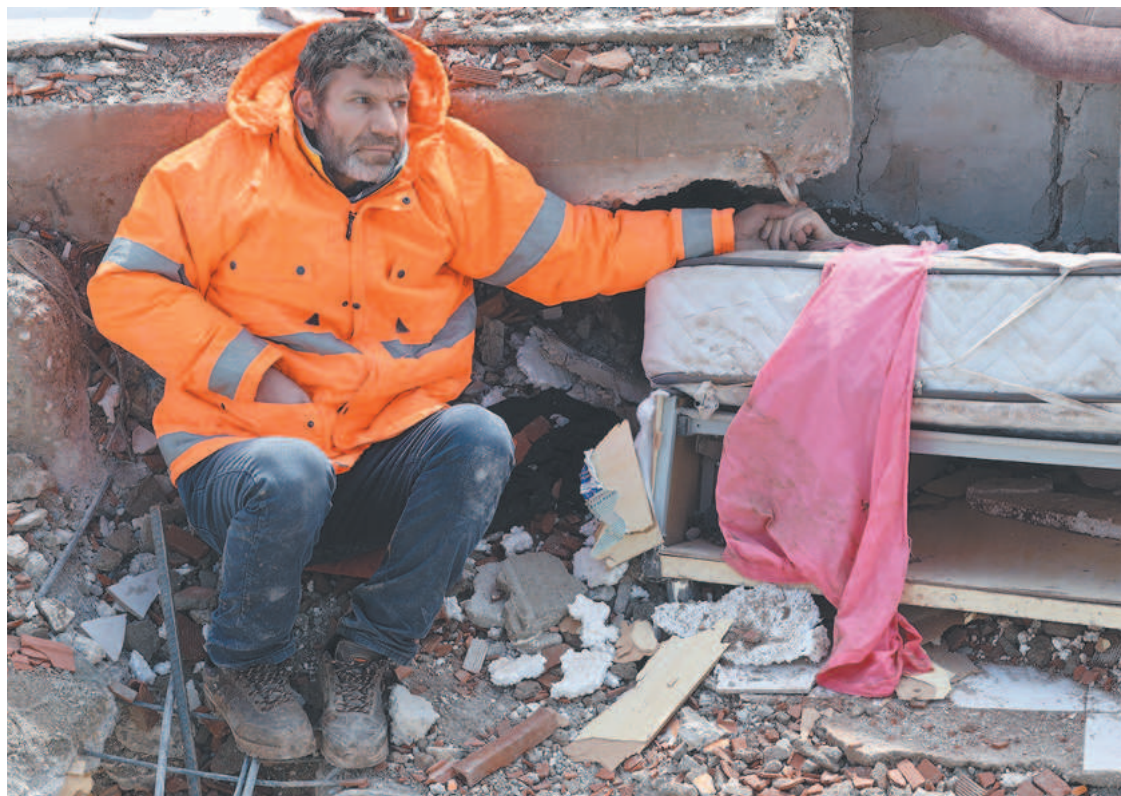
Imagem de um pai segurando a mão de filha morta viralizou pelo mundo ontem

“A OMS está ciente da forte capacidade de resposta da Turquia e considera que as principais necessidades não atendidas podem