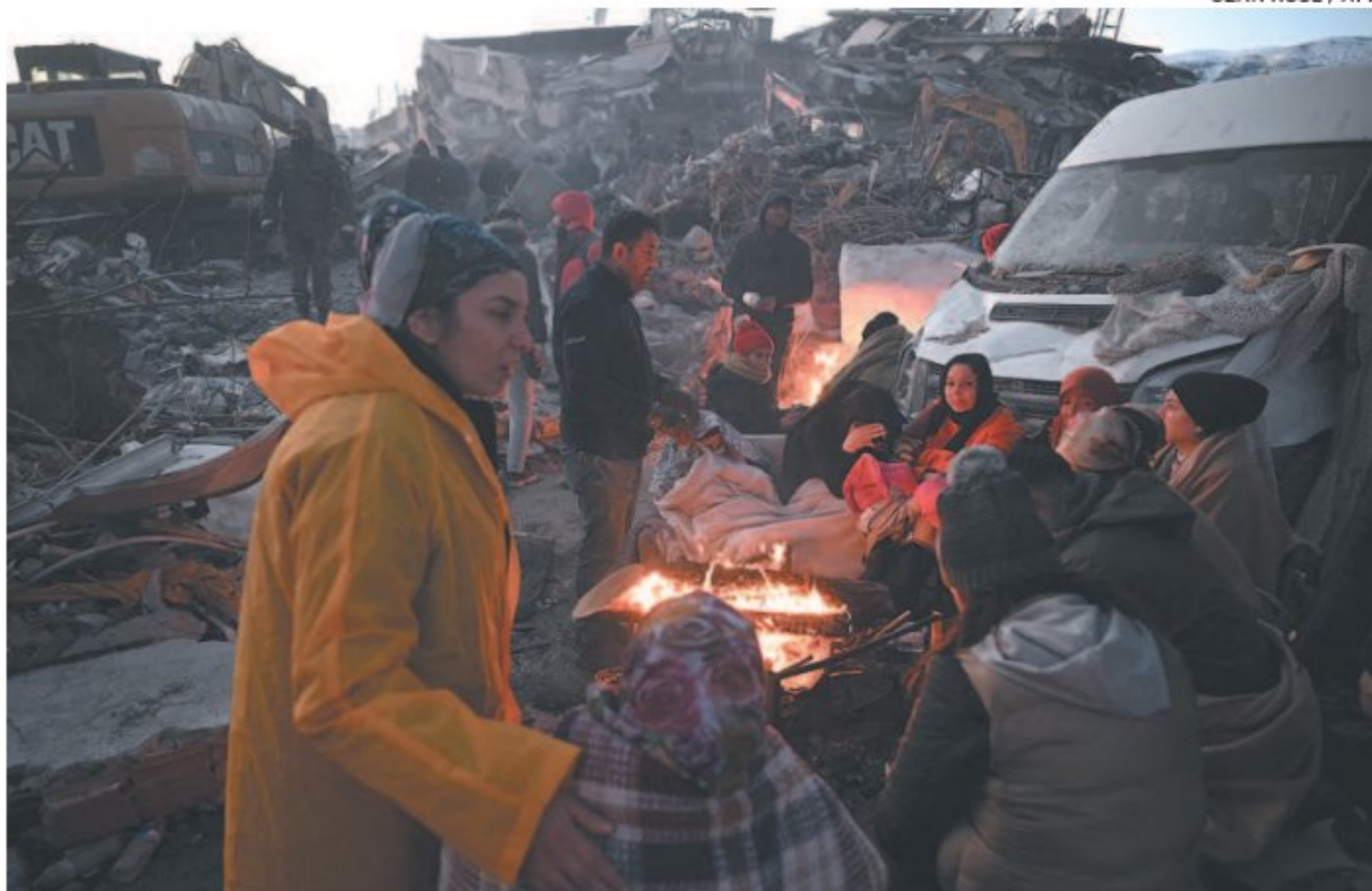
Muitos turcos acampam em meio aos escombros, apesar do frio intenso na região