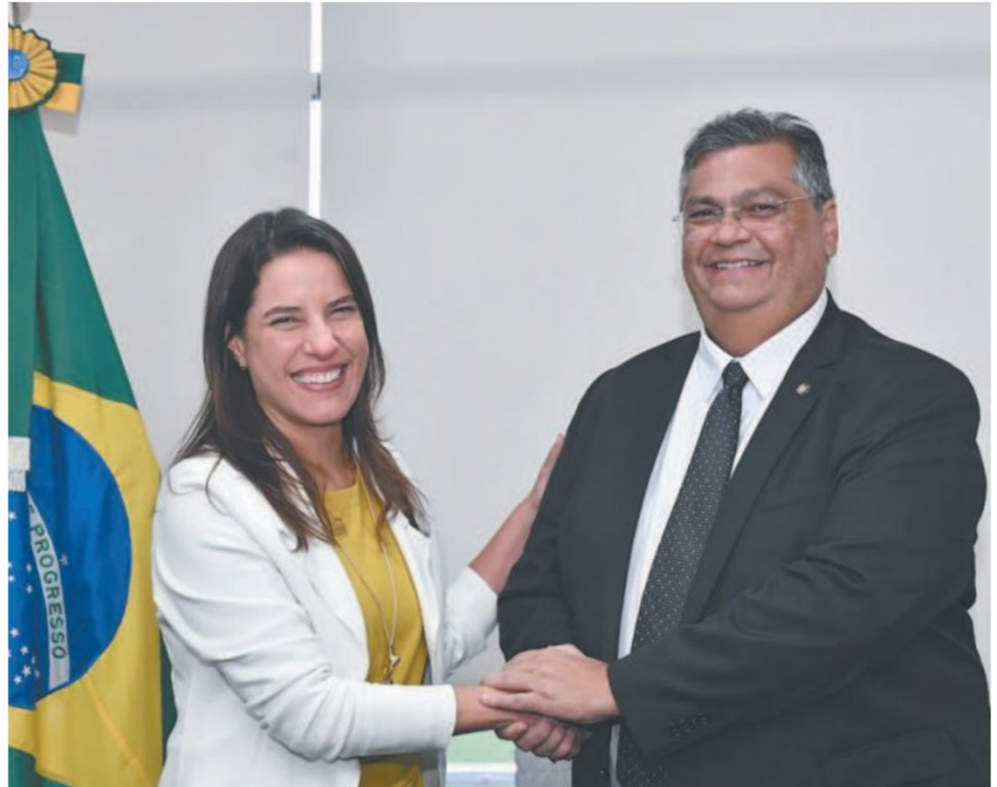
A governadora Raquel Lyra recebida pelo ministro Flávio Dino em Brasília

O concurso de fantasias do carnaval aconteceu ontem na sede do Clube Português. Os ganhadores vão desfilar sábado, no Baile Municipal.