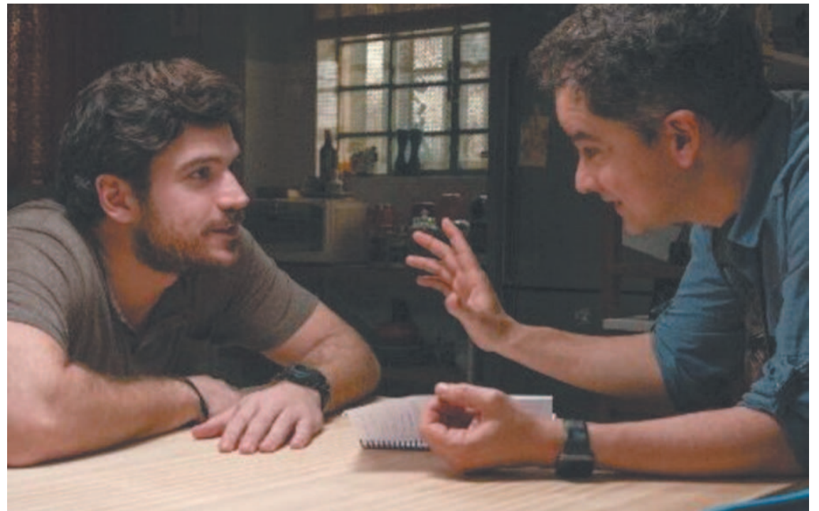
Temporada ocorre após um salto temporal em relação aos eventos da primeira parte

e outros personagens marcantes do imaginário brasileiro. Nesta nova temporada, após um salto temporal em relação aos eventos da primeira parte da série, o personagem de Marco Pigossi aparece em um santuário natural protegido por in-