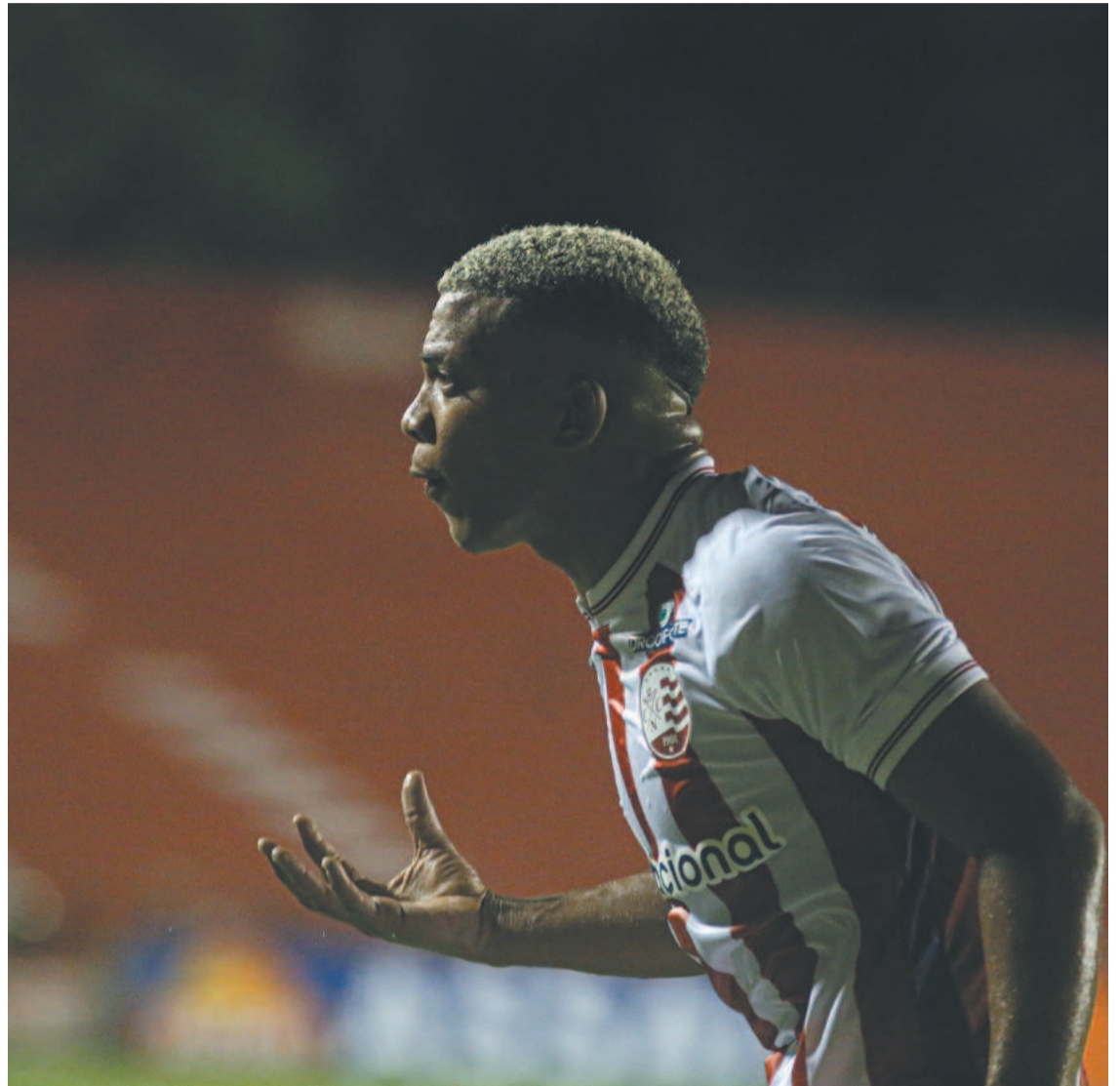
Atleta deve seguir como titular no próximo compromisso do Alvirrubro em 2023