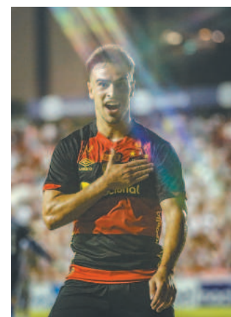
Ataque segue exitoso