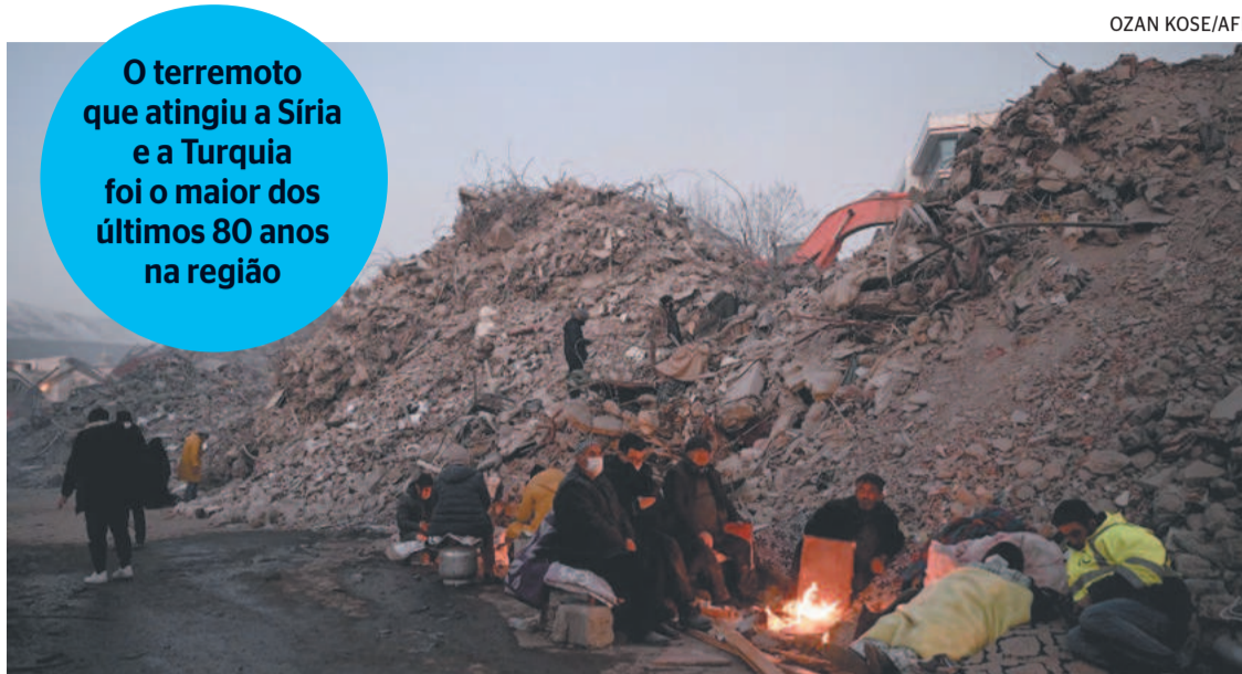
O terremoto que atingiu a Síria e a Turquia foi o maior dos últimos 80 anos na região

“Até agora, falhamos com o povo do noroeste da Síria. Eles têm direito de se sentirem abandonados, esperando por ajuda internacional que não chega”, disse Griffiths, acrescentando que