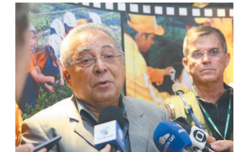
Amazonino disputou o pleito para governador em 2022

da Silva lamentou a morte de Amazonino Mendes, prestou solidariedade à família do político e disse que ele tinha “gosto e vocação política”. O presidente também lembrou que Amazonino o apoiou no segundo turno da eleição de 2022, contra o ex-presidente Jair Bolsonaro (PL).