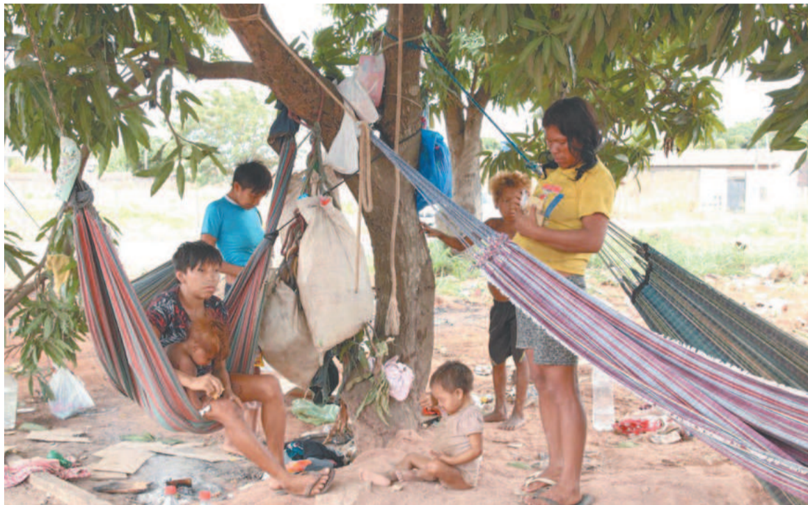
Grupo fugiu da terra indígena por falta de comida e ataque de homens de outra comunidade

Por enquanto, vivem como sem-teto na cidade de Boa Vista, dormindo sobre papelão e contando com a solidariedade de outras pessoas para sobreviver. (Agência Brasil)