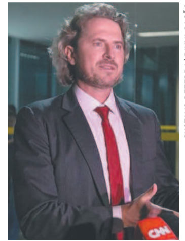
Juros de 13,5% a.a. acirraram ânimos

"Se o Banco Central começar a tomar decisões boas, e se essas decisões começarem a melhorar o país, ajudar na retomada do emprego, do salário, no controle do custo de vida, acredito que vai ter uma calma grande em relação a essas críticas", afirmou ainda Zeca Dirceu. "O resultado das políticas do Ban-