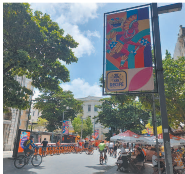
Bares e restaurantes estão entre os setores beneficiados

O montante de R$ 263,7 milhões indica o segundo ano de recuperação do volume de negócios no estado. Dados da CNC apontam que em 2021, primeiro carnaval afetado pela pandemia, o faturamento foi R$ 188,40 milhões no estado, uma queda de 37,4% em relação a 2020. Em 2022, o volume cresceu 18,8% e agora deve avançar 17,8%.