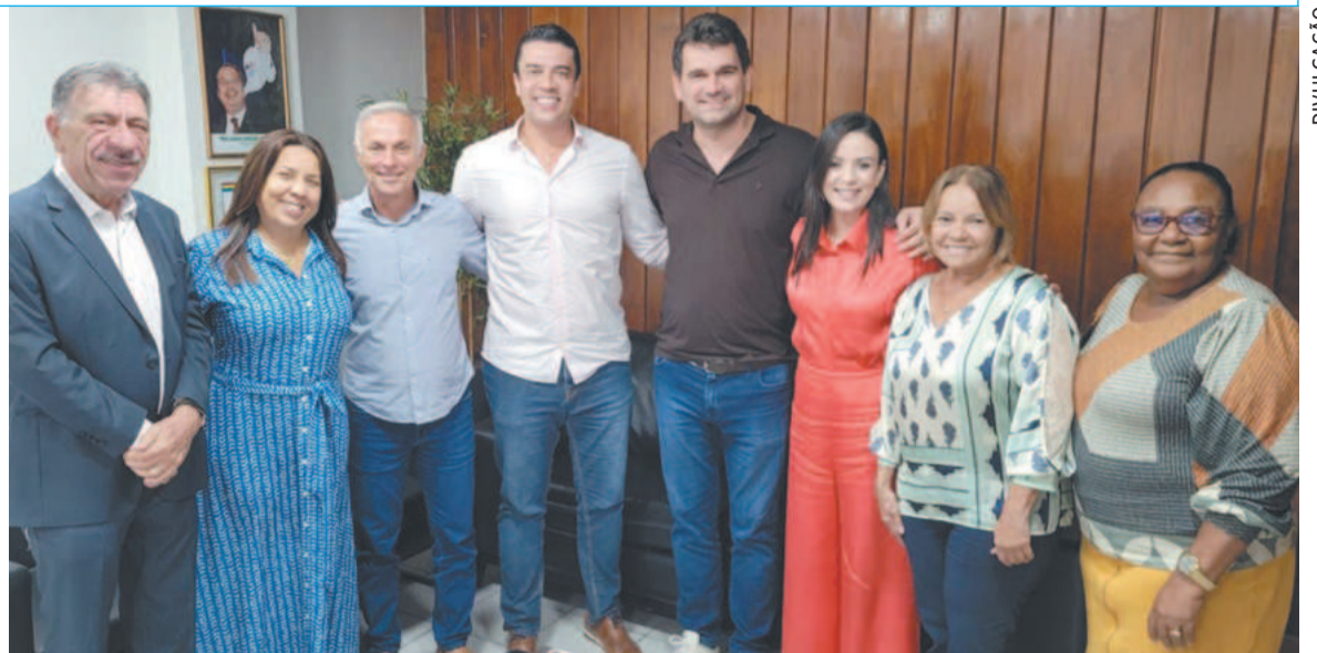
Amupe comemora acordo entre candidatos após semanas de especulação