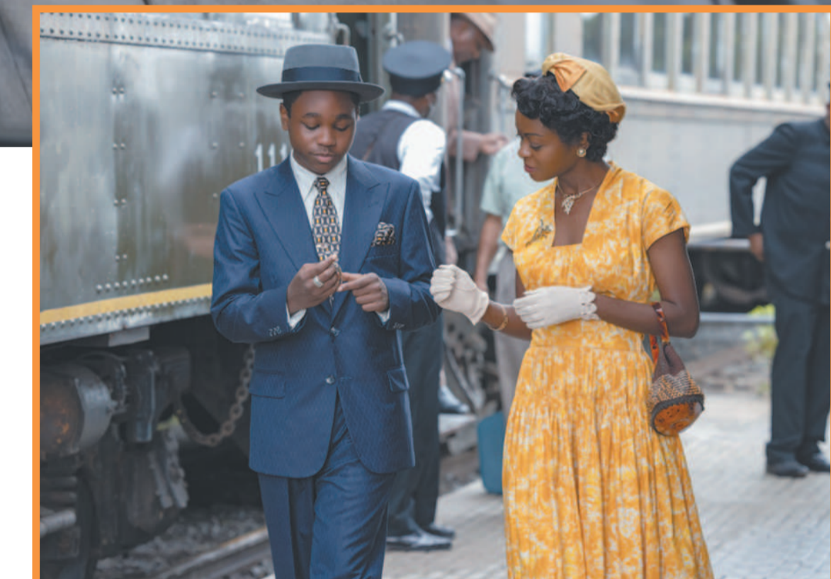
Obra retrata a morte de um jovem negro por ter assobiado para uma jovem branca

Till contextualiza em um prólogo o intenso laço afetivo entre Mamie e o filho, tal como a palpitação emocional dela em vê-lo pegar o trem. A luz quente no rosto dos atores e as interpretações cheias de vida de Danielle Deadwyler (inexplicavelmente esnobada no Oscar de melhor atriz) e de Jalyn Hall, no papel de Emmett, vêm carregadas de presságio, de uma atmosfera quase fugidia, que já indica uma pureza e uma inocência prestes a