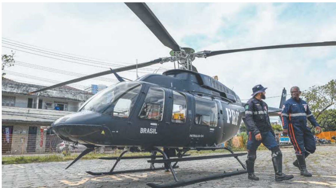
No Galo da Madrugada, o Samu usará a Estação Central do Metrô como heliporto e base