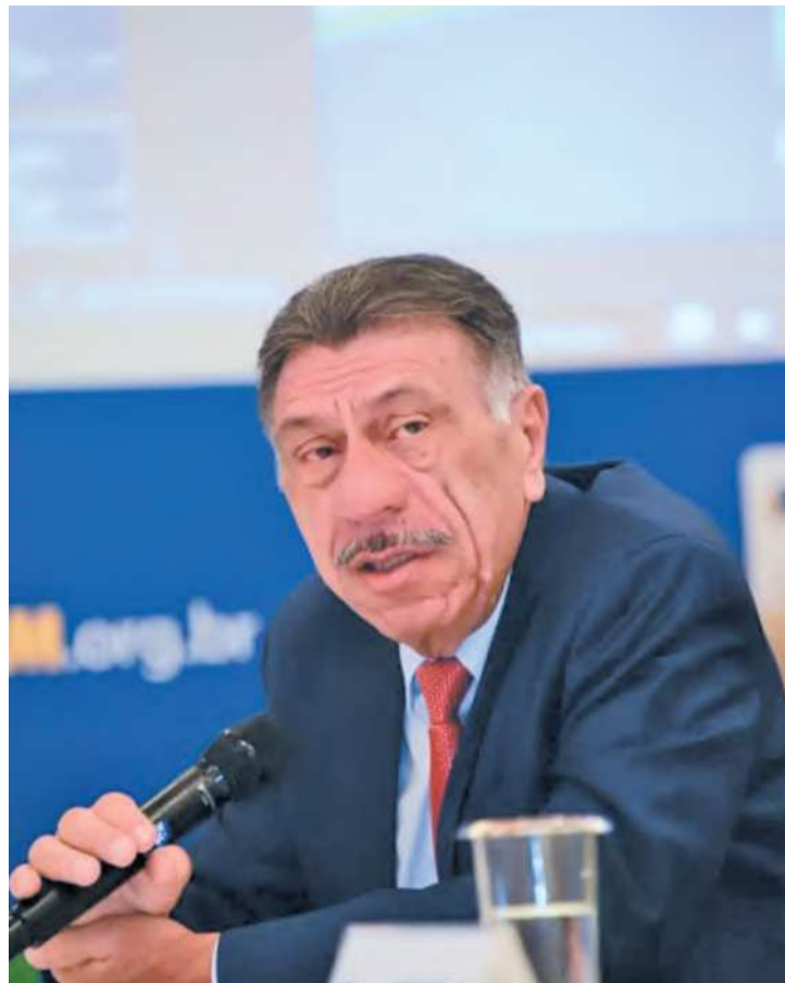
Patriota: “Fim do ISS prejudicaria o caixa das cidades”

gras para a arrecadação de recursos dos municípios, estados e da União.