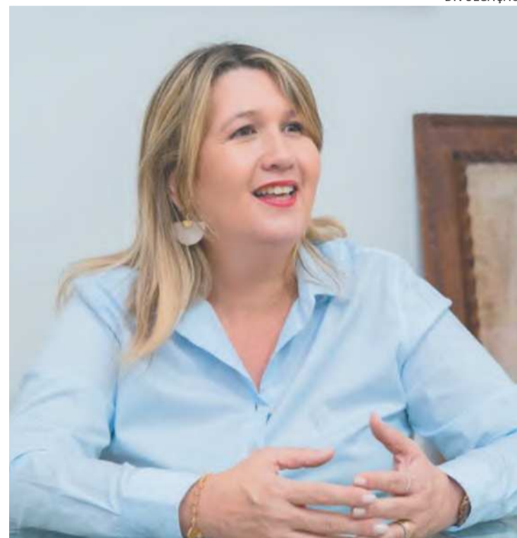
Ex-secretária de Lupércio criticou a falta de diálogo

“A medida restritiva de comercialização de marcas de bebidas e outros patrocinadores do carnaval, a apenas três dias do iní-