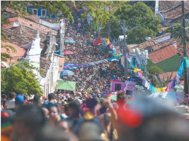
Após dois anos, cidade espera uma multidão para a folia