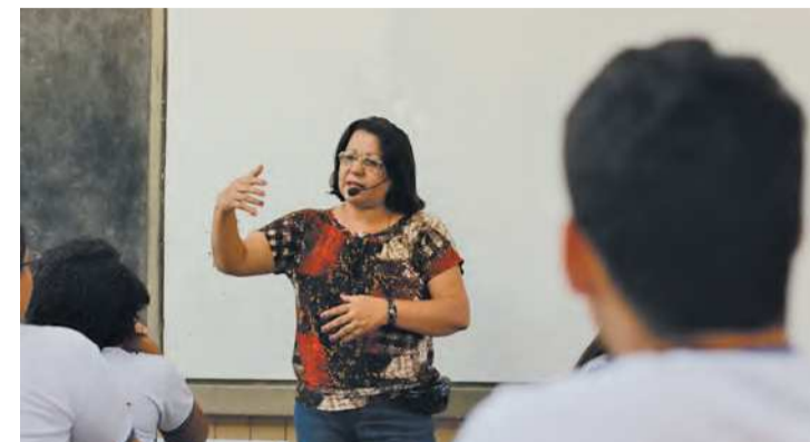
Fundo beneficia professores públicos do estado

O Governo de Pernambuco, por meio das secretarias de Administração (SAD) e de Educação e Esportes (SEE), divulgou, ontem, o calendário de pagamentos do abono dos precatórios do Fundo de Manutenção e Desenvolvimento do Ensino Fundamental e de Valorização do Magistério (Fundef) para os servidores ativos sem vínculos e herdeiros que não receberam a primeira parcela. Com essa ação mais de 11 mil pessoas serão beneficiadas. Para os herdeiros, o pagamento ocorrerá em 28 de fevereiro e para os servidores que não possuem mais vínculos, o repasse ocorrerá em 29 de março.