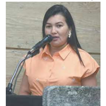
A vereadora negou envolvimento no crime