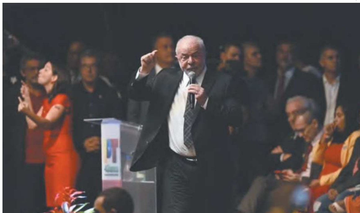
Presidente questionou a utilidade da autonomia da instituição e os benefícios ao país

O bilionário mercado de games do Brasil espera ansioso a aprovação do PL nº 2.796/21 que cria o Marco Legal para a indústria dos jogos eletrônicos e para os jogos de fantasia. O projeto está na Comissão de Assuntos Econômicos do Senado. No ano passado, o texto aprovado pela Câmara prevê que será livre a fabricação, importação, comercialização e dos jogos eletrônicos no Brasil.