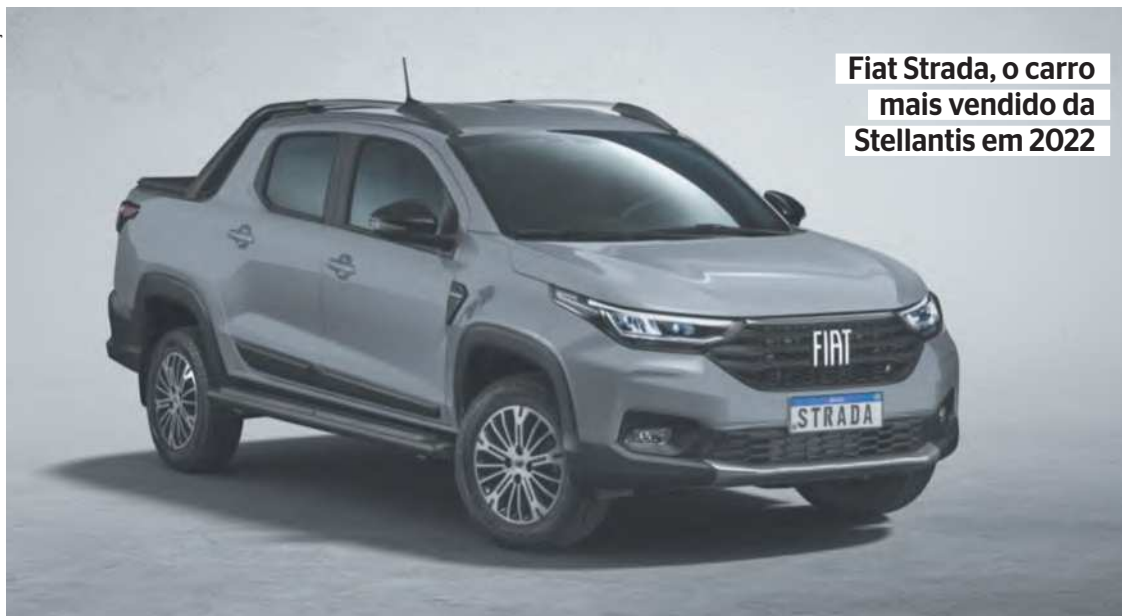
Fiat Strada, o carro mais vendido da Stellantis em 2022

vendas, com um crescimento 83% em relação a 2021, e assegurou à marca a terceira posição. O modelo com maior destaque foi a Ram 3500, lançada no final de março de 2022, com 2.201 vendas.