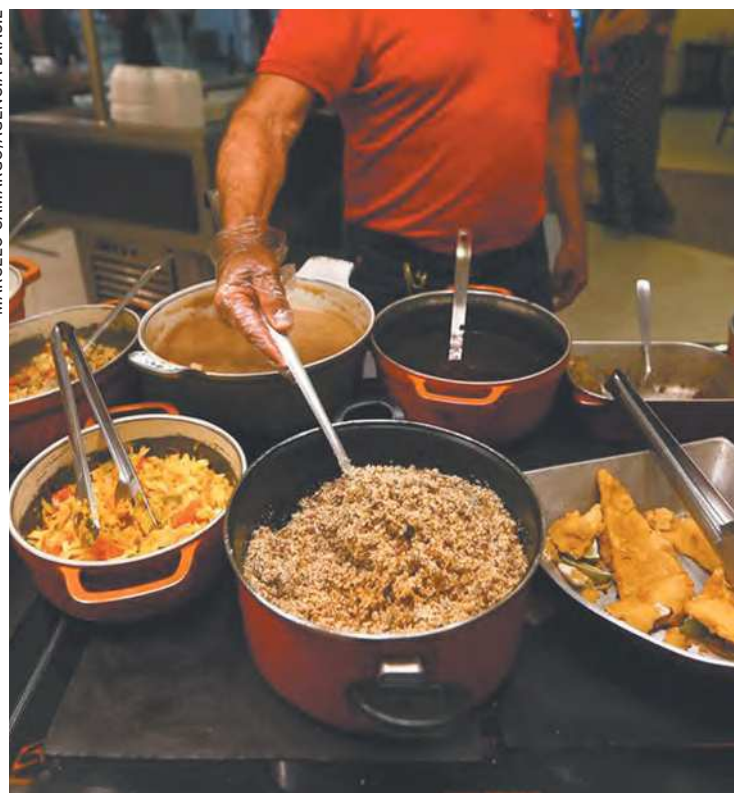
Custos estão entre as causas de se operar no vermelho

O total de empresas do setor de alimentação fora do lar que atua no vermelho no estado é considerado alto. Um levantamento da Associação Brasileira de Bares e Restaurantes em Pernambuco (Abrasel-PE), realizado entre 20 e 29 de janeiro, indica que cerca de 16% delas funcionam em tais condições.