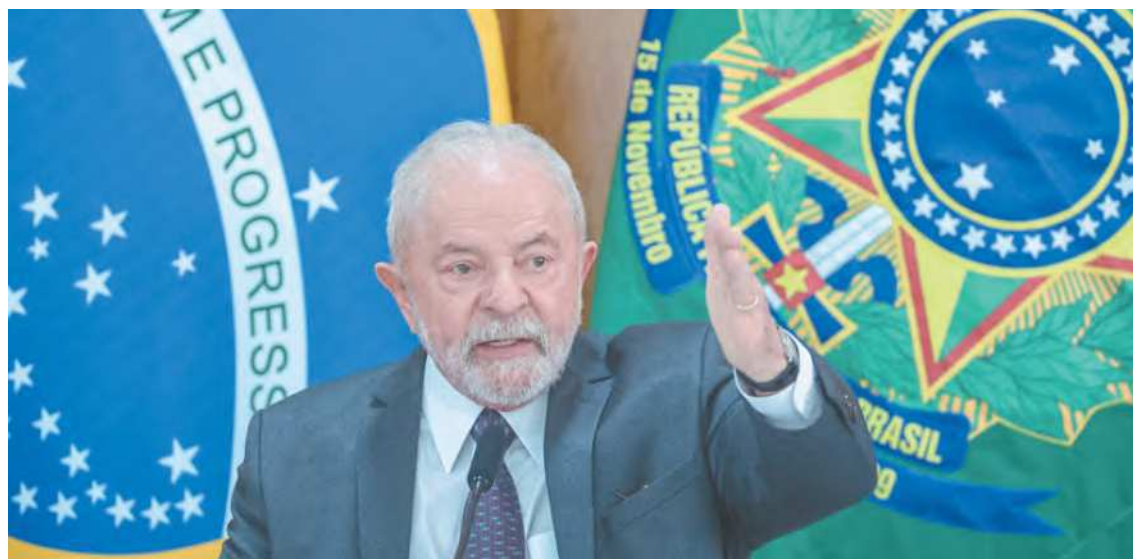
Atualização da tabela será realizada de maneira gradativa, segundo o presidente

Desde então, ocorreram ajustes parciais e o mais recente foi em 2016, no governo Dilma Rousseff (PT), sem ter ocorrido mudanças nas gestões Michel Temer (MDB) e Jair Bolsonaro (PL). Em 2016, a faixa de isenção do IRPF passou de R$ 1.877,77 para R$ 1.903,98. (Da Redação com agências)