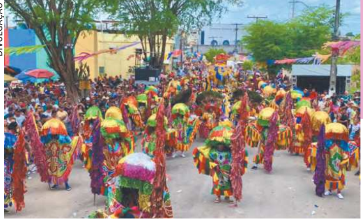
Maracatu Rural voltou a reinar em Nazaré da Mata