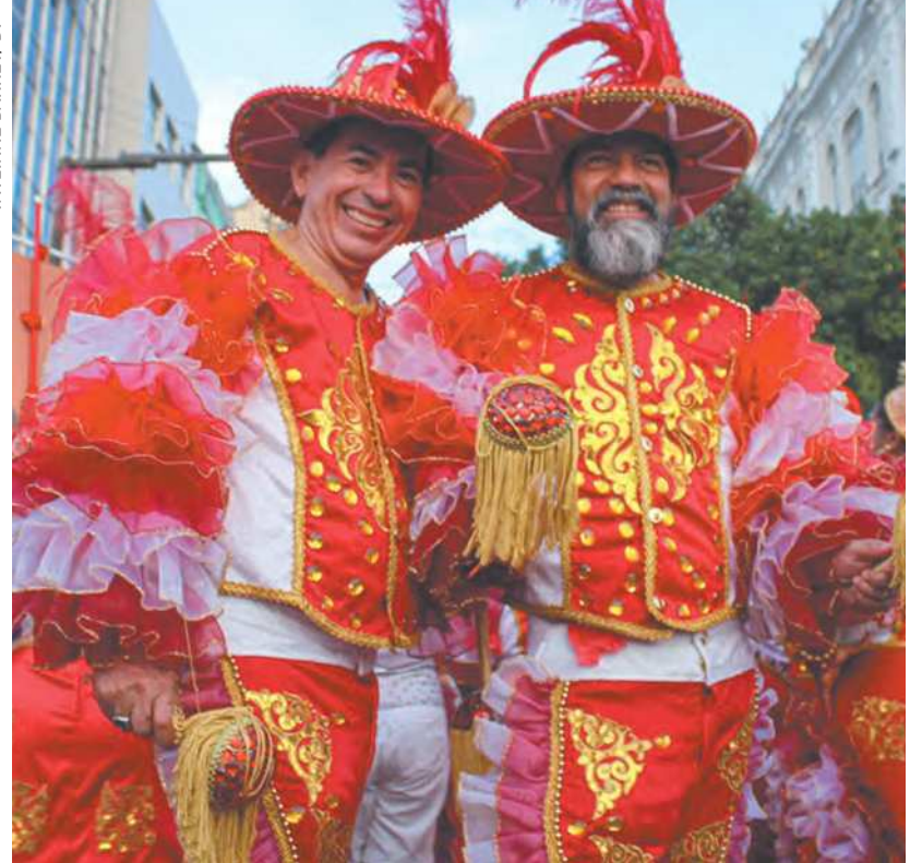
Foi também o reencontro dos blocos líricos com o Recife