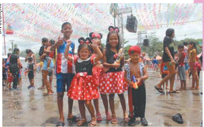
Paudalho teve festas infantis em sua folia