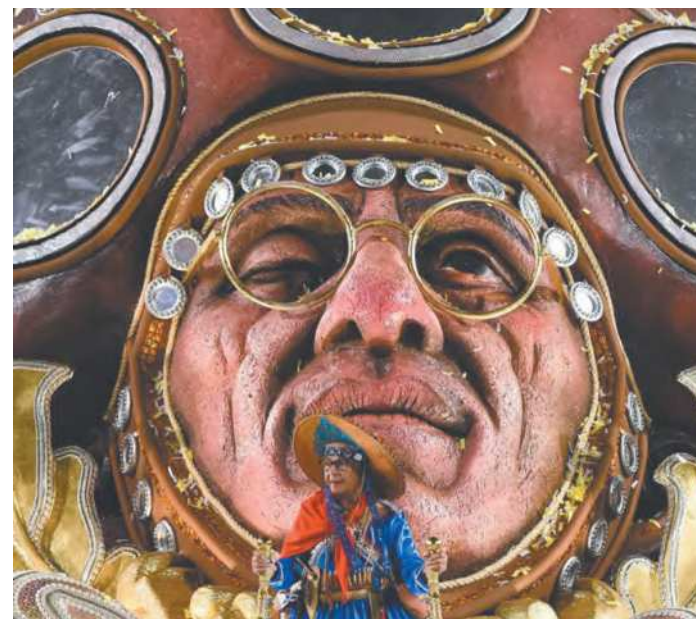
Enredo foi inspirado em dois cordéis sobre Lampião

A Imperatriz, que completa 64 anos no próximo dia 6 de março, é detentora de nove títulos do grupo principal, conquistados em 1980, 1981, 1989, 1994, 1995, 1999, 2000, 2001 e 2023. Em 1980, 1989 e 2001 obtendo nota máxima em todos os quesitos. Desfilou pela primeira vez em 1960, com um enredo em homenagem à Academia Brasileira de Letras. (Agência Brasil)