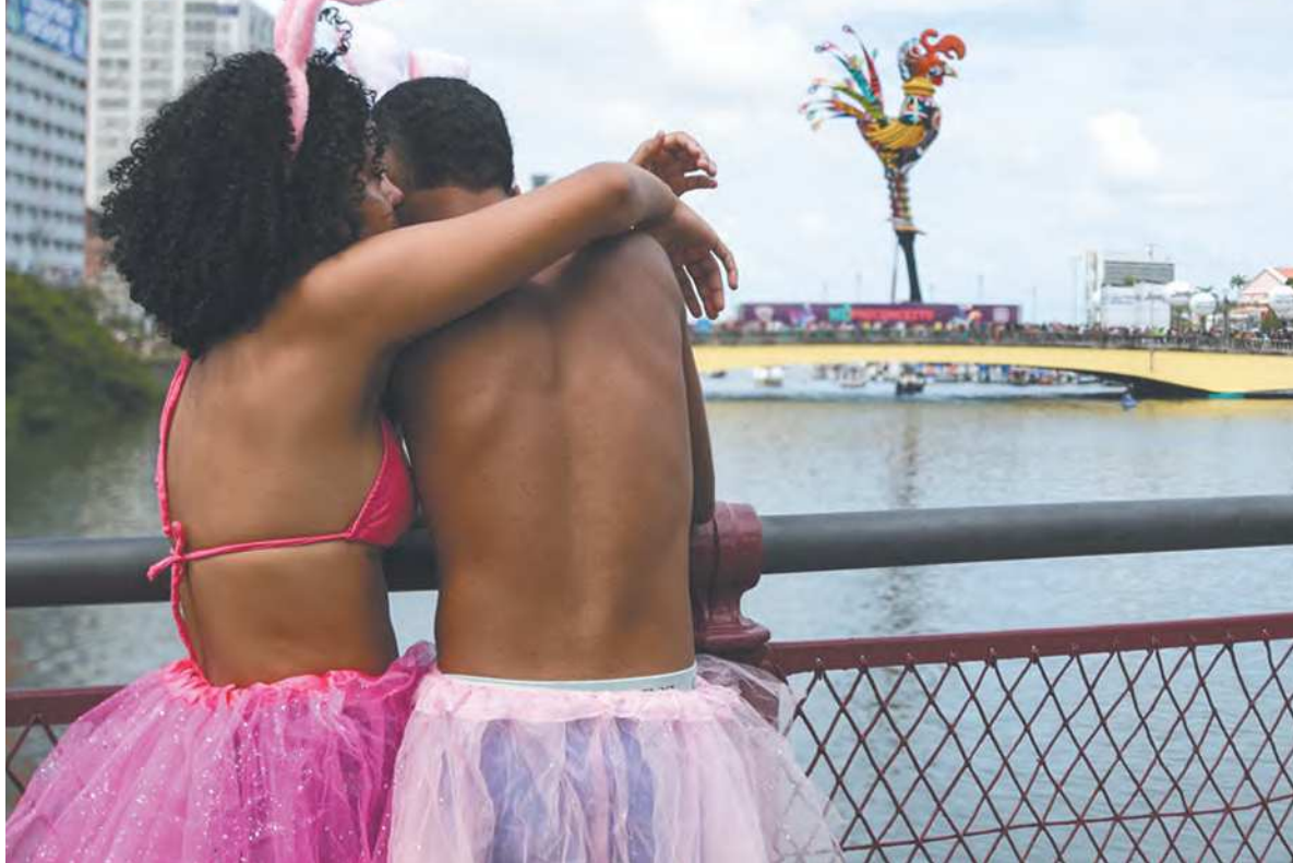
Quantos amores viram o primeiro carnaval? Quantos começaram? Quantos terminaram?