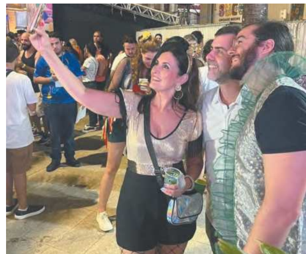
Fátima Bernardes, Marcelo Freixo e Túlio Gadelha