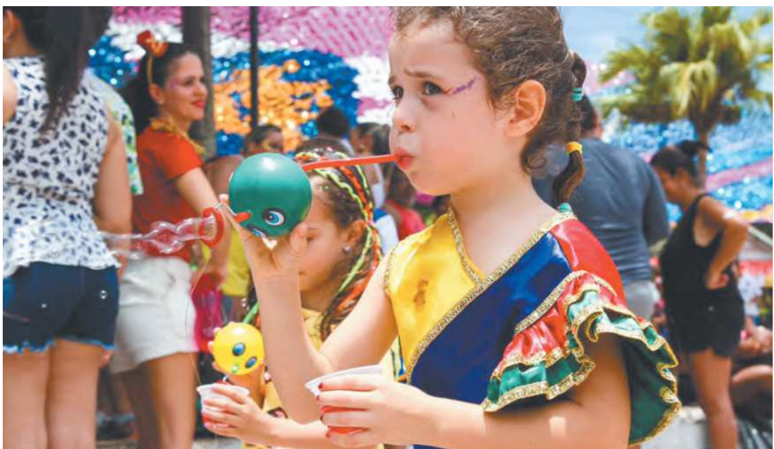
Bloquinhos, geralmente matutinos, fizeram a alegria também dos pequenos foliões