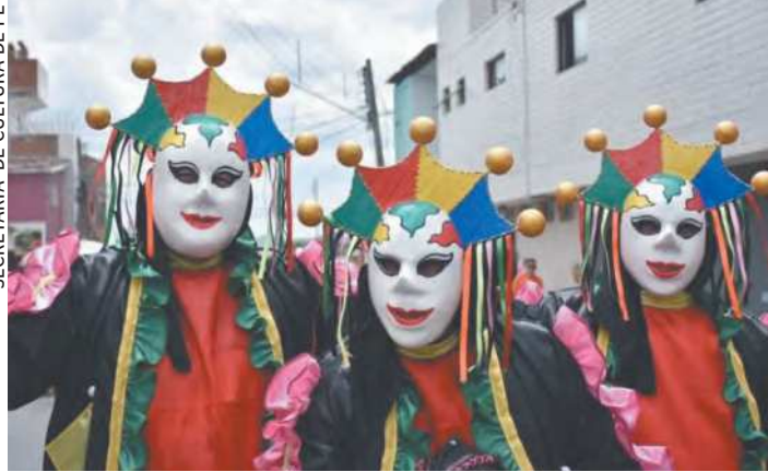
Bezerros estava com saude de seus papangus