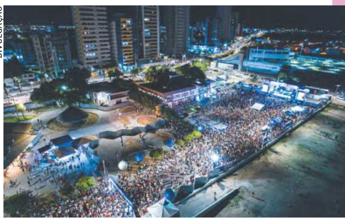
Em Petrolina, 150 mil foliões se divertiram