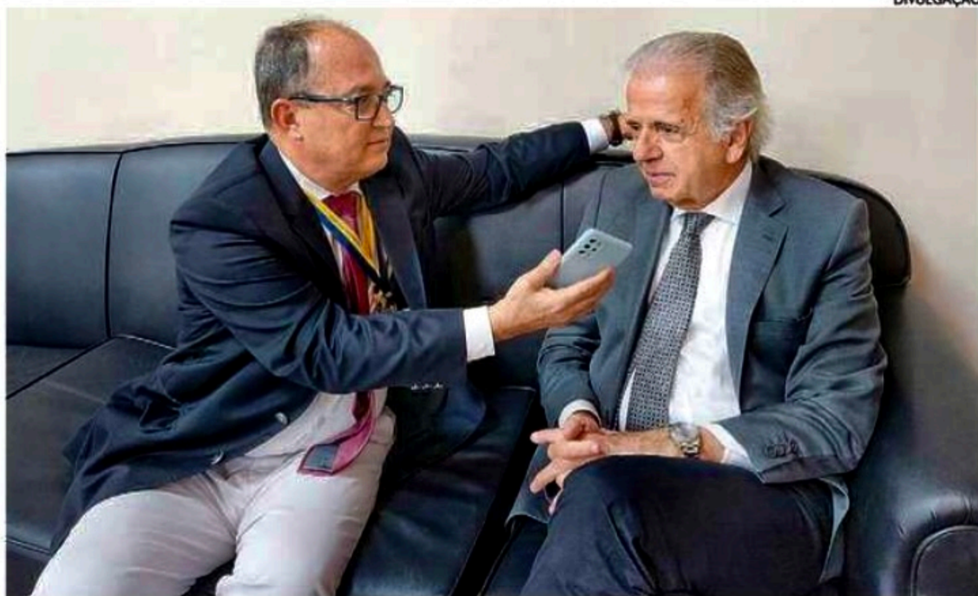
Ministro conversou com a Folha de Pernambuco e ressaltou entusiasmo com a Escola de Sargentos

Em maio de 2022, antes de eleição, ao saber quem iria vencer as eleições, ele foi, dentro dos critérios que o Exército usa, designado que em março de 2023 assumiria um comando do Estado de Goiás. Depois disso, agora no final, algumas sus-