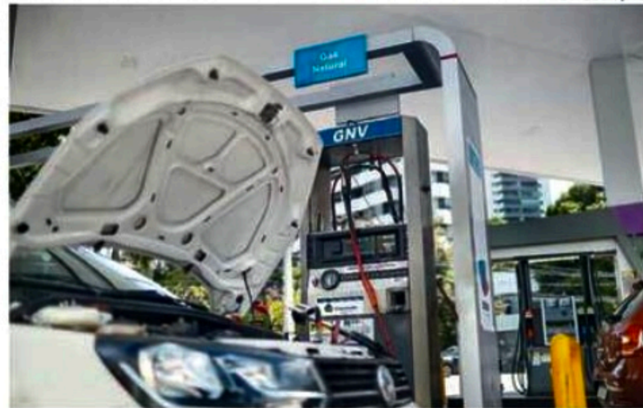
Queda no preço reflete ampliação no número de empresas supridoras

Para o secretário de Desenvolvimento Econômico de Pernambuco, Guilherme Cavalcanti, o corte no preço ajudará a aquecer a economia do Estado. "Essa redução no preço possibilita que os diversos setores atendidos pela Copergás consigam melhores resultados. E esses efeitos positivos podem ser sentidos tanto no veículo que utiliza o GNV quanto nas indústrias e no setor de servi-