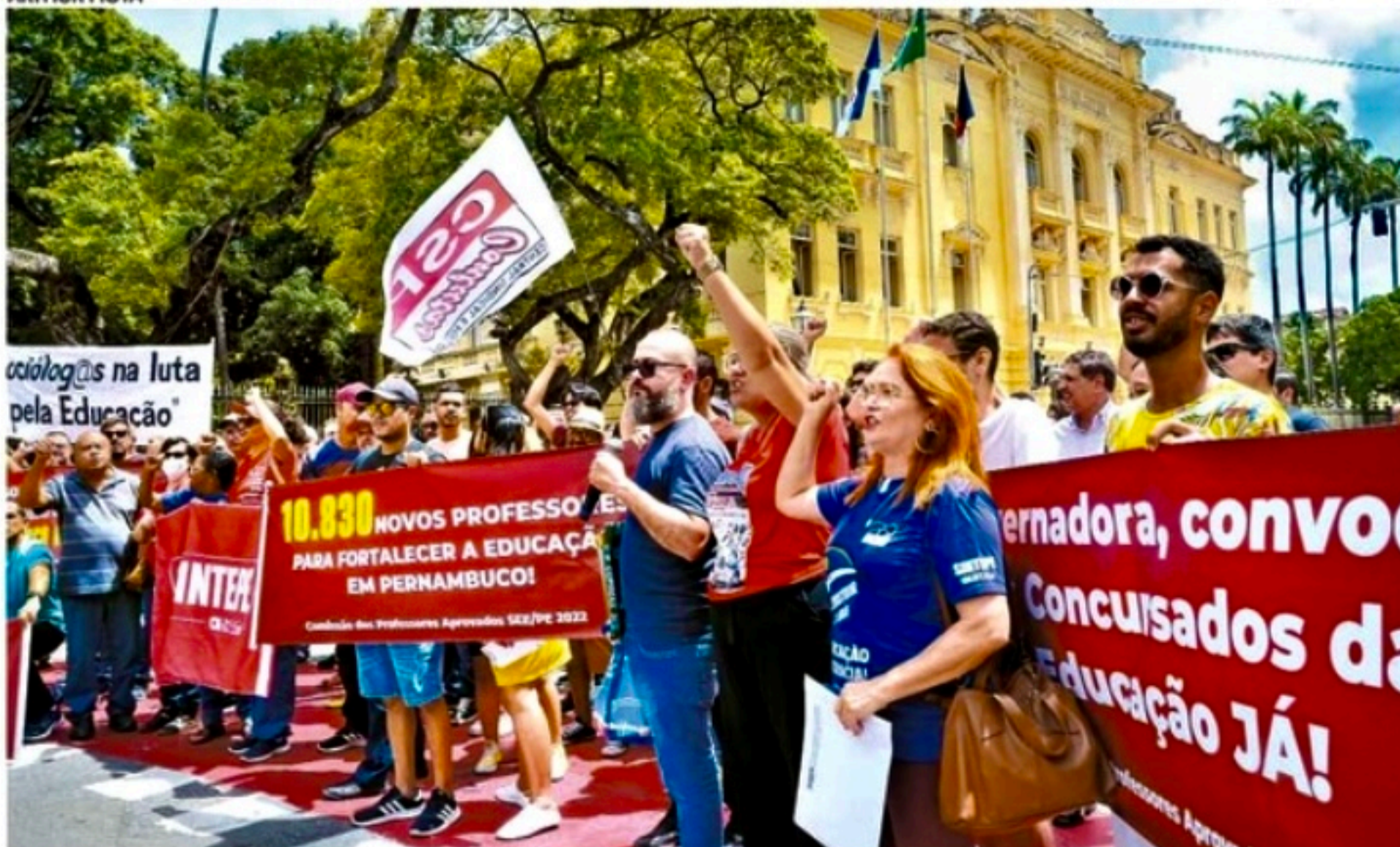
Candidatos que passaram em concurso fizeram manifestação em frente ao Palácio das Princesas