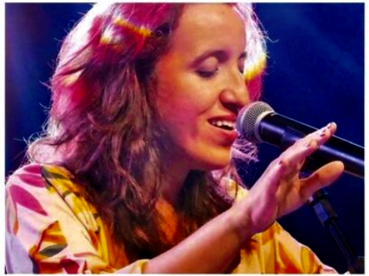
Mais de 40 pessoas estiveram envolvidas no projeto