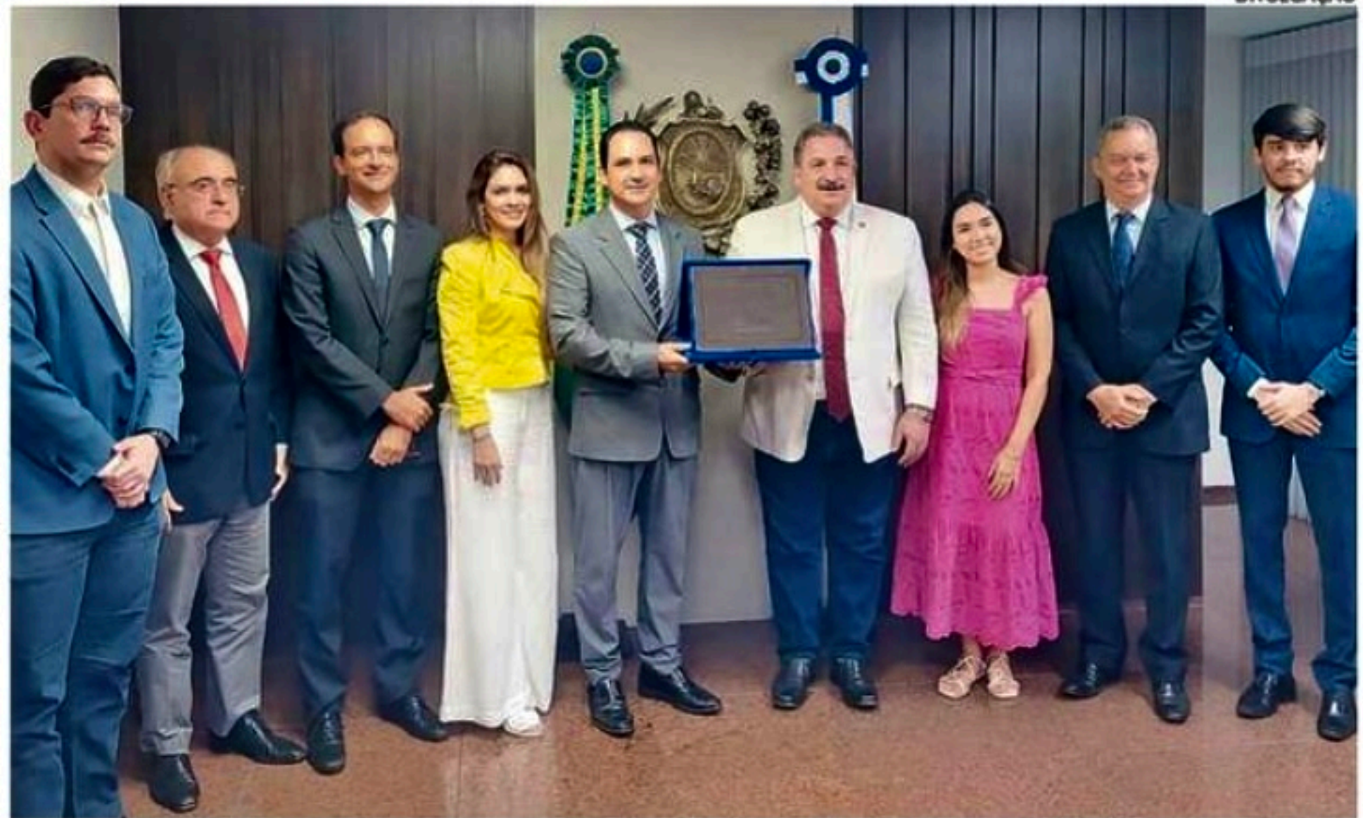
A família recebeu, das mãos do então presidente da Alepe, a placa simbólica da Rodovia Luiz Magalhães