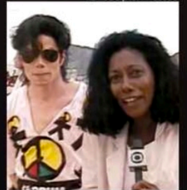
Histórico: entrevista com Michael Jackson, no Brasil