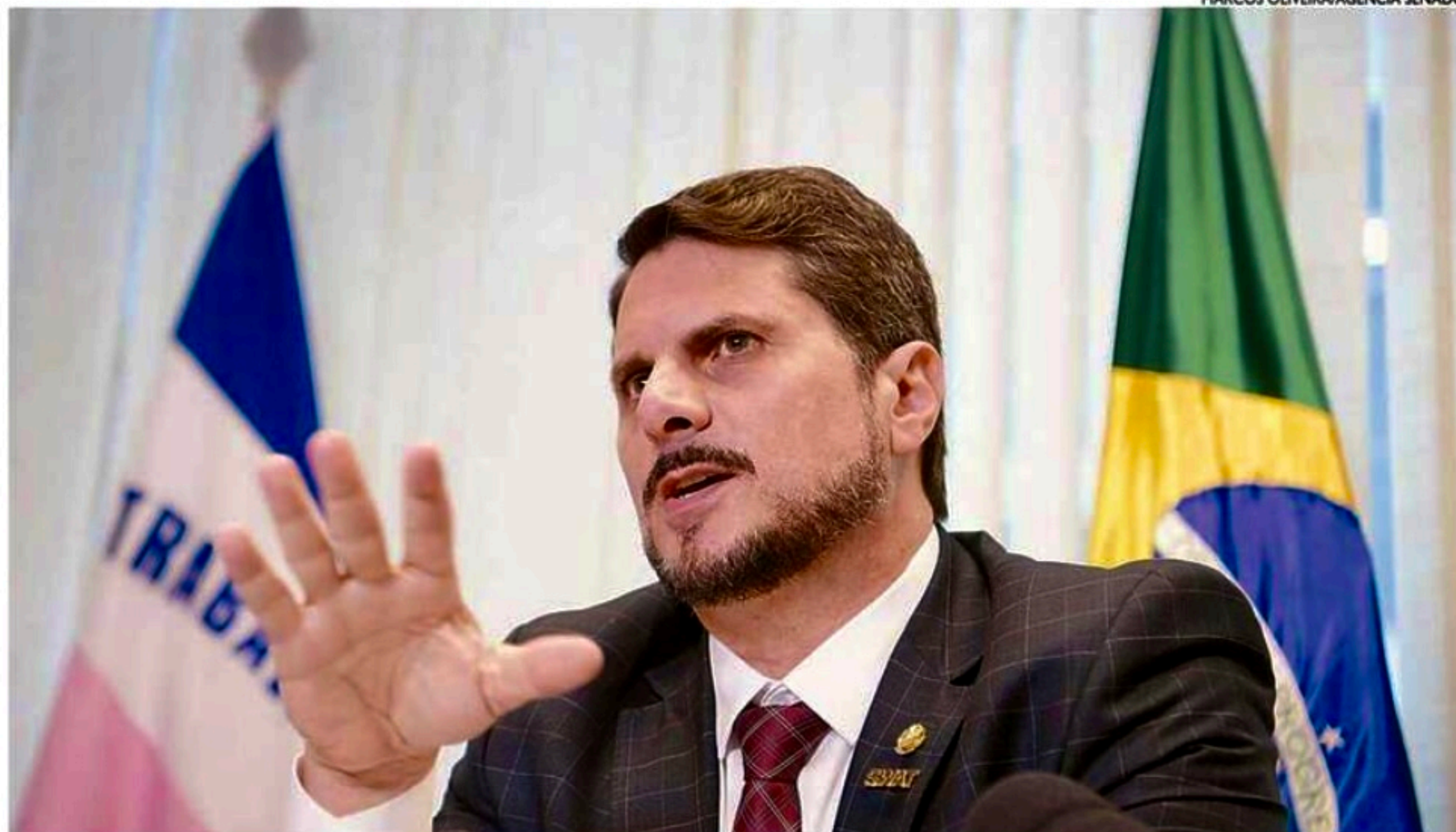
Marcos Do Val disse que a sugestão era induzir o ministro Alexandre de Moraes a dizer que teria "ultrapassado os limites da Constituição"

■ Depois de acusar o ex-presidente Jair Bolsonaro de ter lhe pressionado a dar um golpe, o senador Marcos Do Val acabou apresentando novas versões