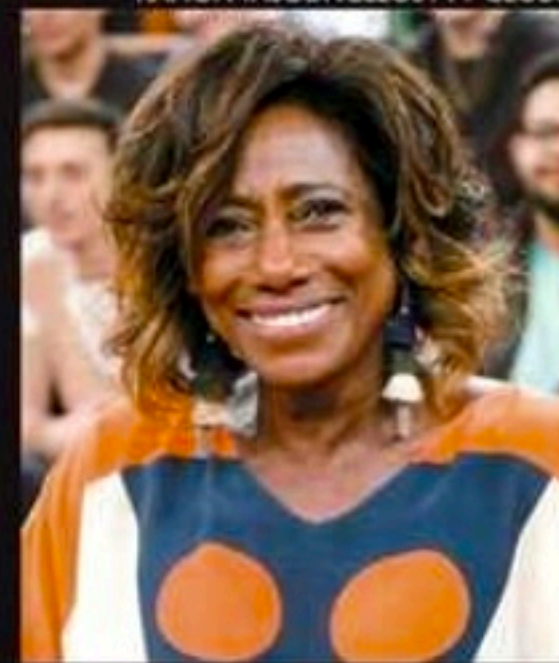
Ela inventou formas de fazer jornalismo, diz William Bonner