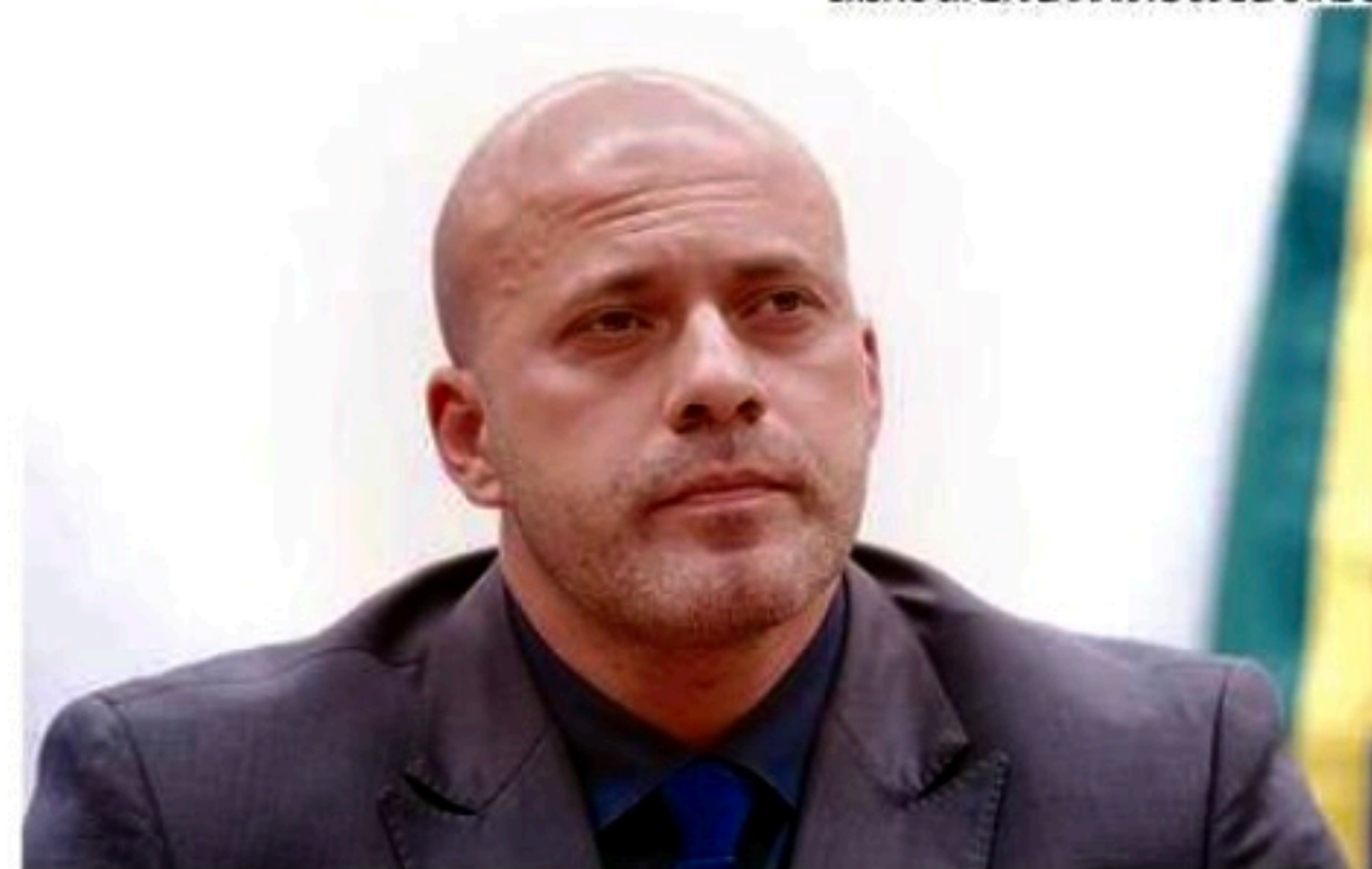
O ex-parlamentar descumpriu as medidas cautelares impostas a ele

Na decisão, Moraes diz que Silveira agiu com "completo desrespeito e deboche" diante de decisões do Supremo. O ministro destacou que o ex-deputado danificou a tornozeleira eletrônica que tinha