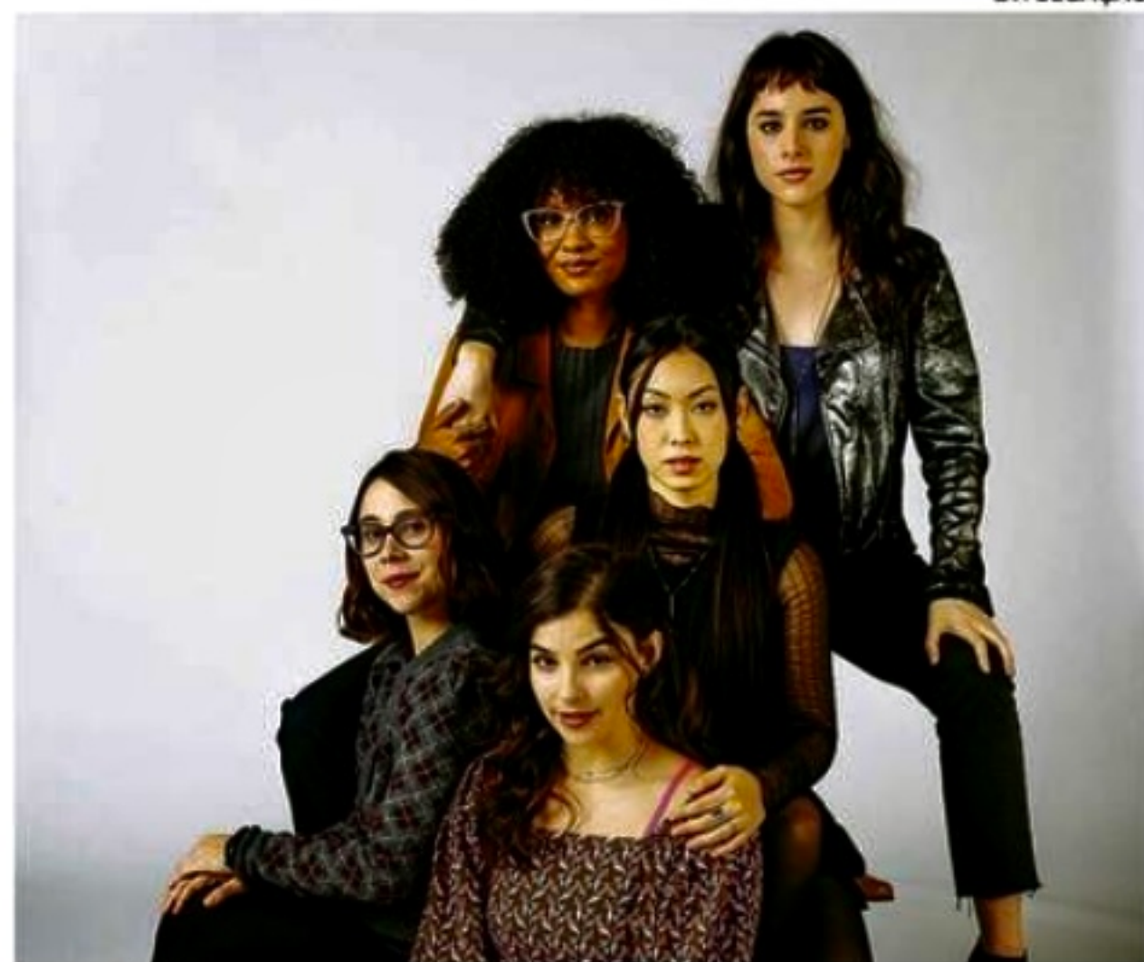
Cinco amigas, vários dilemas e afeto em uma história