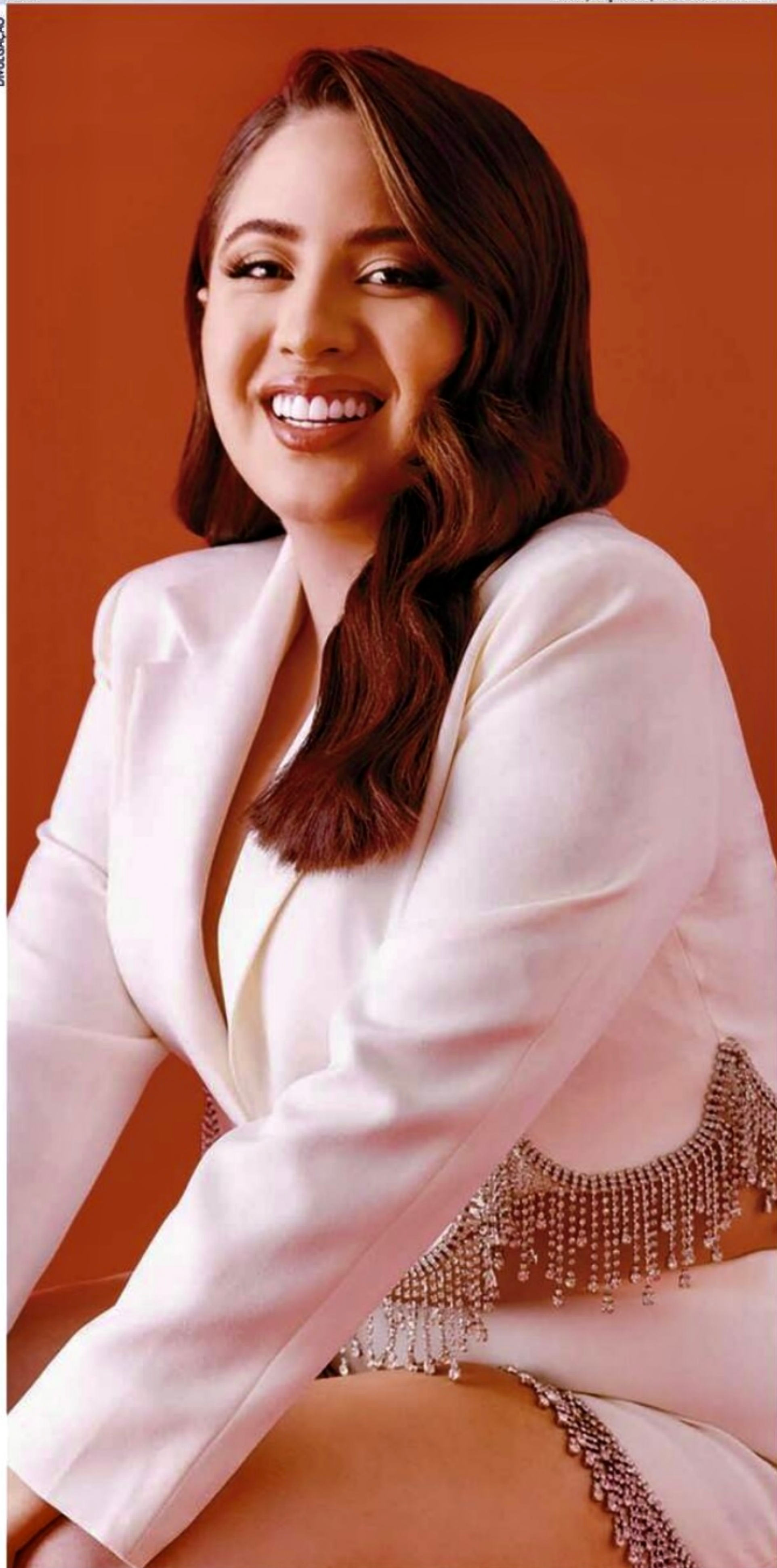
Em recente prévia carnavalesca no Recife, Mari confirmou a gravação do seu 2º DVD para março, em São Paulo

“A galera pode esperar muitas novidades no DVD. Tem muita participação boa, música boa. É meu segundo DVD, estamos preparando tudo do melhor jeito, gravando em São Paulo, uma cidade que sempre sonhei em fazer show, e gravar um