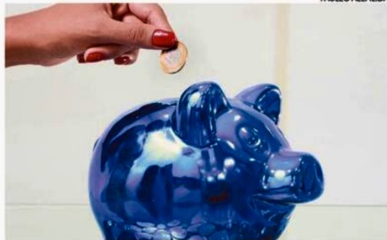
Os brasileiros sacaram R$ 33,63 bilhões a mais do que depositaram