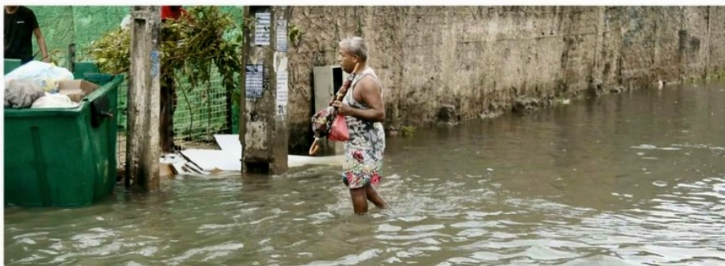
Avenida Presidente Kennedy, em Olinda, voltou a alagar, dificultando a vida dos moradores