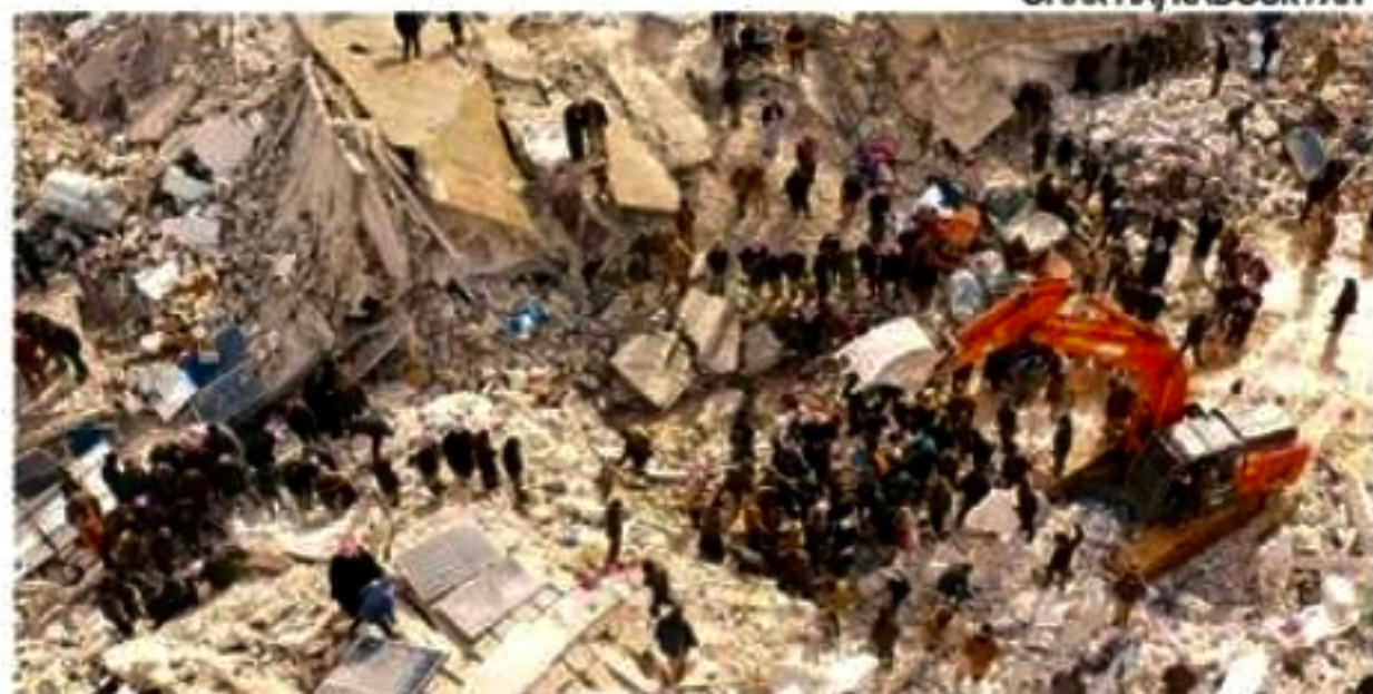
Equipes trabalham sem parar na busca de encontrar sobreviventes