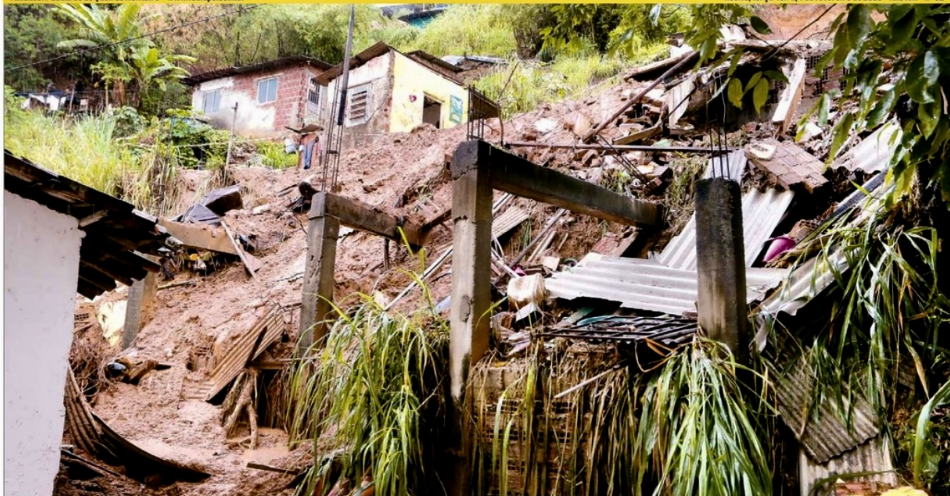
Em Águas Compridas, Olinda, uma barreira deslizou e atingiu duas casas, matando o motoboy Israel e ferindo cinco pessoas

Recife, terça-feira, 7 de fevereiro de 2023 Ano XXV nº 32