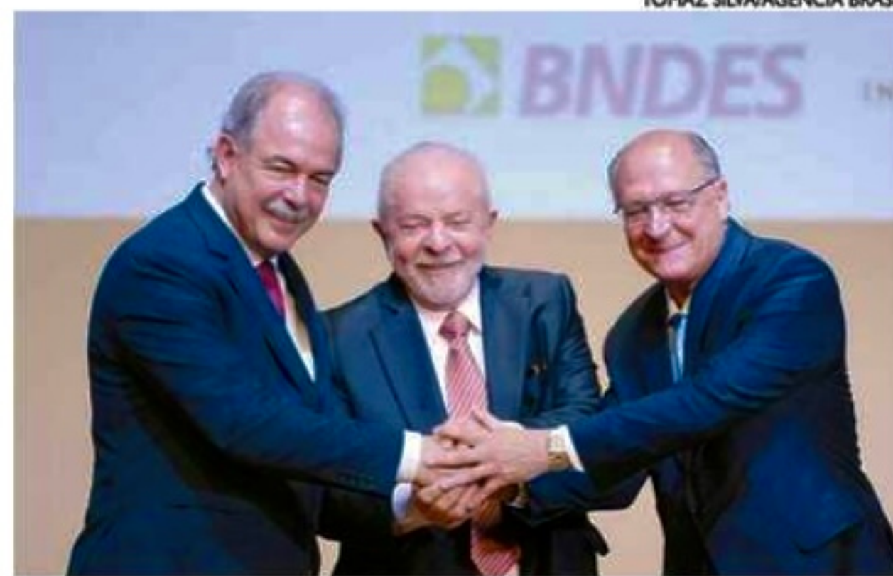
Lula e Alckmin estiveram na posse de Mercadante no BNDES, no Rio

Os advogados do ex-secretário de Segurança Pública do Distrito Federal Anderson Torres pediram ontem (6) ao Supremo Tribunal Federal (STF) a revogação da prisão preventiva a que ele está submetido. Torres, que estava à frente da pasta no dia 8 de janeiro, alega que não teve culpa nas falhas de segurança que permitiram os atos terroristas e aponta uma possível omissão do Exército e do Gabinete de Segurança Institu-