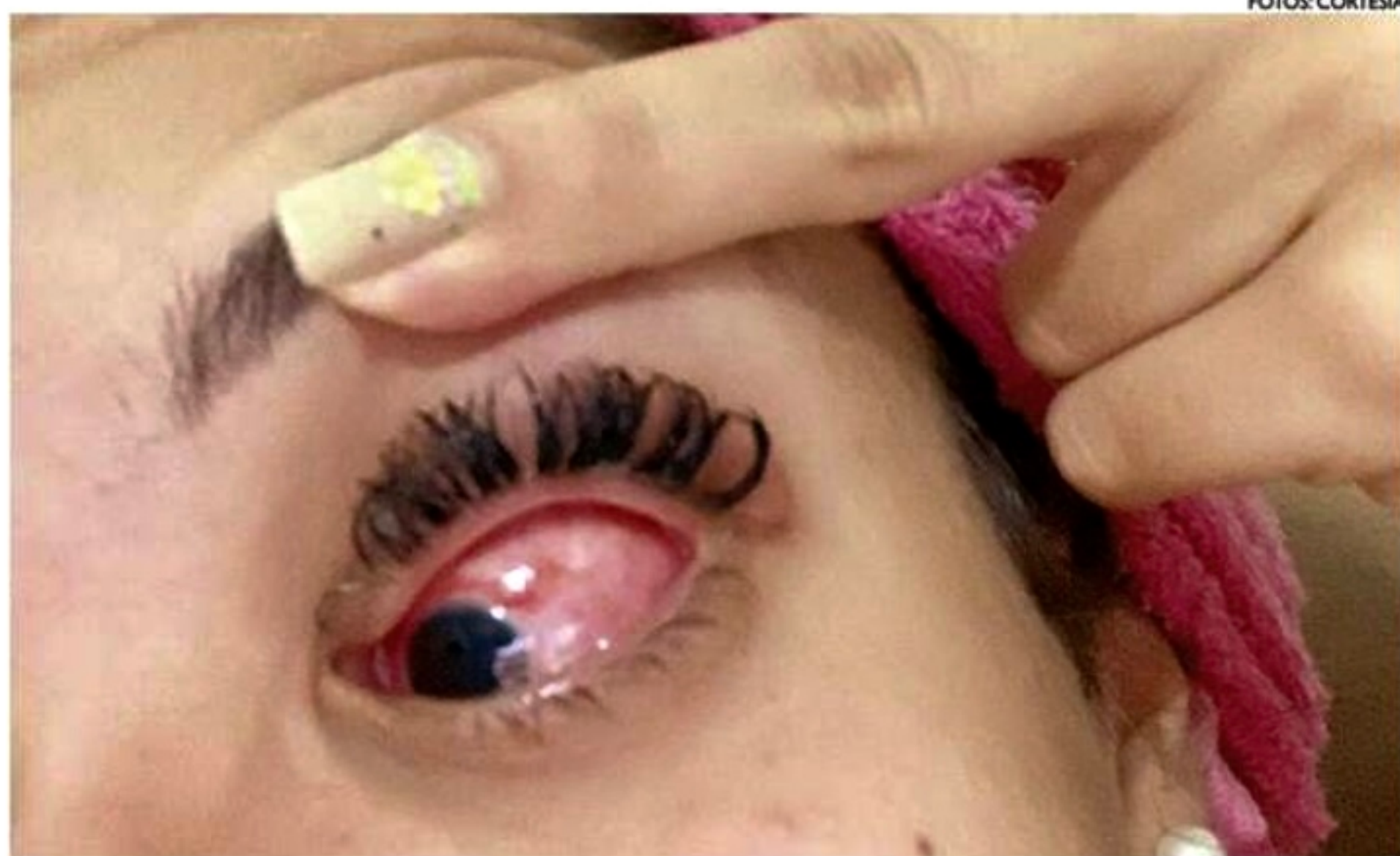
Pacientes relataram dores nos olhos e visão turva. Dependendo da exposição, pode causar cegueira

Como explica o especialista, a reação se dá após o produto presente na pomada escorrer pelos fios e entrar em contato com os olhos, o que costuma ocorrer por meio da água (do banho, chuva, piscina, etc.) ou pelo suor, por exemplo. No entanto, ainda não se sabe