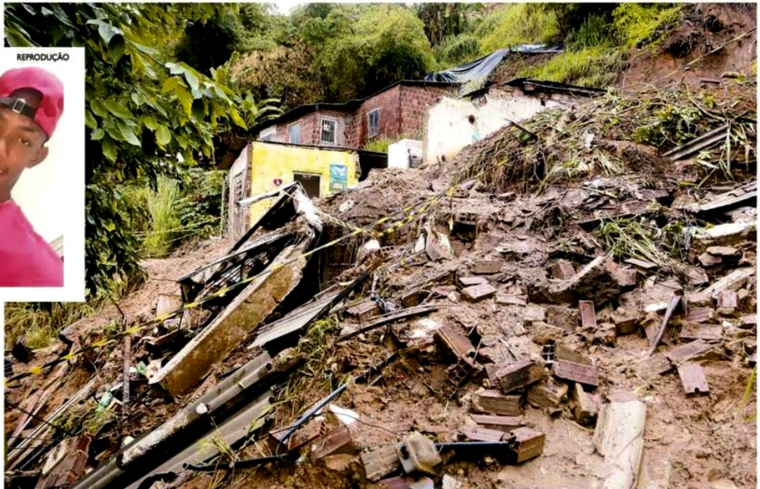
Deslizamento no bairro de Águas Compridas, em Olinda, ocorreu no início da manhã de ontem, deixando cinco feridos e um morto