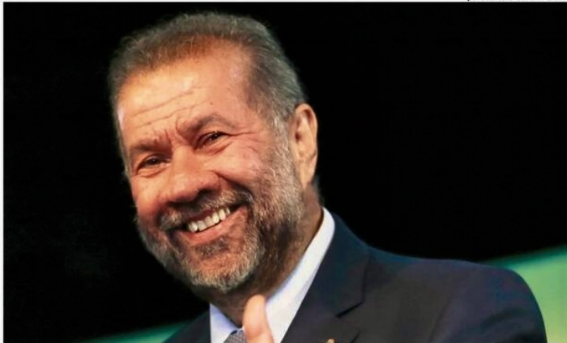
O ministro Carlos Lupi explica que o cartão vai concentrar direitos e terá validade nacional