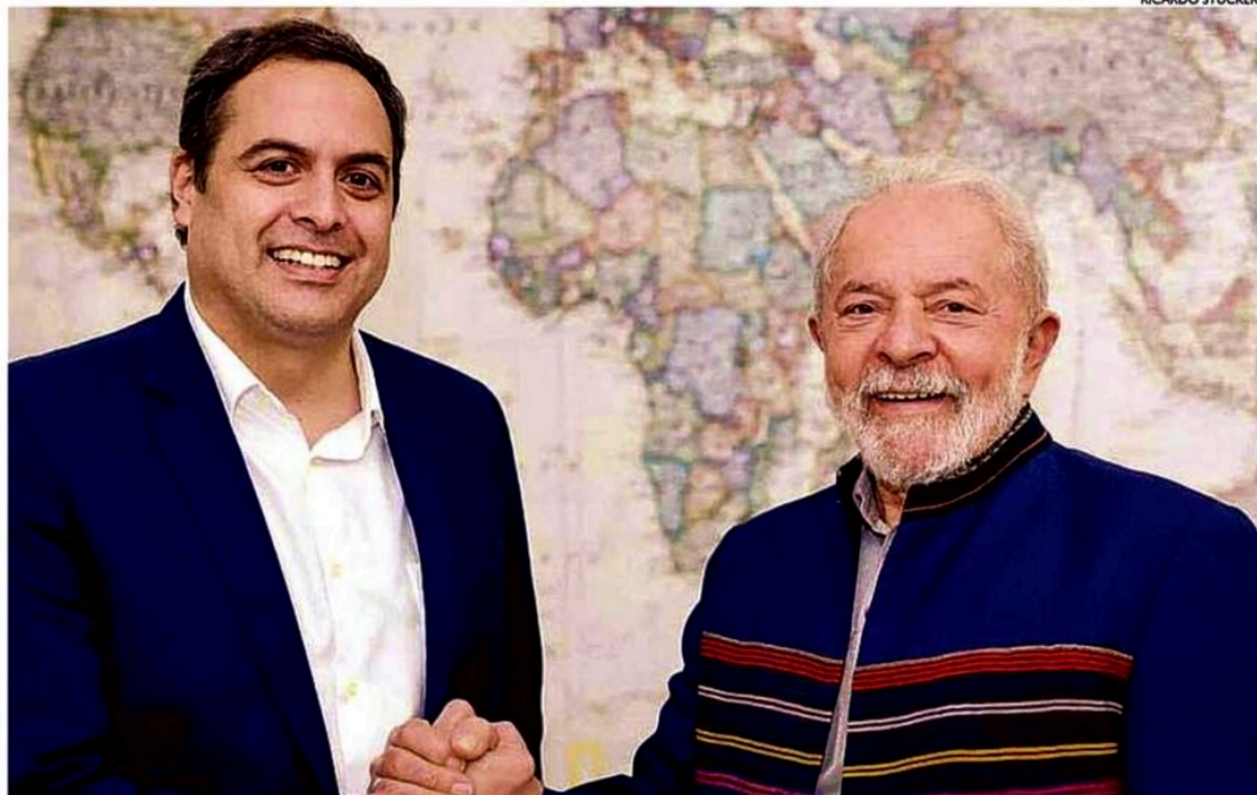
Lula e Paulo Câmara estiveram juntos ontem em Brasília. O Banco é a maior instituição de desenvolvimento regional da América Latina