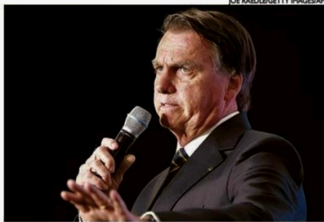
Jair Bolsonaro é investigado pelos ataques ao sistema eleitoral