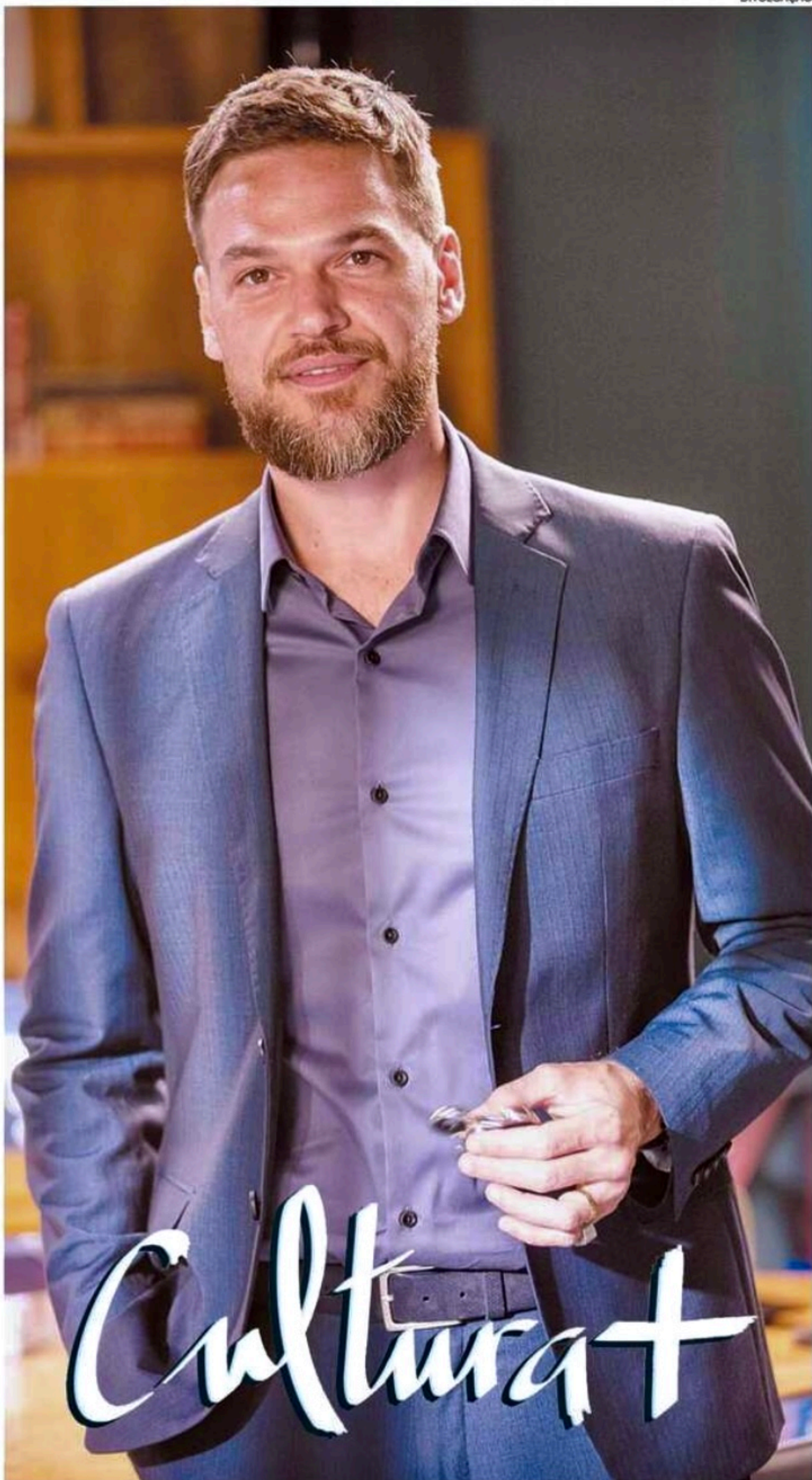
Ator celebra retorno às novelas em "Vai na Fé"