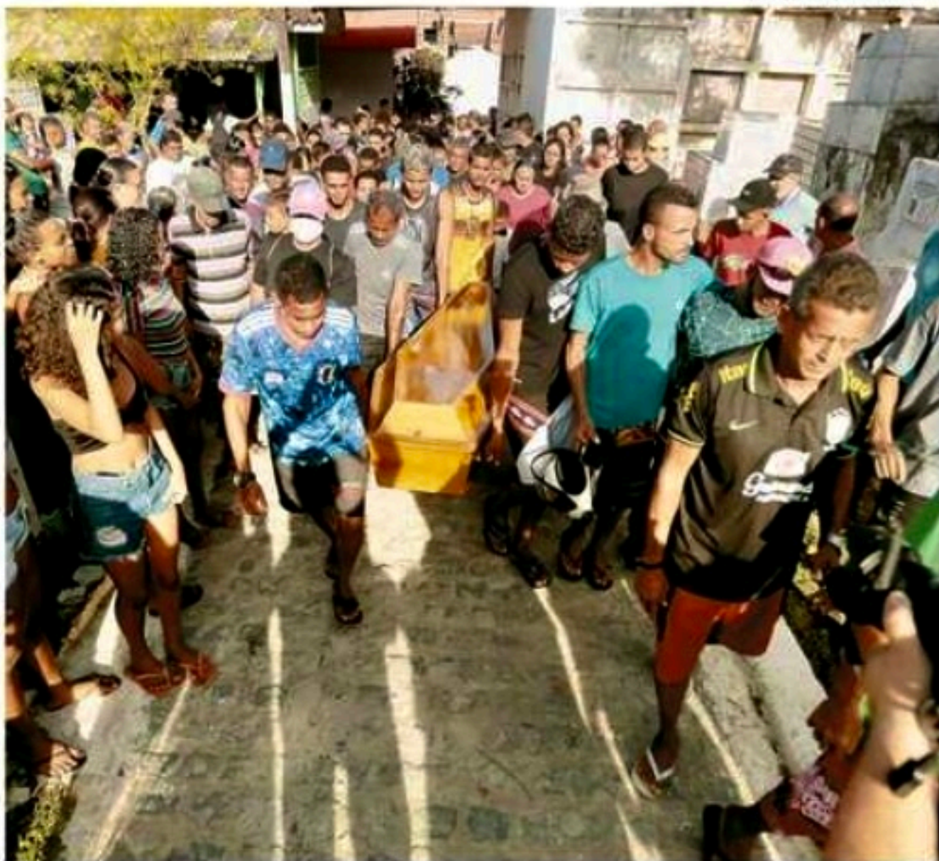
Sepultamento de Israel aconteceu no Cemitério de Águas Compridas