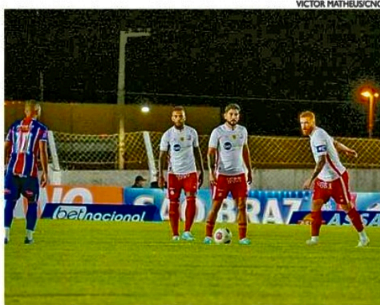
Alvirrubro chegou a 12 pontos no Campeonato Pernambucano