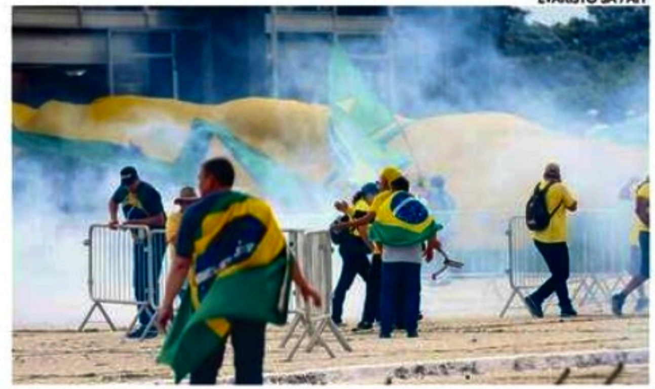
A Lesa Pátria vem atuando para investigar todos os envolvidos

Os outros presos são o major da PM Flávio Silvestre de Alencar, o ca-