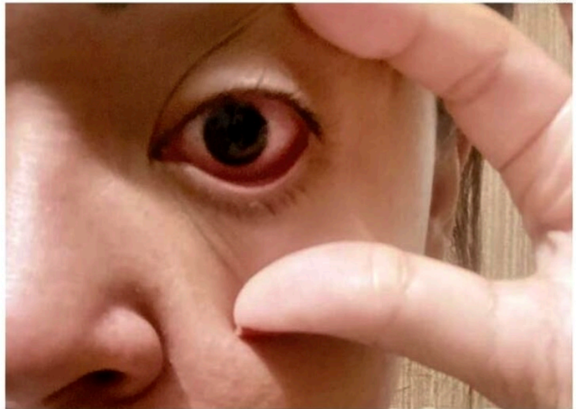
Sintomas relatados por pacientes são vermelhidão, dor intensa nos olhos e na cabeça, ardência e visão embaçada

O consumidor, ainda segundo o Procon, pode pedir a devolução do valor investido no produto. E em caso de negativa, realizar um pro-