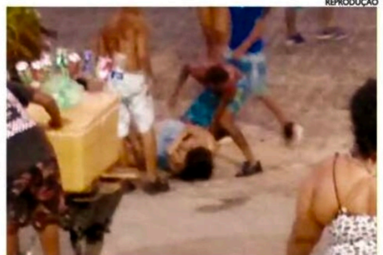
Cenas de violência também foram registradas no Sítio Histórico de Olinda

"Isso é comum no pré-Carnaval, esses assaltos, essa violência. Roubaram o celular do casal, roubaram tudo. Eles andam em galeira, às vezes sete rapazes, voam para cima da pessoa, pegam tudo. Foi o que aconteceu aqui. Roubaram o celular, chutaram, espancaram. Isso é comum aqui no Sítio Histórico, ninguém aguenta mais", desabafou a moradora. "Quando