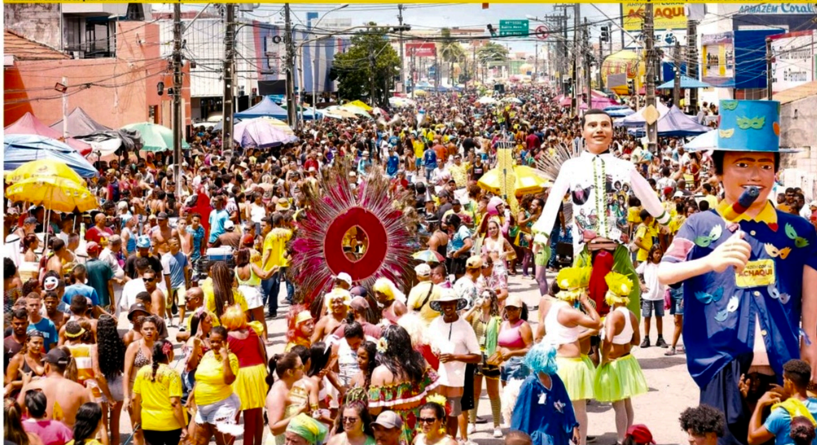
Uma multidão acompanhou o desfile das Virgens do Bairro Novo, em Olinda, ontem

Recife, segunda-feira, 13 de fevereiro de 2023 Ano XXV nº 37