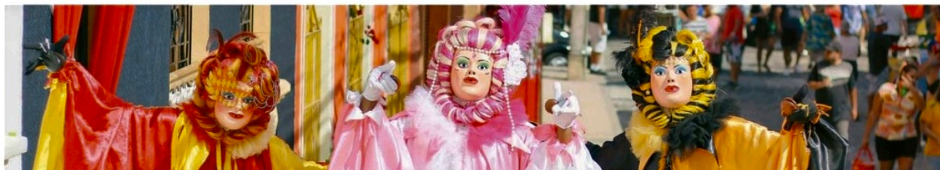
No Sítio Histórico, durante o dia, uma mistura de cores enfeitava as ladeiras em meio aos blocos

Agora falta pouco para o Carnaval chegar oficialmente. Mas enquanto isso, Recife e Olinda têm uma agenda intensa de prévias que prometem arrastar foliões. Confira o que está programado para polos como Praça do Arsenal, Marco Zero, Pátio do Terço, entre outros locais. Na Marim dos Caetés, vale conferir a Praça do Carmo. É frevo no pé! COTIDIANO >> PÁGINA 5