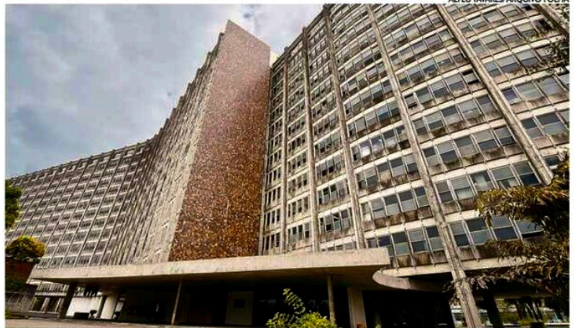
Abertura de espaço na Sudene seria uma forma de contemplar partidos da base, como o SD, Avante e PV

A coluna de Edmar Lyra é publicada de segunda a sábado