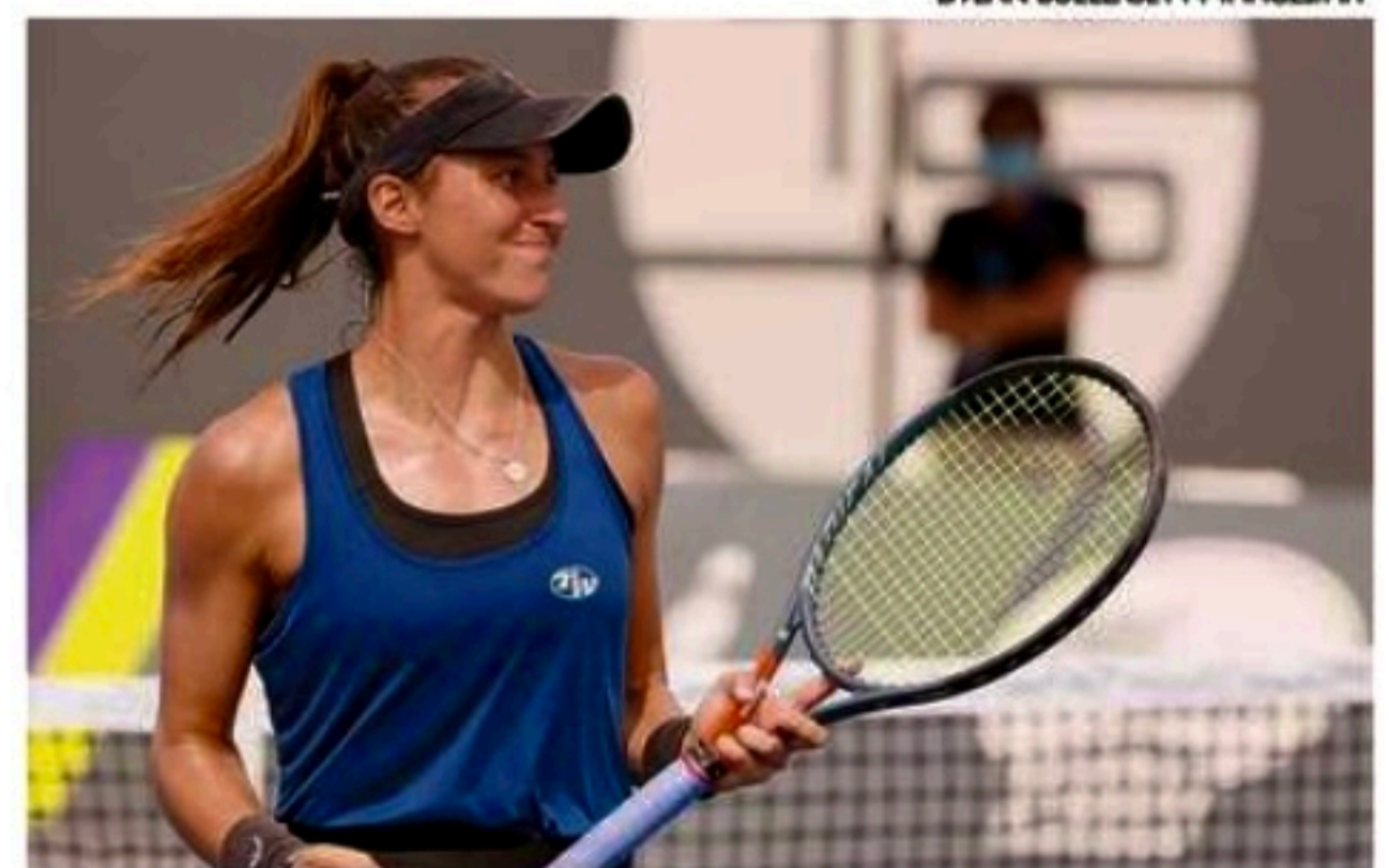
Brasileira é campeã das duplas femininas no WTA 500 de Abu Dhabi

Antes do torneio nos Emirados Árabes, Luisa aparecia na 36ª colocação do ranking. Com os títulos, ela faturou 470 pontos e deve dar um salto de seis posições. O próximo torneio da atleta será o WTA de Doha, no Catar, a partir de hoje.