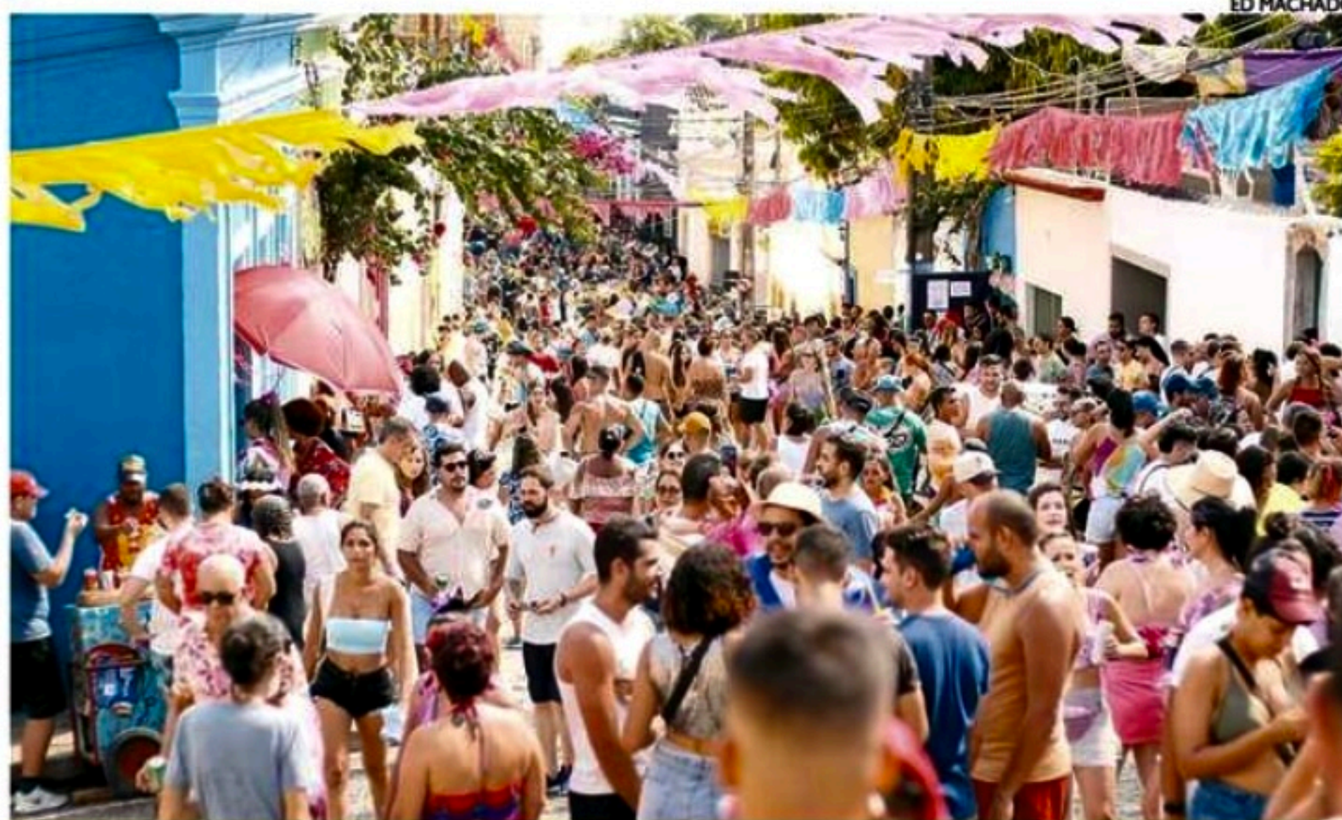
Já no ritmo da Festa de Momo, foliões aproveitaram o último domingo de prévias na Marim dos Caetés

Amanhã, às 14h, o Classic Hall recebe o Baile Municipal da Pessoa Idosa. Já às 17h, na Praça do Arse-