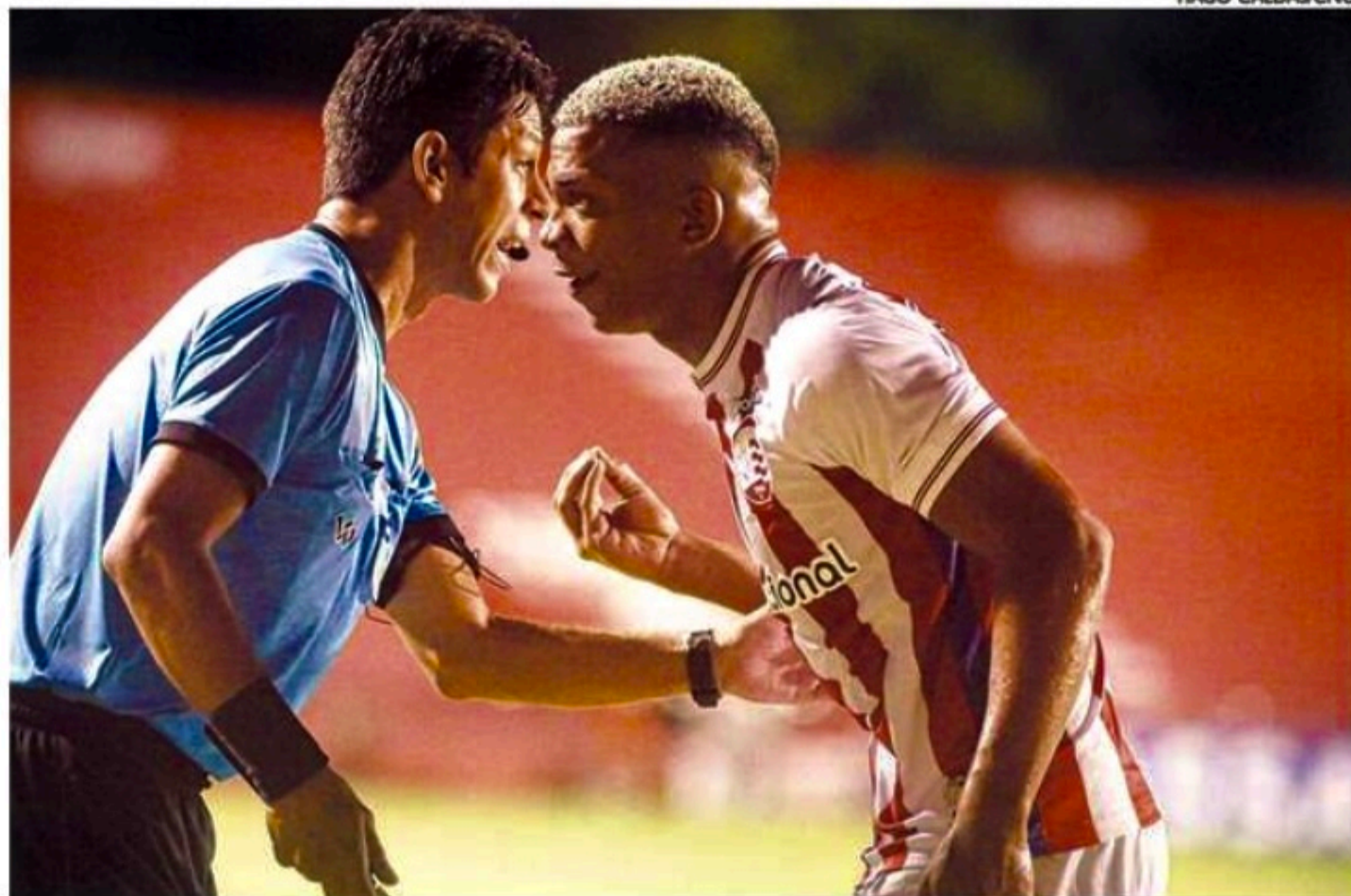
Arbitragem do Clássico dos Clássicos foi alvo de reclamação de alvirrubros e rubro-negros