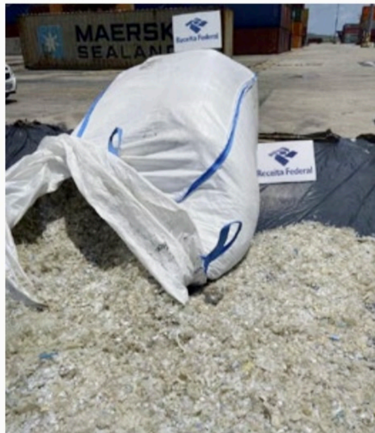
Receita Federal apreende lixo hospitalar em contêiner no Porto de Suape

“Em 2021, outra ocorrência chamou a atenção pois estávamos no meio de uma pandemia e o material podia ter sido utilizado, inclusive, em pacientes. O caso atual nos chama a atenção pela proximidade das festividades carnavalescas”, disse.