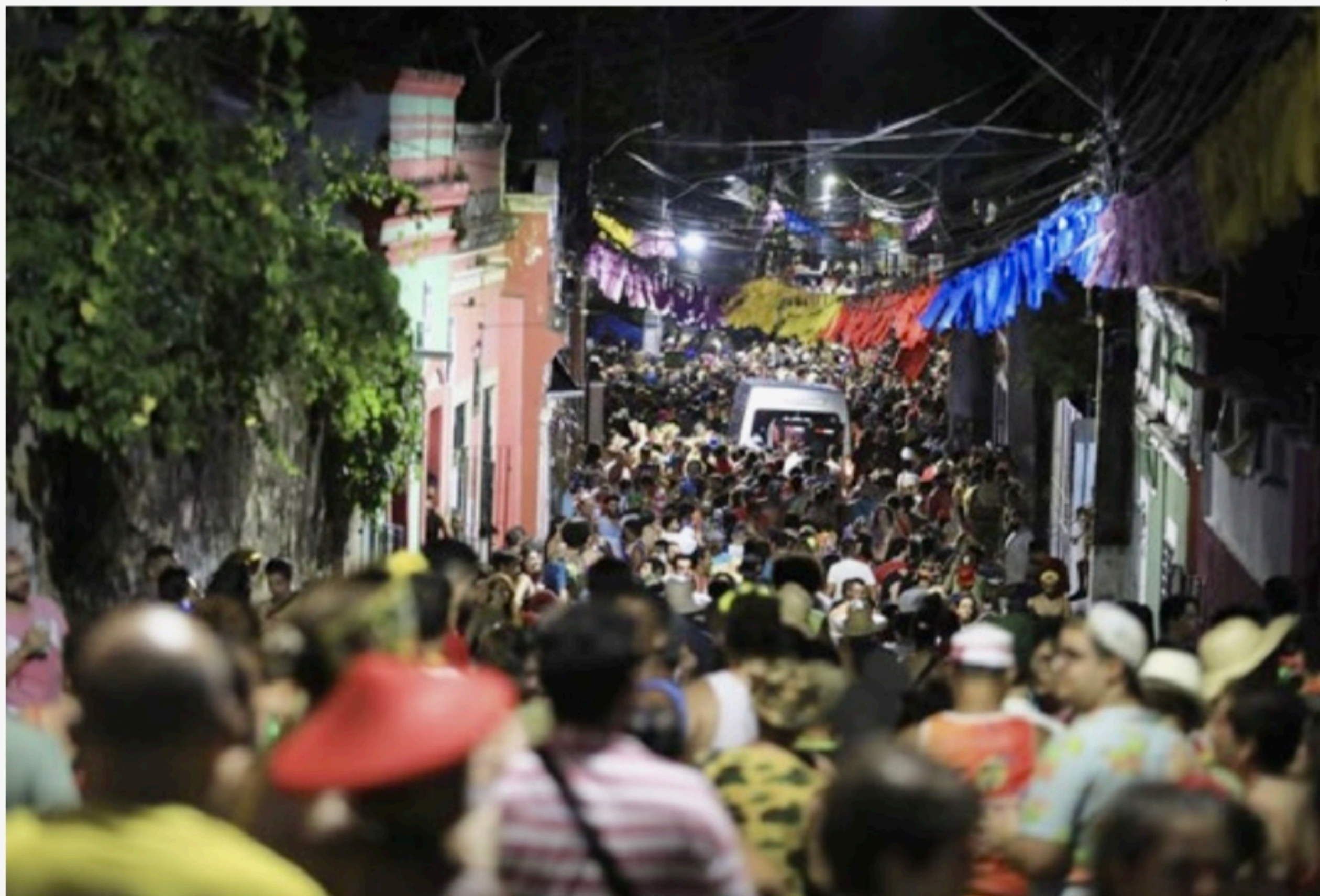
A Prefeitura de Olinda divulgou o balanço do Carnaval 2023 nesta quinta-feira (23), um dia após o encerramento oficial da festa na cidade

Gestão guardou RG, CPF, carteira de habilitação além de cartão de crédito, cartão VEM, dinheiro, bolsas, chaves de carro e celulares