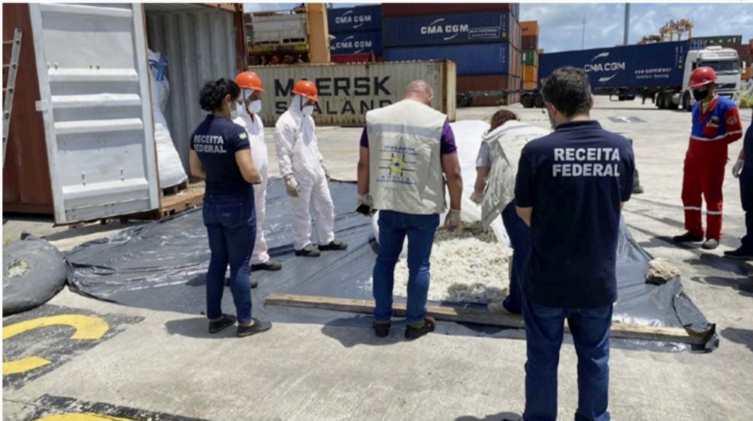
Receita Federal realiza trabalho de análise de riscos nas cargas que circulam pelo Porto de Suape, e contêiner foi apontado como suspeito