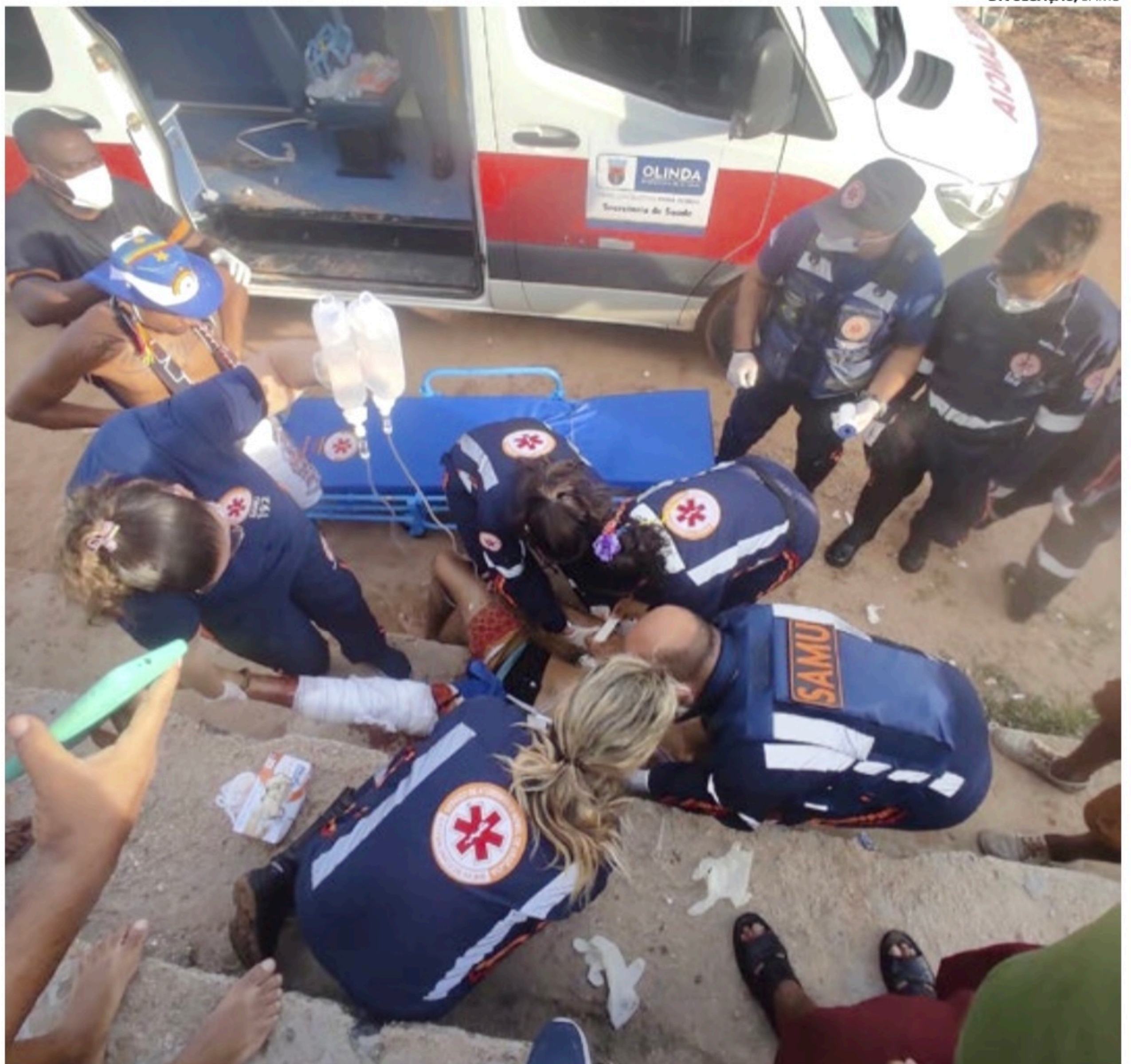
Homem foi atendido por profissionais do Samu e depois encaminhado ao HR, no Recife

foi acionado, mas o surfista foi retirado da água por amigos e populares, antes da chegada da corporação. O socorro foi realizado pela Serviço de Atendimento Móvel de Urgência (Samu).