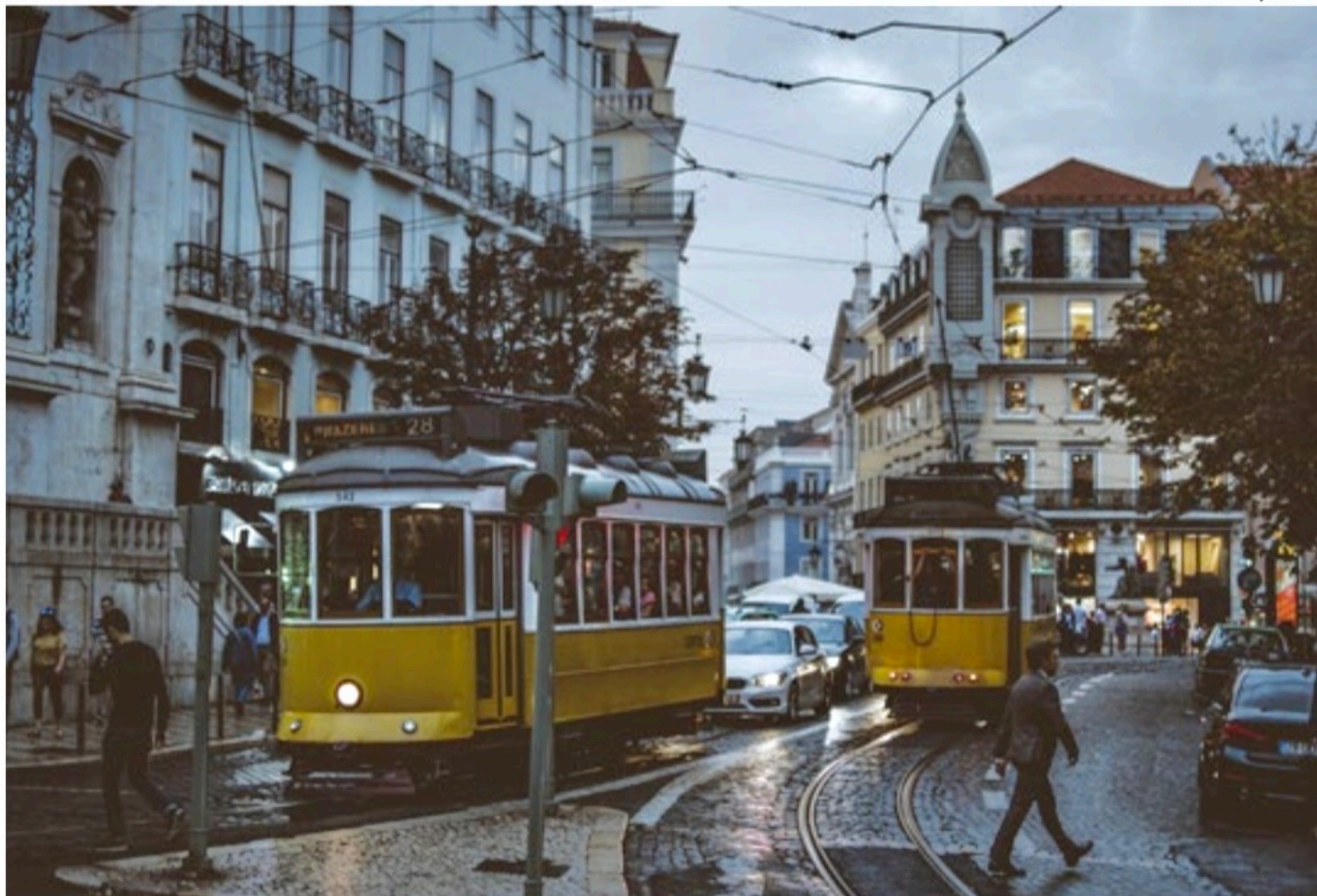
Lisboa, Portugal: o número de brasileiros cresceu pelo quarto ano consecutivo, atingindo em 2020 o recorde de 183.993 residentes