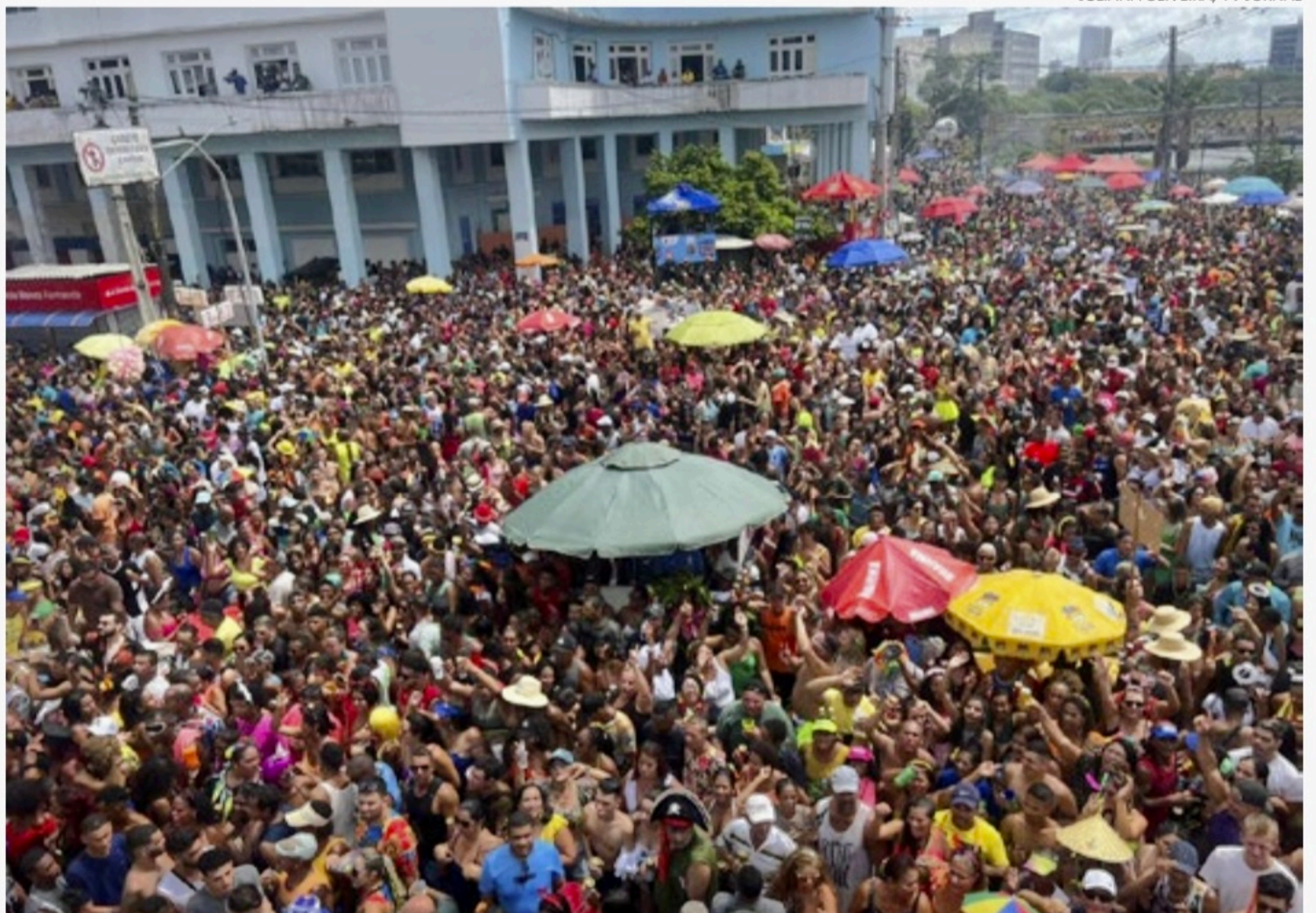
Com um público de mais de 2,5 milhões de foliões, o Galo da Madrugada teve como tema “Viva a Vida, Viva o Frevo, Viva Enéas”

Apesar de a SDS fazer que não houve mortes em polos de folia, há vários registros de violência e que deveriam constar no