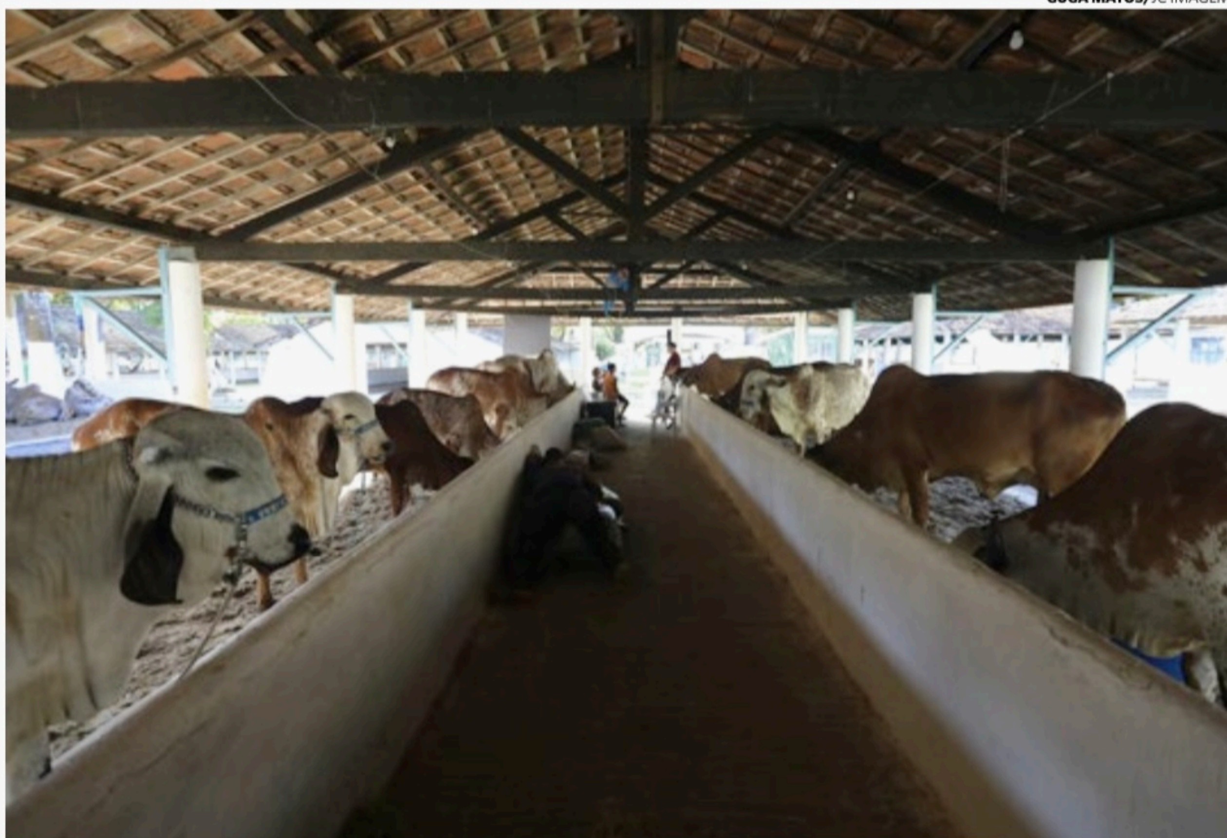
Caso de Vaca Louca aconteceu no município de Marabá (PA). Animal foi abatido e incinerado

cias estão sendo adotadas imediatamente em cada etapa da investigação e o assunto está sendo tratado com total transparência para garantir aos consumidores brasileiros e mundiais a qualidade reconhecida da nossa carne”, disse no comunicado o ministro Carlos Favaro.