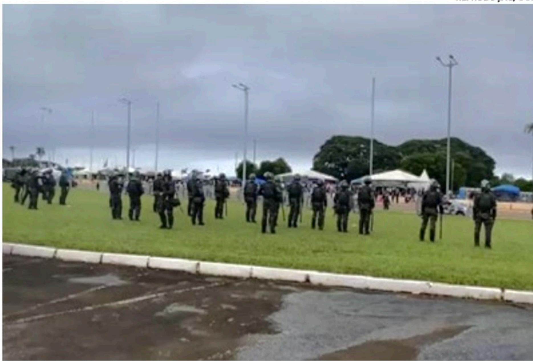
Forças militares no Quartel-General do Exército em Brasília

Como o inquérito foi aberto em 12 de janeiro, no Coman-