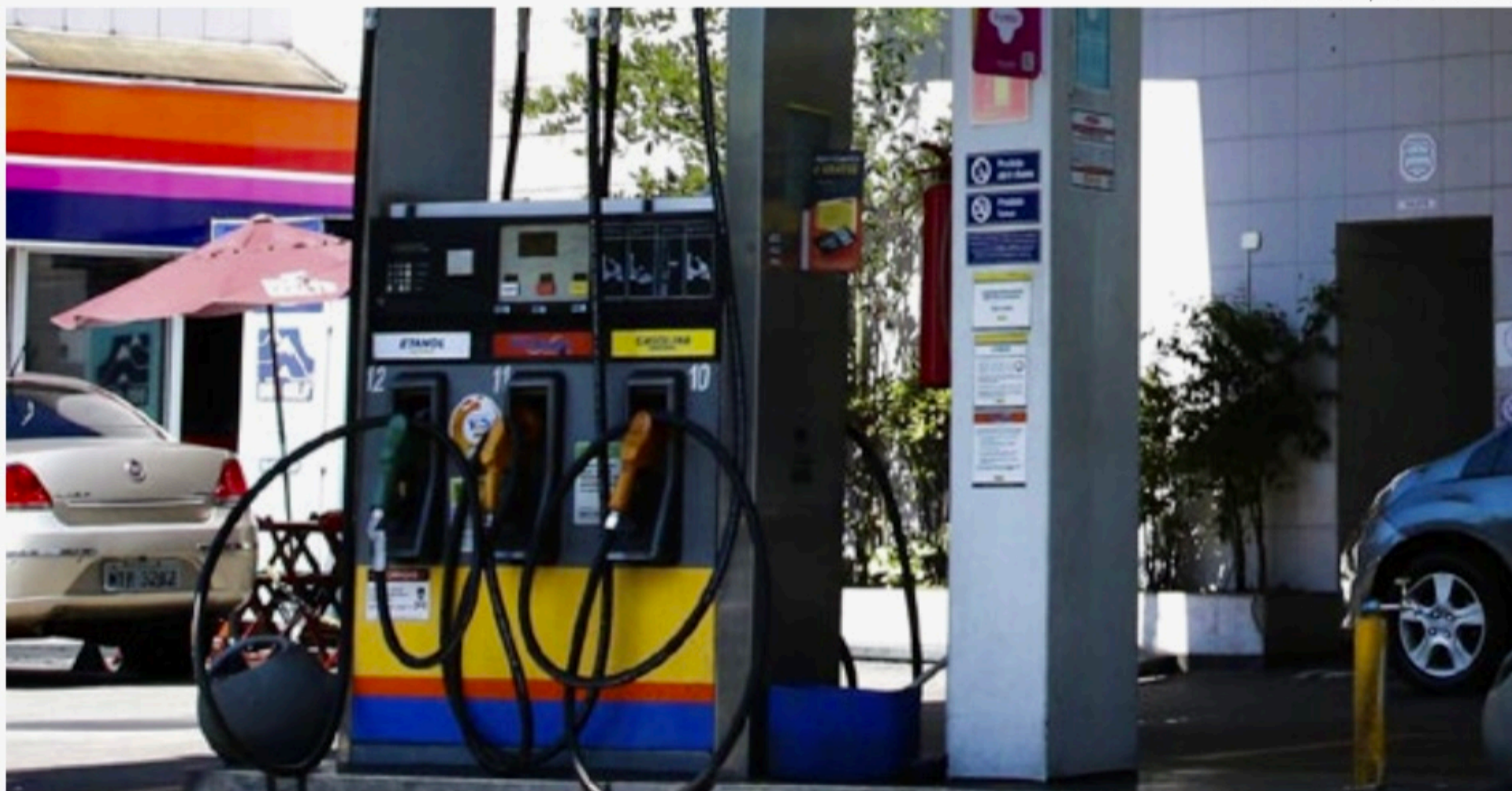
Preço da gasolina pode aumentar a partir de março