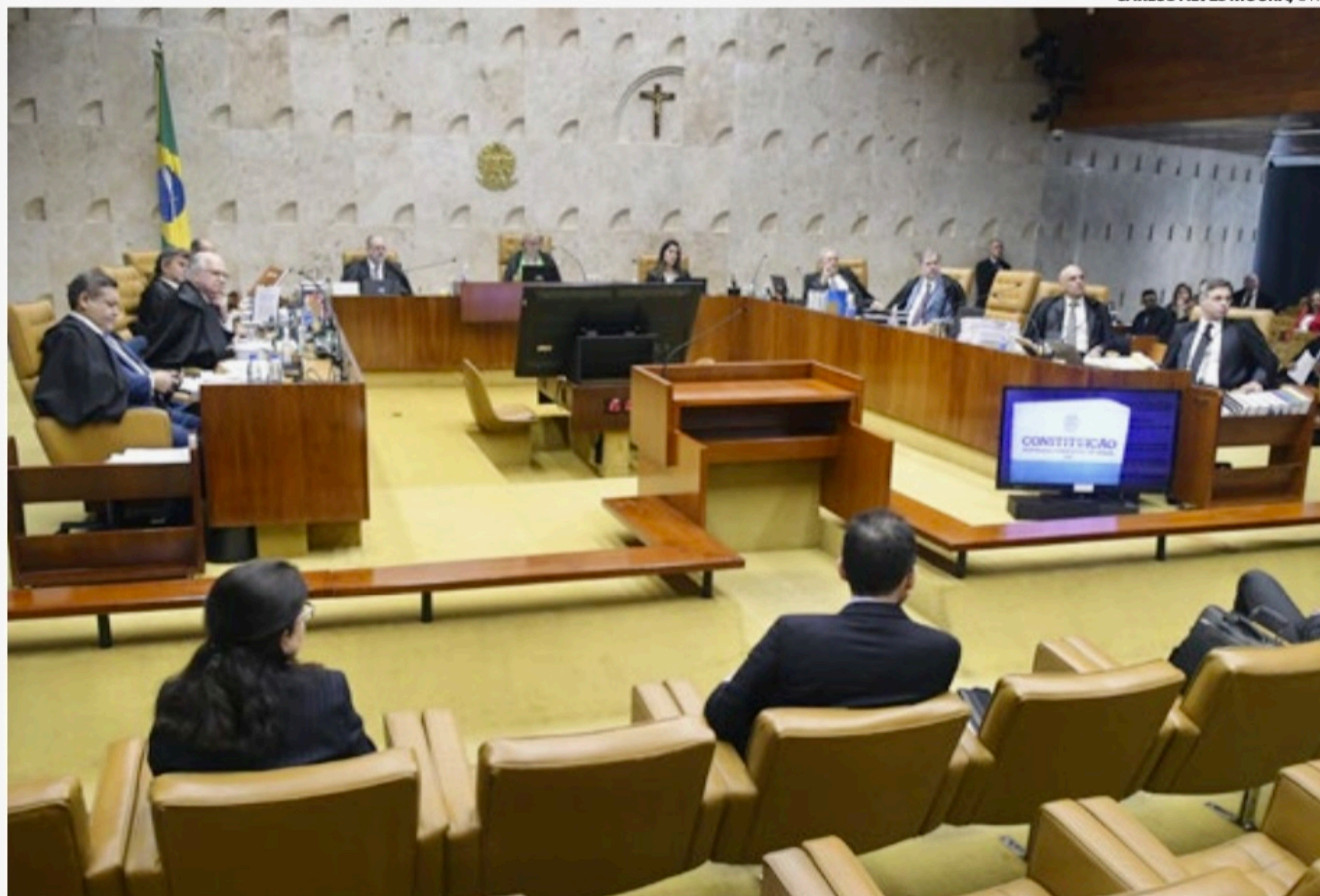
Processo discutia se autoridades brasileiras podem solicitar dados diretamente a provedores de internet com sede no exterior

Para Moraes, o procedimento exigido no acordo não é eficiente. “Funciona bem para todo tipo de cooperação, mas não vem funcionando bem nessa troca de informações ou colheita de provas relacionadas a grandes plataformas”, disse o ministro. O acordo determina que a solicitação de informações seja feita somente entre os