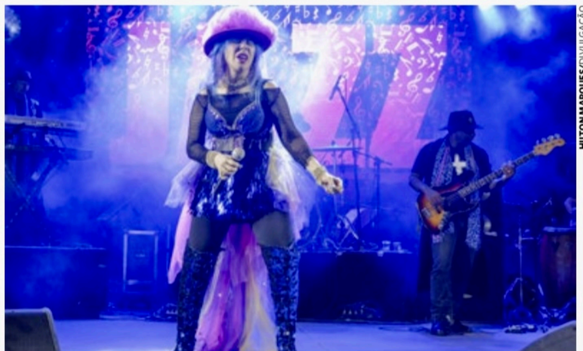
Baby do Brasil fez participação bem aplaudida no Garanhuns Jazz Festival no Carnaval