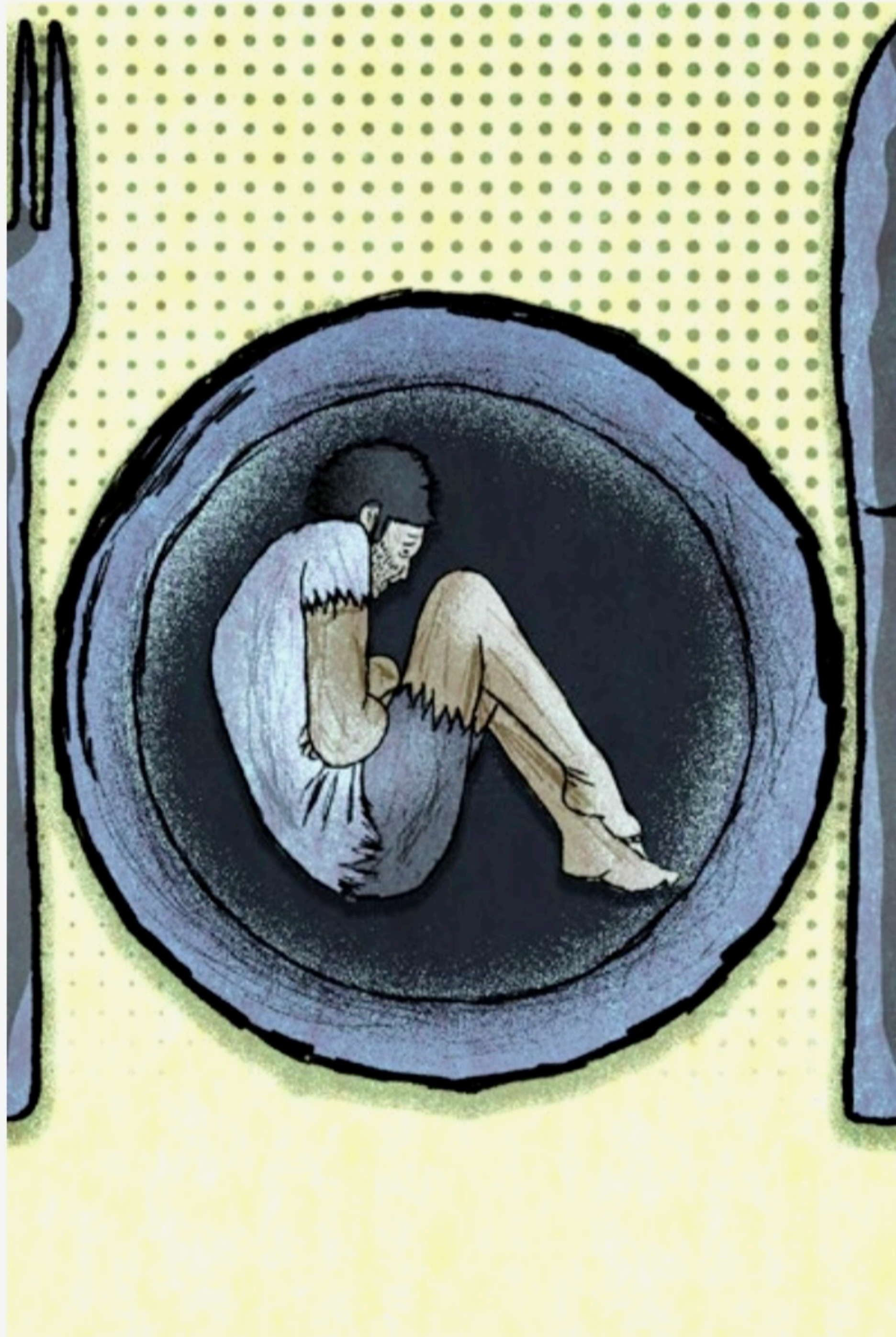
THIAGO LUCAS/ARTES JC

A CF se propõe a trazer à baila esses assuntos que compõem a malsinada fome, este segmento desumano da economia e das gestões públicas,