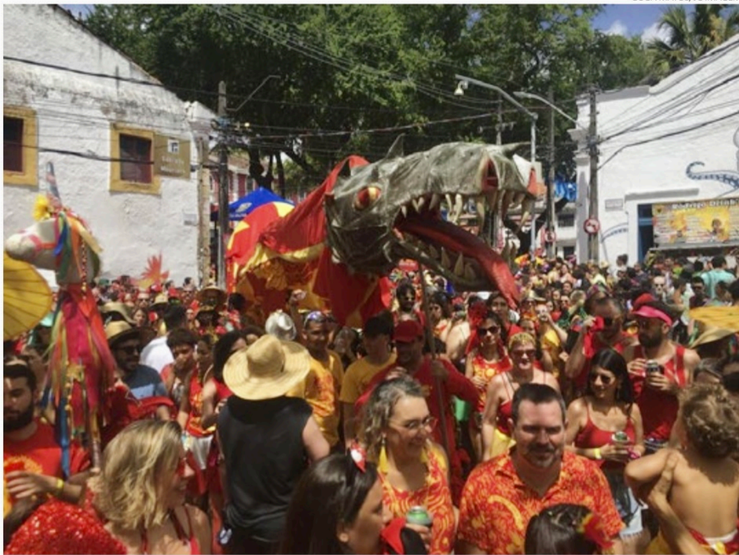
Bloco Eu Acho é Pouco desfilou em Olinda no sábado (18)

Os dois anos sem Carnaval por conta da pandemia fizeram com que os foliões fossem às ruas