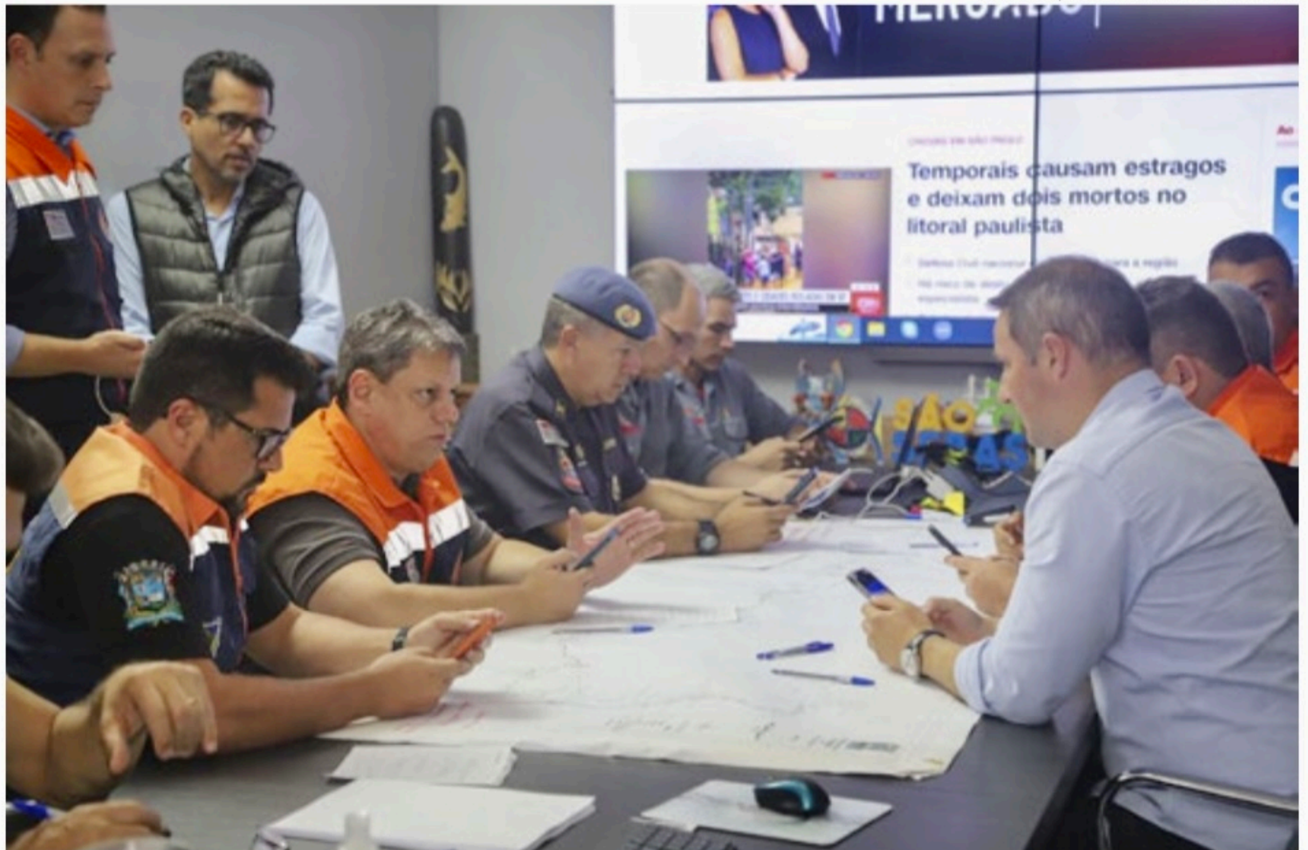
Governador de São Paulo, Tarcísio de Freitas

Apenas os quatro municípios do litoral norte somam 355 mil habitantes e, em razão do carnaval, receberam milhares de turistas. Cerca de 34 mil