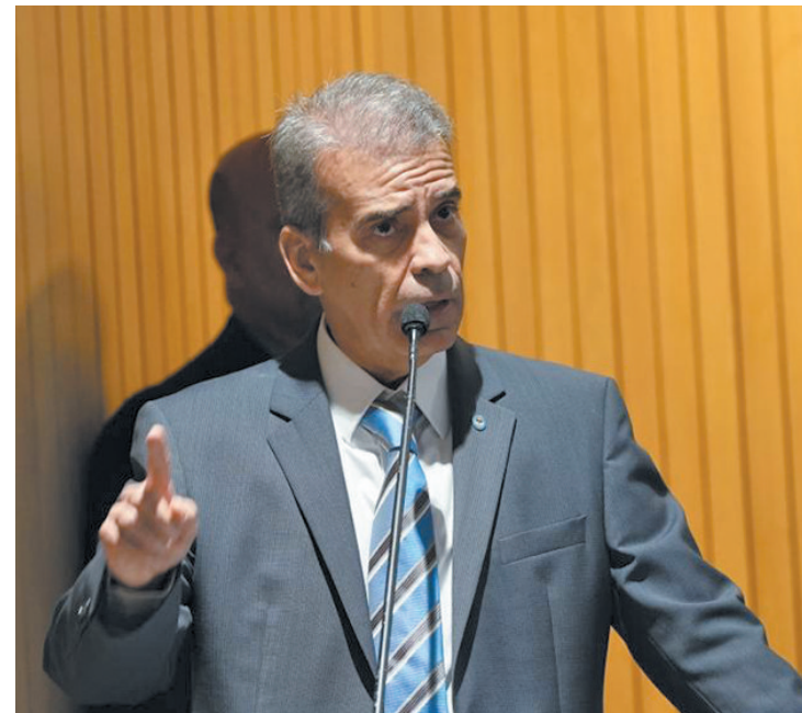
Parlamentar subiu o tom contra o Campo das Princesas

O deputado disse estar aliviado por não ter mais que seguir como líder de bancada na Assembleia Legislativa e teceu duras críticas aos primeiros dois meses da atual administração estadual. “Há uma latente falta de competência da governadora Raquel Lyra de não pagar os salários aos funcionários e isso é algo que custa caro à população, principalmente à parcela mais vulnerável. Isso sem falar no sigilo imposto sobre os dados da segurança pública. Me questiono se estamos em uma ditadura militar... Na verdade, nem nos tempos da ditadura era assim”, pontuou.