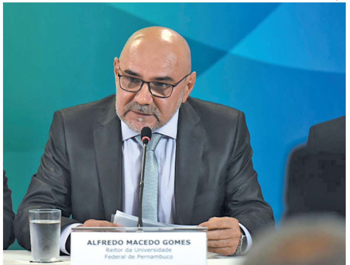
Gomes é psicólogo, mestre em sociologia e doutor em Educação pelo Reino Unido

(PhD) pela University of Bristol (2000), no Reino Unido, e realizou estágio pós-doutoral junto ao Centre for Globalization, Societies and Education, também pela University of Bristol (2010-2011). É professor do Departamento de Fundamentos Sócio Filosóficos da Educação, do Centro de Educação (CE). É reitor da UFPE des-