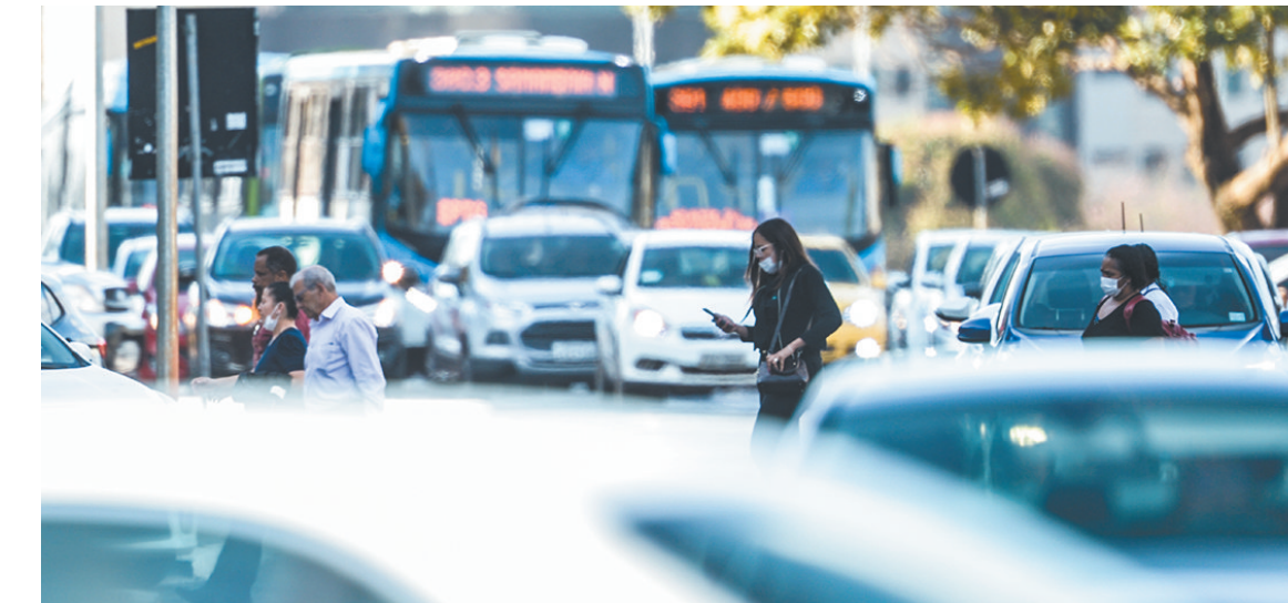
Atividades de transportes registraram um dos melhores crescimentos anuais do país

Por unidades da federação, a soma das riquezas de Pernambuco alcançou R$ 193.307 bilhões, o segundo maior montante do Nordeste e atrás da Bahia. No