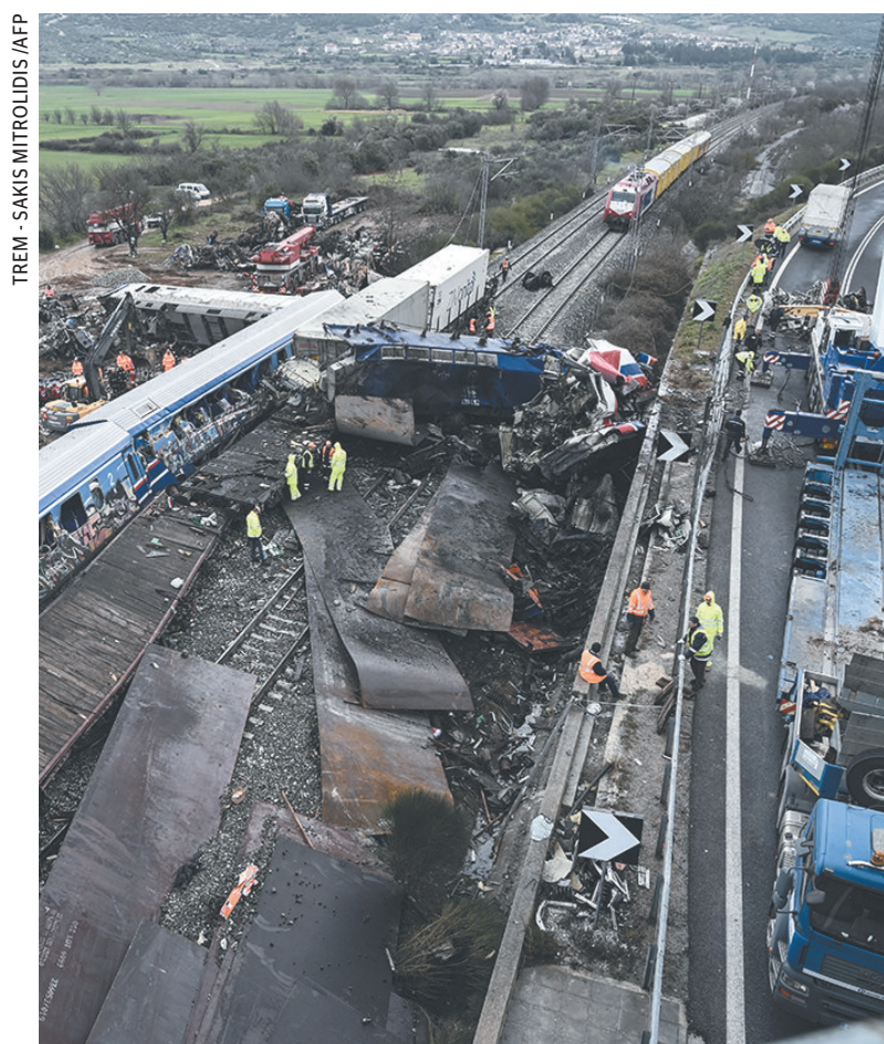
TREM - SAKIS MITROLIDIS /AFP

Se considerado os casos de violência psicológica, a estimativa é de que 43% das brasileiras já foram vítimas do parceiro íntimo. Mulheres negras, de baixa escolaridade, com filhos e divorciadas são as principais vítimas. (Redação com Agência Brasil)