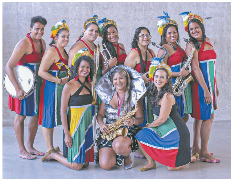
'Só Mulheres' se destaca há 16 anos na cena orquestrada