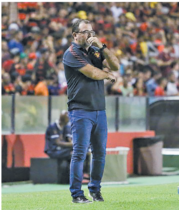
Anderson quer alinhar resultados a um bom desempenho

GENIVALDO HENRIQUE ESPECIAL PARA O DIÁRIO