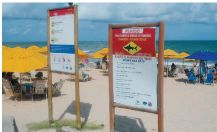
Placas alerta para cuidados antes de banhos de mar

bo de Santo Agostinho”. O trecho interditado vai da praia de Bairro Novo a Itapoama.