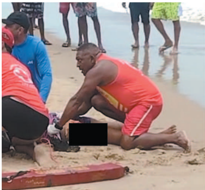
Adolescente recebeu primeiros socorros ainda na praia

A proibição de 1999 tem caráter estadual. Em decreto, o então governador Jarbas Vasconcelos, vetou natação, mergulho e práticas esportivas “na faixa litorânea da orla marítima dos municípios de Olinda ao do Ca-