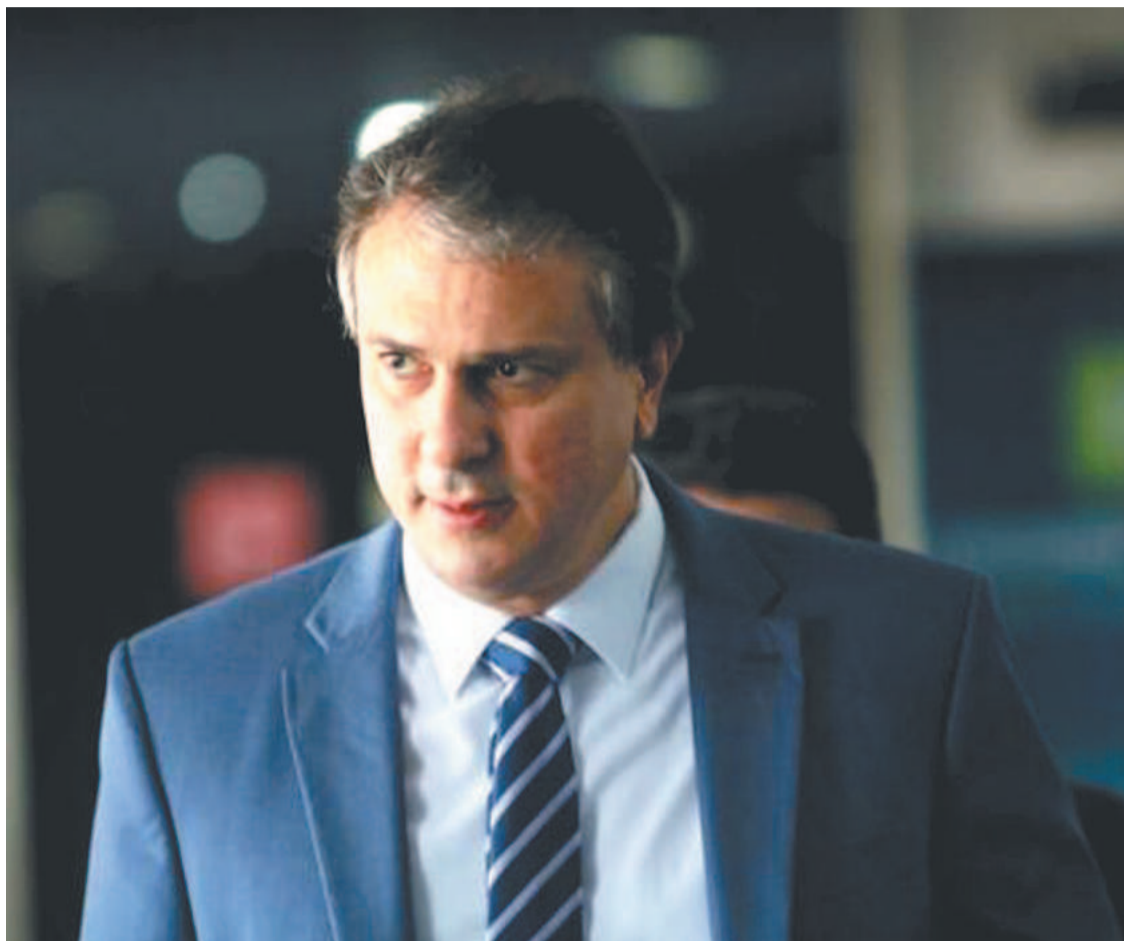
Anúncio de mais bolsas de pós nas universidades veio logo depois de reajustes no país

No caso da bolsa do mestrado, o valor sairá de R$ 1,5 mil para R$ 2,1 mil. Na de doutorado, de R$ 2,2 mil para R$ 3,1 mil. Já nas bolsas de pós-doutorado, o acréscimo será de 25%, com aumento de R$ 4,1 mil para R$ 5,2 mil. Outras modalidades também serão reajustadas. De acordo com o Planalto, o aumento terá aporte de R$ 2,38 bilhões de recursos do Ministério da Ciência e Tecnologia e do Ministério da Educação. (Correio Braziliense)