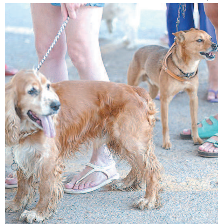
Cães, gatos e ratos eram comumente usados nos testes