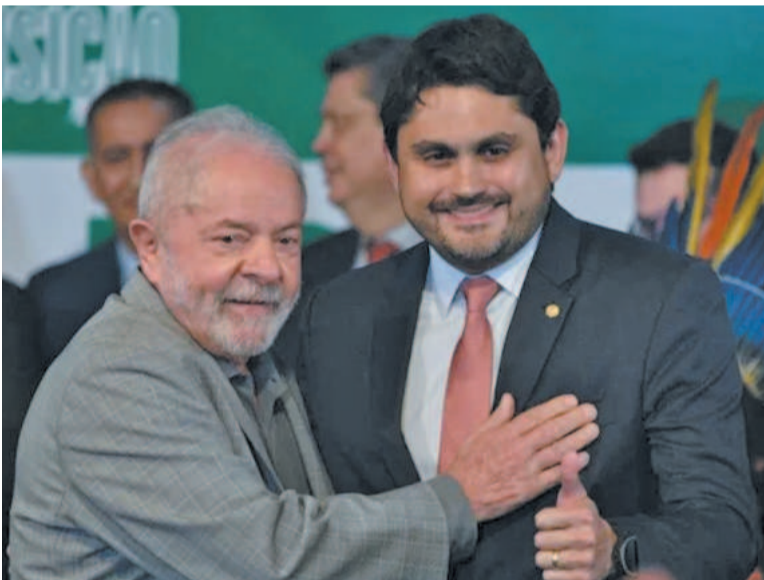
Planalto avalia possibilidade de afastamento do ministro