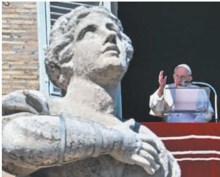
Pontífice se comoveu ao falar da tragédia na Calábria

Ao discursar, o papa ficou muito comovido e depois calou-se perante a multidão reunida em frente à Praça de São Pedro, em Roma. A tragédia ocorrida no último