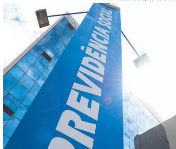
INSS alega dificuldades técnicas para fazer mudanças

Uma das dificuldades apresentadas para a implantação da mudança foi que os sistemas atuais do Dataprev não preveem o cálculo considerando salários anteriores a julho de 1994, sendo necessárias mudanças tecnológicas que viabilizem o procedimento. Moraes reconheceu as dificuldades técnicas, mas afirmou que a decisão do STF não pode ficar sem resultado prático. Ele acrescentou que “é preciso que a autarquia previdenciária requerente informe de que modo e em que prazos se propõe a dar efetividade ao entendimento definido” pelo STF. Somente após receber e analisar o plano é que decidirá sobre o pedido de suspensão dos processos, afirmou Moraes. (Agência Brasil)