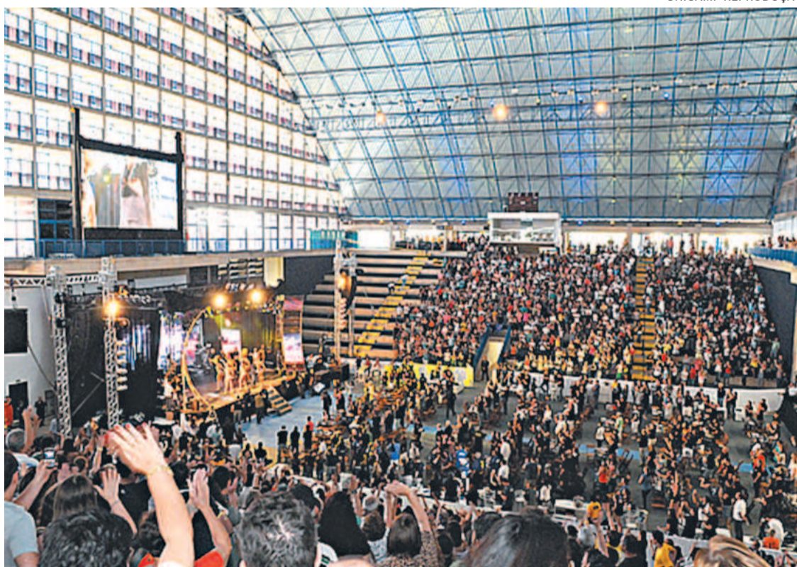
A competição é um sucesso e movimentou escolas públicas e privadas de todo o país