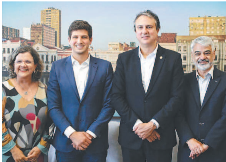
Os senadores Teresa Leitão e Humberto Costa ladeando o prefeito João Campos e o ministro Camilo Santana, na sede da Prefeitura do Recife

A Neoenergia Pernambuco reforçou sua equipe com 15 mulheres formadas na Escola de Eletricistas da empresa. Agora são 143 eletricistas do sexo feminino espalhadas no estado. Intenção da distribuidora é igualar número de homens e mulheres na operação da rede elétrica.