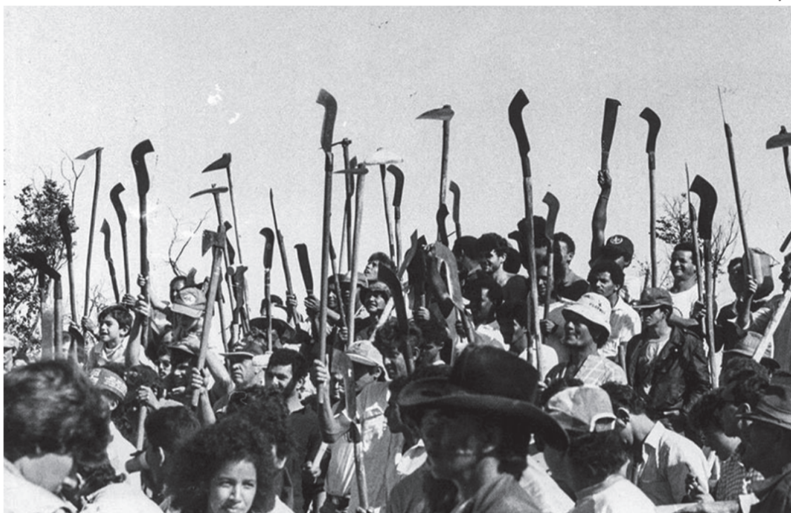
Primeira grande lei brasileira, o Estatuto do Trabalhador Rural data de março de 1963

Em 1963, quando o Estatuto do Trabalhador Rural entrou em vigor, já fazia 75 anos que a Lei Áurea (Lei 3.353, de 1888)