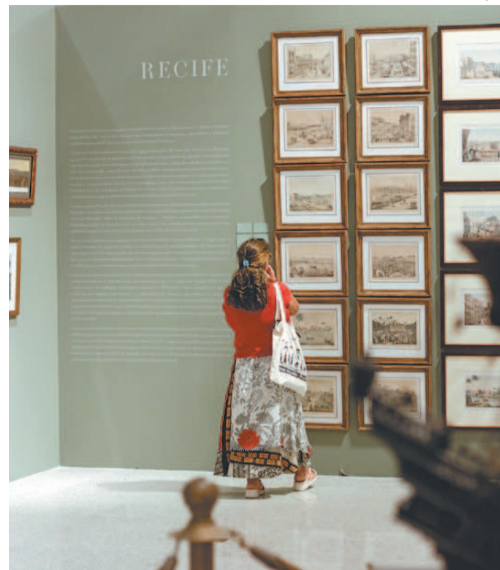
Acervo da mostra oferece 104 obras, segundo o curador

Exposição - PANORAMA: de portos a capitais, no Brasil Setentrional Quando: já em cartaz e segue até 23 de abril de 2023. Horário: das 13h às 17h (Última entrada às 16h30). Onde: Alameda Antônio Brennand, s/n - Várzea Mais informações: (21) 2121.0365/0334