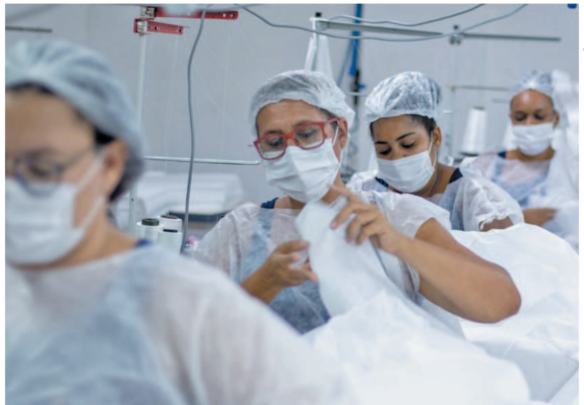
Marca de roupa foi lançada em fevereiro, mas pode ser comprada pela internet

Se você faz parte de uma Organização Não Governamental (ONG) ou conhece uma iniciativa social e deseja que a história dessa ação seja contada no DP+Social, pode sugerir, através de nosso e-mail: social@diariodepernambuco.com.br .