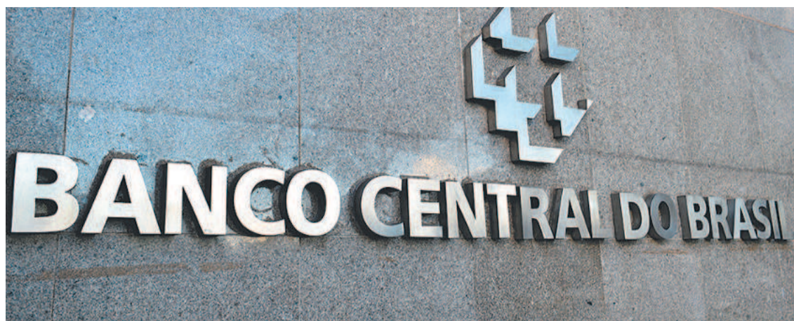
Mais de um milhão de solicitações de saques diretos foram por meio de chaves Pix

A maior parte dos valores passíveis de resgate será de, no máximo, R$ 10. Nesta faixa ficam 62,55% das contas, o equivalente a 29.282.110 pessoas. Entre R$ 10,01 e R$ 100, o SVR reúne 26,05% ou 12.195.837 pessoas, enquanto 10,03%, correspondente a 4.694.862 pessoas, têm direito entre R$ 100,01 e R$ 1.000. (Da Redação com Agência Brasil)