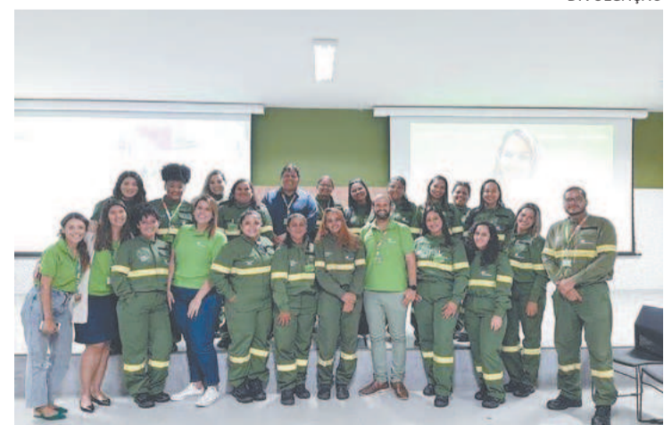
A nova equipe estudou 480 horas para a formação

Serviço Nacional de Aprendizagem Industrial (Senai). Capacitação e treinamento é a prova de que todos são aptos a desempenhar qualquer tipo de função, independente do sexo.