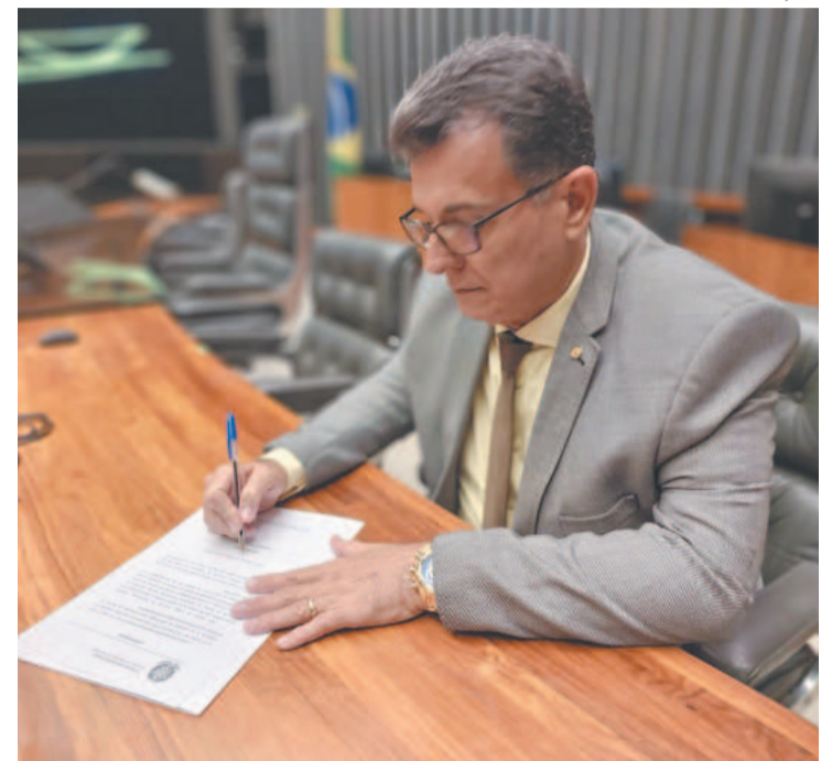
Deputado repercutiu excedente de 160 mil famílias

A CGU apontou ainda que o problema em questão ocorre desde 2016, conforme auditoria do Tribunal de Contas da União (TCU), que analisou dados do CadÚnico e os comparou com dados da Receita Federal,