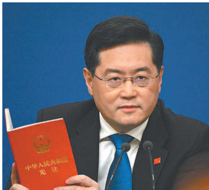
Qin Gang disse que ação dos EUA pode levar a conflito

Por sua vez, o conselheiro de segurança nacional, Jake Sullivan, aplaudiu o texto que permite banir aplicativos como o TikTok. O projeto “permitiria impedir que certos estados explorassem serviços de tecnologia de forma que ameacem a confidencialidade dos dados de americanos e a segurança nacional”, disse. (AFP)