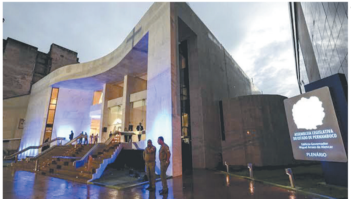
Assembleia Legislativa terá uma semana inteira de serviços dedicados às mulheres