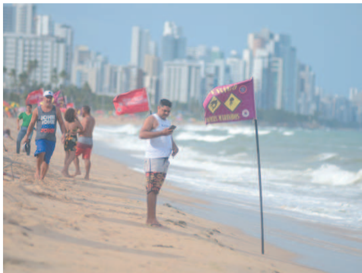
Jaboatão reforçará fiscalização; Olinda instalará mais placas