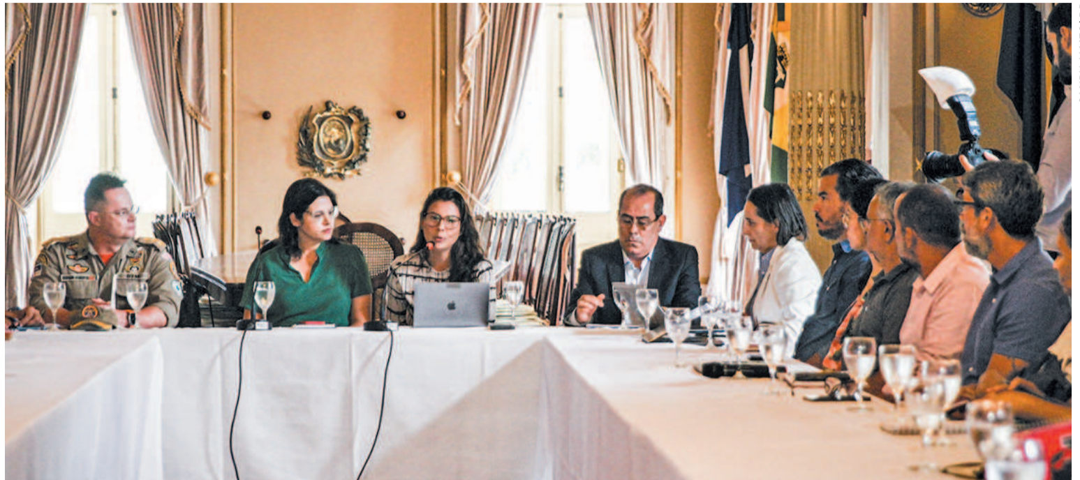
Dois ministérios do governo federal passarão a fazer parte do grupo, mas houve poucas medidas concretas no encontro