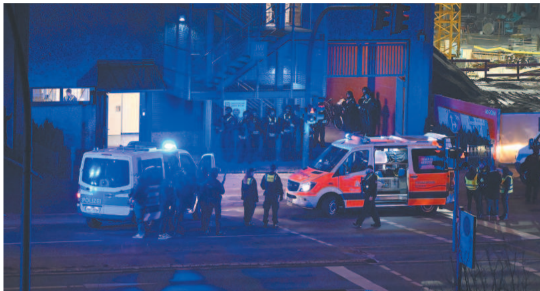
Polícia isolou ruas da igreja e advertiu população para "perigo extremo"

Imprensa alemã menciona "banho de sangue" com vários mortos e feridos