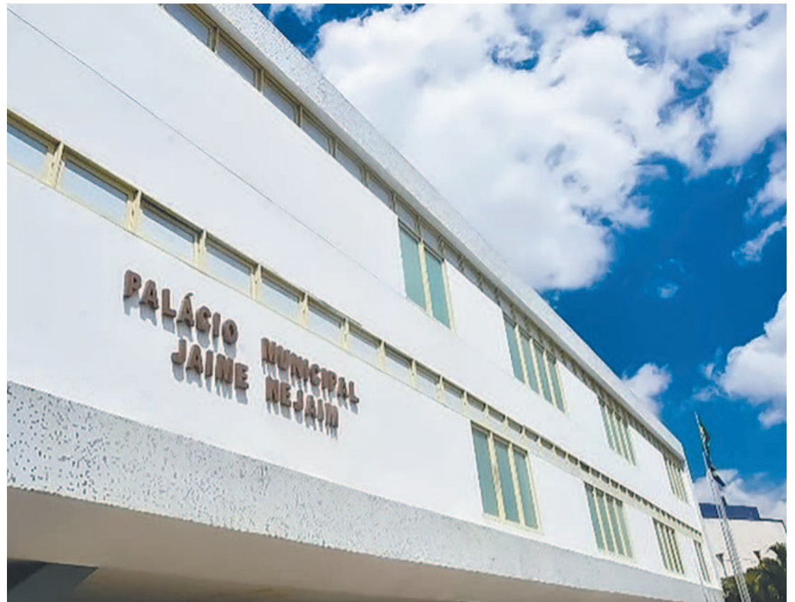
A prefeitura deve preencher as vagas até o fim deste ano, a maioria em saúde e educação

Haverá provas pela manhã e também à tarde. Locais podem ser conferidos no site do organizador, www.ibam-concursos.org.br