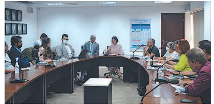
Reunião contou com a presença de lideranças sindicais

a retomada do atendimento aos pacientes vinculados ao Sassepe, suspensos de forma unilateral pela unidade hospitalar. O governo estadual afirma ter realizado pagamentos em torno de R$ 5 milhões referentes ao ano de 2022 e pretende seguir com os repasses para o Santa Efigênia e outras unidades da rede credenciada.