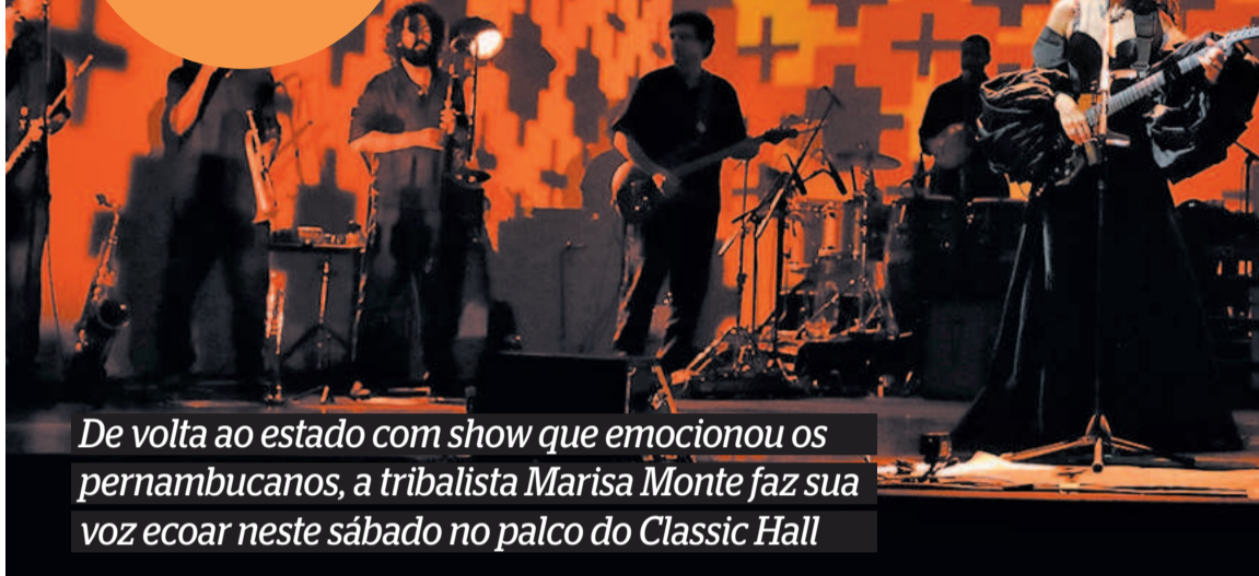
De volta ao estado com show que emocionou os pernambucanos, a tribalista Marisa Monte faz sua voz ecoar neste sábado no palco do Classic Hall

Turnê segue até novembro no Brasil e fora do país, com passagem por Estados Unidos, Canadá e Áustria