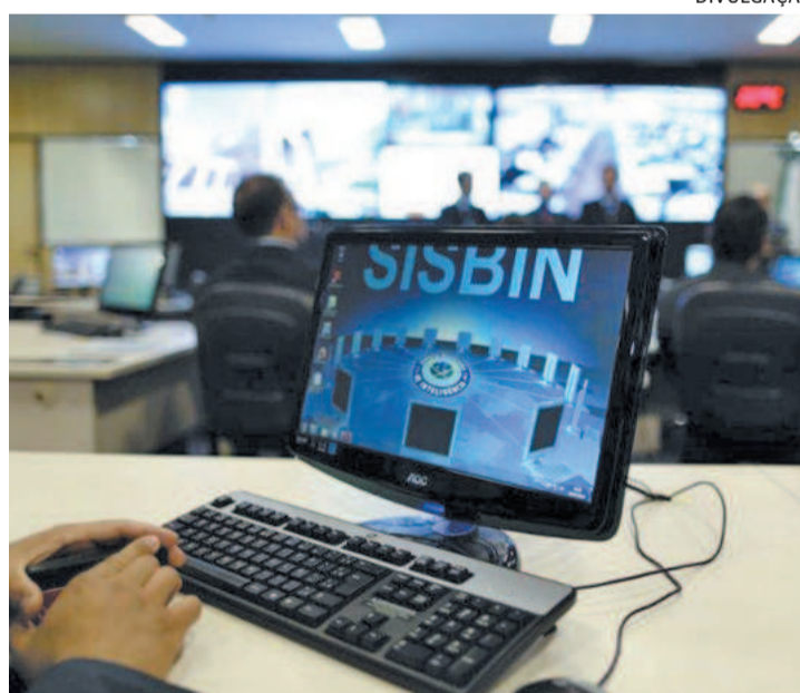
Abin é acusada de espionar civis na gestão Bolsonaro

"A quebra de sigilo digital dos cidadãos, em qualquer circunstância, configura uma grande ameaça aos brasileiros e às instituições, e deve ser objeto de elevado repúdio e providências tanto do Ministério Público como dos demais órgãos da República", afirma o texto da representação. "É preciso agir com rigor extremo para punir os responsáveis por iniciativas que colocam em risco o Estado Democrático de Direito e suas instituições, a liberdade individual, a segurança e a vida de milhares de brasileiros", acrescenta.