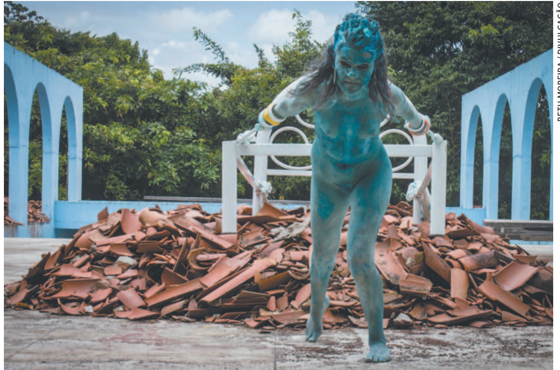
Ao todo, são 20 vagas voltadas para profissionais das artes do corpo, atores etc.

Com carga horária de 40 horas, a oficina teórico-prática será ministrada entre os dias 14 de abril e 13 de maio, nas noites das sextas-feiras e tardes