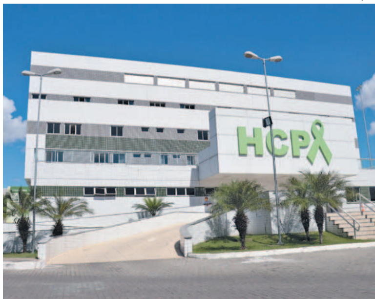
Unidade que atende milhares de pacientes vive grave crise