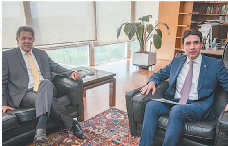
O ministro Fernando Haddad recebe o deputado Silvio Costa Filho, no Ministério da Fazenda, em Brasília

A Meta vai demitir 10 mil funcionários. A empresa, controladora do Facebook e Instagram, já tinha demitido 11 mil pessoas em novembro do ano passado.