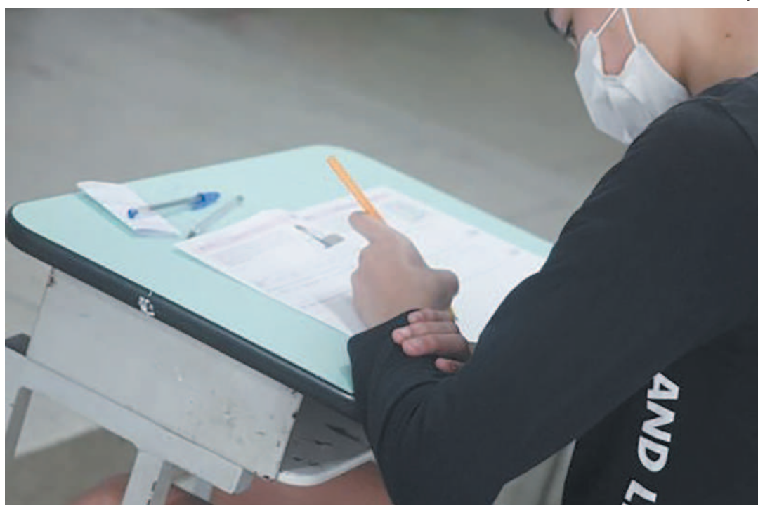
Anualmente, mais de 18 milhões de estudantes do país participam da competição

Os alunos que conquistarem medalhas nacionais são convidados a participar do Programa de Iniciação Científica Jr.