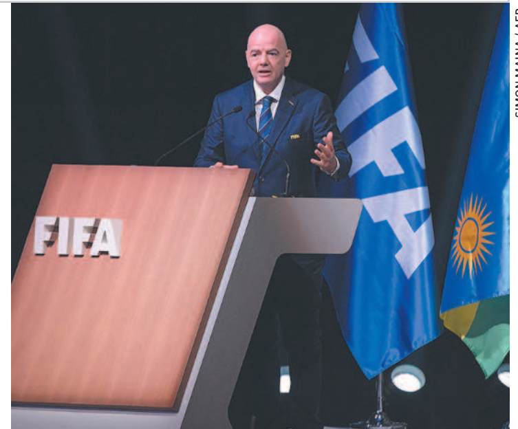
Infantino apresentou um balanço com aumento de 18% das receitas e 45% a mais nas reservas