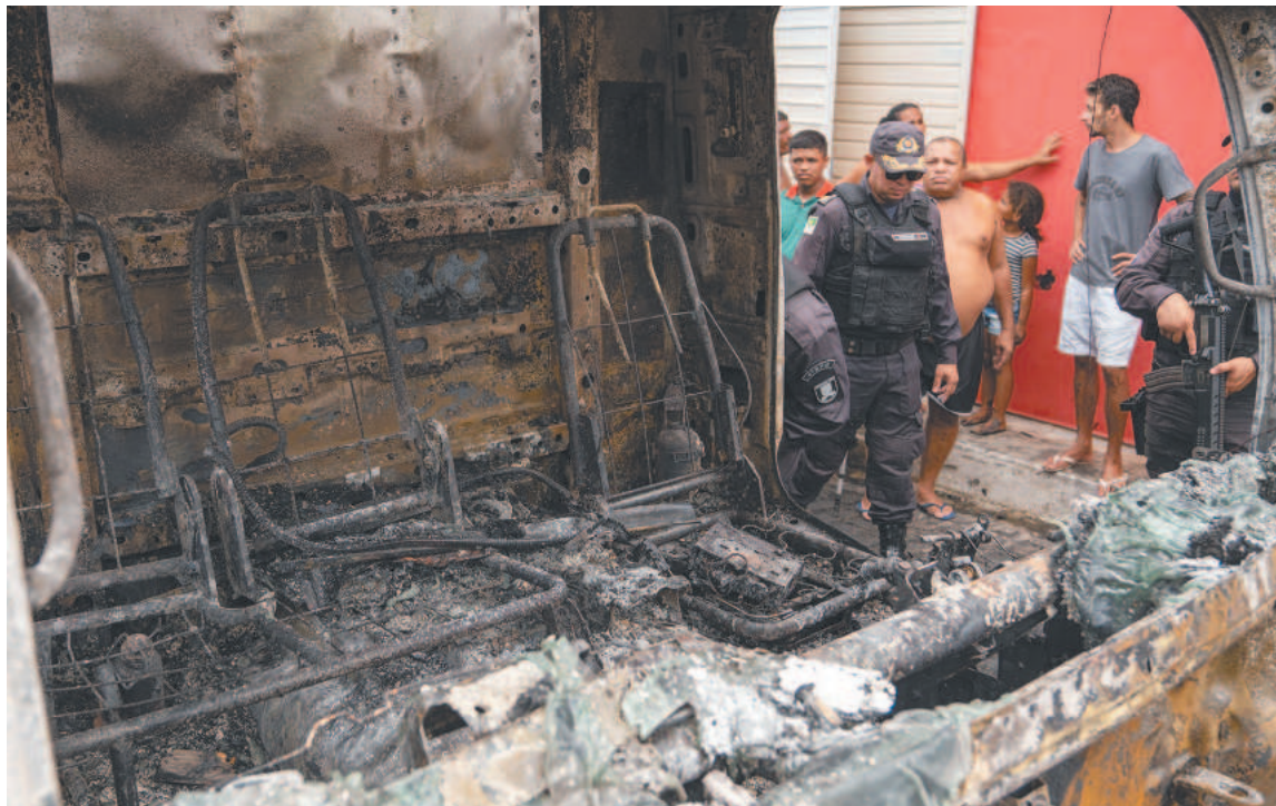
Criminosos queimaram ônibus, caminhões e motos em bairros da periferia da capital potiguar

De acordo com as autoridades, os ataques são orquestrados de dentro dos presídios, onde os detentos protestam contra as condições de vida, com reivindicações como televisões e visitas particulares. Organizações de direitos humanos denunciam que não são respeitadas as condições mínimas às quais os presos têm direito. (Da Redação com AFP)