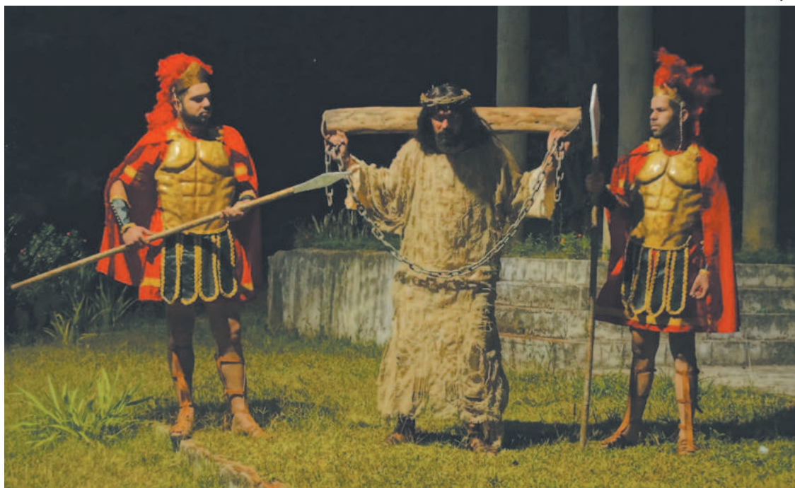
A cada ano, são feitas interferências contemporâneas sem deturpar a história original

A cada ano, são feitas interferências contemporâneas na encenação sem deturpar a história original. As 13 cenas da atual montagem trazem os tumultos que a presença de Cristo causou ao redor do Templo sagrado, os atritos com os fariseus, a Última Ceia, a traição, prisão, julgamento, flagelação, Crucificação e Ressurreição. A estrutura cenográfica natural da Via Verde permite que o público acompanhe a peça ao ar livre, desfrutando da tempera-