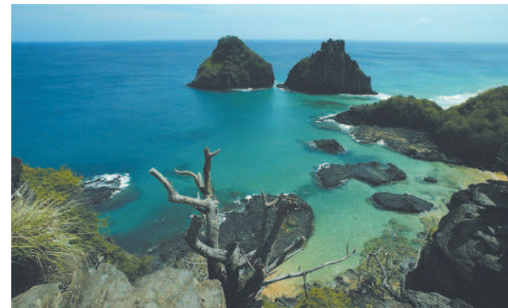
Pernambuco e União tinham chegado a entendimento