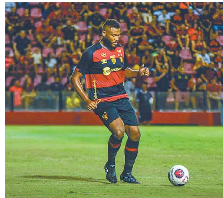
IGOR CYSNEIROS / SCR

Depois de cumprir suspensão, Sabino retorna à defesa