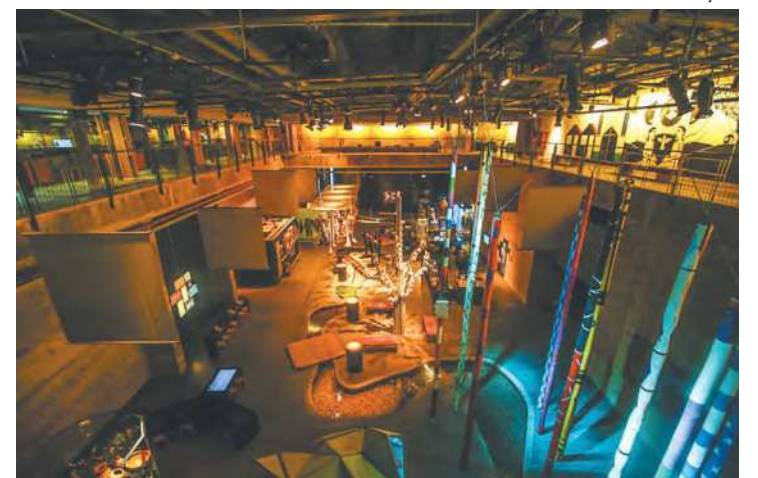
Cais do Sertão foi o primeiro espaço a ser digitalizado

A digitalização de museus acontece por meio de tecnolo-