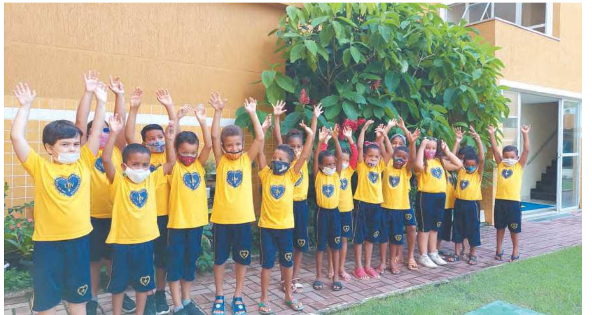
O público infantil é ajudado, sobretudo, pelo projeto Criança: Futuro no Presente

A Legião da Boa Vontade realiza doações de cestas básicas e