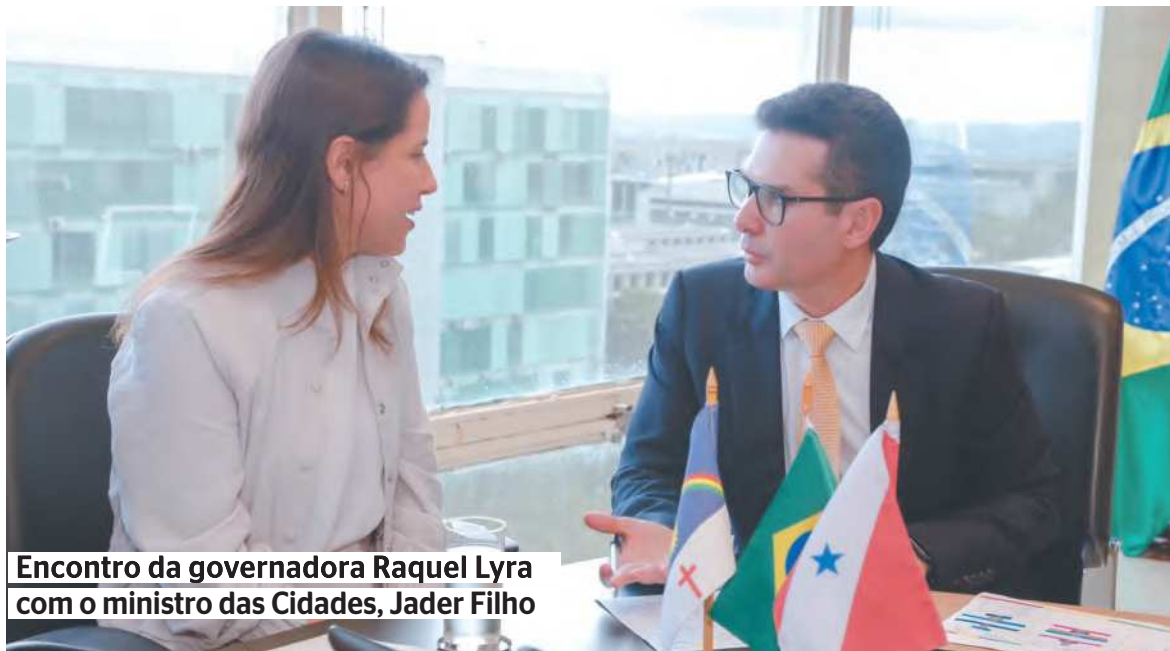
Encontro da governadora Raquel Lyra com o ministro das Cidades, Jader Filho