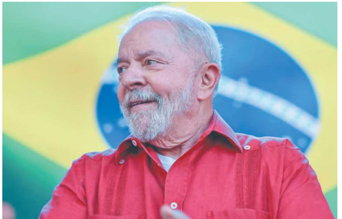
A programação prevê atos isolados com a governadora do estado e o prefeito do Recife