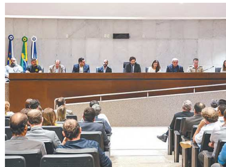
Ataques recentes levantaram debates em Pernambuco