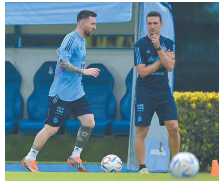
Técnico Scaloni disse que continua contando com Messi