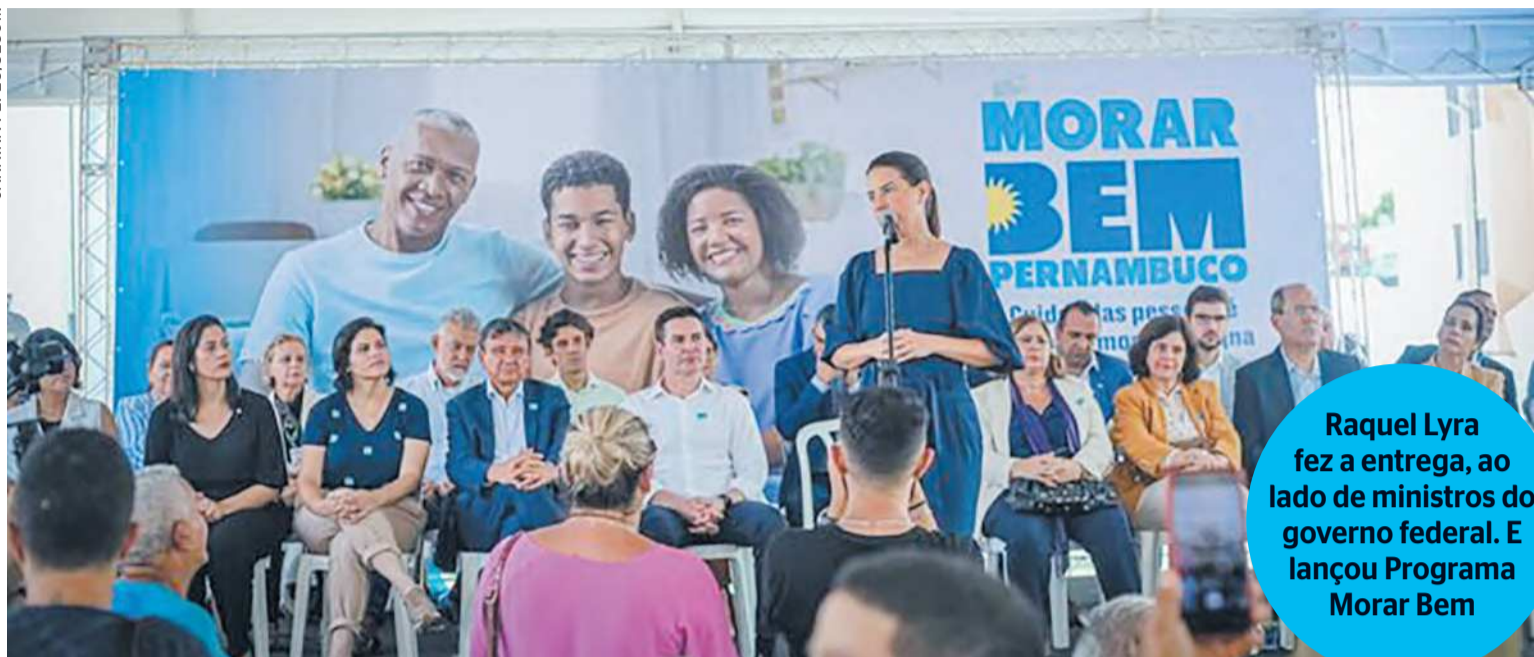
Raquel Lyra fez a entrega, ao lado de ministros do governo federal. E lançou Programa Morar Bem