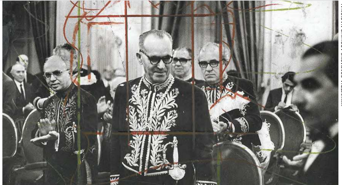
Na imagem, Guimarães Rosa em sua posse na Academia Brasileira de Letras, em 1967

continuamente excepcionais. O artifício de reviravolta narrativa pode variar entre um banal mecanismo de finalizações óbvias e uma convergência esmerada para um desfecho criativo e inusitado, encarna, nos escritos de Guimarães Rosa, uma educação da sensibilidade estética. Mostra-nos que conclusões apressadas em torno do objeto literário anulam da nossa experiência como leitores.