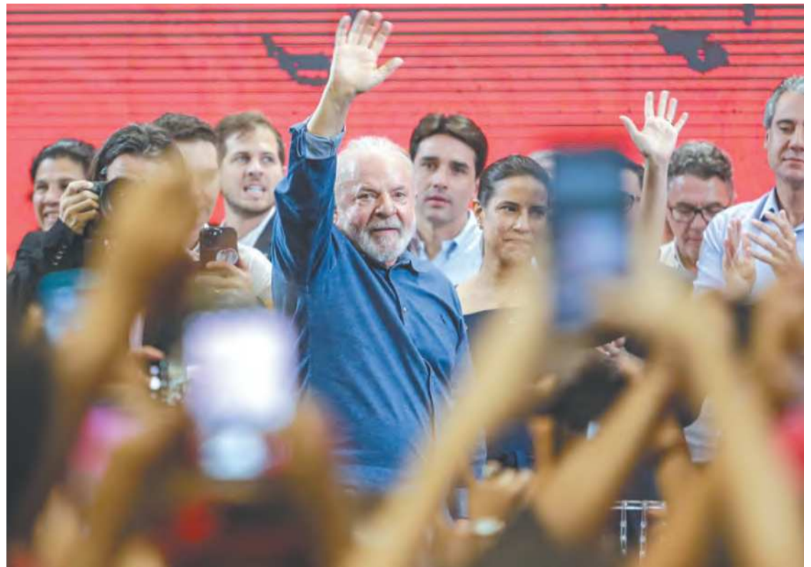
Ato foi marcado por protestos de entidades sindicais. Houve vaias e clima de tensão

Já a diretora socioambiental do Banco Nacional de Desenvolvimento Econômico e Social, Tereza Campello (PT), comunicou a implementação de um programa que vai destinar R$ 1 bilhão para 250 mil agricultores do Nordeste, batizado de Semeando Resiliência Climática em Comunidades Rurais do Nordeste.