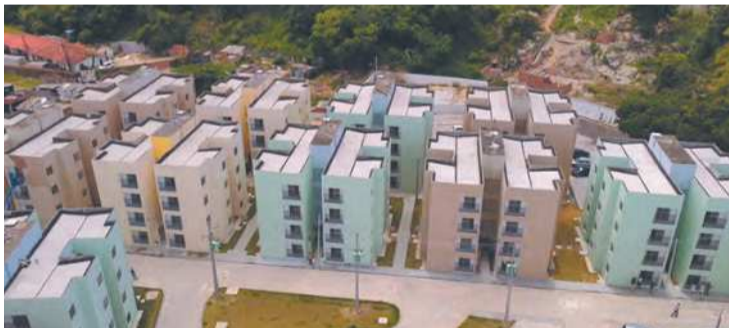
Há moradores que estavam há 13 anos na fila de espera