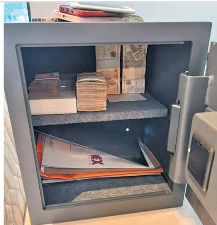
Polícia encontrou dinheiro e joias na casa de suspeito

O PCC atua dentro e fora de presídios brasileiros, além de ter atuação internacional. Gakiya e Moro estiveram à frente de transferências para unidades prisionais federais de integrantes da facção, inclusive do chefe, Marcos Camacho, o Marco-la. Moro defende o isolamento de organizações criminosas como uma estratégia de enfraquecimento, o que colocou em prá-