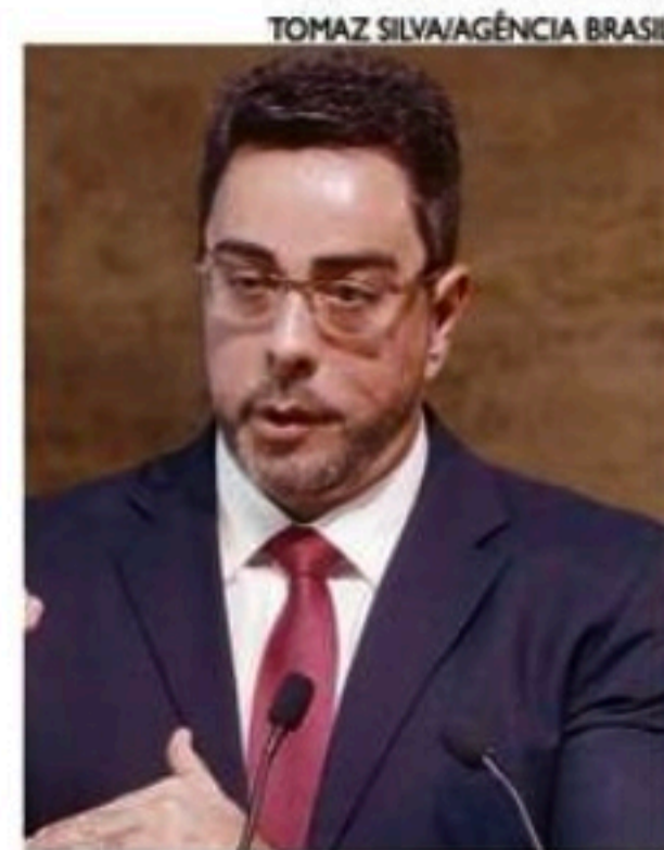
Bretas foi fotografado viajando com o ex-governador Witzel

alvo de um processo administrativo disciplinar (PAD). O afastamento foi decidido por 11 votos a quatro. A sessão ocorreu de forma sigilosa, por envolver conteúdos de delações premiadas. Estão sendo analisadas três reclamações disciplinares apresentadas contra Bretas.