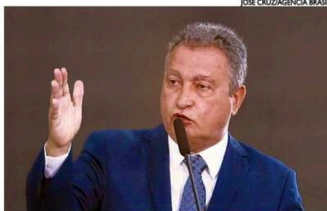
Ministro Rui Costa ficará responsável pelo trabalho com a mudança

A coluna de Edmar Lyra é publicada de segunda a sábado.