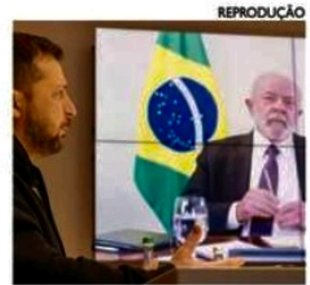
Volodymyr Zelensky conversou com Lula por videochamada

Zelensky. O país sofre há pouco mais de um ano com uma invasão militar russa, numa guerra que contabiliza milhares de mortos e milhões de refugiados. A informação sobre a conversa foi divulgada por Lula em uma postagem nas redes sociais. "Tive uma reunião por vídeo agora com o presidente da Ucrânia, Zelensky. Reafirmei o desejo do Brasil de