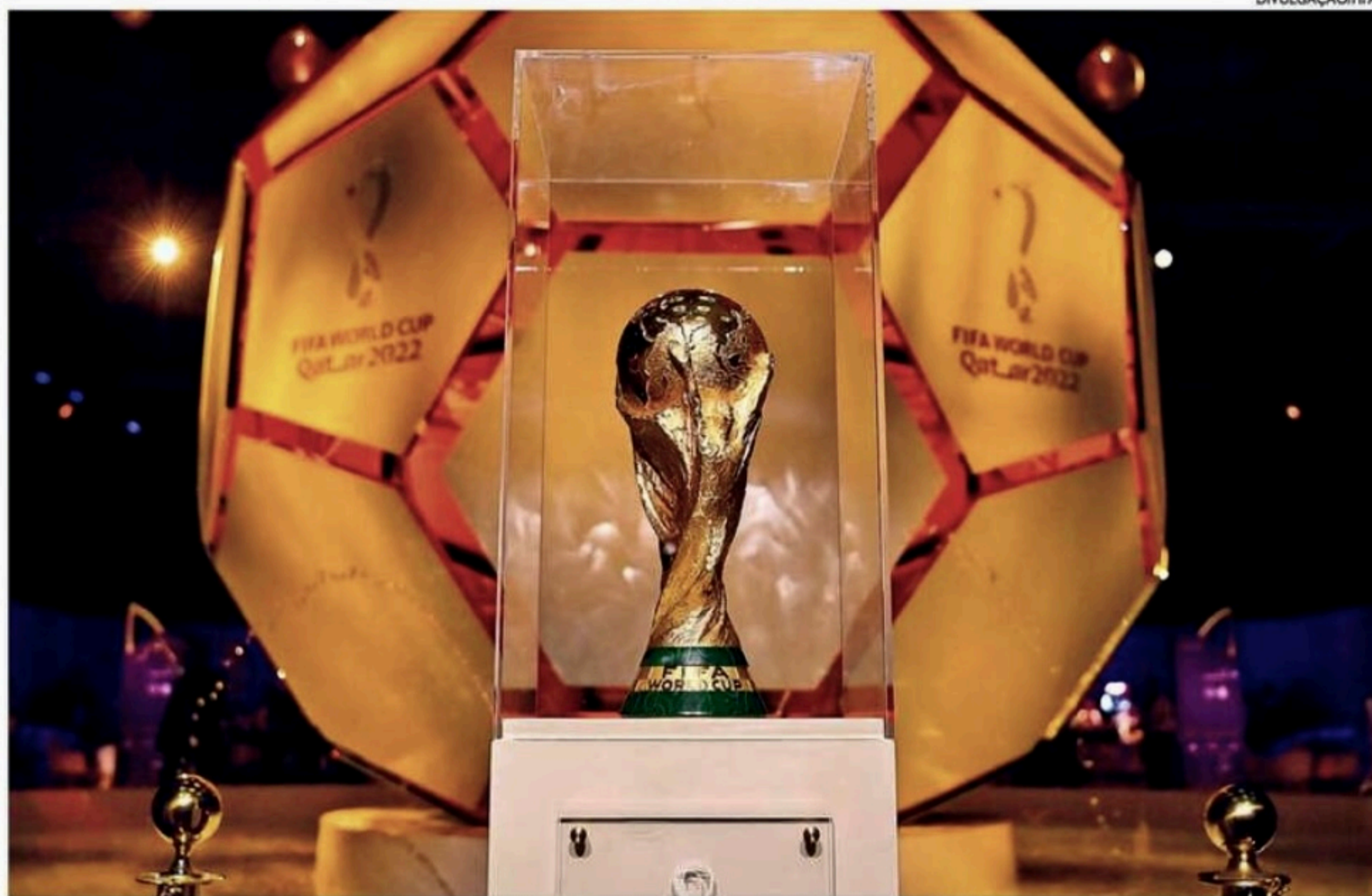
Entidade anunciou mudanças na competição durante reunião do conselho, ontem, em Kigali, Ruanda

■ Fifa oficializa mudanças no torneio, que passará a contar com 48 seleções e 12 grupos a partir da edição de 2026, sediada na América do Norte