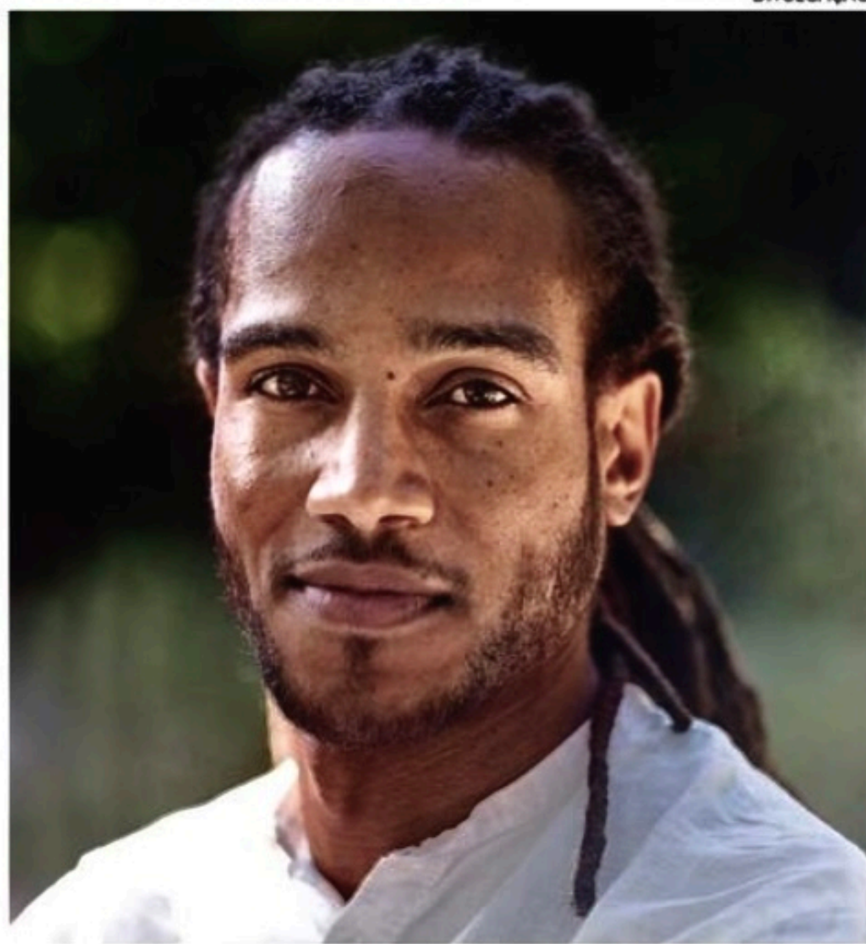
Conferência discute questões climáticas sob a ótica das desigualdades