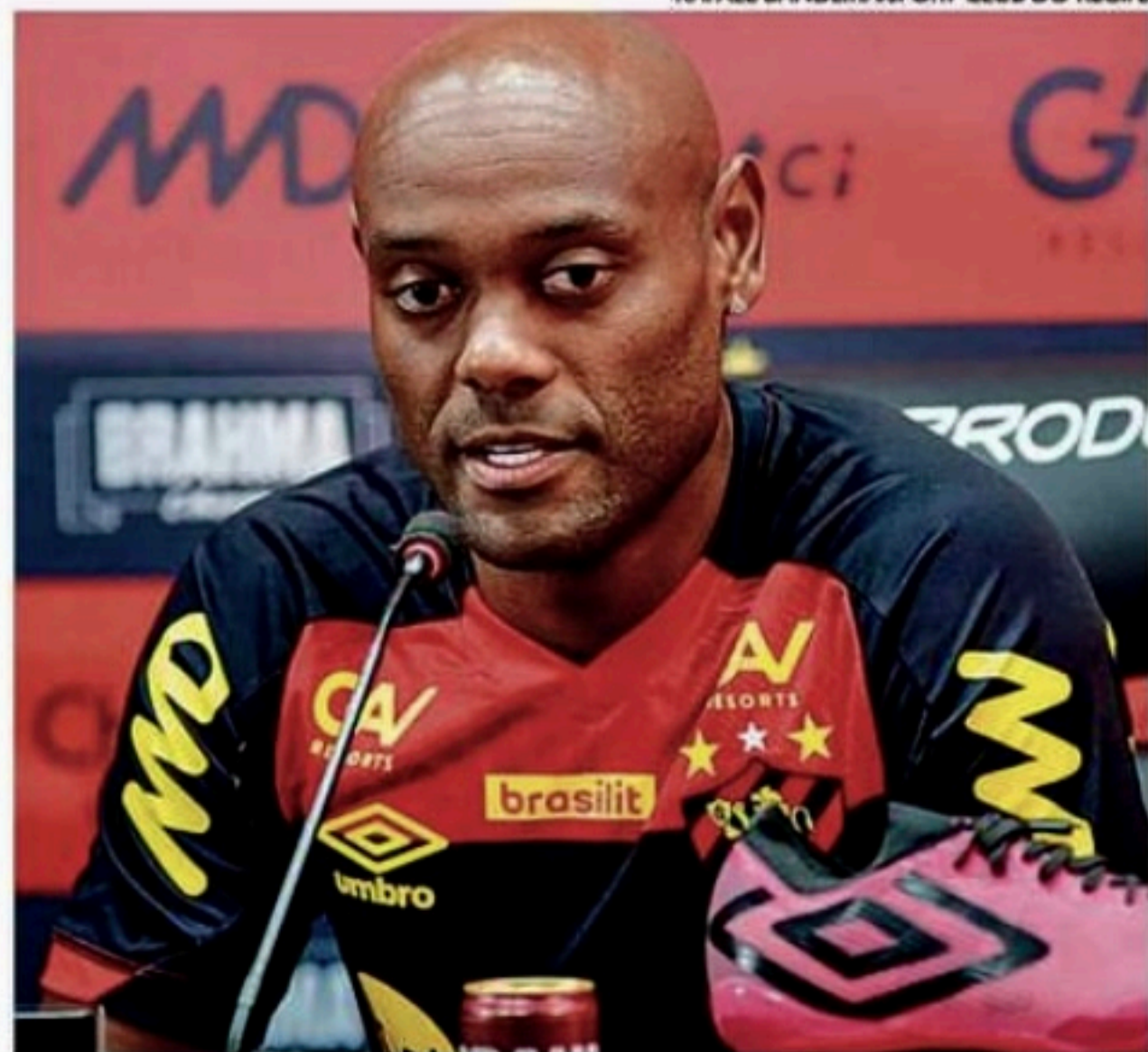
Artilheiro está próximo de alcançar a marca de 400 gols na carreira