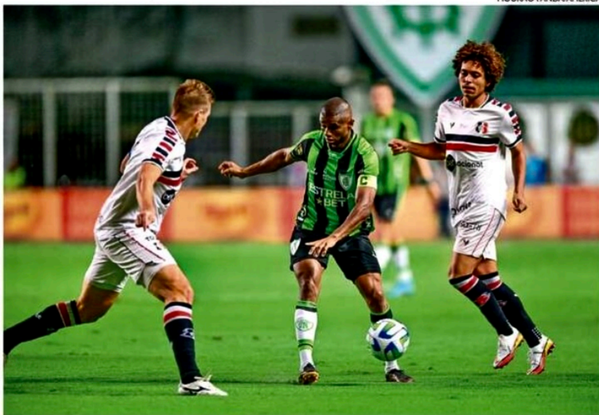
Apesar de ter perdido pelo placar mínimo, Santa Cruz foi amplamente dominado pelo time mineiro em BH

Estádio: Independência (Belo Horizonte/MG) Árbitro: Ramon Abatti Abel (FIFA-SC) Assistentes: Thiago Americano Labes e Bruno Müller (ambos de SC) Gols: Benítez, aos 46' do IT (AME) Cartões amarelos: Martínez (AME); Pipico (STA)