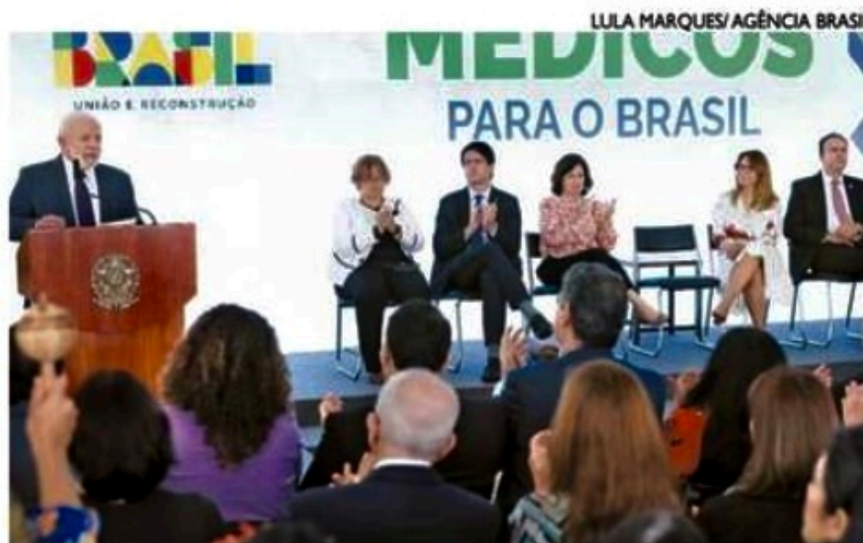
Lula: "Não importa a nacionalidade do médico, mas saber a do paciente"

■ Gestão federal aposta em iniciativa que leva trabalhadores de saúde a áreas vulneráveis e interior e não descarta uso de estrangeiros