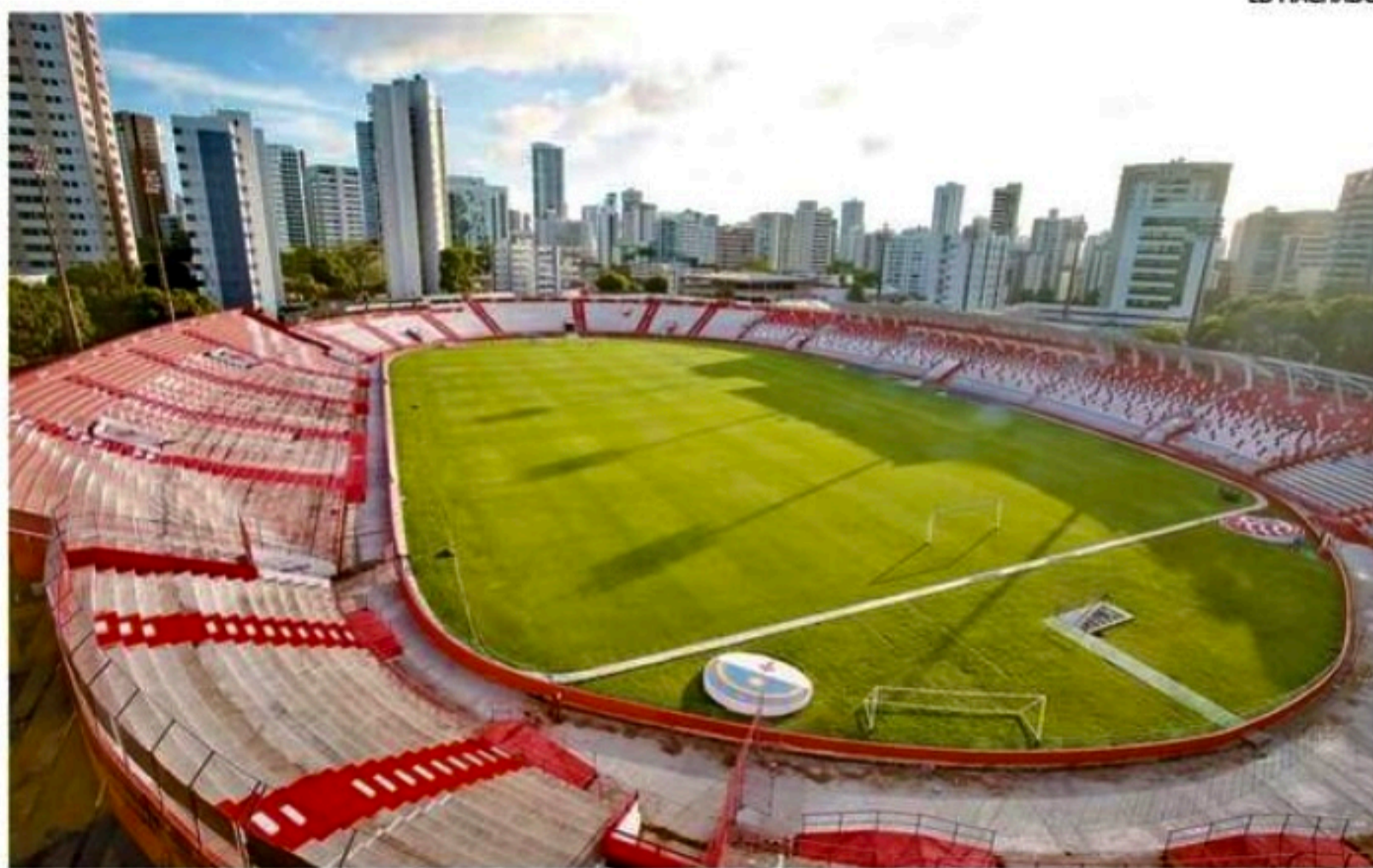
Nos Aflitos, a partir das 21h30, Náutico, integrante do Grupo B, vai duelar contra o Ferroviário/CE

Em 2005, Náutico e Santa Cruz disputaram jogos decisivos na Série B, valendo acesso à Série A. Quase 30 mil pessoas acompanharam a derrota do Timbu por 1x0 para o Grêmio, nos Aflitos. Mais de 60 mil estavam no Arruda, no 2x1 da Cobra Coral perante a Portuguesa.