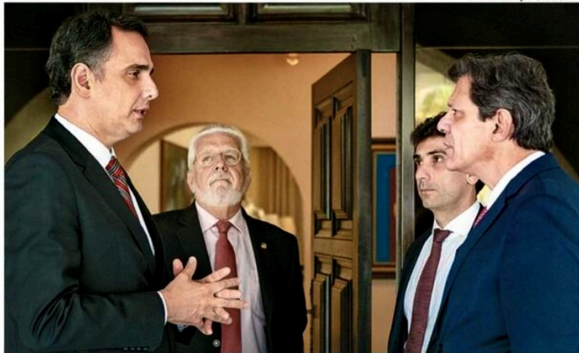
Pacheco e Haddad discutiram as linhas principais do projeto que será enviado ao Congresso Nacional

Além do senador, Haddad também se reuniu com o presidente da Câmara, Arthur Lira (PP-AL), na residência oficial, para conversar sobre o assunto. Pela manhã, o ministro conversou com os líderes do governo na Câmara, José Guimarães (PT-CE), e no Senado, Jaques Wagner (PT-BA). As conversas foram encomendadas pelo presidente Luiz Inácio Lula da Silva.