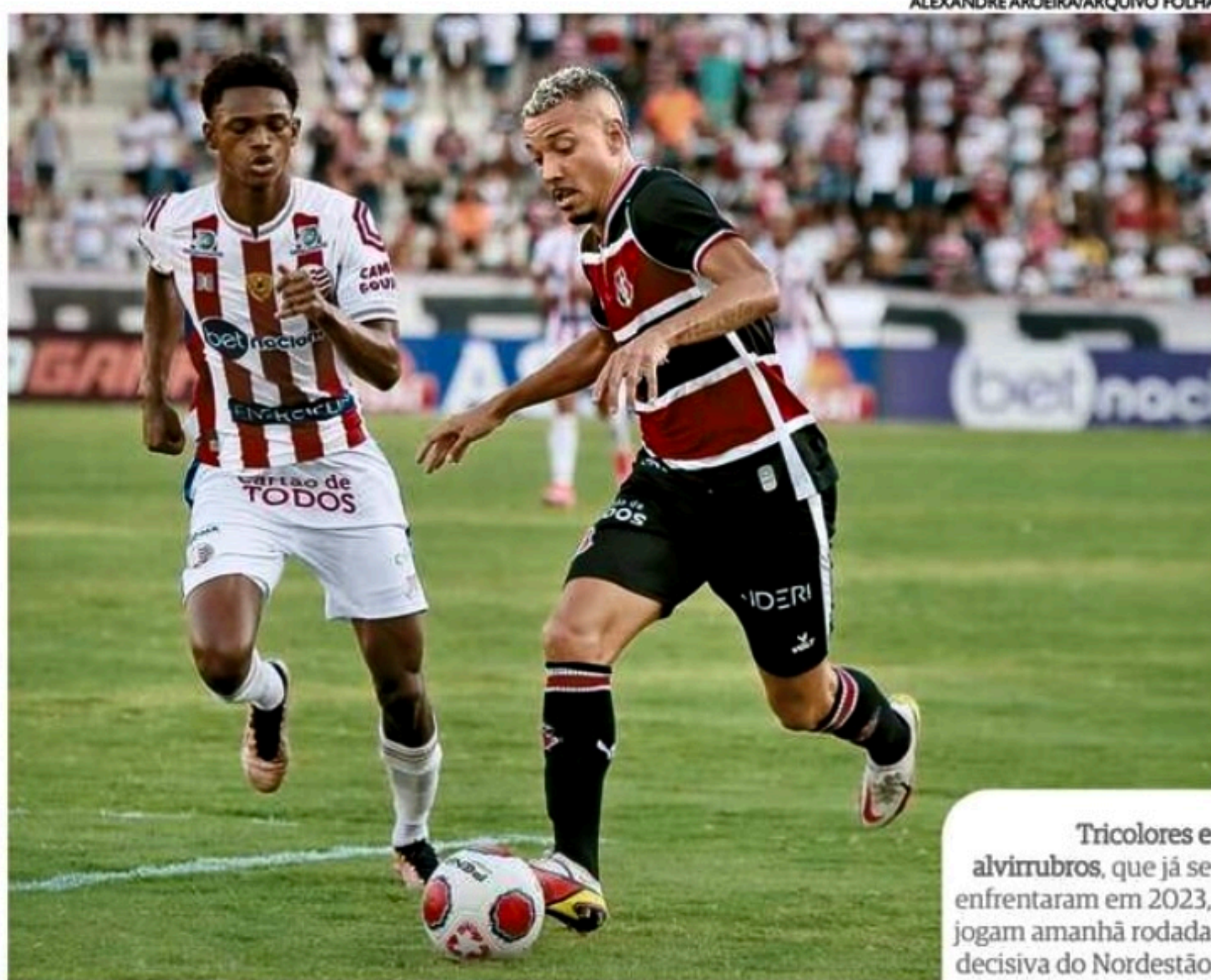
Tricolores e alvirrubros, que já se enfrentaram em 2023, jogam amanhã rodada decisiva do Nordestão

U m déjà vu que o torcedor do Santa Cruz está ansioso para viver e os alvirrubros desejam esquecer. Na Copa do Nordeste de 2020, o Tricolor conseguiu a classificação à próxima fase do torneio na última rodada, após “roubar” vaga do Timbu do G4 do Grupo B. Algo que pode acontecer na edição deste ano.