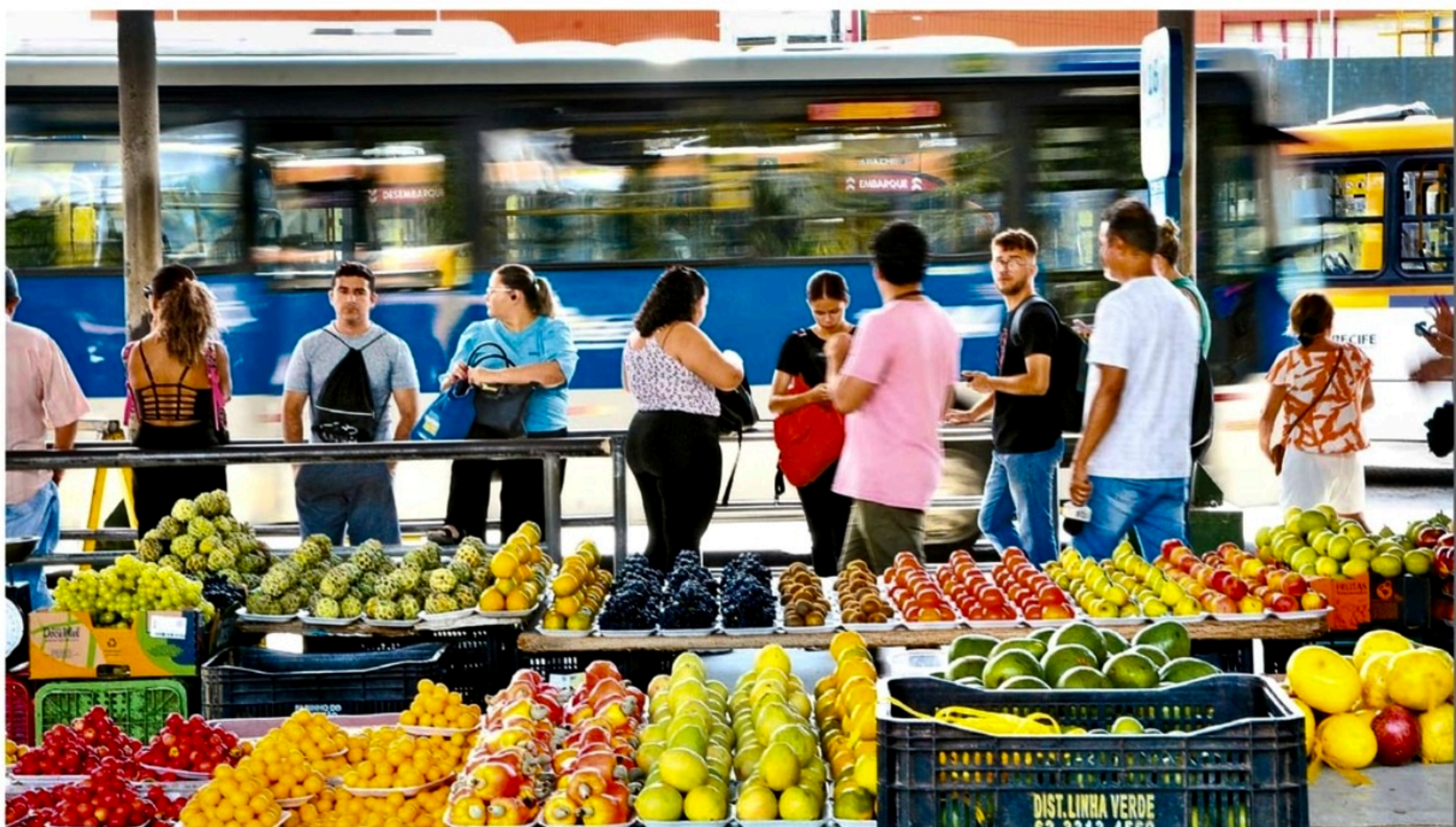
No TI Pelópidas, verduras e frutas são comercializadas em caixotes improvisados nos corredores de embarque dos passageiros

Utilizado por 79 mil passageiros/dia, o Terminal Integrado Pelópidas Silveira, em Paulista, apresenta vários problemas, entre eles filas duplas e falta de organização, que atrapalham o funcionamento do local. Confira na segunda reportagem da série sobre terminais integrados da RMR. COTIDIANO >> PÁGINA 5