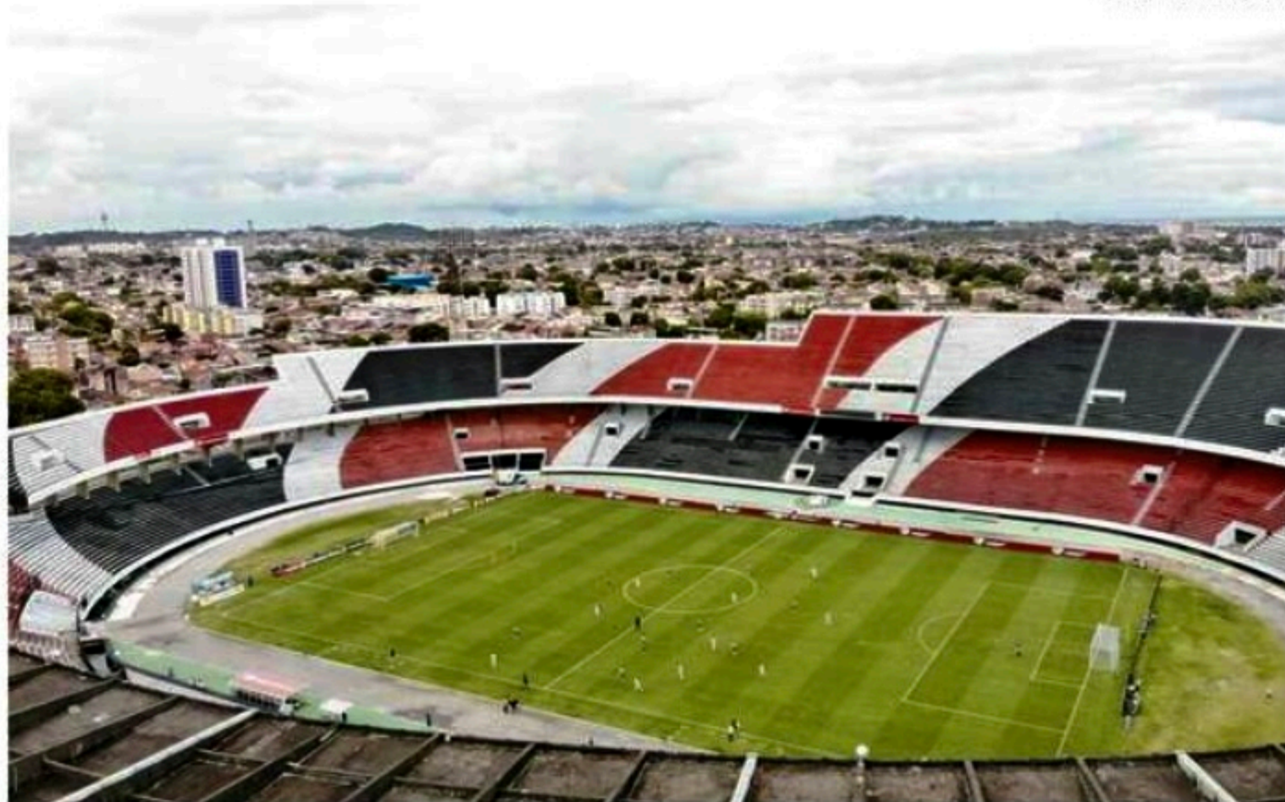
A cerca de 2 km dos Aflitos, o Santa Cruz irá receber o Fortaleza, no Arruda, no mesmo horário

■ Válidas pela Copa do Nordeste, partidas de Náutico e Santa Cruz no Recife, amanhã, no mesmo horário, geram preocupação