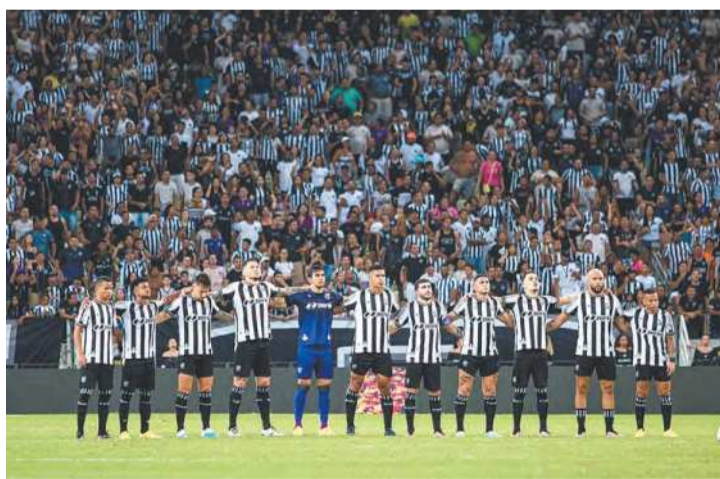
Vozão perdeu Estadual, mas venceu o Sport na 1ª fase

Os alvinegros foram o único time que derrotou o Sport na atual temporada, quando venceram o duelo válido pela ter-