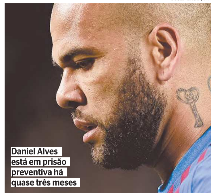
Daniel Alves está em prisão preventiva há quase três meses

A defesa do jogador interpôs depois um recurso para solicitar sua libertação na Audiência de Barcelona, mas o tribunal decidiu manter sua prisão preventiva em fevereiro à es-