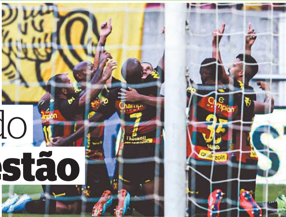
Após vitória sobre o Retrô, 2x1, Rubro-negro vai encarar nova decisão pela frente

Além disso, o árbitro do Rio Grande do Norte também apitou no empate em 1 a 1 entre Vitória e Santa Cruz, e na vitória por 3 a 1 do Ceará diante do Sergipe, ambos também na primeira fase do Nordestão.