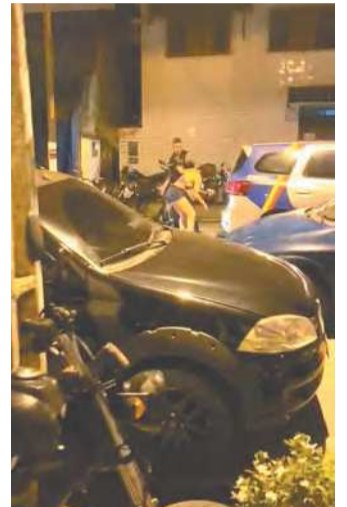
Vítima levou socos e tapas de dois agentes

A Secretária de Defesa Social (SDS) fez o pedido, ontem à tarde, e apontou que houve ato incompatível com a função pública. Por meio de nota, a SDS informou que os PMs já foram identificados. Caso fique comprovado, ao longo da tramitação do processo, que eles descumpriram o código de conduta dos militares, a corregedoria poderá pedir a expulsão deles da Polícia Militar.