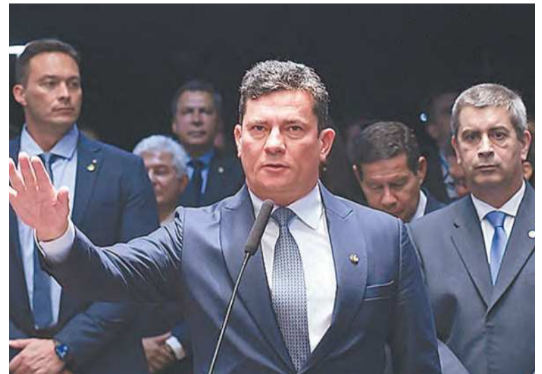
Sérgio Moro foi eleito senador pelo União Brasil em 2022

Até o fechamento desta edição, a prefeitura não emitiu posicionamento com relação ao ofício expedido pelo Ministério Público de Contas.