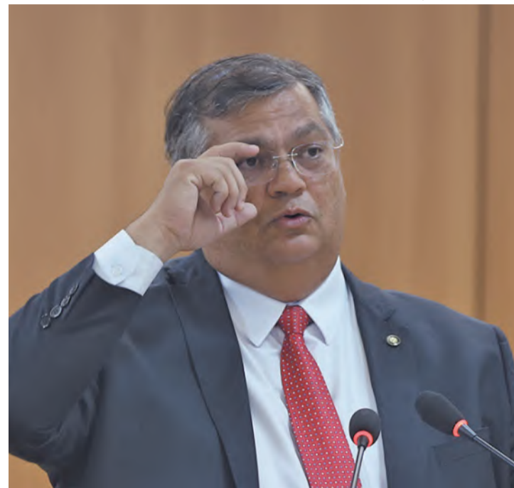
Ministro afirmou que as ameaças não são fato isolado

Dino afirmou, ainda, que as denúncias ocorrem em todo o país, o que demonstra não se tratar de ato isolado. Desde o lançamento da plataforma do Ministério da Justiça, foram feitas 7.473 denúncias. (Correio Braziliense)