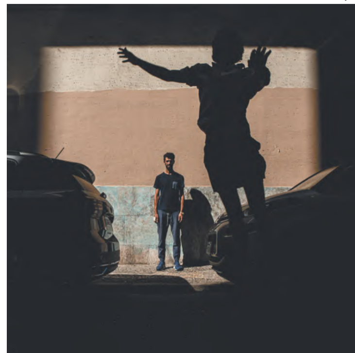
Peça repensa a construção do teatro a partir das vivências

Nesse local, que funcionou como um centro cultural, o grupo teve um intenso fluxo de intercâmbio com vários artistas, entre os quais Miró da