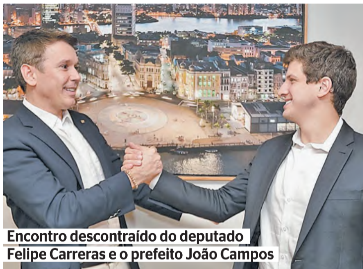
Encontro descontraído do deputado Felipe Carreras e o prefeito João Campos