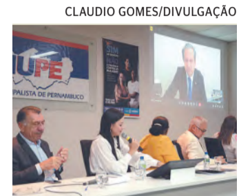
Amupe foi palco de encontro entre gestores

"Nós assinamos esse edital que permite que qualquer projeto, lançado por estados ou municípios, possam receber recursos para fortalecimento da patrulha, para aquisição de armamentos letais e não letais, para qualquer