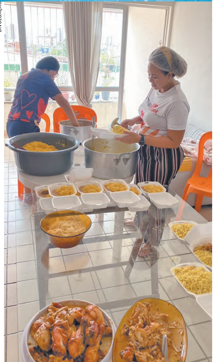
Nos almoços, mais de 100 quentinhas são distribuídas

ções físicas é necessário entrar em contato pelo Instagram, @distribuamor. O apoio financeiro pode ser feito pelo Pix, cuja chave é 81988729613.