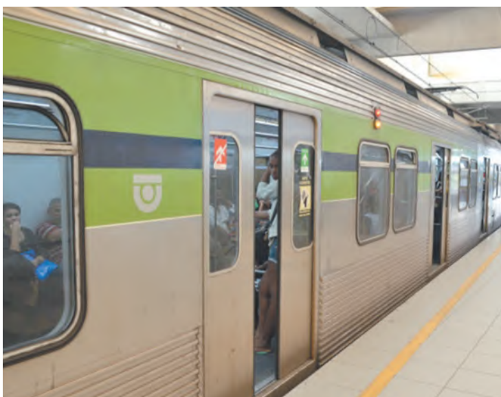
Categoria quer mostrar força com apoio de movimentos

Os metroviários do Recife estão se mobilizando para realizar uma Assembleia Geral Extraordinária e decretar greve hoje. A mobilização deve ocorrer às 18 horas na Estação Recife.